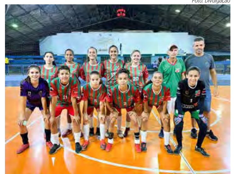
Time de Futsal feminino do Velo disputa o Regional

Já o time de futebol de campo feminino do Velo Clube vai disputar, a partir do dia 15 de outubro, o Campeonato Paulista Série Especial, que dá acesso à Série A. Na primeira fase da disputa, o Velo