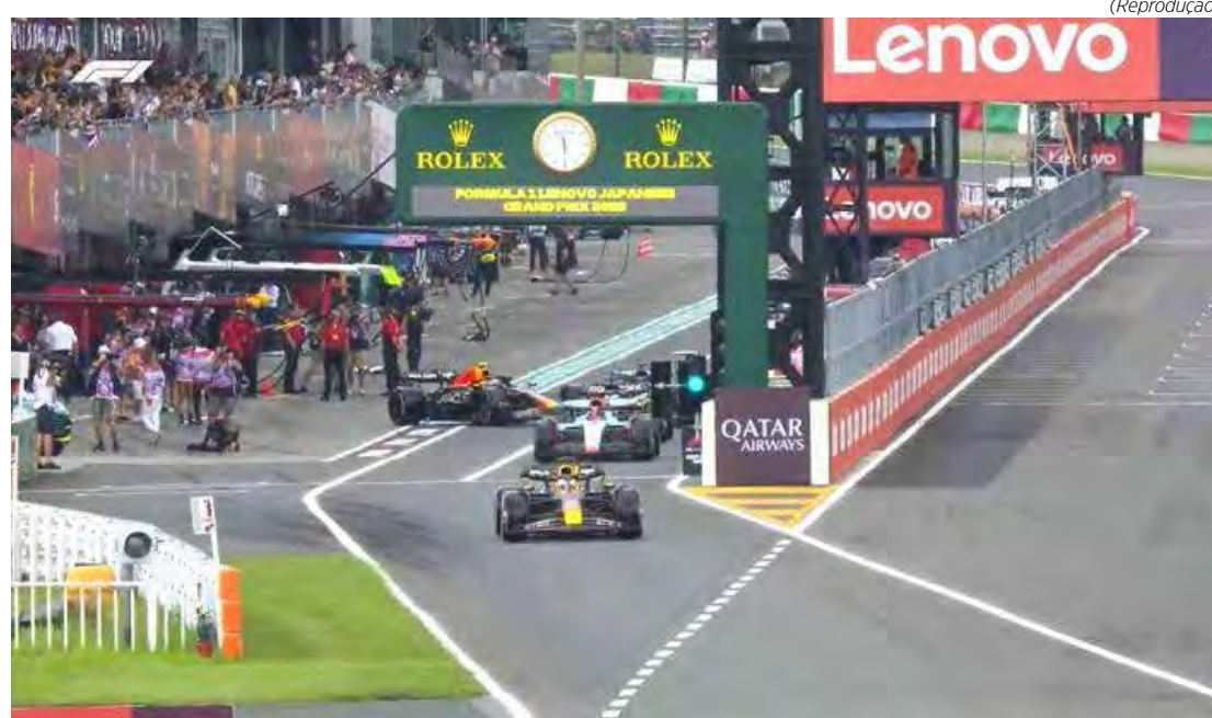
Por conta do fuso, fãs brasileiros do automobilismo terão que sintonizar a TV de madrugada

do campeonato com 374 pontos, com Perez em segundo (223) e Hamilton em terceiro (180). A média do número de ultrapassagens dos últimos quatro anos em que o GP foi realizado é de 46, ou seja, o GP do Japão costuma ficar acima da média em termos de mudanças de posição, e a expectativa é que, com os novos carros, a corrida fique ainda mais movimentada.