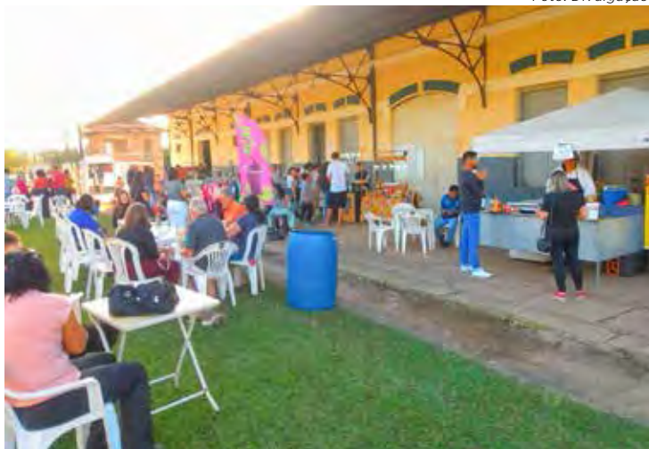
Dia de Feira acontece neste sábado (23) na antiga estação ferroviária em Batovi