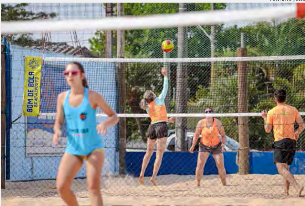
Torneio de Vôlei reúne 48 casais em Rio Claro