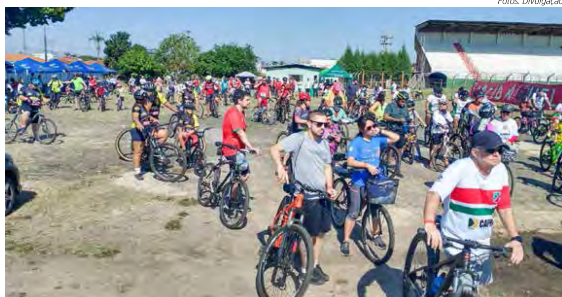
Concentração dos ciclistas no Benitão, antes da saída