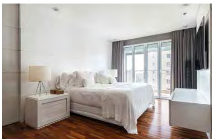
Para definir o colchão, o morador deve levar em conta o conforto para noites muito bem dormidas

Segundo as arquitetas, logo no começo é ideal avaliar os tipos de colchões disponíveis: mola contínua, mola individual, espuma, viscoelástico, látex, etc. “Como tudo na vida, cada tipo tem suas vantagens e suas desvantagens. Então na hora de escolher