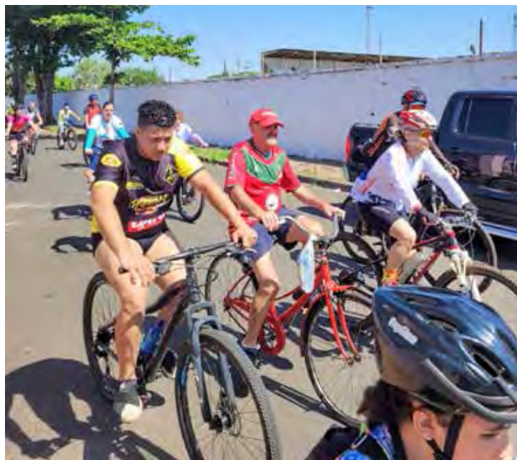
Ciclistas percorreram as ruas centrais de Rio Claro