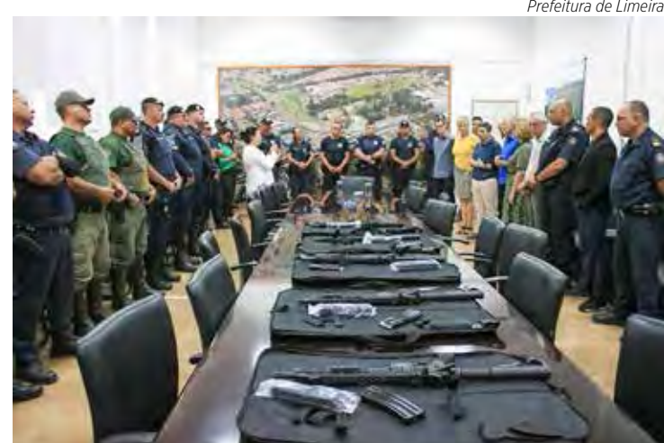
Armamentos expostos durante solenidade de entrega