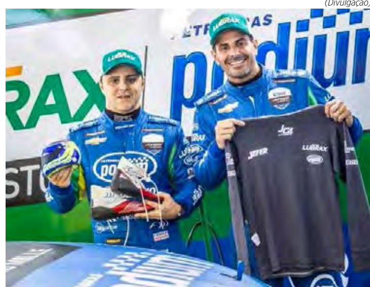
Felipe Massa e Julio Campos disponibilizaram itens para leilão

Massa contribuiu com um par de sapatilhas usadas por ele ainda em 2010, quando era piloto da Ferrari na Fórmula 1, e uma réplica em miniatura de um capacete. Já Julio doou uma camisa antichamas, que os pilotos usam por baixo do macacão de corrida.