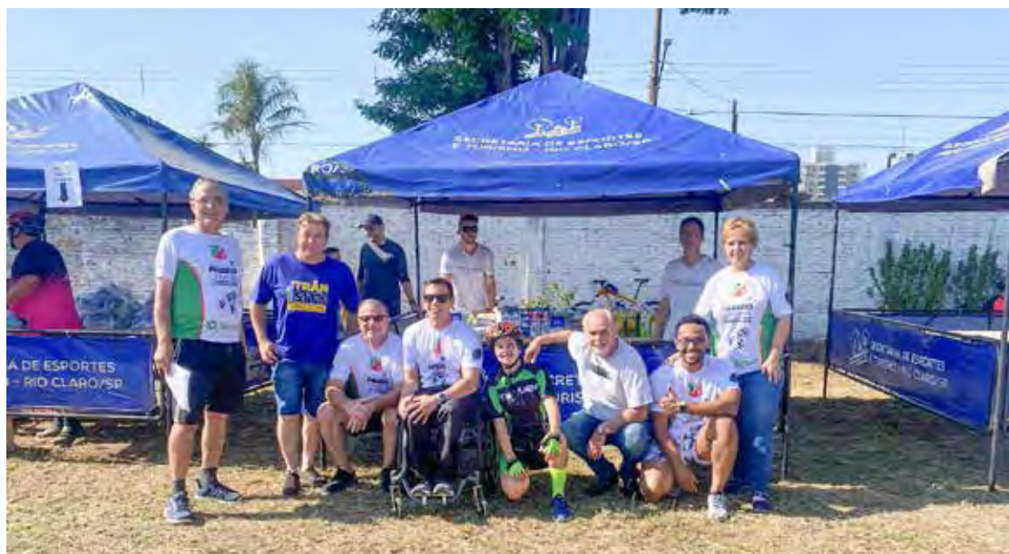
Dirigentes velistas e equipe de apoio do 1o. Passeio Ciclístico