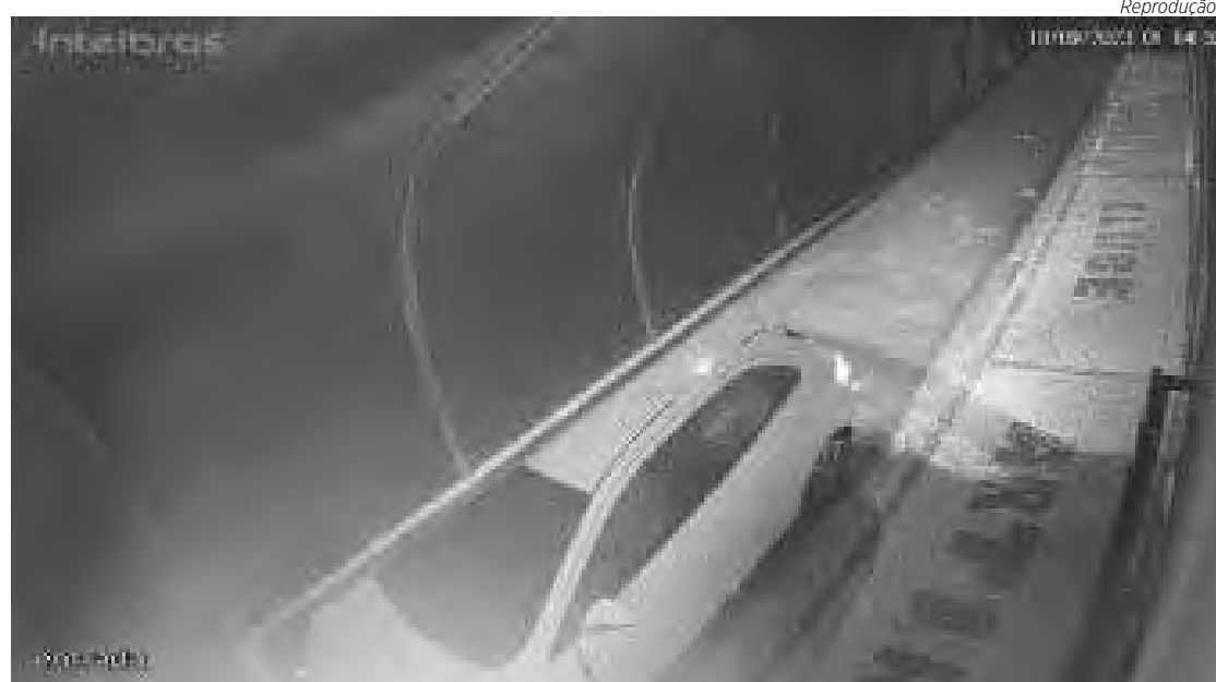
Um Onix branco foi usado pelo bando para chegar ao local

Checando o local, os agentes constataram que uma vidraça da