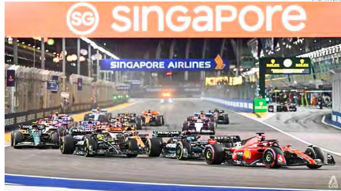
Restam sete etapas com três corridas sprint na temporada 2023

A Fórmula 1 volta a acelerar já no próximo fim de semana com o GP do Japão, 16ª etapa da temporada.