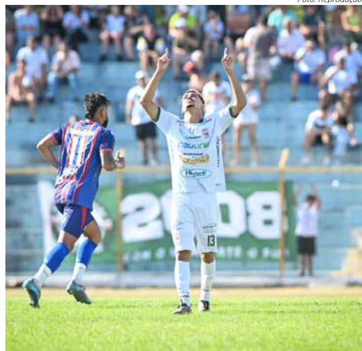
União São João voltou de São Carlos classificado

voltarão a se enfrentar, uma semana depois, dia 30, no mesmo horário, no estádio Hermínio Ometto, em Araras, quando será conhecido o campeão.