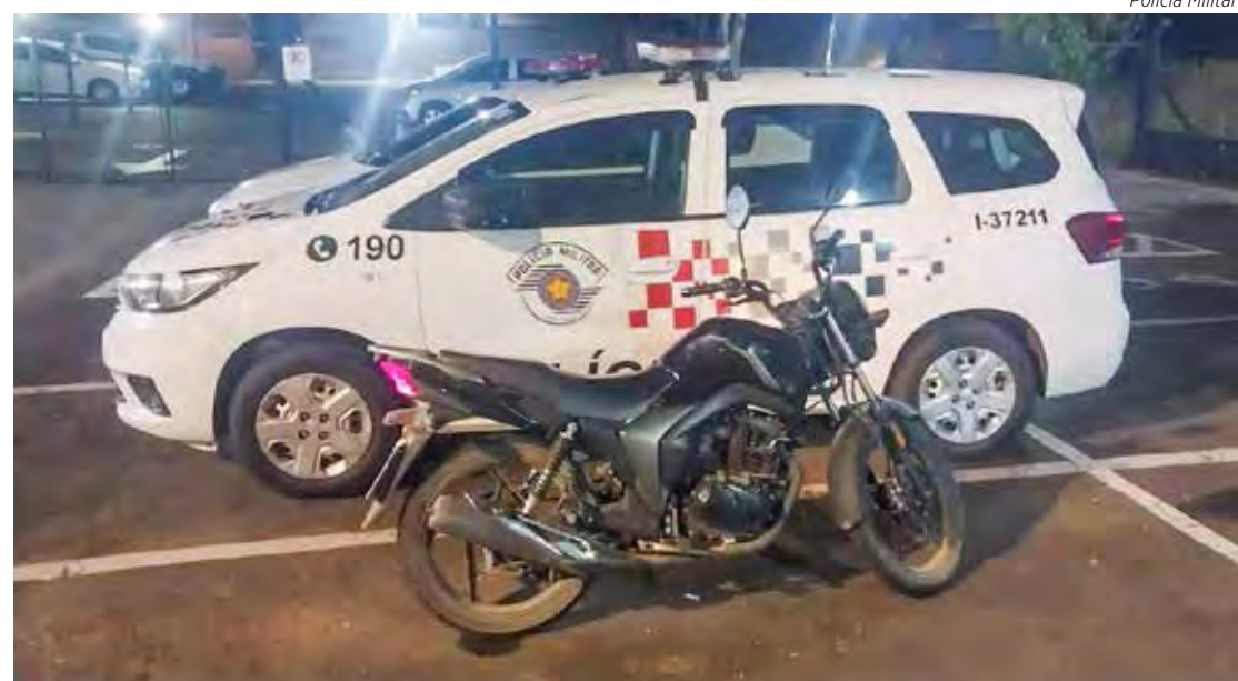
Porções de maconha foram localizadas com o rapaz e a moto havia sido furtada em São Carlos no ano passado

Segundo o registro policial, durante patrulhamento pela Rodovia Municipal Domingos Inocentine a equipe visualizou uma motocicleta ocupada por um indivíduo que, ao notar a presença da viatura, tentou fugir para a área rural, porém foi abordado.