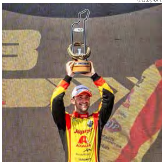
Pole position no sábado e vencedor da corrida 1 no domingo, piloto paranaense assume liderança