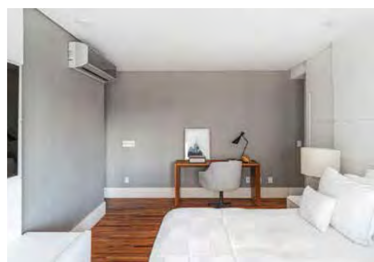
O colchão de espuma é considerado mais firme, enquanto que o de molas é mais macio