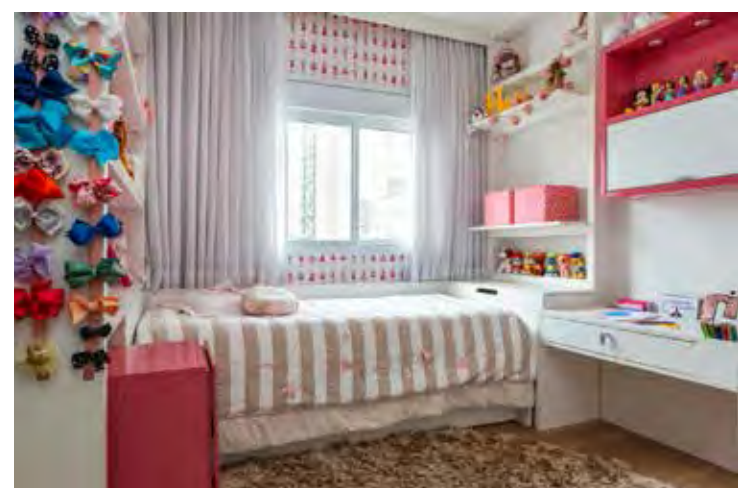
As camas de solteiro seguem o padrão de 1,88m de comprimento