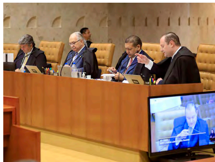
Julgamento STF

Tribunal Federal (STF) anular o acordo de leniência da Odebrecht, fechado durante a Lava Jato, os condenados se preparam para pedir anulação de suas sentenças. É o caso do ex-doleiro Alberto Youssef que afirma ter provas contra o senador e ex-juiz Sergio Moro, que podem levar à anulação da sua delação premiada. Tal fato se refere a grampos clandestinos encontrados na carceragem da Polícia Federal de Curitiba logo no início da Lava Jato. O escândalo teria sido abafado por Moro. Youssef também está pedindo que o ministro Toffoli assuma a investigação sobre a conduta de Moro no caso do grampo da PF. Se a moda pegar, o STF ficará assoberbado com pedidos de revisão de processos da Lava Jato. A gente espera que se houver revisão, que o