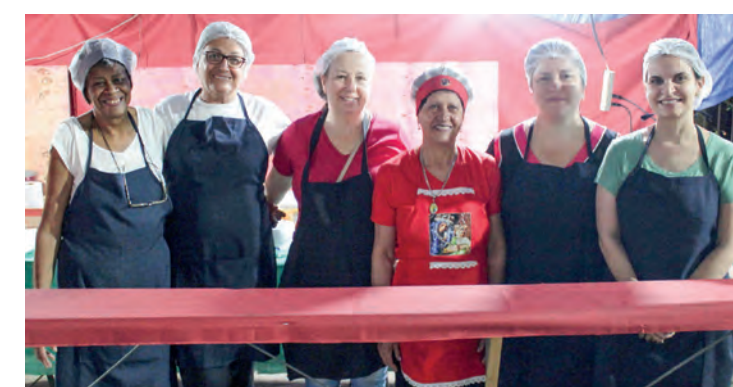
Voluntários da Barraca dos Salgados