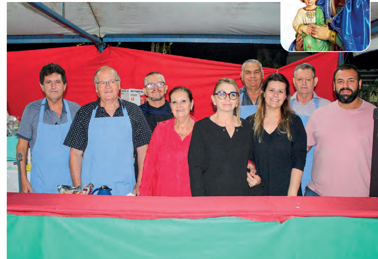
Voluntários da Barraca da Roleta