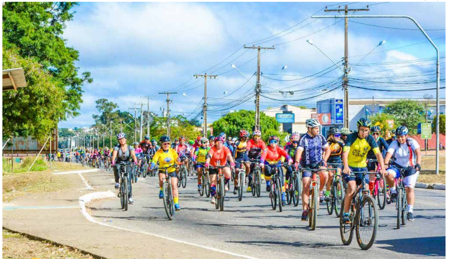
Velo Clube promove 1º Passeio Ciclístico neste domingo

A diretoria do Velo sugere que os participantes vistam as cores vermelho e verde como forma de homenagear o Velo Clube que completou no último dia 28, 113 anos de fundação. Então, vamos lá, curtir o 1º. Passeio Ciclístico do Velo Clube, na manhã deste domingo.