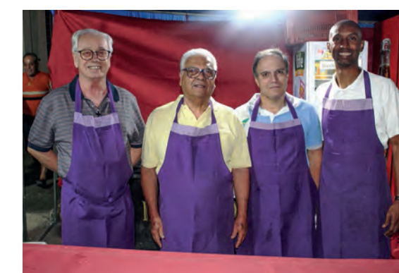
Voluntário da Barraca das Bebidas