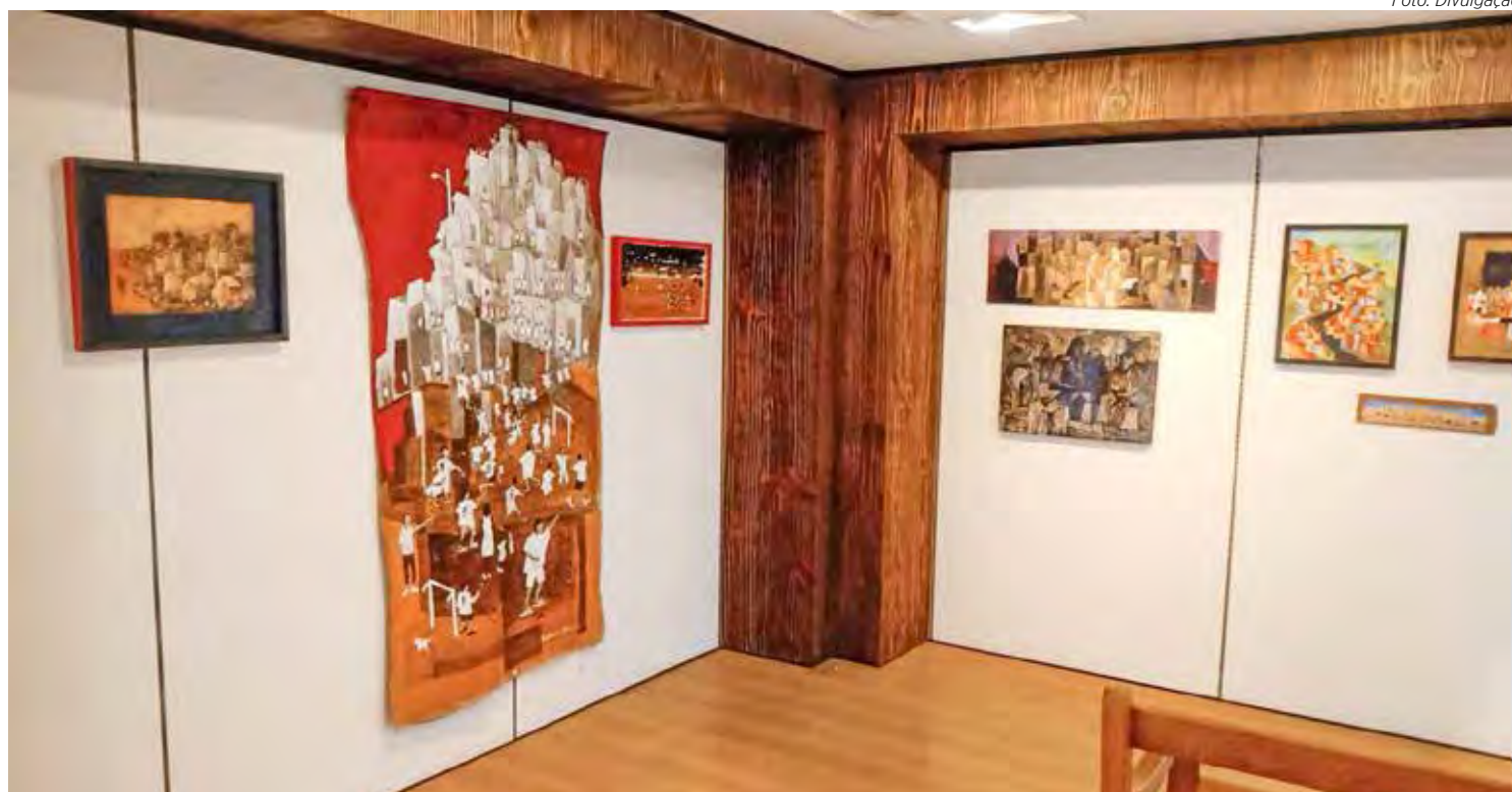
A exposição pode ser visitada durante o funcionamento do shopping