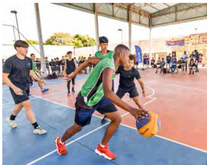
Torneio Tudo Nosso de basquete 3x3 reúne 12 equipes nessa segunda edição