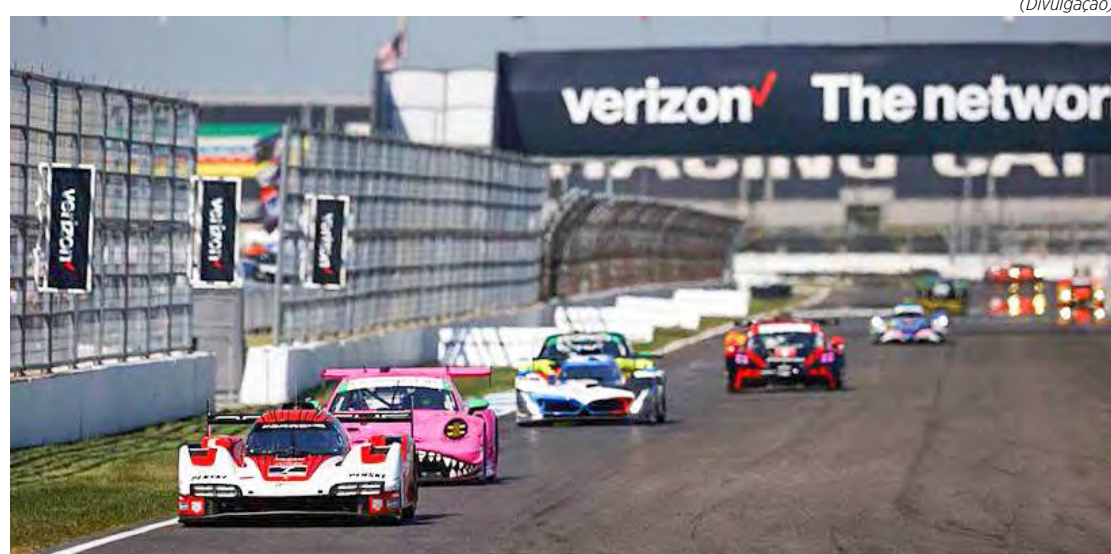
IMSA retorna ao lendário circuito de Indianápolis