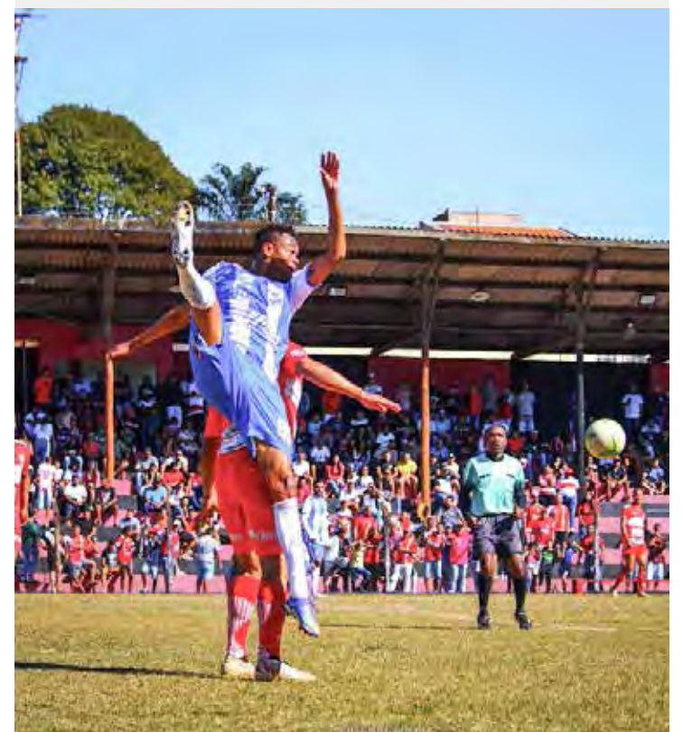
9ª rodada do Amadorão, neste domingo