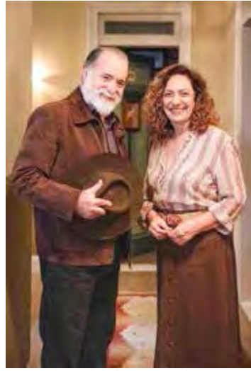
Tony Ramos e Eliane Giardini

A qualquer momento o SBT irá anunciar o novo responsável pelo