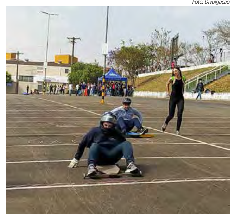
Shopping Rio Claro sedia Campeonato de Carrinho de Rolimã