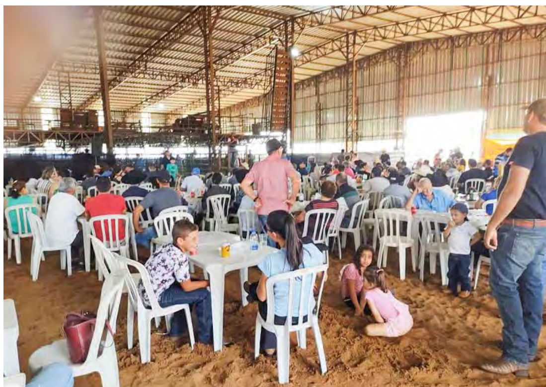
A quermesse será realizada no salão de festas do Abrigo da Velhice São Vicente de Paulo