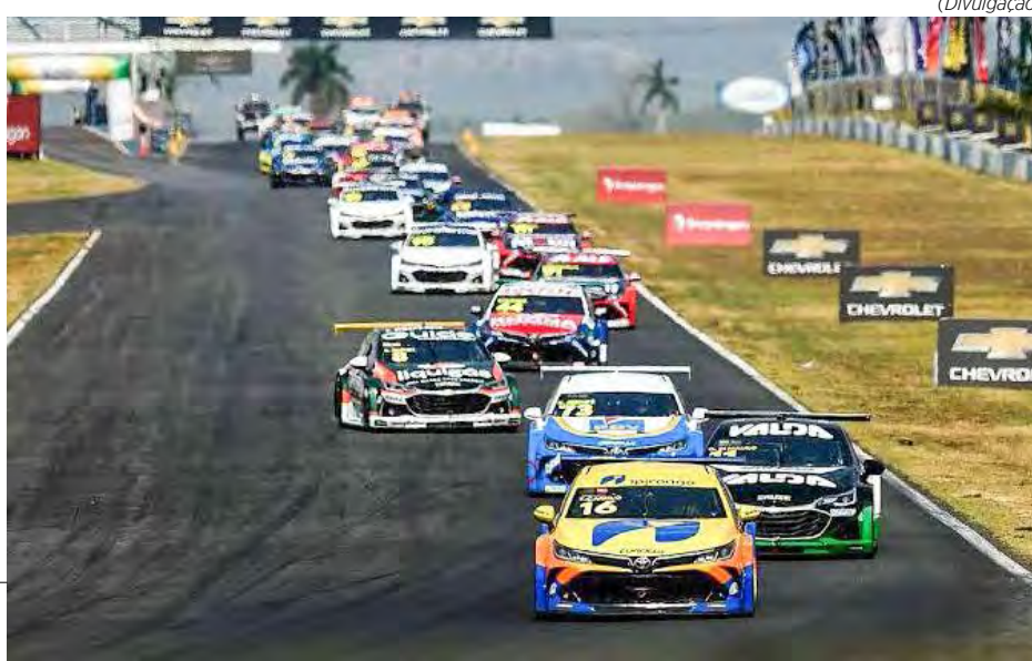
Categoria doará parte da bilheteria e vai arrecadar itens para as vítimas da tragédia

O episódio é considerado o maior desastre natural do estado em 64 anos. Ao todo, 88 municípios e mais de 340 mil pessoas foram diretamente afetados pela passagem do ciclone extratropical.