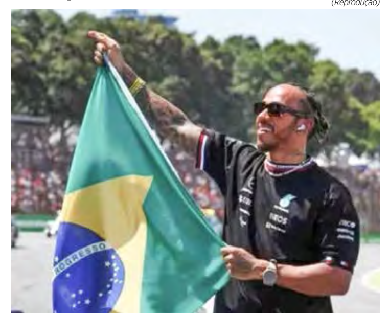
Hamilton se diz animado para o GP de São Paulo

Interlagos foi o palco da única vitória da Mercedes na temporada 2022 da F1. No circuito de São Paulo, George Russell conseguiu triunfar tanto na corrida Sprint quanto no GP de domingo, enquanto Hamilton terminou em segundo.