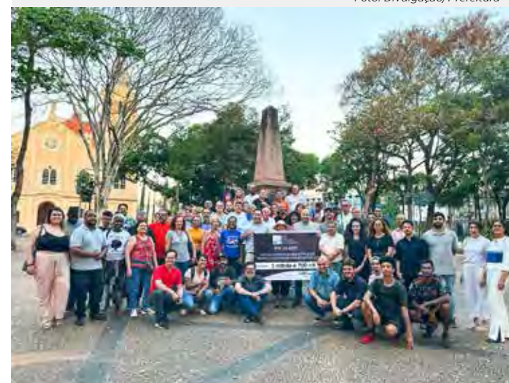
Artistas contemplados com recursos da Lei Paulo Gustavo em Rio Claro