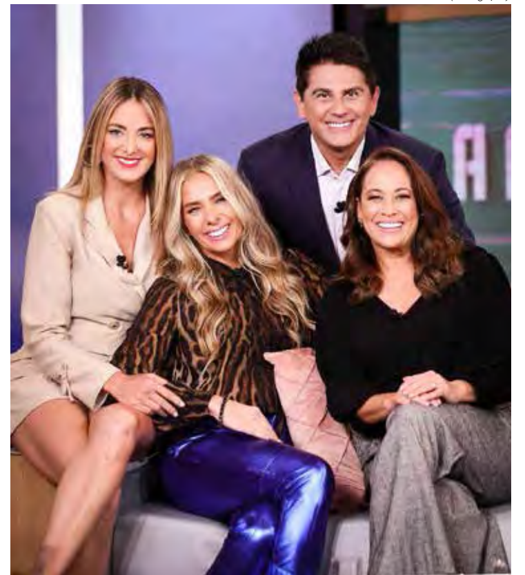
Adriane Galisteu durante visita ao Hoje em Dia