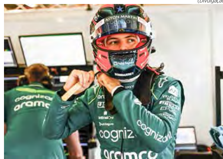
Piloto de reserva da Aston Martin foi convidado pela Carpenter para fazer um teste na Indy, mas recusou o convite