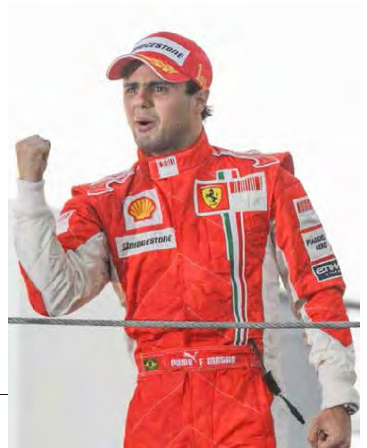
Felipe Massa segue tomando medidas para reivindicar o título mundial de 2008

Já o britânico, atual piloto da Mercedes, não tem qualquer envolvimento jurídico no caso, ainda que tenha se beneficiado da batida proposital de Piquet Jr em Singapura, onde subiu ao pódio do GP vencido por Alonso. Massa, por sua vez, foi prejudicado no "acidente" orquestrado por Briatore.