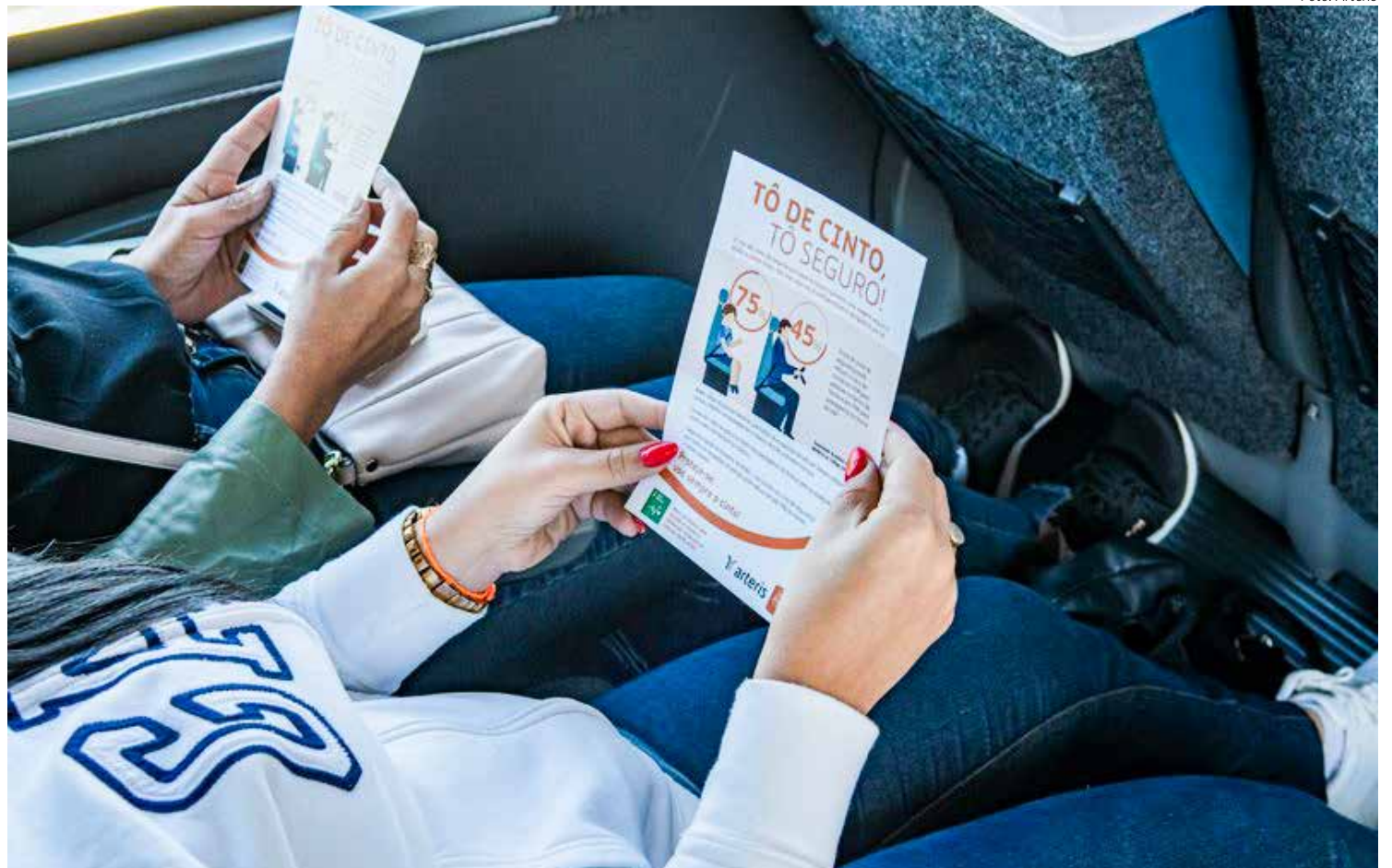
Concessionária reforça a importância do uso do item de segurança

Somente neste ano, mais de 2,3 mil usuários das rodovias sob concessão da Arteris Intervias já foram orientados sobre a importância do uso correto do cinto para a preservação da vida, durante edições da campanha Tô de Cinto, Tô Seguro, realizadas em vários pontos do trecho. As ações, que