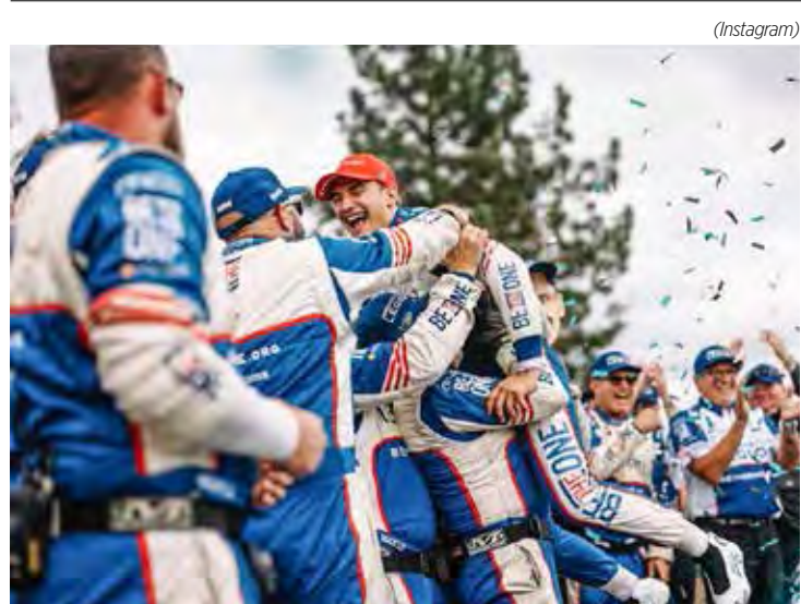
Álex Palou, bi campeão da Indy por antecedência, deve permanecer na Ganassi