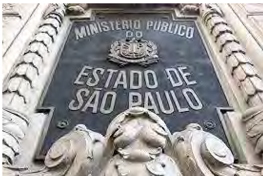
Os trabalhos miram os crimes de falsidade material e ideológica

Os trabalhos miram em crimes de falsidade material e ideológica, por meio de fraude fiscal estruturada, moldada a partir da criação de empresas fictícias, com interposição de pessoas nos quadros societários, a fim de simular operações comerciais e propiciar a utilização de créditos irregulares de Imposto sobre Circulação de Mercadorias e Prestação de Serviços de Transporte Interestadual e Intermunicipal e de Comunicação (ICMS) por terceiras em-