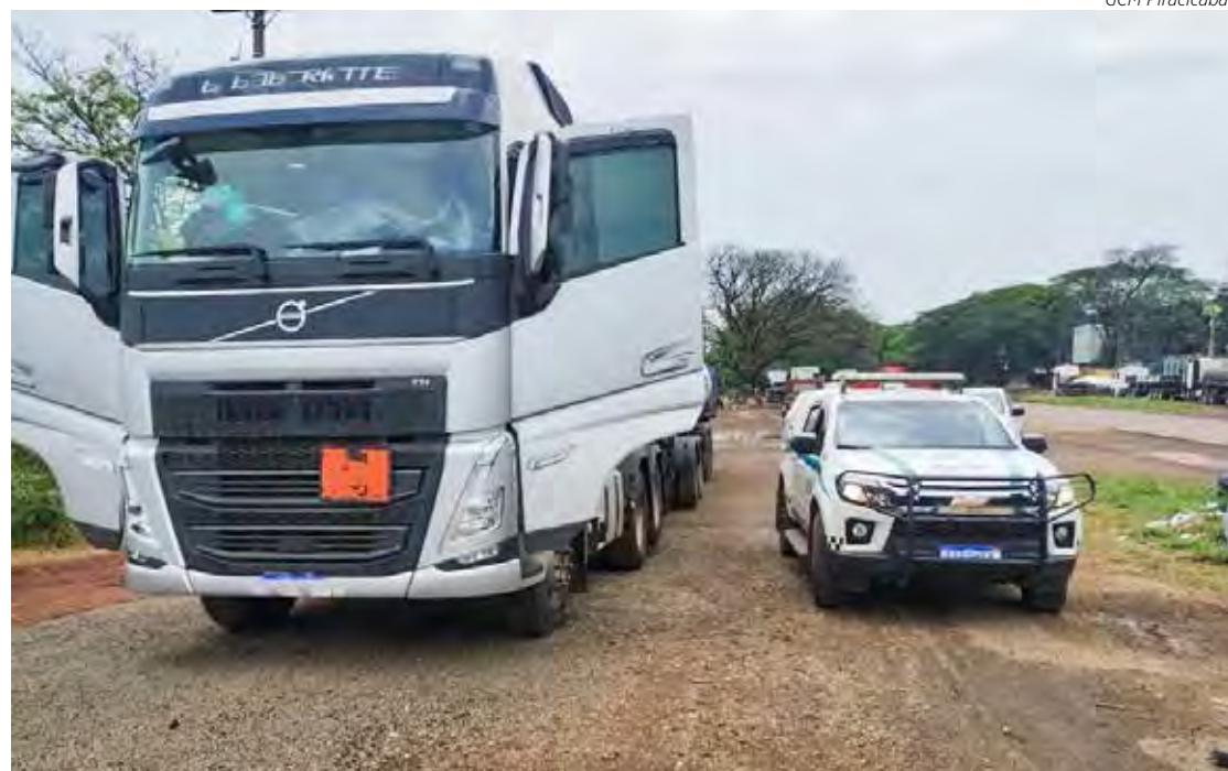
A carga já não estava mais nos tanques quando aconteceu a localização

estava mais nos tanques do veículo, segundo a GCM. Enquanto os agentes de segurança faziam a localização do veículo, foram