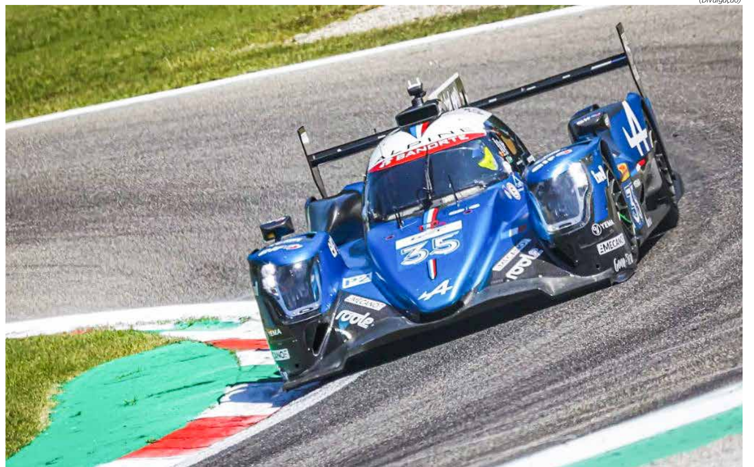
Brasileiro da Alpine se anima após melhora de desempenho do carro e trabalha para novo bom resultado

A Indy retorna para a última corrida da temporada neste fim de semana. Trata-se do GP de Laguna Seca, que acontece no circuito localizado em Monterey, na Califórnia.