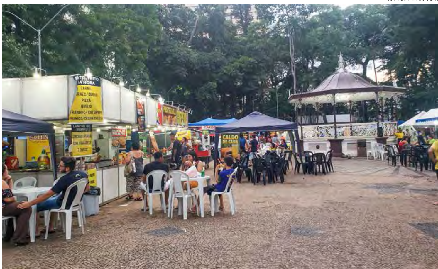
Ambulantes no Jardim Público durante o horário especial de funcionamento do comércio