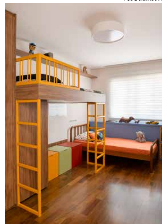
Um ambiente cheio de combinações e cores projetado pela arquiteta Patrícia Miranda