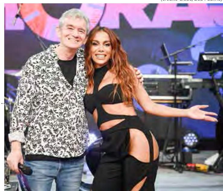
Serginho Groisman e Anitta