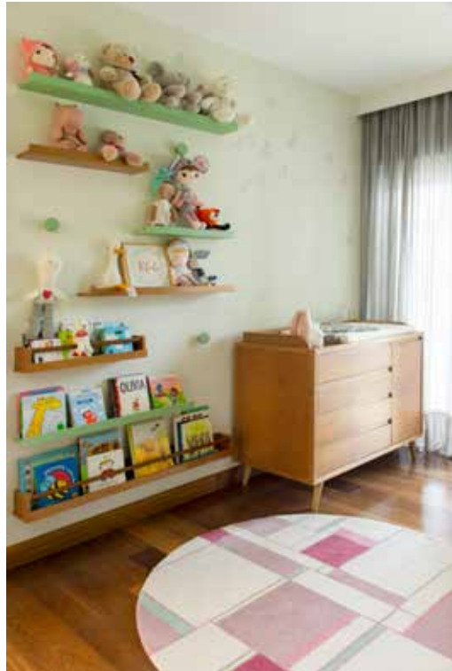
Uma solução para evitar o chão frio para as crianças é o piso de madeira, que tende a não ficar tão gelado nos dias mais frios