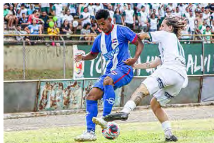
União São João despachou Nacional e disputa acesso