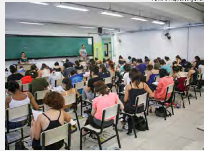
O vestibular da Unesp é dividido em duas fases