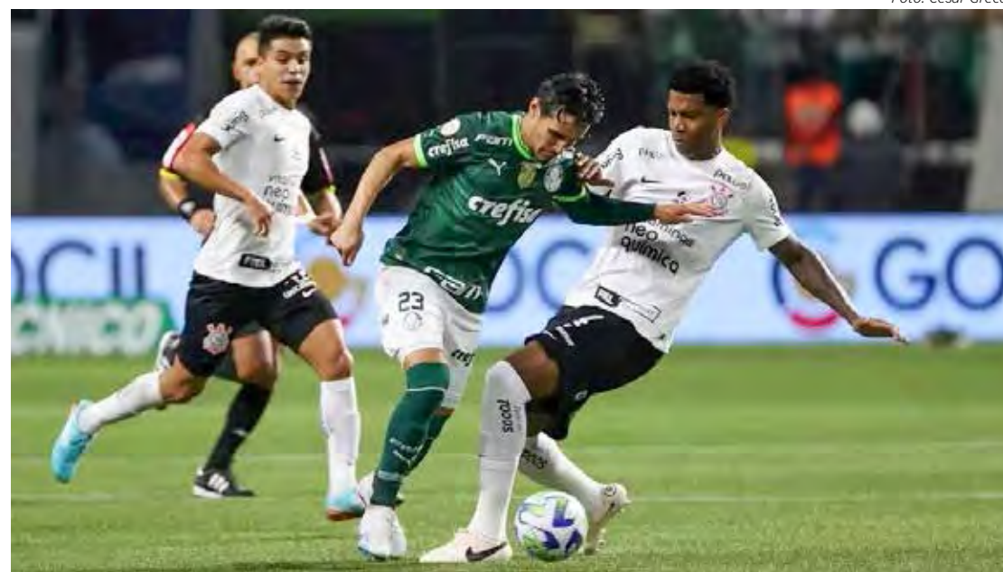
Clássico ficou no 0x0