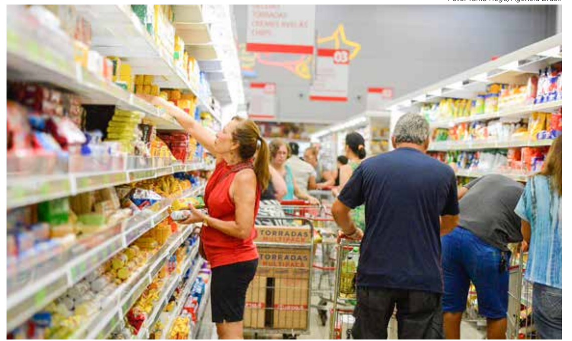
A pesquisa avaliou quase 10 mil alimentos e bebidas das principais redes de supermercados de São Paulo e Salvador