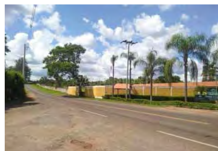
Estrada que dá acesso à represa do Broa

As vítimas, um homem de 59 anos e outro de 64, foram socorridas pelos Bombeiros para o Pronto-Socorro de Itirapina. Até o fechamento desta edição não havia mais informações sobre o estado de saúde deles.