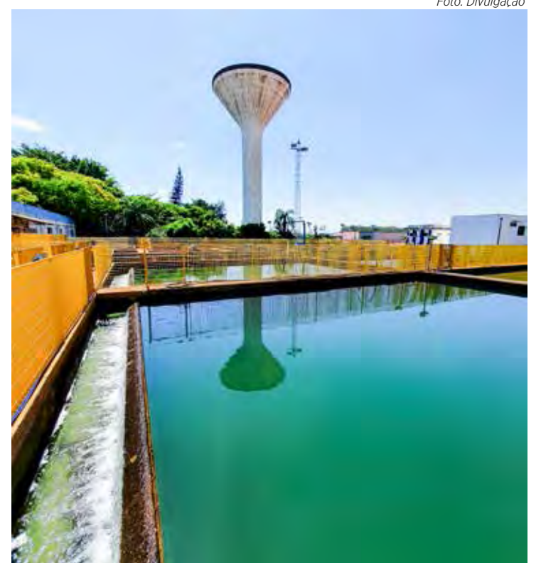
Para executar esse trabalho, será necessário parar temporariamente as operações da ETA 1

A ETA 2, que fica na estrada vicinal Nicolau Marotti e abastece os outros 60% da cidade, seguirá funcionando normalmente. Em caso de chuva, o serviço será remarcado.