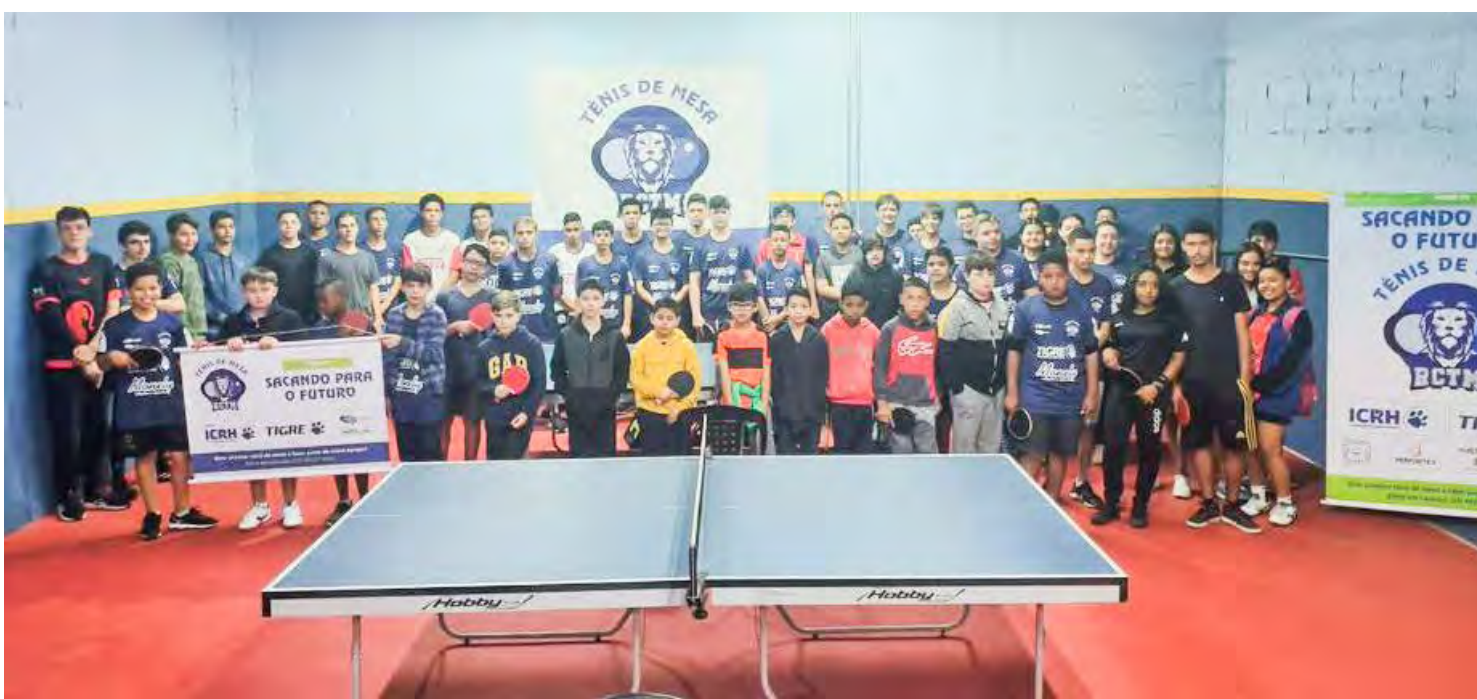
1º Festival de Tênis de Mesa da RCTM reuniu mais de 60 alunos