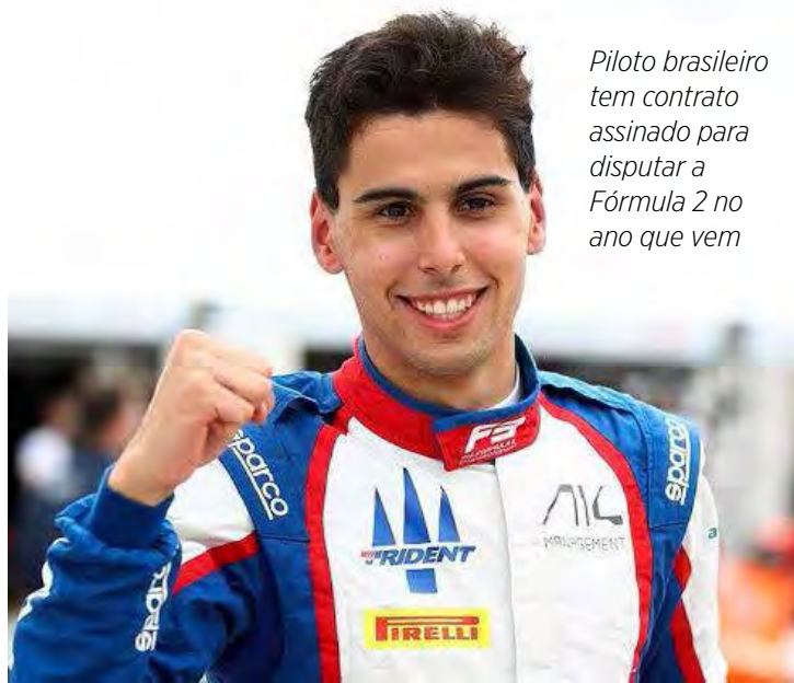
Piloto brasileiro tem contrato assinado para disputar a Fórmula 2 no ano que vem

Partindo do oitavo posto, o brasileiro foi ultrapassando os adversários um a um em manobras bastante acirradas, como a que valeu o segundo lugar justamente para cima de Boya, na