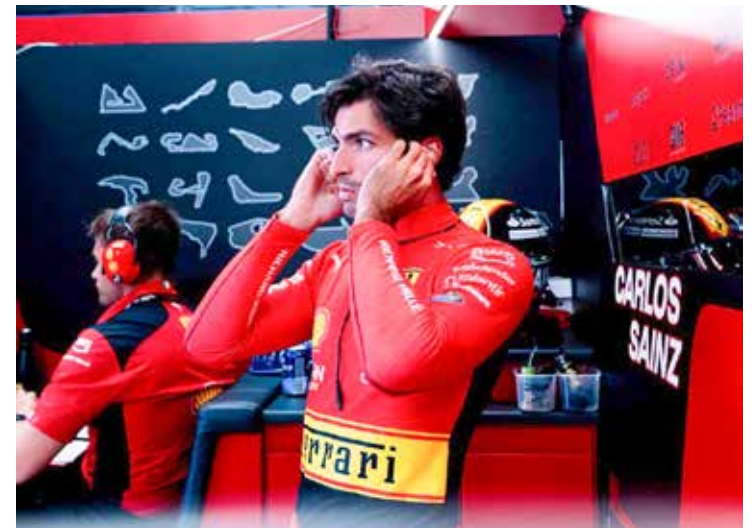
Carlos Sainz Jr. da Ferrari, garantiu a pole position e vai largar em primeiro lugar em Monza

Às 10h tem início o GP da Itália, com transmissão da Band, Bandsports, Band.com e Bandplay.