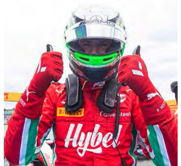
Piloto da Prema tomou a liderança ainda na largada