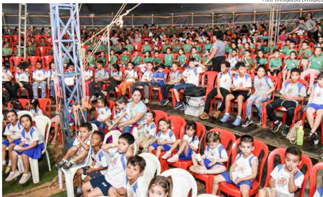
Crianças assistiram a espetáculo do circo Las Vegas

Assistiram ao espetáculo alunos da Escola Agrícola e escolas Isolina Hupert Cassavia, Laura Pena Joly, Denizard