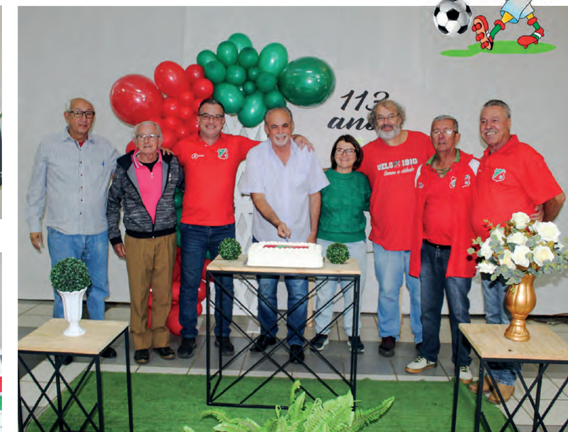
Diretoria do A. E. Velo Clube no momento dos Parabéns