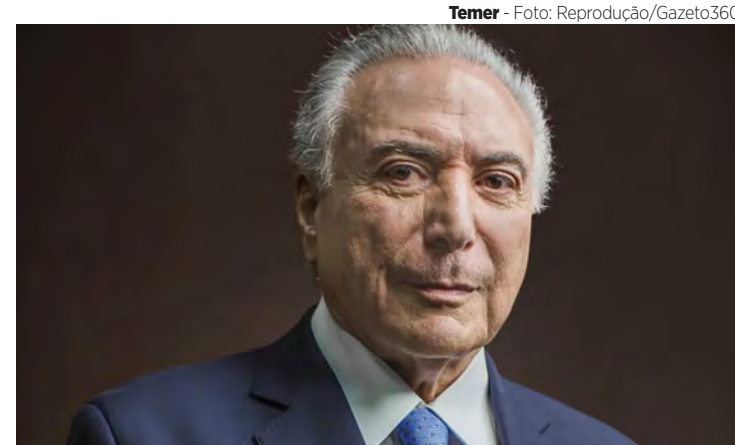
Temer - Foto: Reprodução/Gazeto360

novidades devem surgir já que Mauro Cid tenta realizar um acordo de delação premiada com a Polícia Federal, e para isso deve dar algo em troca.