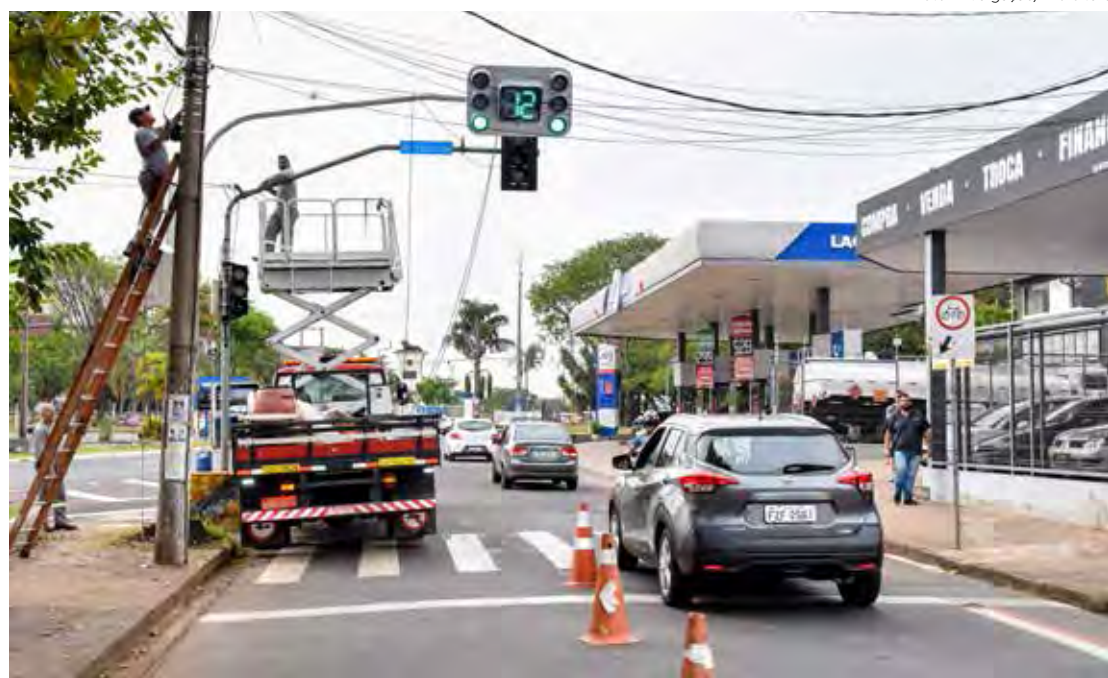
Via passa por ampla remodelação, terá ciclovia e maior acessibilidade