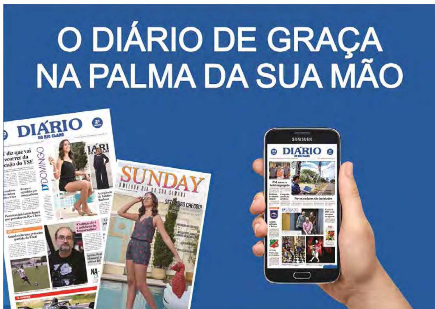
O DRC conta com versão digital que pode ser acessada gratuitamente pelo site www.j1diario.com.br ou pelo WhatsApp