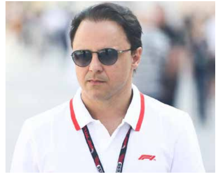
Equipe jurídica do brasileiro pede agilidade e retorno das entidades até a próxima sexta-feira, 8 de setembro

Vale lembrar que a ação prometida não julgará o caso em si, ela exige que respostas formais sobre 2008 sejam dadas. Se ainda assim os argumentos de FIA e FOM não forem satisfatórios, a equipe formada por Massa deve entrar com outra ação para apreciação do caso.