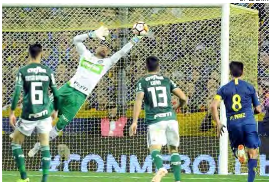
Rivalidade em campo entre brasileiros e argentinos

Além de Palmeiras e Boca Jrs, o Internacional de Porto Alegre também já está classificado. A equipe gaúcha passou pelo Bolívar-BOL, com duas vitórias. Ontem, Olímpia do Paraguai e Fluminense, decidiram no estádio Defensores Del Chaco, em Assunção-PAR, a última vaga.