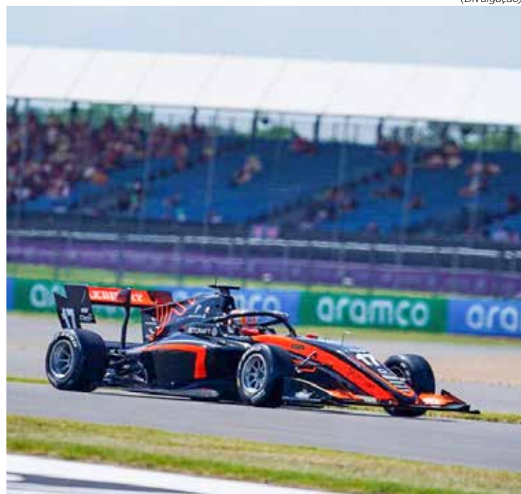
Brasileiro da equipe VAR ocupa o 10º lugar no campeonato