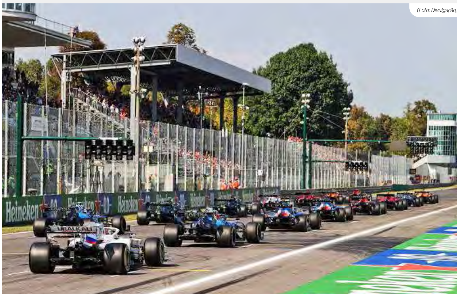
Fórmula 1 2023 chega ao Templo de mais alta velocidade no calendário