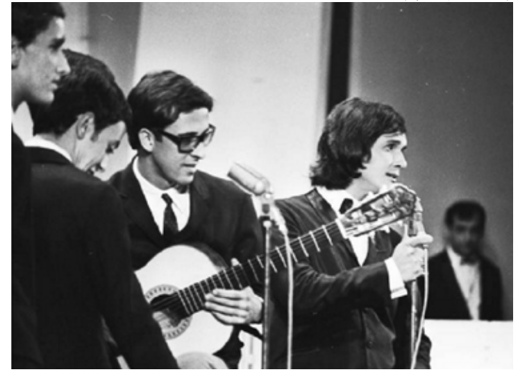
Roberto Carlos em registro de Festival de Música