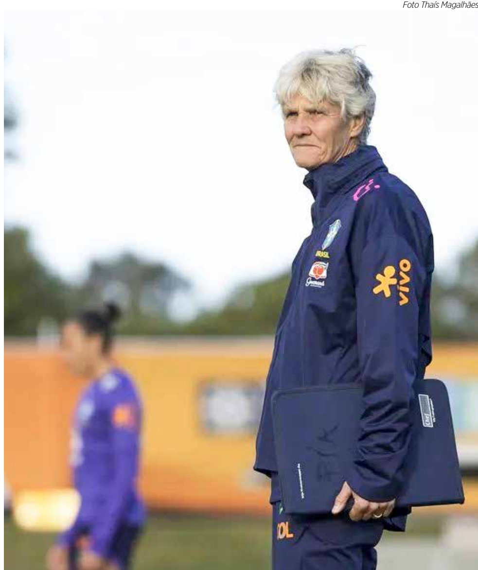
Pia Sundhage foi demitida pela CBF

Pia Sundhage assumiu a seleção brasileira em 2019. De lá para cá foram 57 jogos sob seu comando, sendo 34 vitórias, 10 derrotas e 13 empates. A única conquista de Pia Sundhage à frente da seleção brasileira foi a Copa América, ano passado, que garantiu a equipe brasileira na Olimpíada de Paris em 2024.