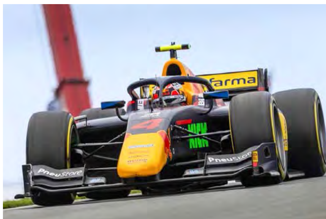
Enzo Fittipaldi também na pista de Monza neste final de semana

A primeira corrida, com 21 voltas, será disputada no sábado, às 9h15, enquanto a corrida 2, que contará com 30 voltas, tem início marcado para 4