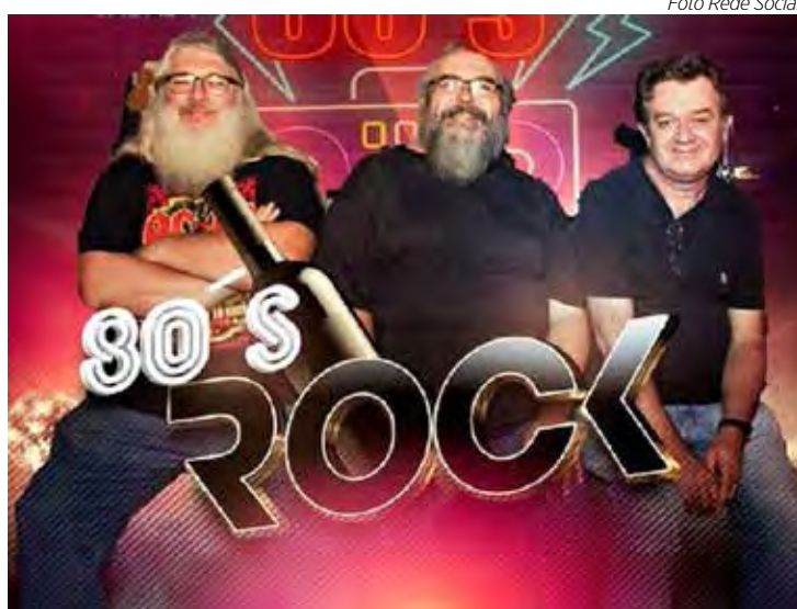
80 Rock na Choperia Monte Azul e no Biertempel

PARÓQUIA SANTA CRUZ – No sábado (2) e domingo (3) a partir das 19h, tem início a tradicional quermesse da Santa Cruz, com barracas típicas de doces e salgados