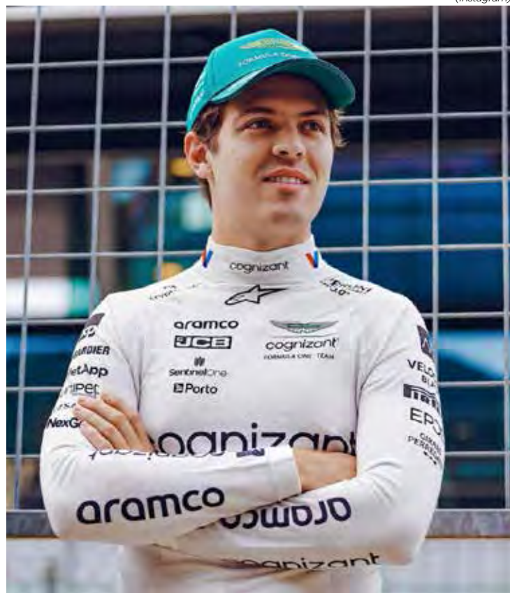
Brasileiro venceu a Fórmula 2 no circuito de Monza, local da etapa