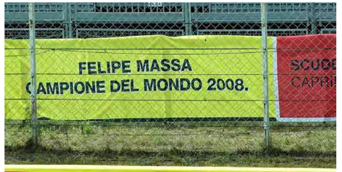
Faixa em manifestação a Felipe Massa, que reivindica título de Campeão da F1 2008

Massa estará presente no circuito neste fim de semana, sendo sua primeira aparição no paddock desde que iniciou o processo de judicialização da temporada de 2008.