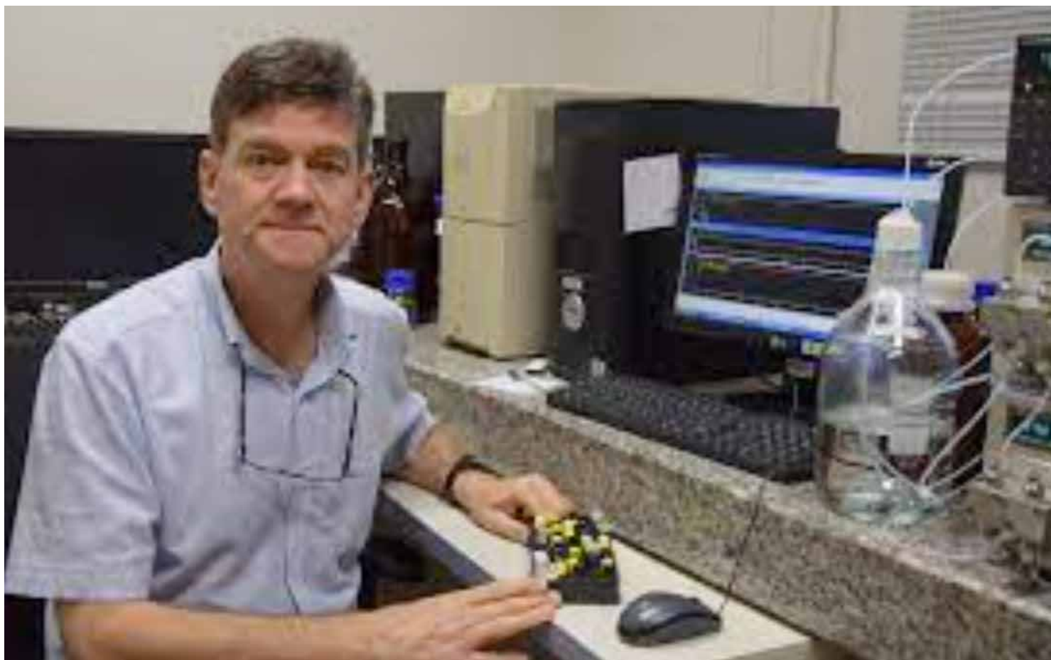
Pedro Luís Rosalen, um dos homenageados listados entre os melhores cientistas do mundo