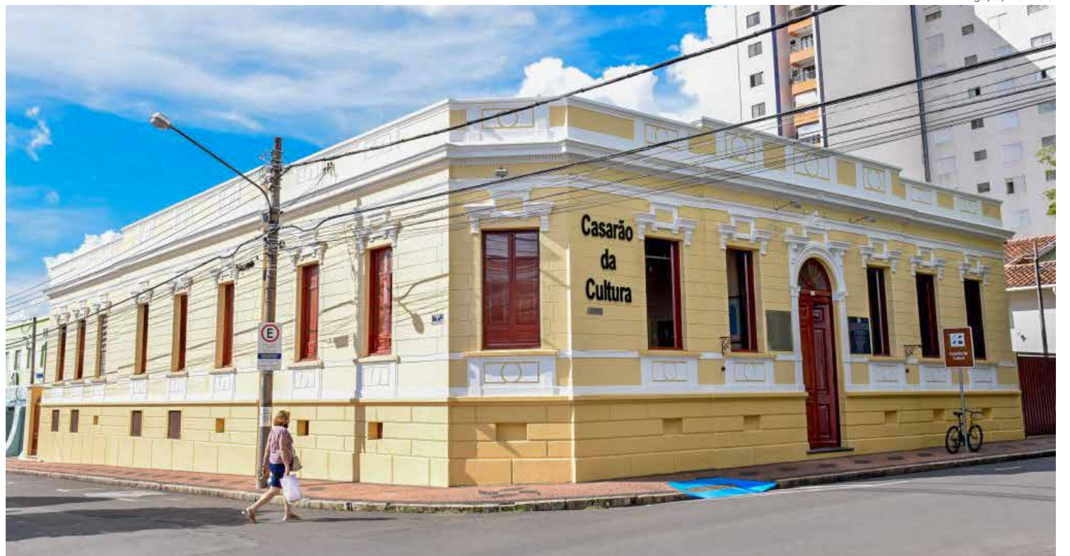
O Casarão da Cultura fica na Avenida 3 esquina com a Rua 7, Centro

O evento é realizado pela prefeitura por meio da Secretaria Municipal de Cultura, com apoio da Assessoria dos Direitos da Pessoa com Deficiência. O Casarão da Cultura fica na Avenida 3 esquina com a Rua 7, Centro.