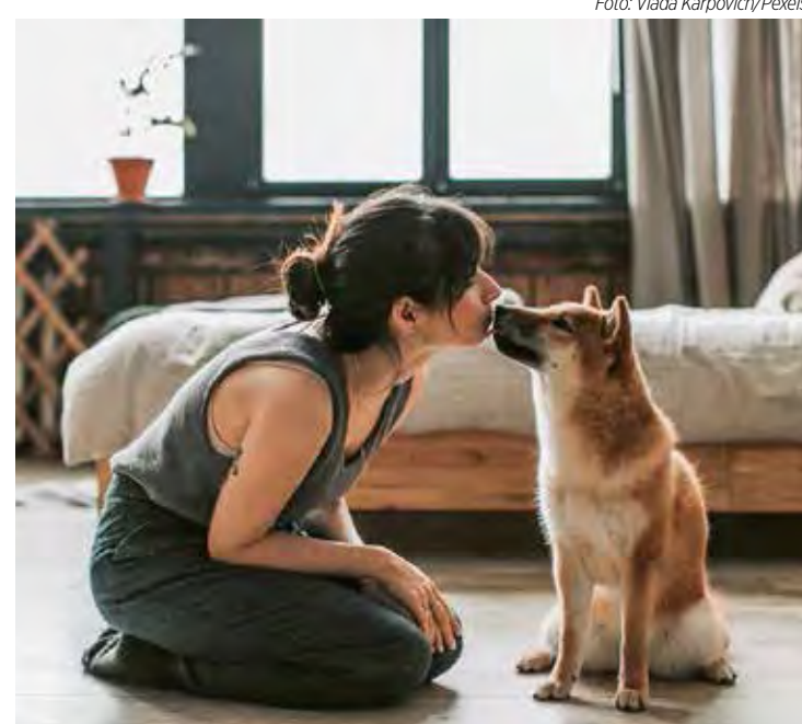
A ligação implica numa relação de confiança e é a base fundamental do laço entre o tutor e o animal de estimação