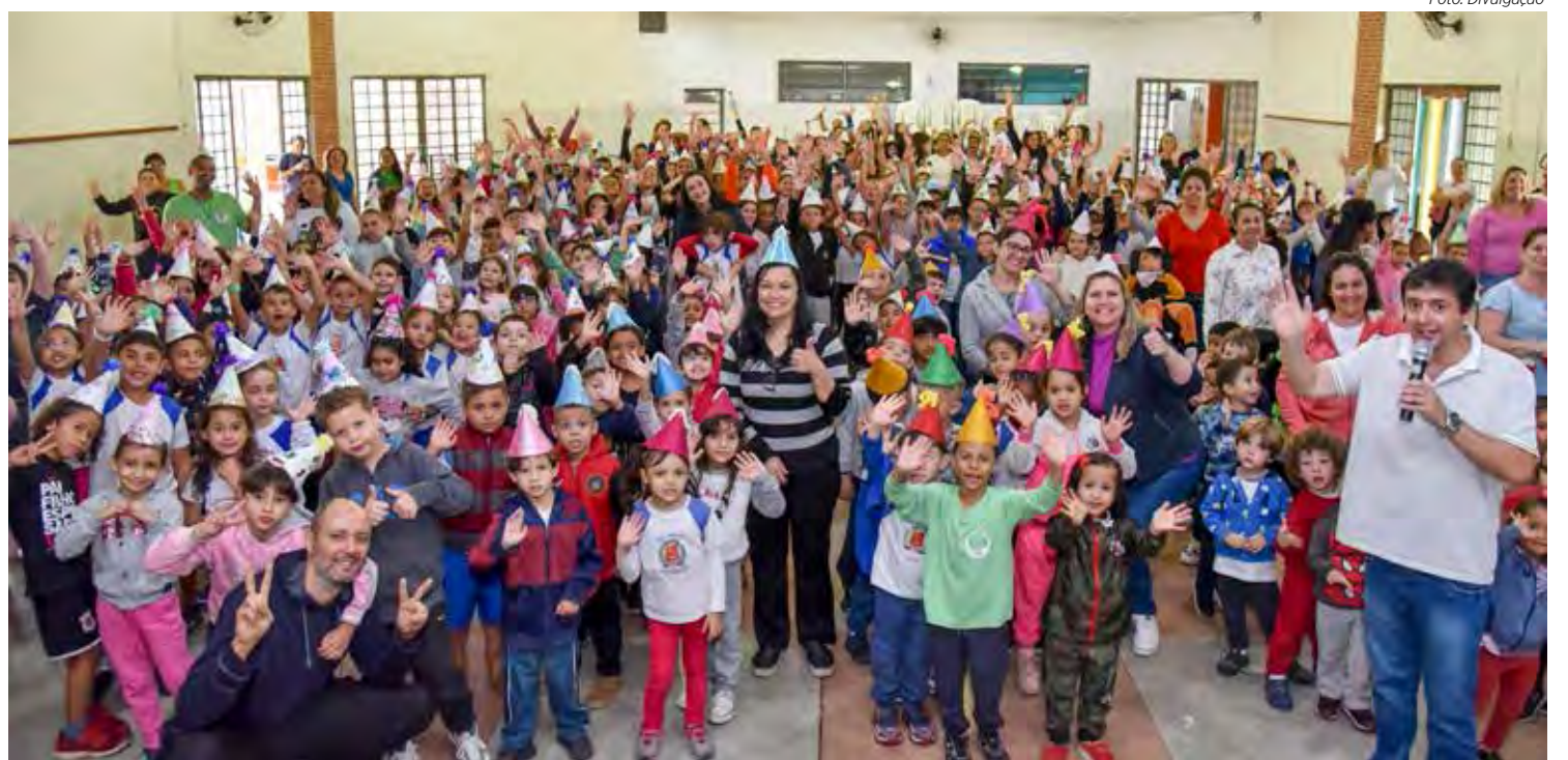
Atividades reuniram alunos, professores e demais funcionários

Os quase 800 alunos levaram pratos para um piquenique, cantaram o hino da escola, o Parabéns Pra Você e se confraternizaram nos celebrando os 43 anos da escola.