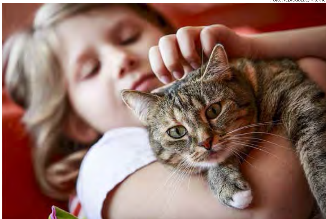
A força do amor incondicional é capaz de transformar as vidas de tutor e pet.