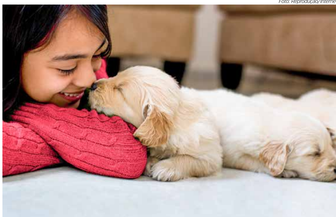
A ligação implica numa relação de confiança entre tutor e animal de estimação