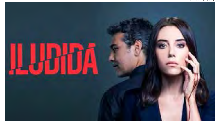
"Cartaz promocional da série turca 'Iludida', estrelada por Cansu Dere e Caner Cindoruk, disponível no HBO Max/

Hoje, por acaso, faz sucesso na Argentina e também está disponível no HBO Max.