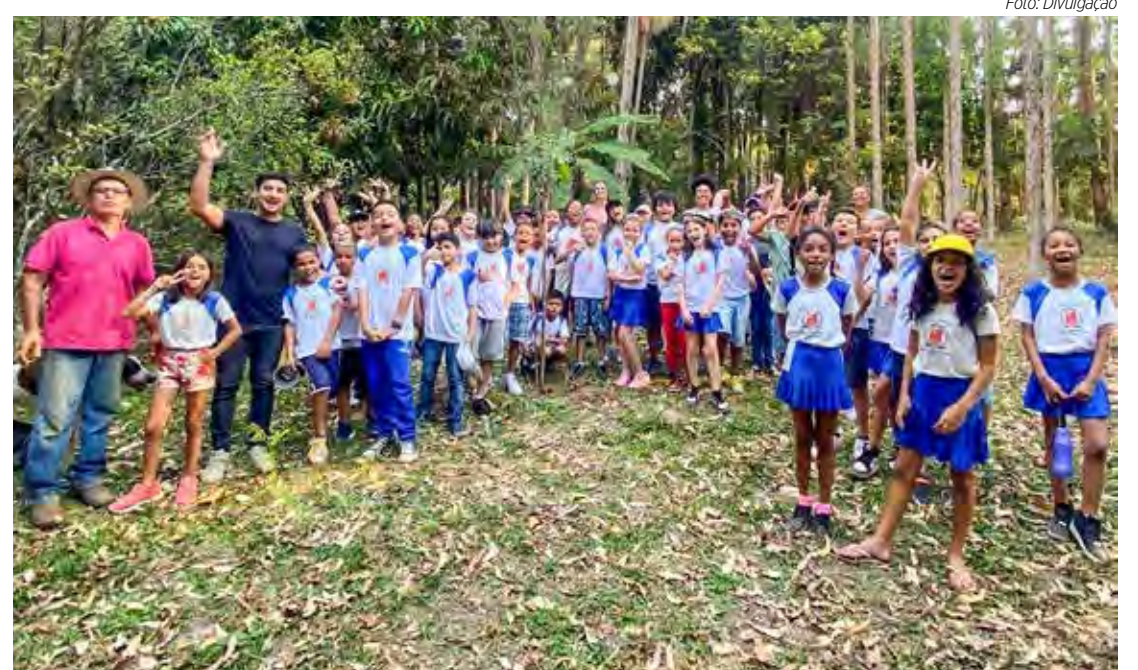
Visita foi realizada na sexta-feira (25) por alunos da escola Hernani Fittipaldi

A experiência foi finalizada no Viveiro Municipal, local de gran-