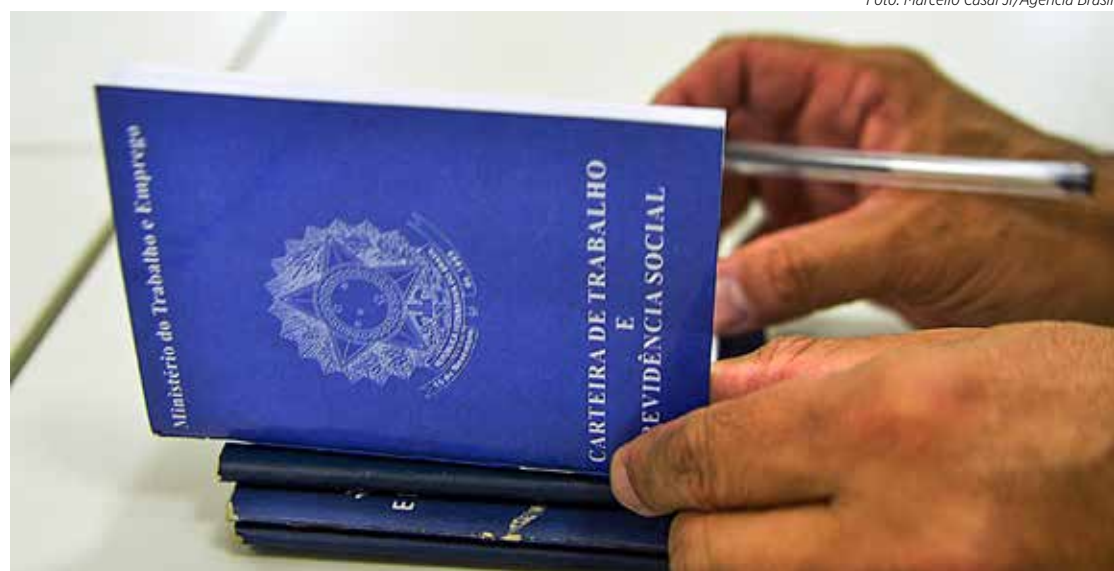
O município de Rio Claro fechou julho com saldo positivo de 285 empregos com carteira assinada

De acordo com o Caged, o saldo positivo foi registrado em quatro dos cinco grupamentos de atividades econômicas que fazem parte do levantamento.