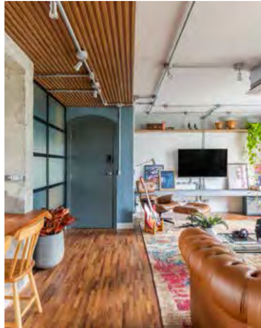
Neste apartamento, Pietro Terlizzi uniu o moderno e o industrial. Com as ripas de freijó no forro, criou-se um corredor que dá as boas-vindas