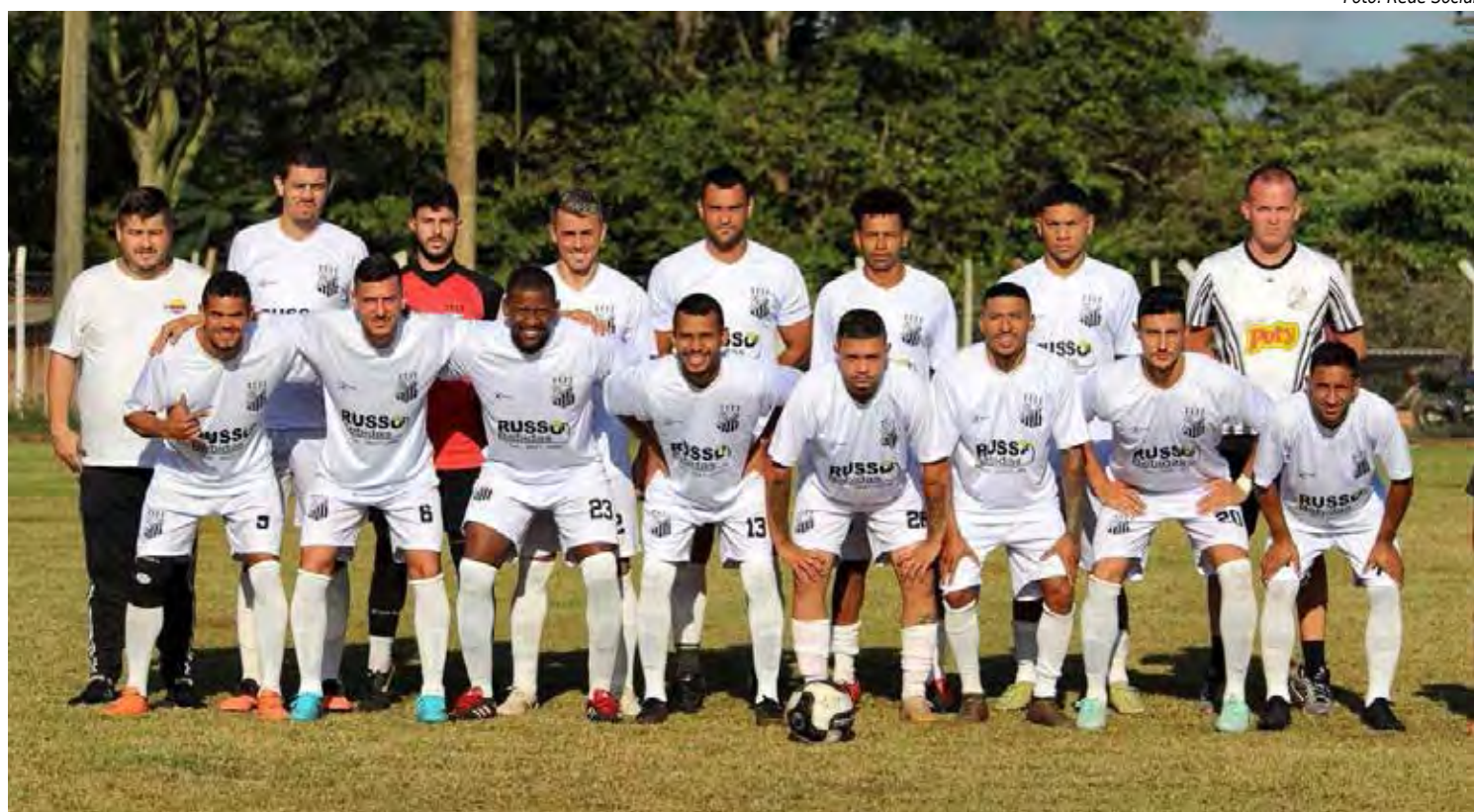
Santana vence o rival Juventude

No último sábado (26), aconteceu a 2ª. rodada do Campeonato Municipal Veteranos 3.8. Confira os resultados: Juventude 3 x 1 Zona Leste, Unidos 1 x 2 Batovi, São Paulinho 3 x 1 Itirapina, IX de Julho 1 x 0 CSA Ajapi, Santa Maria 4 x 2 Pumas e Panorama 0 x 0 Bellmare.