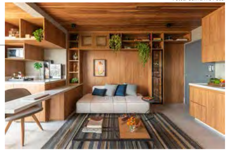
Na sala de estar projetada por Pietro Terlizzi, a madeira é protagonista e está em forro (cumaru), paredes e mobiliário de freijó