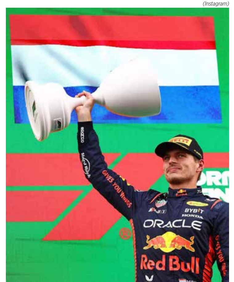
Com nove vitórias consecutivas, Verstappen igualou marca de Vettel

No mundial de construtores, a Red Bull/Honda RBPT vem disparada em primeiro com 540 pontos; seguida pela Mercedes com 255. A Aston Martin/Mercedes aparece em terceiro com 215 e a Ferrari, com 201.