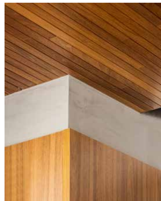
O forro de madeira não é indicado para áreas úmidas – neste caso opte pelo gesso verde, específico para esses ambientes