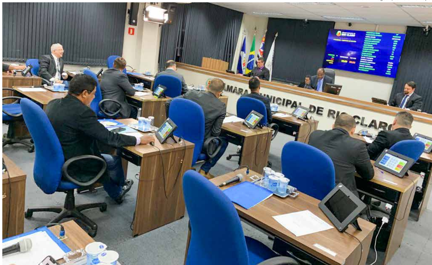
Vereadores no plenário da Câmara Municipal durante a sessão ordinária desta segunda-feira (28)

Os vereadores aprovaram outros sete projetos em primeira discussão. Entre eles, proposta do Executivo Municipal que desafeta a destinação original de área institucional localizada no loteamento Bosques de Rio Claro para construção de empreendimento habitacional de interesse social. De acordo com o projeto, a previsão é de construir 200 moradias