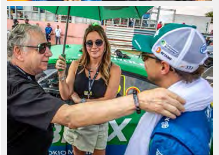
Felipe Massa contou com uma visita ilustre nos boxes de Goiânia