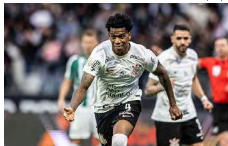
Gil fez o gol da vitória que dá vantagem ao Timão