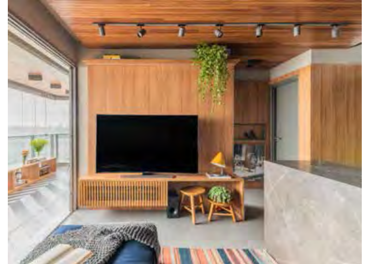
Nesta sala de estar, o arquiteto Pietro Terlizzi adotou o cumaru no forro, mas na marcenaria e nos painéis há o freijó