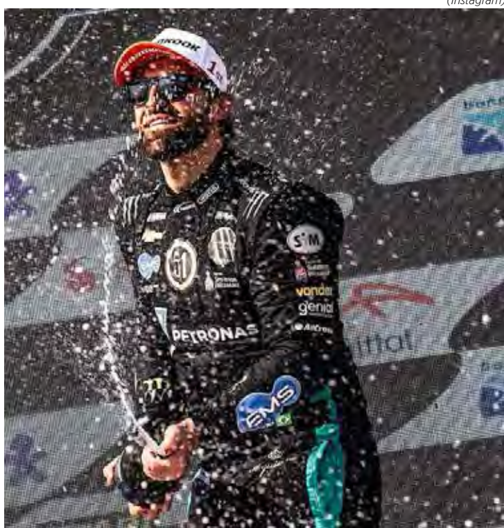
Piloto do carro #51 liderou dobradinha da Pole Motorsport