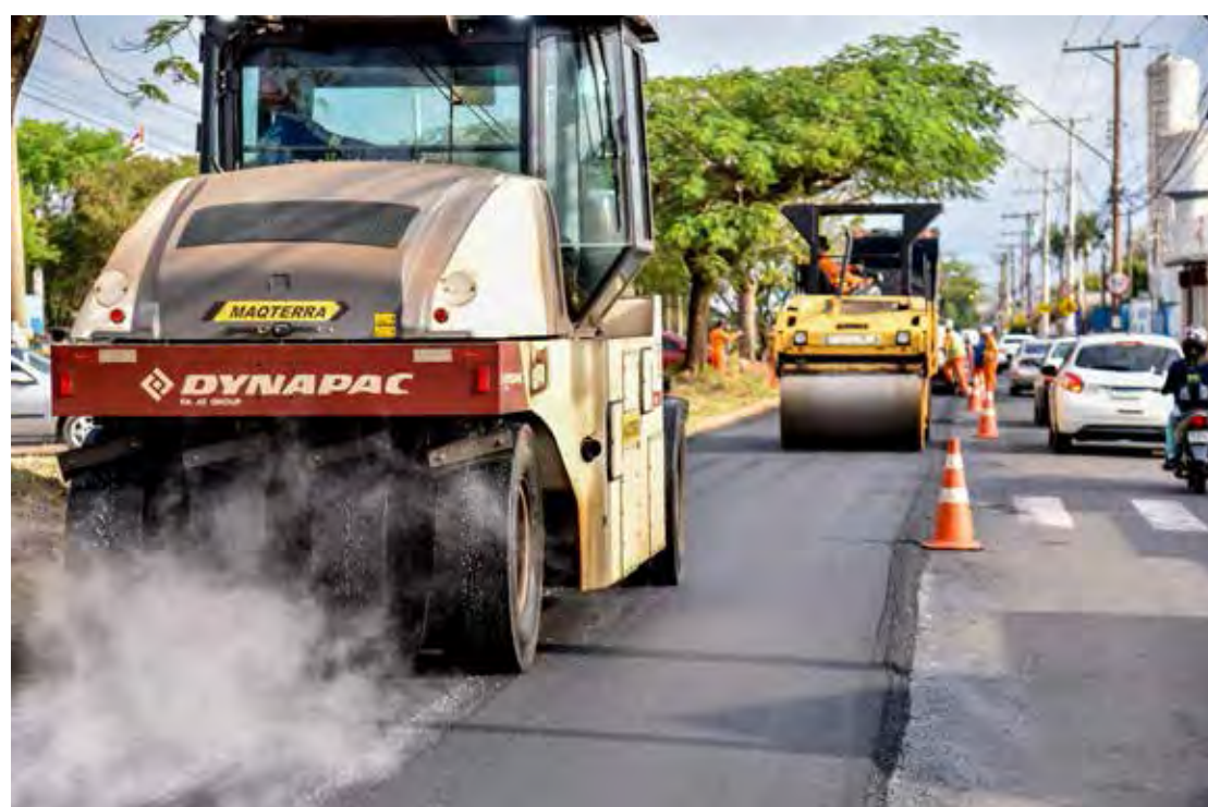
Motoristas devem redobrar a atenção durante recapeamento na via.

A prefeitura de Rio Claro já concluiu o recapeamento na via paralela à Avenida Brasil, a Rua 3-A, recapeada da Avenida 50-A até a Avenida 80-A. O trecho recapeado está recebendo pintura de solo.