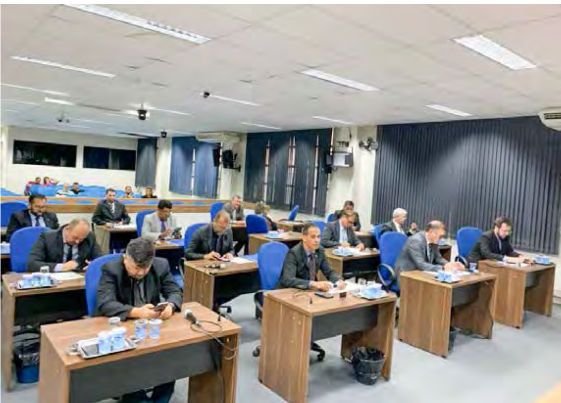
Vereadores aprovaram seis projetos na sessão ordinária desta segunda-feira, dia 21 de agosto