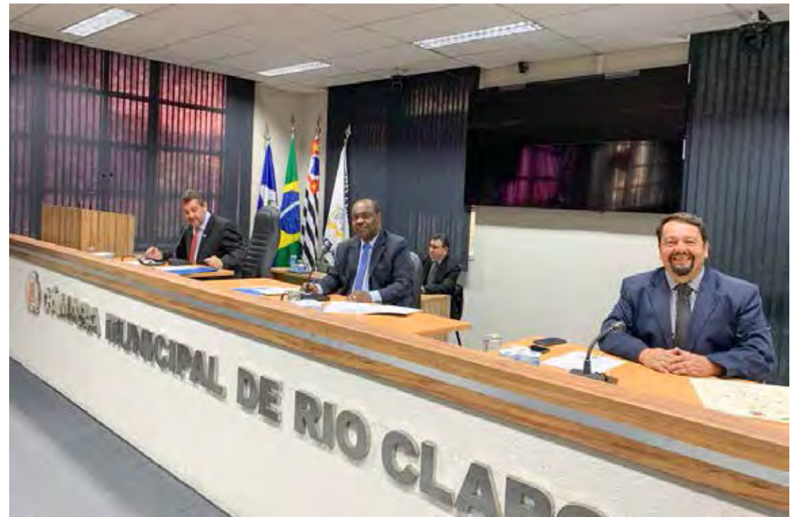
Presidente Pereira retomou os trabalhos na sessão desta segunda-feira