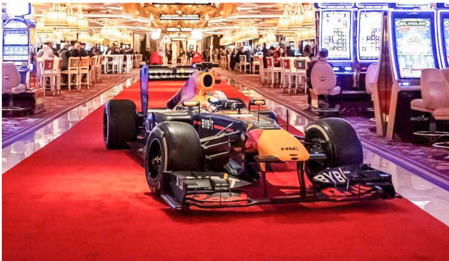
Perspectiva de novas atualizações e melhorias no carro dominante deste ano mantém todos atentos