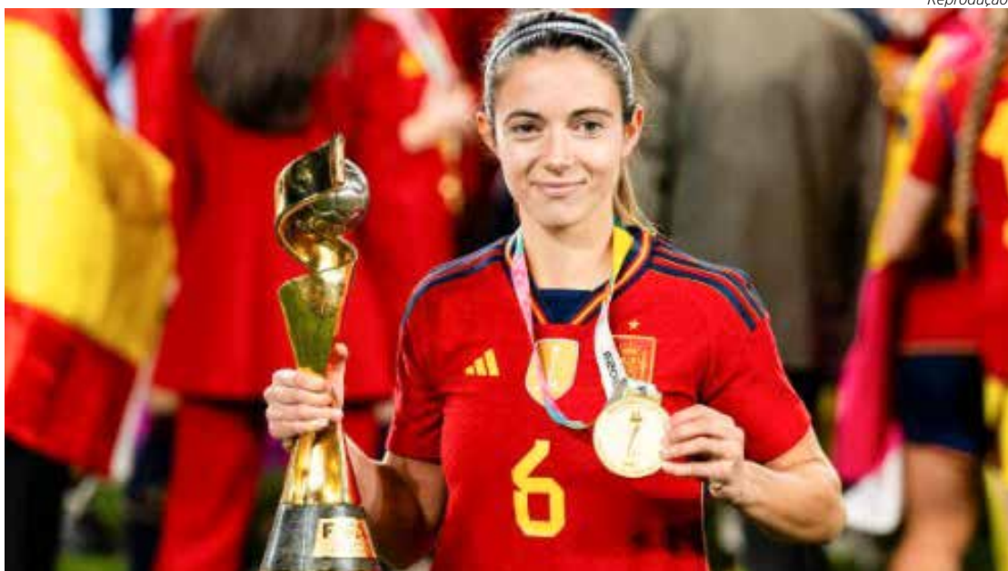
Meia espanhola, Aitana Bonmati, 25 anos, melhor jogadora do Mundial