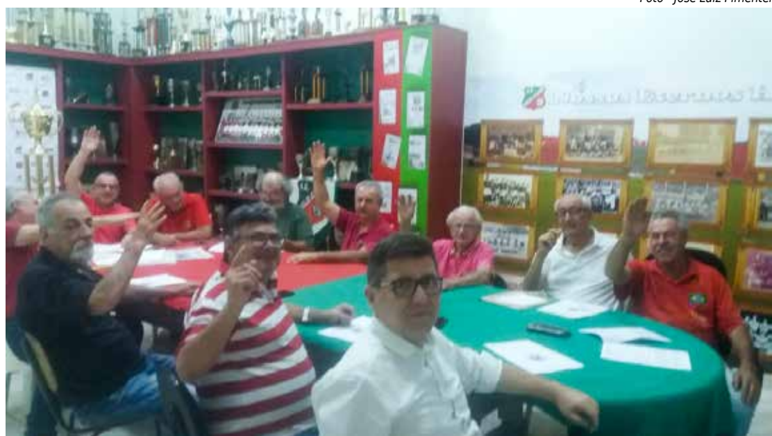
Velo Clube realizou Assembleia para reforma do Estatuto

A venda de adesão para o Almoço Comemorativo dos 113 anos do Velo Clube, no próximo domingo (27), encerra-se nesta quarta-feira (23). As adesões individuais custam R$70,00 e podem ser adquiridas no estádio Benitão, em horário comercial. O cardápio do almoço é um suculento churrasco e seus respectivos acompanhantes. Bebidas à parte.