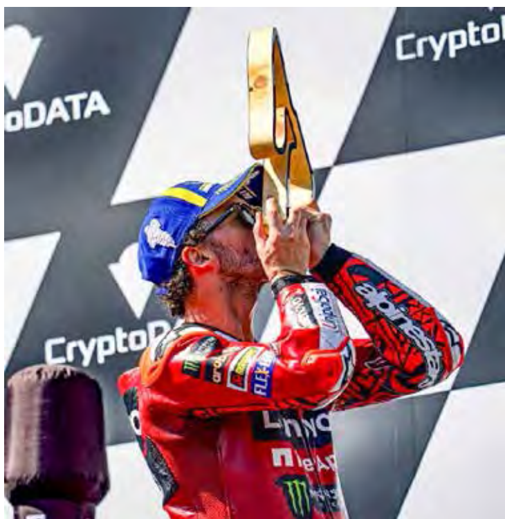
Etapa no Red Bull Ring foi de domínio total do atual líder do campeonato

Enquanto isso, Marco Bezzecchi tenta se aproximar de Martin para 'roubar' o segundo lugar do espanhol. A diferença entre os dois se manteve em seis pontos.