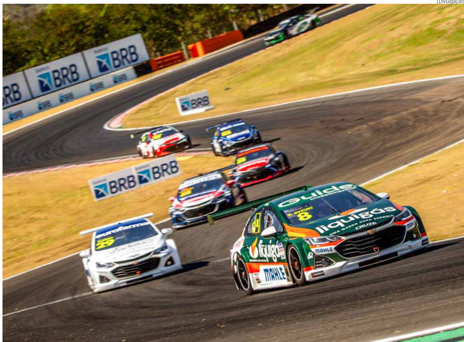
Stock Car tem rodada no final de semana, no Autódromo Internacional Ayrton Senna