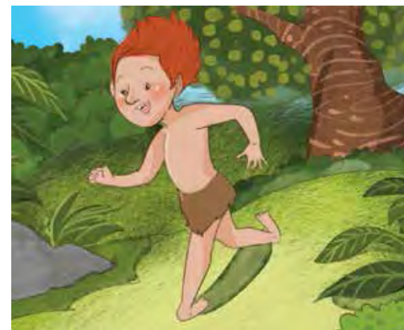
A lenda do Curupira fala de um ser mítico que protegia a floresta contra caçadores