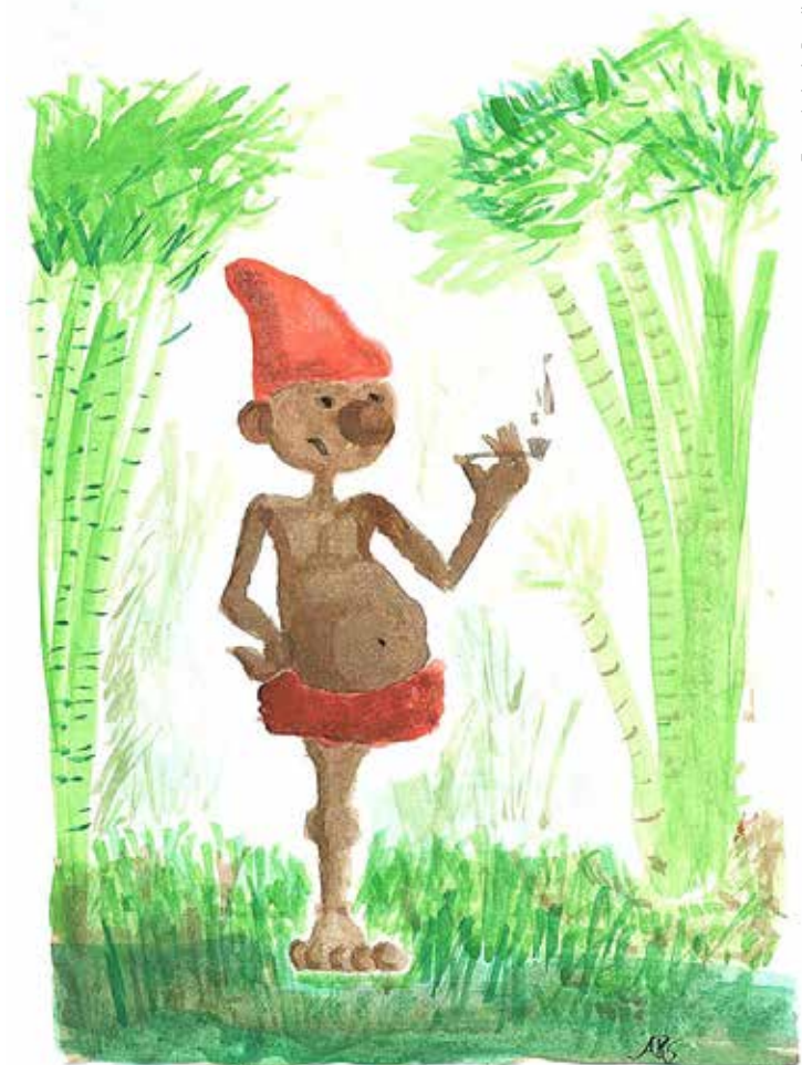
O Saci Pererê é uma das lendas do folclore brasileiro

Brincadeiras: trava-línguas, soltar pipa, bola de gude, pique-pega e passa anel.