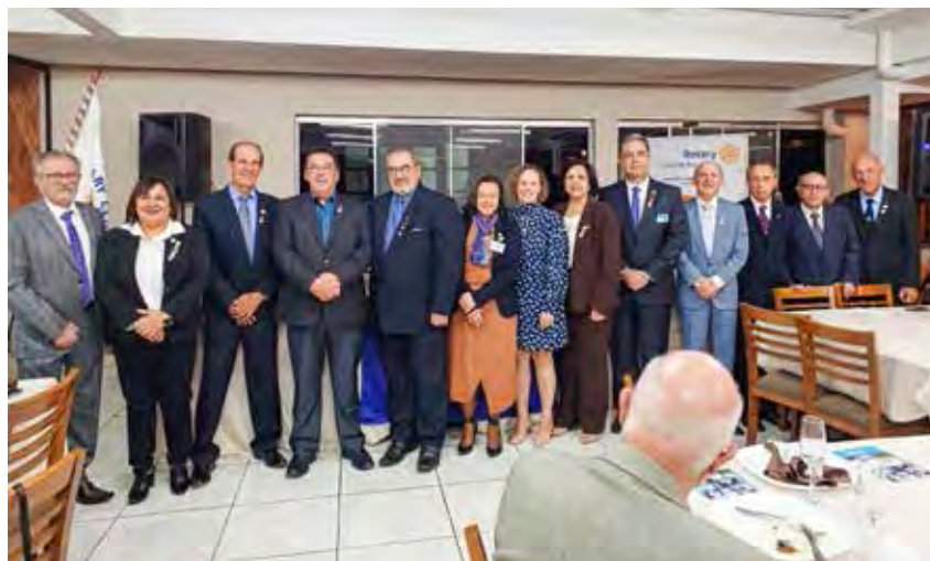
Posse do Conselho Diretor 2023-2024