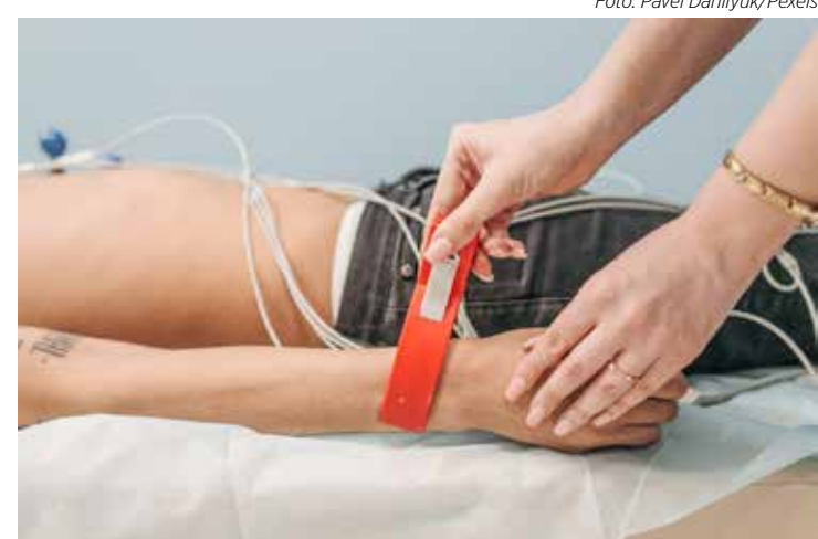
O eletrocardiograma monitora o coração por eletrodos na pele e registra o sinal elétrico em papel.