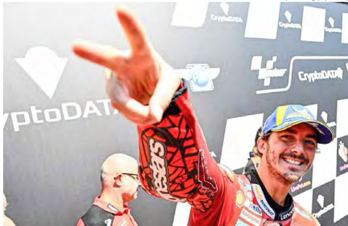
Francesco Bagnaia venceu Sprint na Áustria