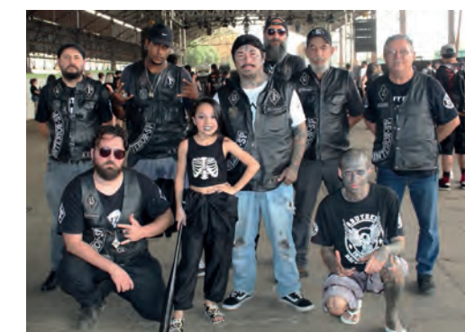
Os Abutres Moto Clube