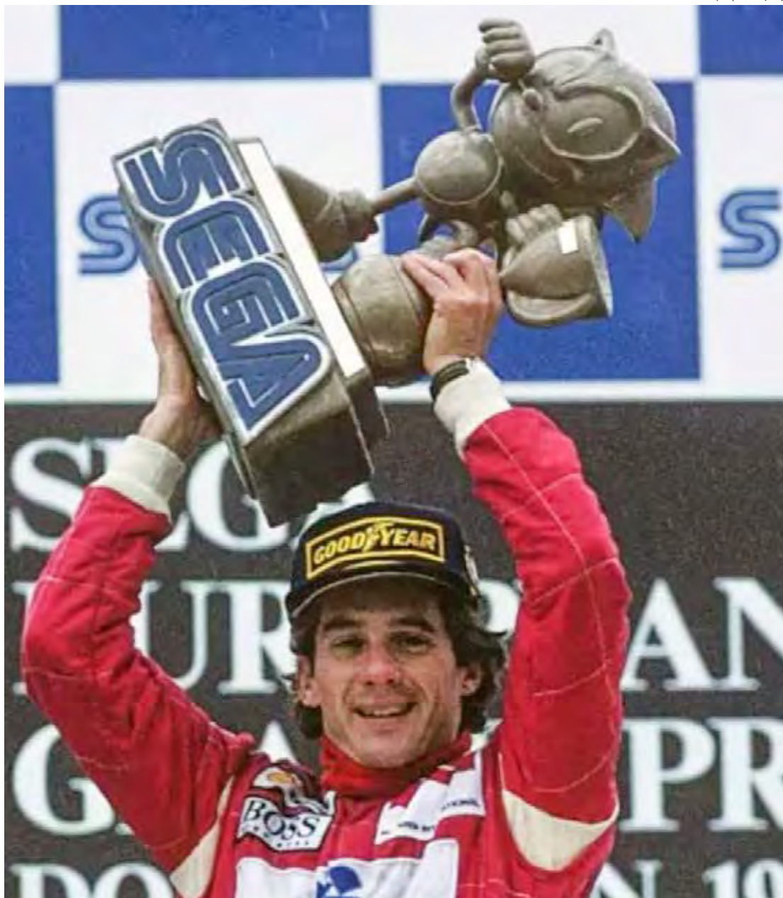
Em 1993, o corredor conquistou um troféu único, que só agora foi reencontrado pela McLaren