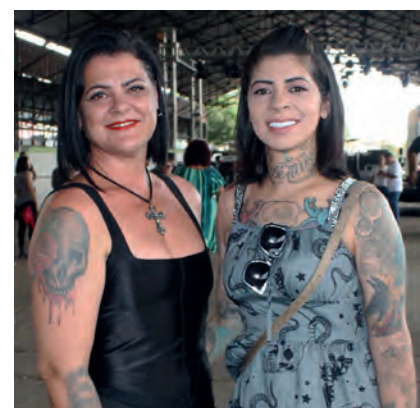
Neura e Seny