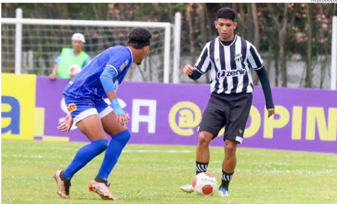
Rio Claro FC na disputa do Paulista Sub-20