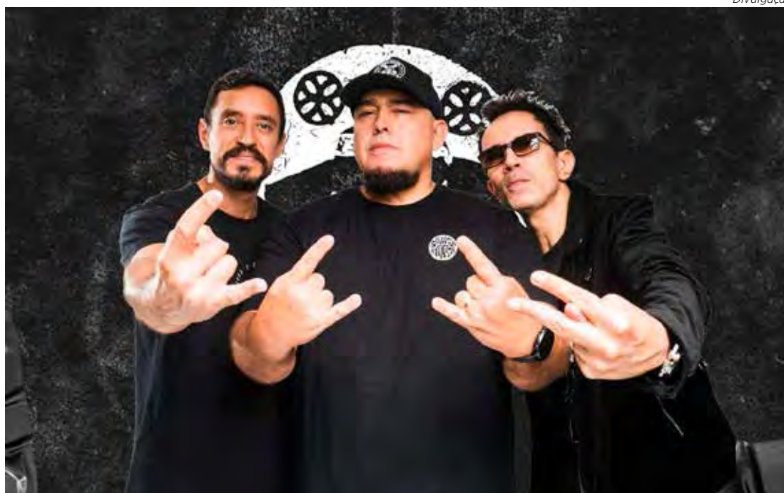
A banda Raimundos fará show gratuito neste domingo (20) em Santa Gertrudes

Depois haverá apresentação das bandas Alerta Mental, Hitmen, Barel, Tráfico de Influência, Dies Killers, Heal My