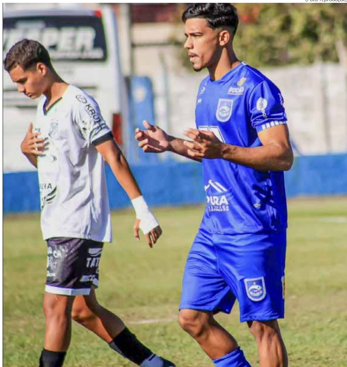
Em jogo decisivo, Rio Claro enfrenta a Portuguesa no Paulista Sub-20