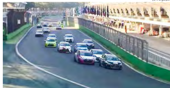
Turismo Nacional é atração no autódromo de Goiânia