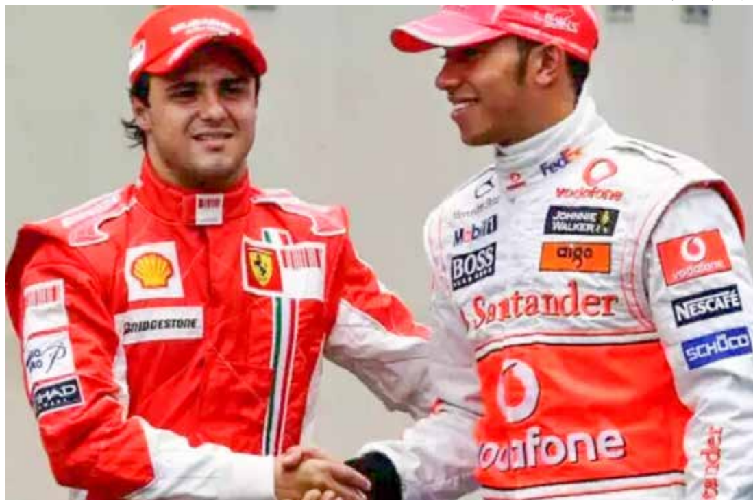
Brasileiro perdeu o título de 2008 para Lewis Hamilton por apenas 1 ponto