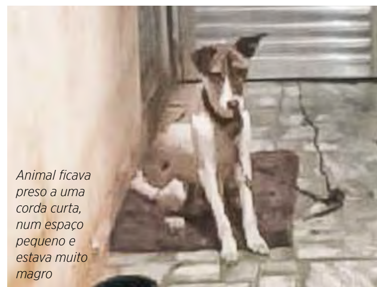
Animal ficava preso a uma corda curta, num espaço pequeno e estava muito magro

A ocorrência de maus-tratos a animal foi registrada no Plantão Policial e o cão foi resgatado e levado ao Canil Municipal, para receber os devidos cuidados. A Lei 14.064/2020 que trata dos direitos dos animais aumentou a pena para quem maltratar cães e gatos, pois quem cometer esse crime poderá ser punido com 2 a 5 anos de reclusão, multa e proibição da guarda. As informações são da GCM de Rio Claro.