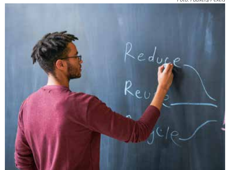
Rio Claro abriu vagas para professores temporários de educação básica

A prefeitura também está com inscrições abertas para o concurso público para contratação de procurador judicial. Os candidatos precisam ter ensino superior completo em Direito mais inscrição na Ordem dos Advogados do Brasil (OAB). As inscrições podem ser feitas até 11 de setembro no site www.avancasp.org.br , e a taxa custa R$ 79,00. O