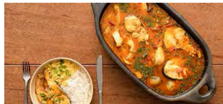
O peixe é um alimento saboroso e está presente em diversos pratos típicos das regiões brasileiras

tamanho do pintado e pique o alho restante, a cebola, o pimentão e o tomate (retirando a semente); 3. Aqueça o óleo, refogue o alho e a cebola e acrescente o tomate, o pimentão e a mandioca; 4. Cozinhe na água fervente até que a mandioca fique macia; 5. Acrescente o peixe e cozinhe por 15 min; 6. Salpique a cebolinha.