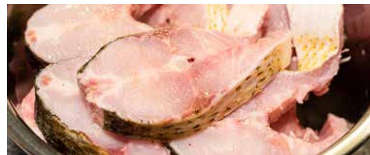
Os peixes são ricos em proteína de alta qualidade e em muitas vitaminas e minerais