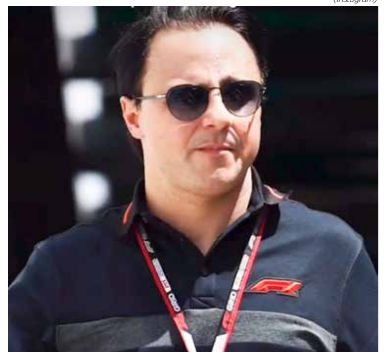
Felipe Massa sente que foi injustiçado na temporada de 2008 da F1