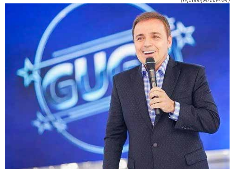
O apresentador Gugu Liberato (1959-2019), um dos grandes nomes da nossa TV