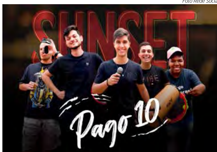
Grupo Pago 10 no Madalena Live Music