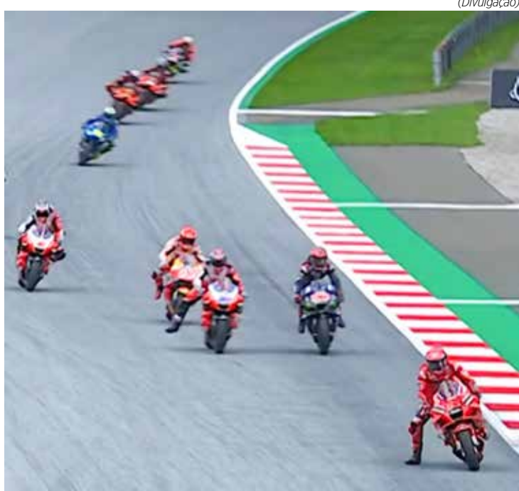
Principal categoria da motovelocidade mundial chega à metade da temporada neste fim de semana