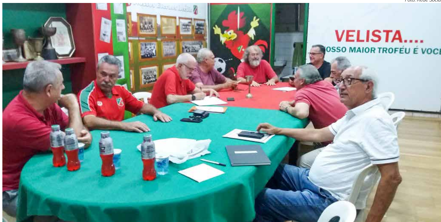
Sócios patrimoniais do Velo se reúnem em Assembleia, hoje, para reforma do Estatuto