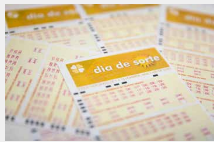
Novo sorteio será neste sábado

2º sorteio: 04 - 05 - 11 - 13 - 26 - 45. Nenhum jogador acertou os sete números em nenhum dos sorteios e o prêmio acumulou em R$ 6,5 milhões. O próximo sorteio da Dupla Sena ocorre neste sábado dia 12.