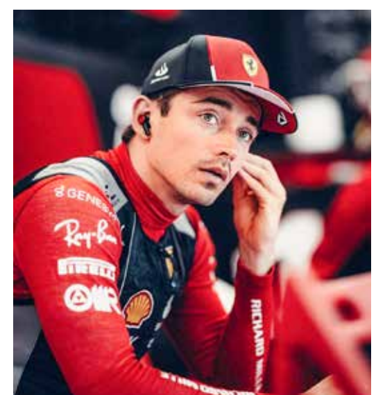
Leclerc: “As tratativas sobre meu contrato ainda nem começaram”

“Todos os rumores de que estou sendo ligado a outras equipes significam apenas que estou fazendo bem o meu trabalho. De todo modo, para mim, é indiferente, porque sei o que quero. Mas ainda não sei o que a Ferrari quer de mim. As negociações sobre meu contrato ainda nem começaram, mas para mim tudo está claro. Eu amo a Ferrari e quero vencer aqui. Essa é a prioridade para mim”, afirmou