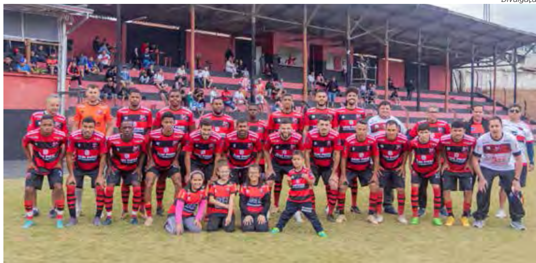
Equipe do Cidade Nova FC que disputa o Campeonato Amador