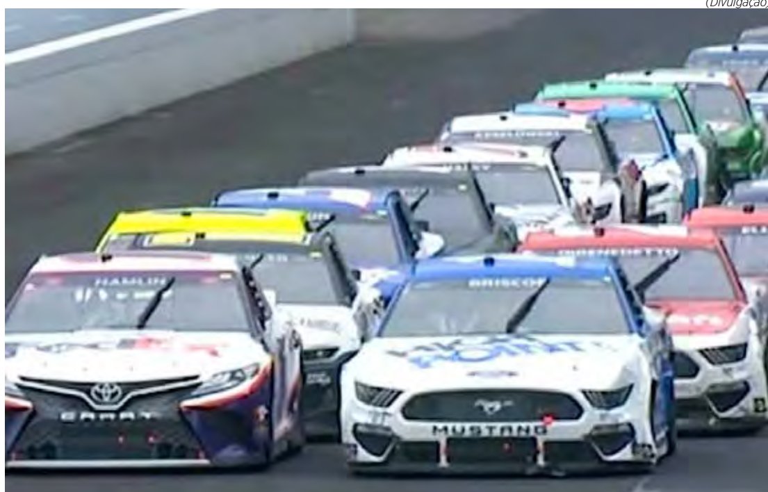
Corrida acontece neste domingo, com largada às 15h30

A corrida da NASCAR Cup Series deste fim de semana, no Indianapolis Motor Speedway (IMS), conta com uma lista de estrelas internacionais de todos os cantos do mundo das corridas. Com apenas três provas para os playoffs da Cup, a corrida de 82 voltas ao redor do