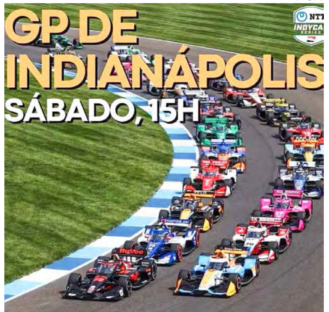
GP de Indianápolis 2 terá transmissão da ESPN e TV Cultura