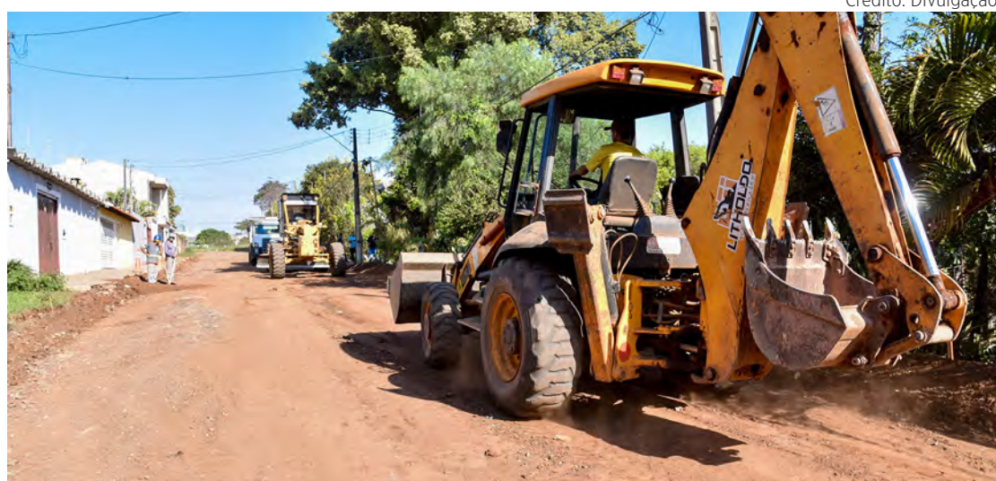
No total serão 17 mil metros quadrados de pavimentação no Jardim Nova Veneza.