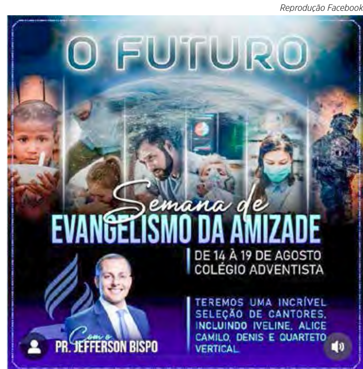
Igreja está divulgando o evento também nas mídias sociais

O nome Adventista do Sétimo Dia reflete as crenças da igreja em três palavras. “Adventista” indica a segurança do breve retorno (advento) de Jesus a esta Terra. “Sétimo Dia” se refere ao Sábado bíblico de descanso que foi graciosamente dado por Deus para a humanidade na criação e observado por Jesus durante a Sua encarnação. Juntos, os dois termos falam do evangelho que é a salvação em Jesus Cristo. (Com informações do portal adventistas.org)