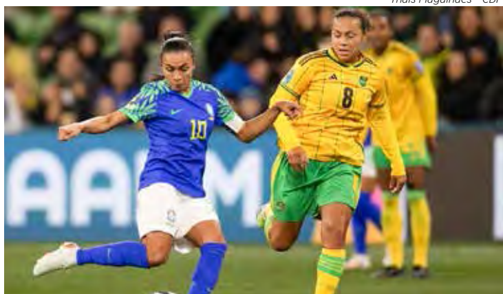
Brasil só empata e se despede do Mundial feminino