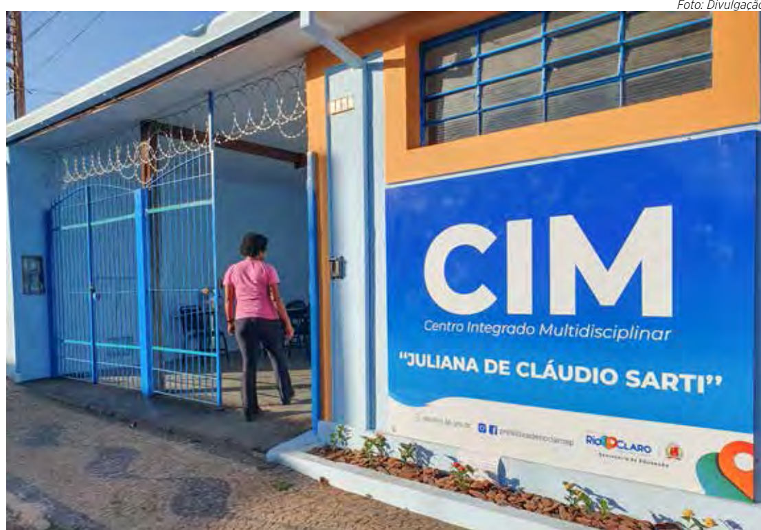
O Centro Integrado Multidisciplinar atenderá de segunda a sexta-feira, das 7 às 18 horas