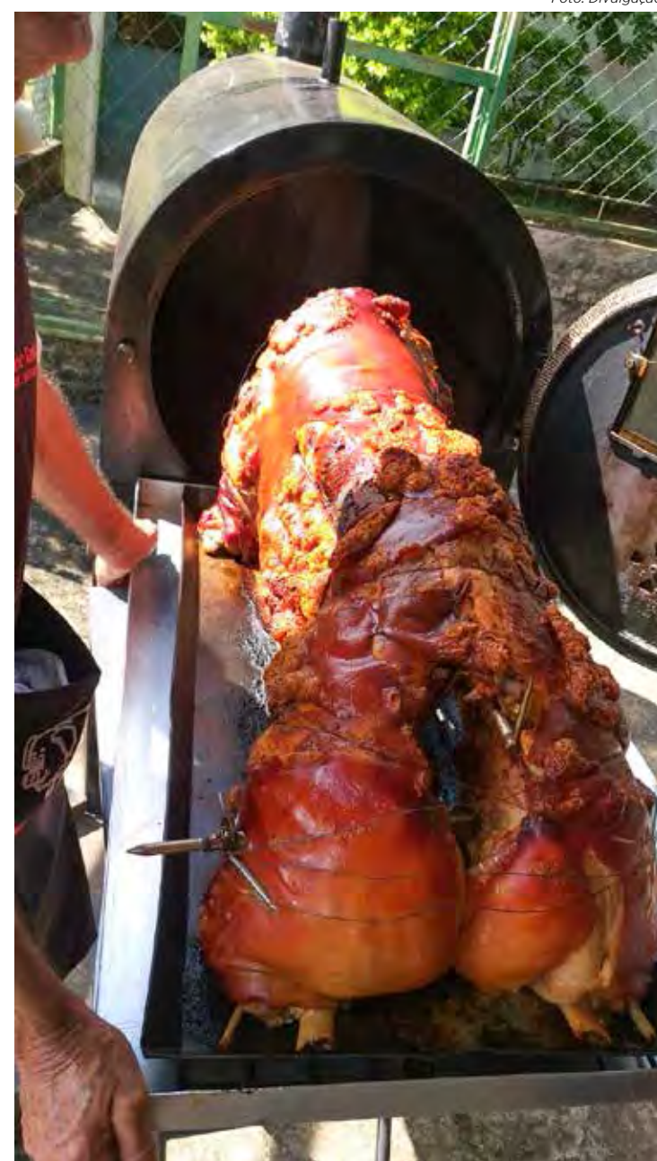
Porco na Fornoalha será no dia 27 de agosto no Santuário Boa Morte