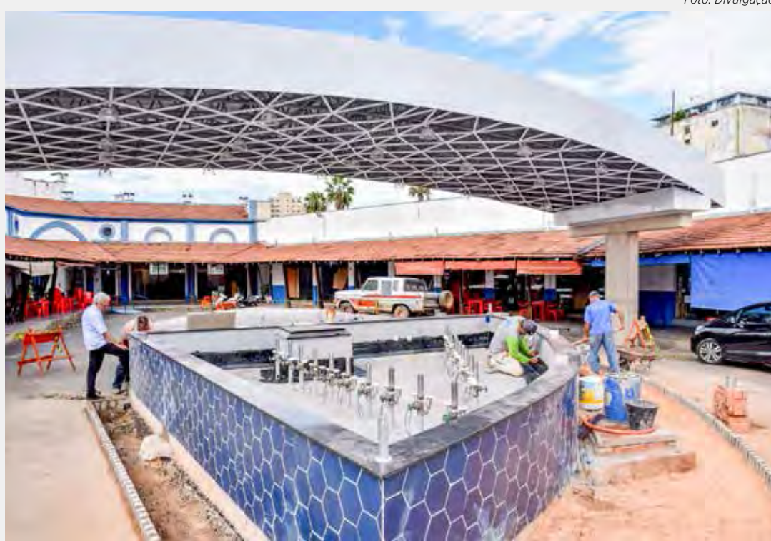
O projeto de revitalização é uma parceria da prefeitura com a iniciativa privada