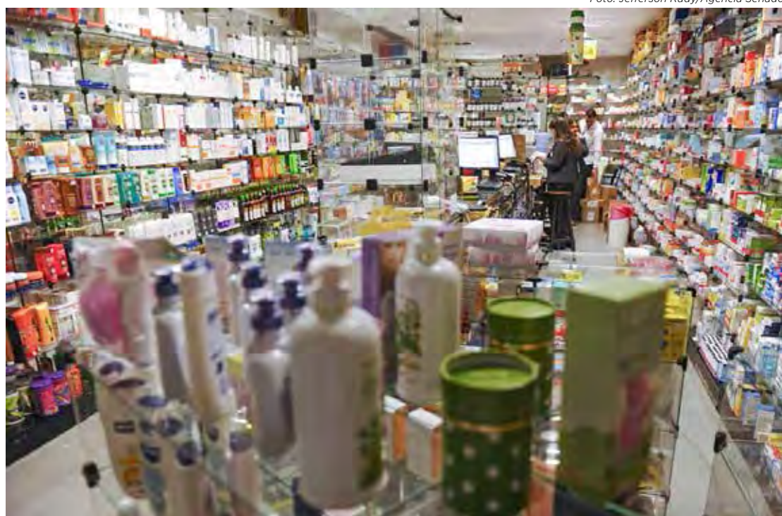
Farmácias podem realizar mais de 40 tipos de exames clínicos para triagem.

Todos os outros serviços de análise clínica, como exames de