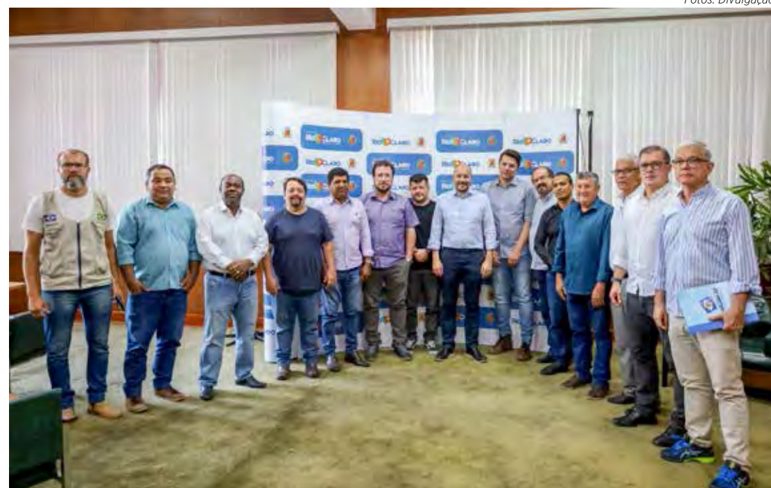
Prefeito Gustavo e vereadores receberam o secretário estadual, Rafael Benini, no paço municipal

deverá ser elaborado para que o governo estadual faça negociação, por intermédio da Artesp (Agência de Transportes do Estado de São Paulo), para que a concessionária Eixos-SP realize a obra, uma reivindicação antiga da comunidade. “O desafio maior é deixar o projeto num valor financeiro factível!”, disse Benini.