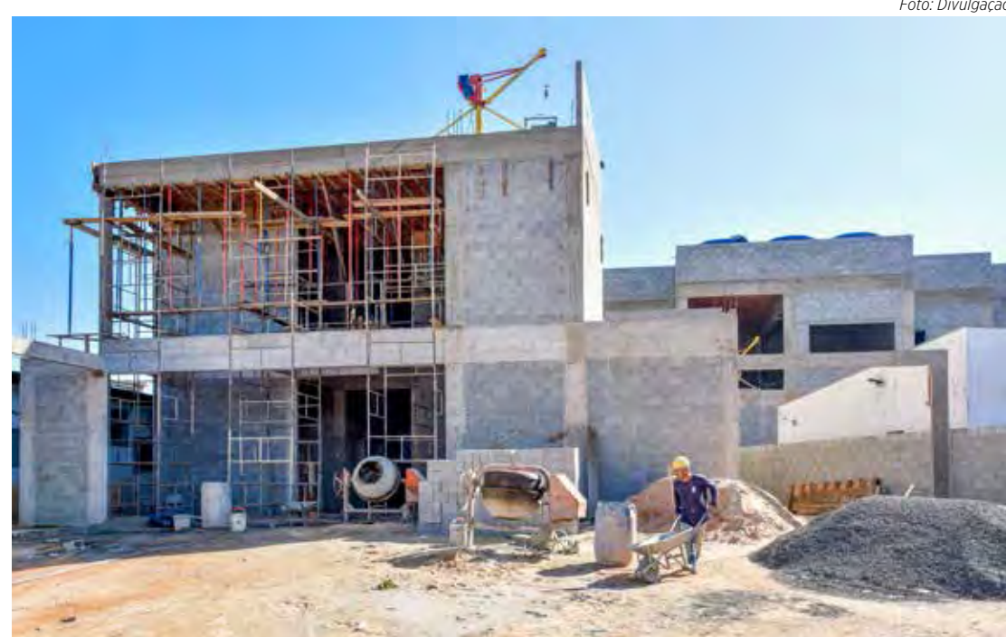
Hospital em construção no Cervezão contará com 60 leitos, incluindo enfermaria e UTI

O complexo de saúde da região norte terá ainda a unida-