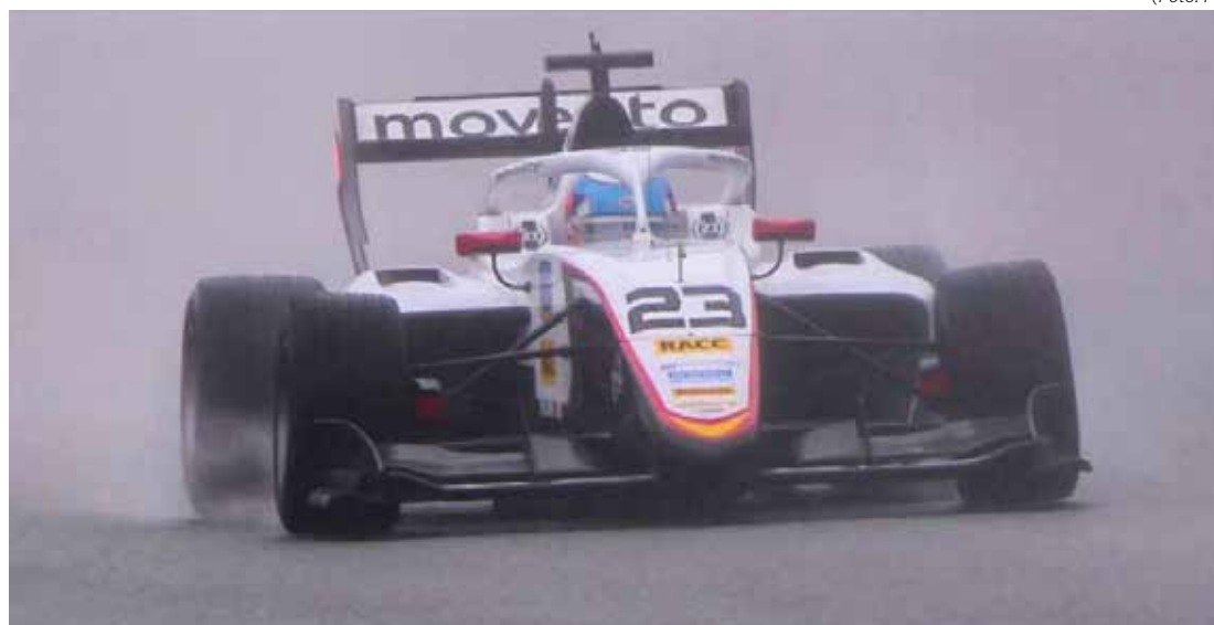
Chuva atrapalhou pilotos nesta sexta-feira na Bélgica