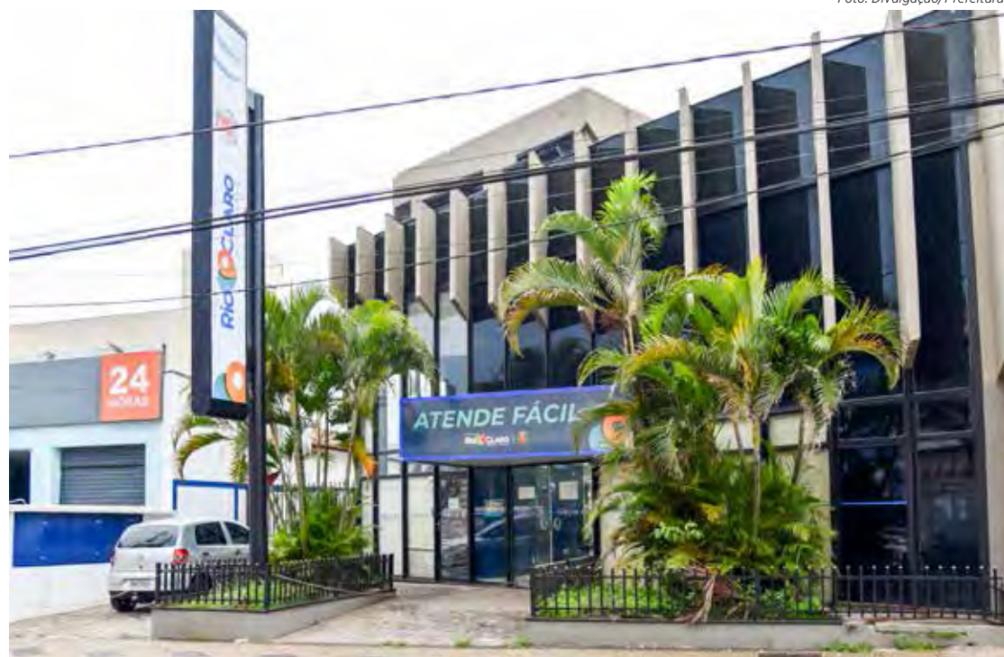
Fachada do Atende Fácil onde são protocolados os pedidos de adesão ao refinanciamento fiscal da prefeitura

No caso de pessoas jurídicas, os sócios, proprietários ou responsáveis legais devem estar munidos de cópia de contrato social, RG, CPF, comprovante de endereço ou ata de responsabilidade e, no Daae, também é preciso a apresentação do cartão de CNPJ.