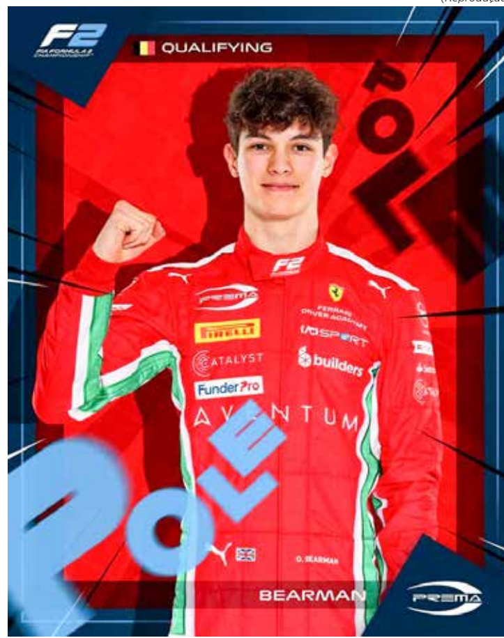
Piloto da Prema vai largar em primeiro em Spa-Francorchamps