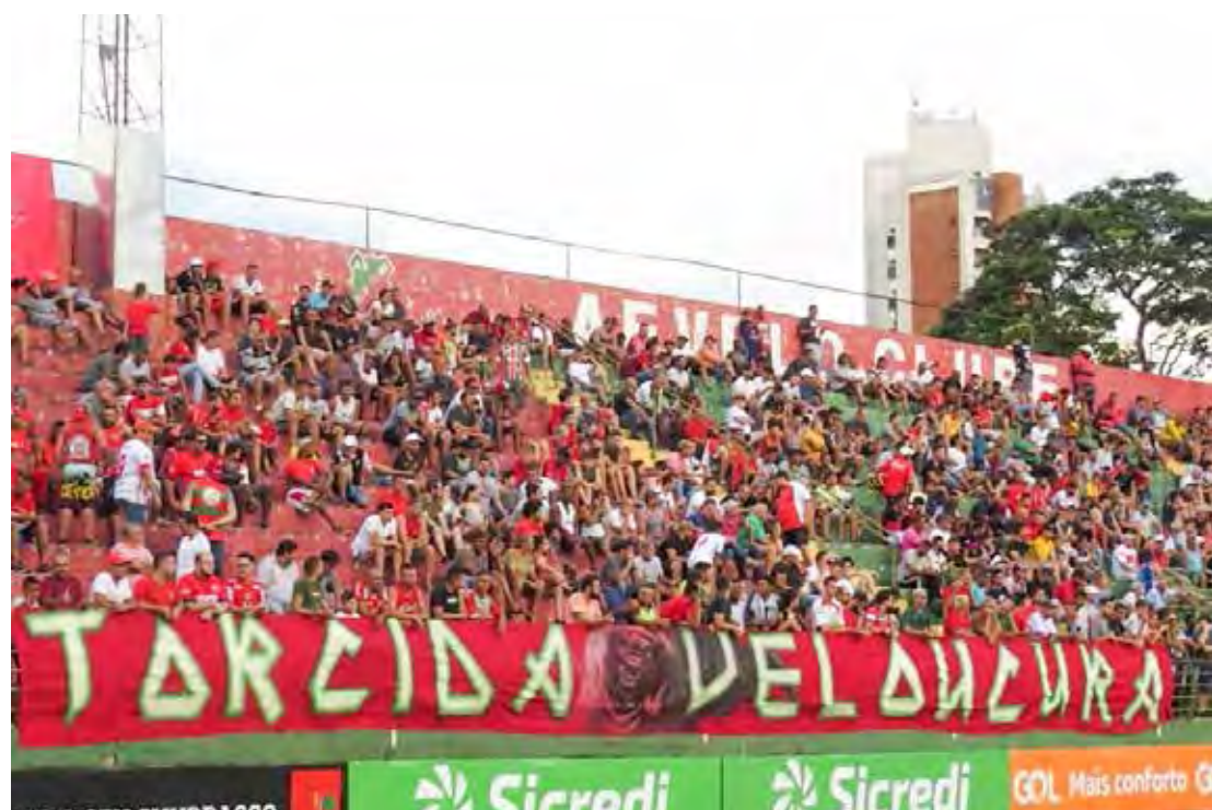
Jogo será às 15 horas, no Benitão