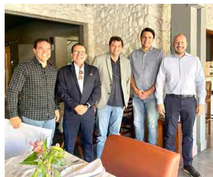
Secretário estadual também se reuniu com membros do Ciesp

pleiteou apoio do secretário para a construção de um viaduto na rodovia Rio Claro-Piracicaba na região do bairro Jardim Novo. “Seria uma alternativa para desafogar o trânsito no trevo da Viviani”, destacou. O projeto para esta obra já foi entregue à Artesp.