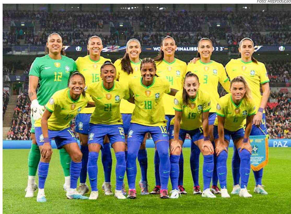
Brasil x França, às 07h00, pela Copa do Mundo Feminina