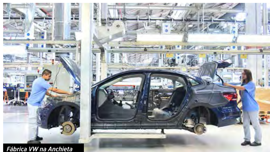
Fábrica VW na Anchieta