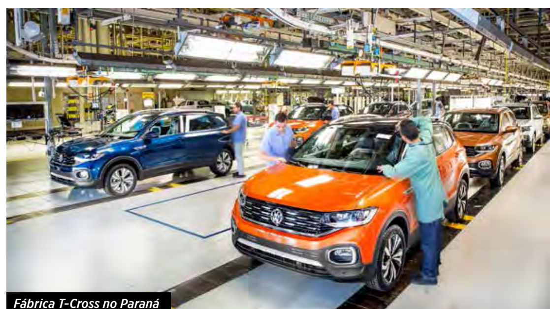
Fábrica T-Cross no Paraná