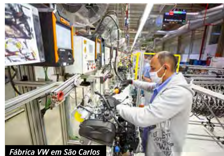
Fábrica VW em São Carlos