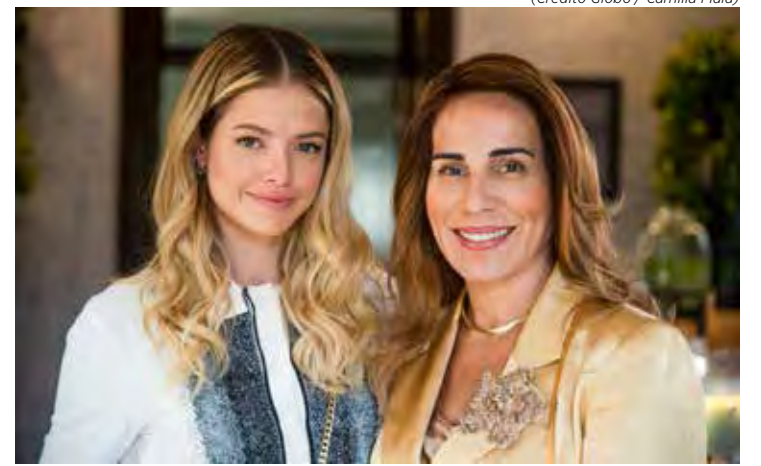
Agatha Moreira e Gloria Pires nos bastidores de “Terra e Paixão”