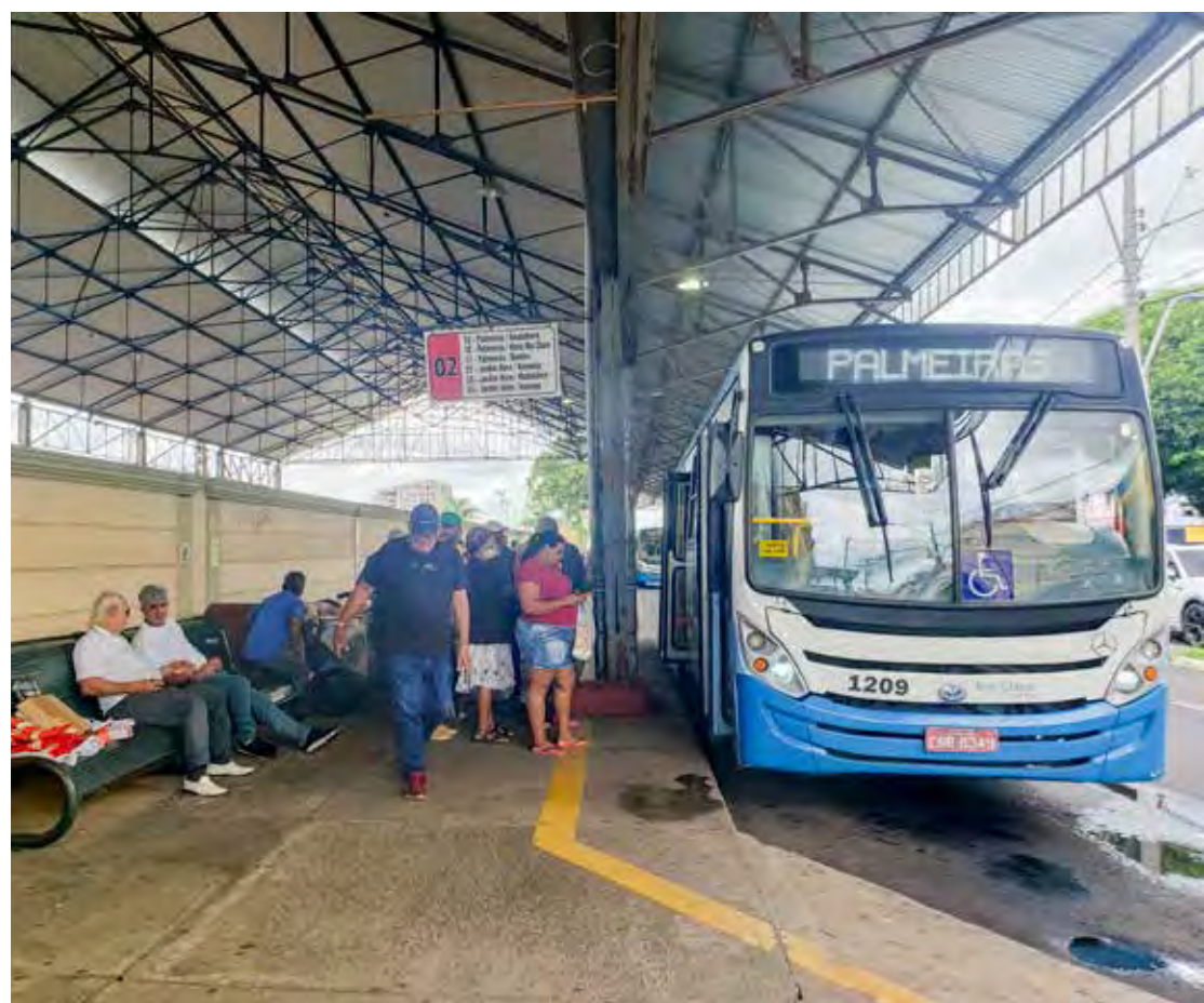
Terminal urbano de ônibus deverá receber melhorias que estão previstas no novo contrato do serviço

O novo contrato prevê ainda que a concessionária deverá reformar o terminal urbano de