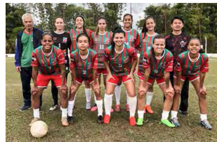
Equipe de futebol feminino de Rio Claro nos Jogos Regionais

meira, a qual, enfrentaria ontem (11). Caso tenha se saído vitoriosa, a equipe de futebol feminino de Rio Claro terá chegado à segunda final consecutiva dos Jogos Regionais. Vale destacar que, ano passado, o time de futebol feminino rioclarenses sagrou-se campeão invicto da disputa, com 5 vitórias e 1 empate.