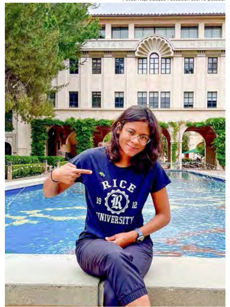
Cientista já ganhou vários prêmios por sua produção acadêmica

Opós-doutorado e a contratação como professora – Morando nos Estados Unidos desde 2016,