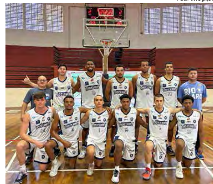
Basquete masculino de Rio Claro nos 65º Jogos Regionais