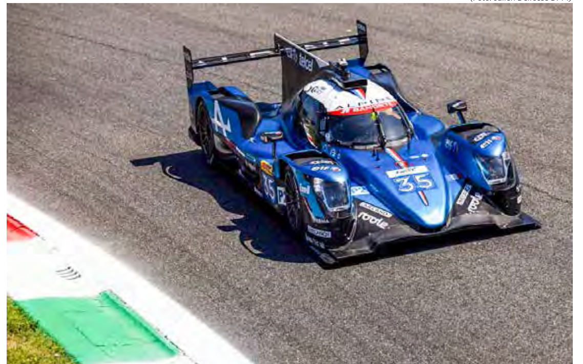
André Negrão em ação nas 6 Horas de Monza

A próxima etapa do WEC, as 6 Horas de Fuji, será realizada de 7 a 9 de setembro, no Japão.