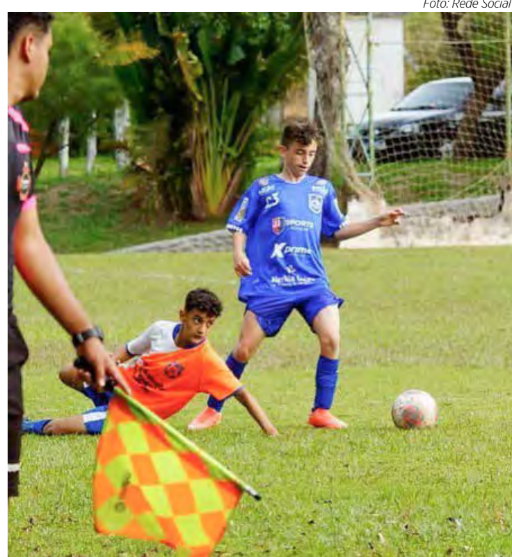
Rio Claro FC fatura título no Sub-13

Na classificação, o Sub-13 do Rio Claro FC é o 4º colocado do grupo 4, com 15 pontos ganhos, mas, apenas, 1 ponto atrás da líder Ferroviária que tem 16.