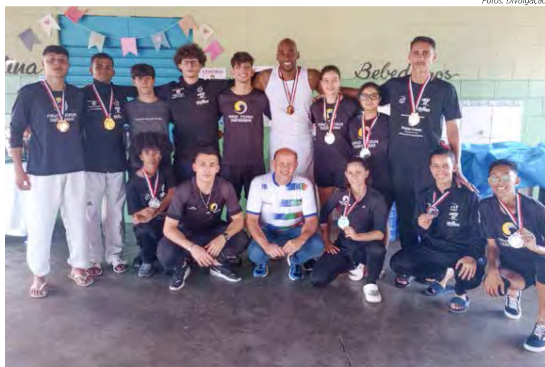
Equipe de Taekwondo rioclarense

para Limeira por 54 x 45. Na segunda rodada da bocha, derrota para Valinhos por 2 x 1. No sábado a equipe de Rio Claro venceu Tambaú por 2 x 1. No futebol feminino, empate em 1 x 1 com Campinas.