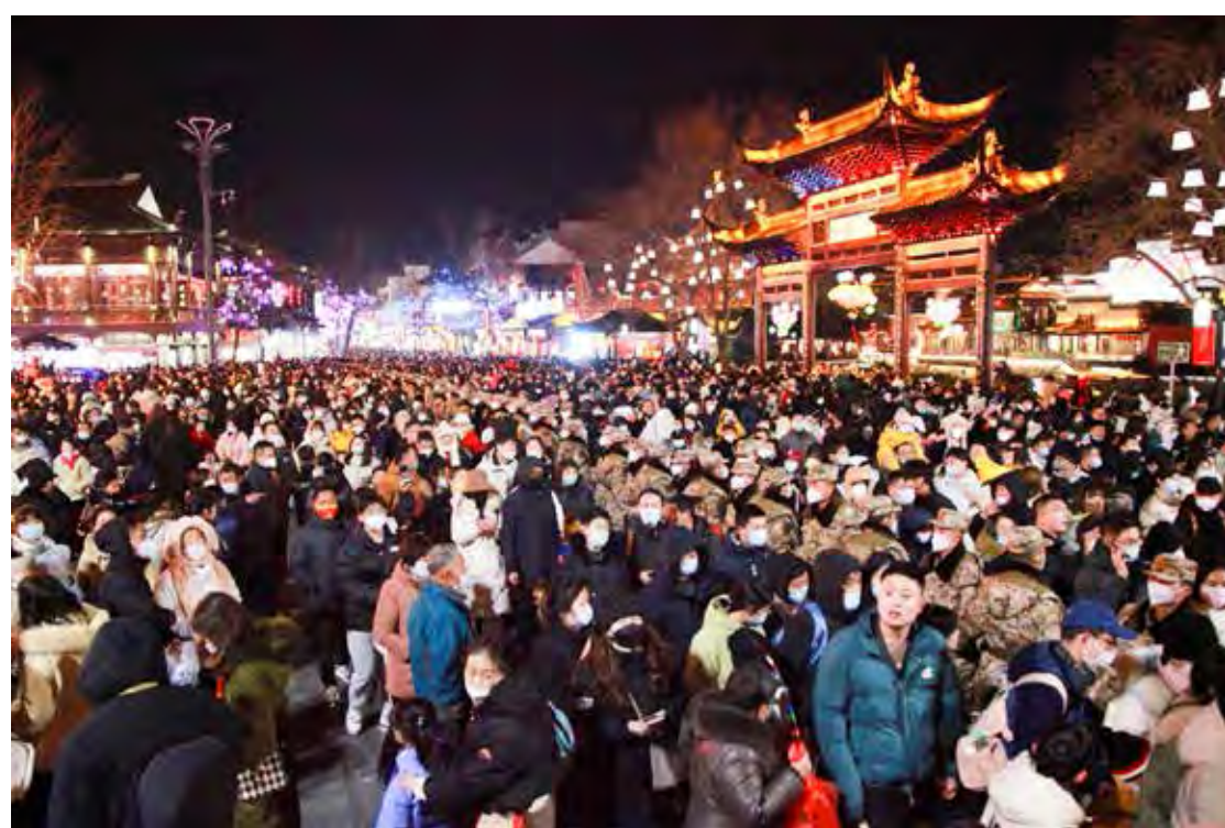
Segundo a ONU, a população da China é estimada em 1,425 bilhão

Quanto à distribuição da população mundial, a maior parte da população encontra-se na Ásia, com