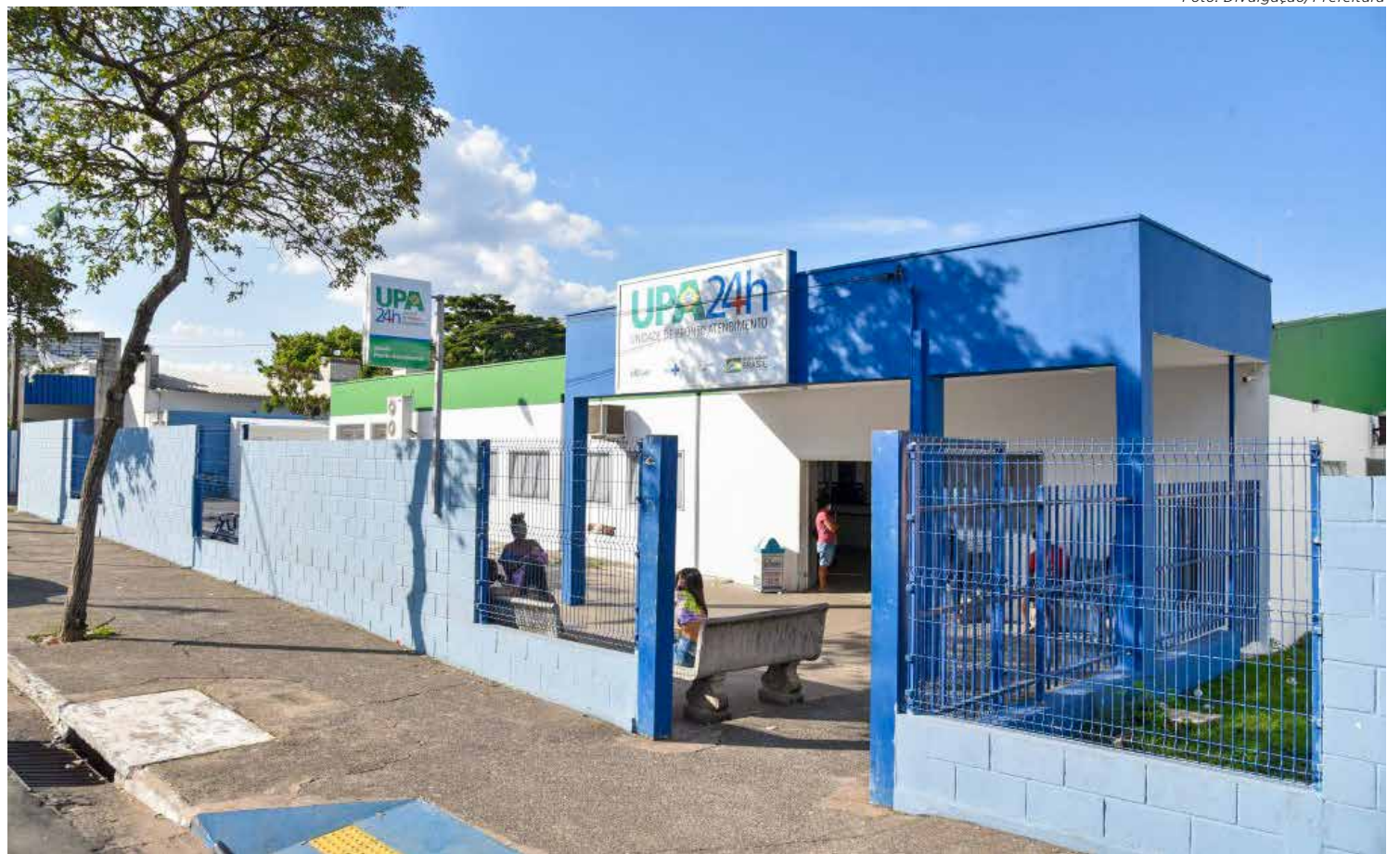
Fachada do prédio da UPA no Cervezão que será um dos equipamentos contemplados com calçadas com acessibilidade

Estão previstas ainda rampas de acessibilidade nas imediações das unidades de saúde: Avenida 29, Cervezão, Vila Cristina, Wenzel, Bela Vista, Benjamin de Castro, Boa Vista, Bonsucesso, Brasília, Aja-