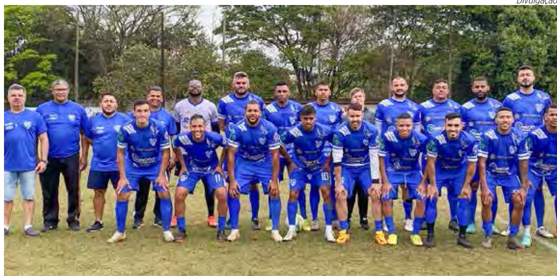
Time do Juventude FC que goleou o EC Paulistão por 5x1.