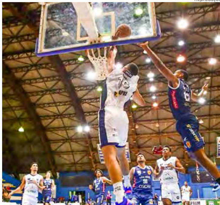
Rio Claro Basquete ficará ausente das quadras