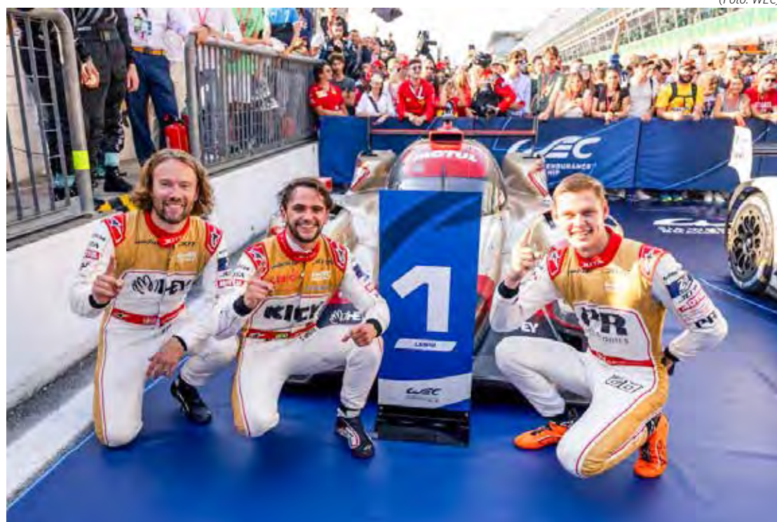
Brasileiro triunfa na Itália a bordo do JOTA de número 28