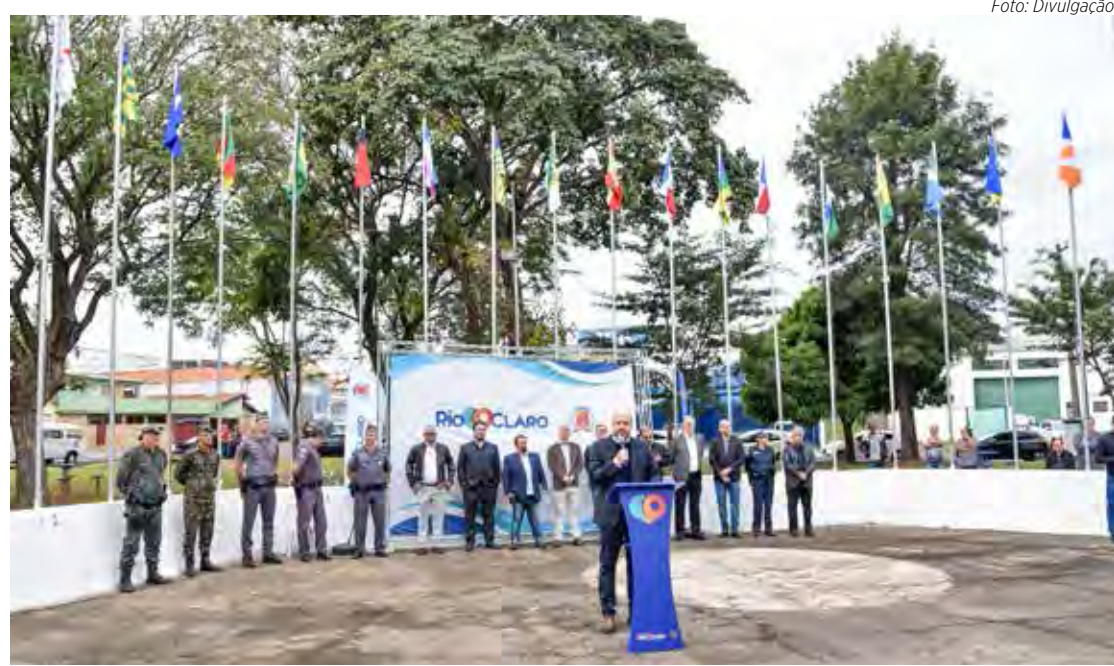
Evento em comemoração aos 91 anos da revolução constitucionalista foi realizado na Praça 21 Irmãos Amigos