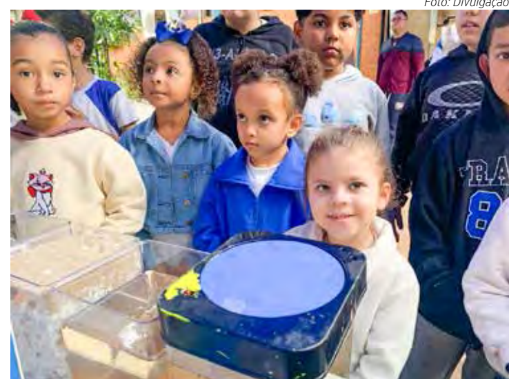
Os encontros foram embasados por palestras e oficinas práticas

Para falar sobre os rios de Rio Claro e a importância das matas ciliares, equipe da BRK representada