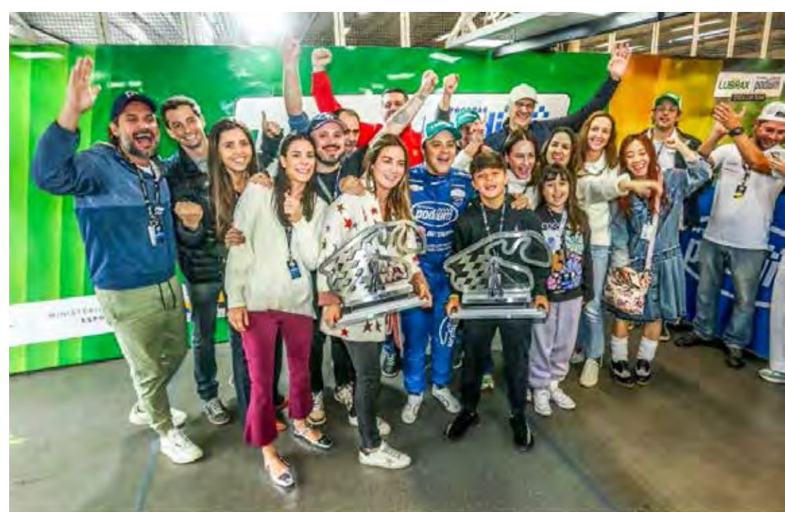
Felipe Massa comemorou com a equipe, familiares e fãs seu grande final de semana em Interlagos