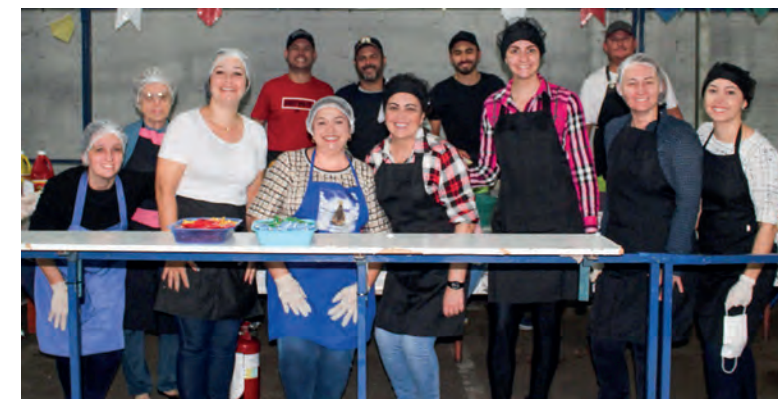
Voluntários da Barraca do Lanche de Pencil