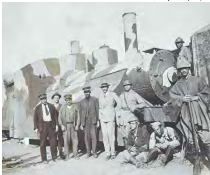
Trem Blindado 4 (TB4) construído nas oficinas locais da Cia Paulista