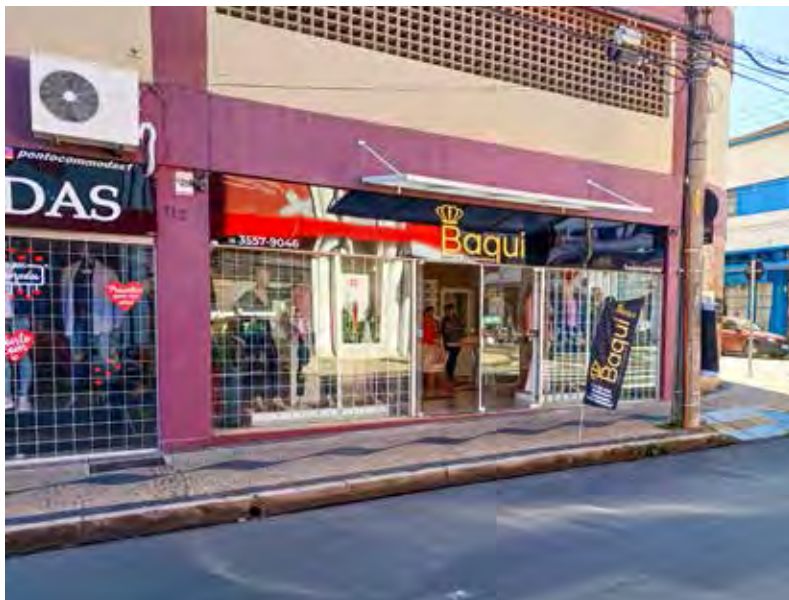
Baqui Modas, seu novo ponto para compor seu look de sucesso