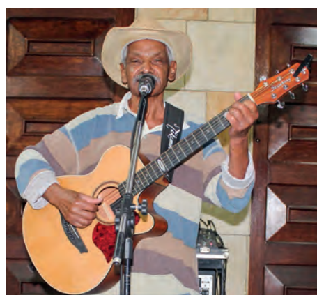
O cantor Gonçalves Araújo