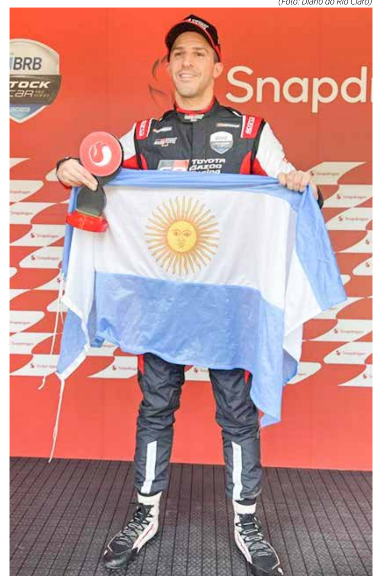
Argentino dominou todas as ações da etapa de Interlagos até agora