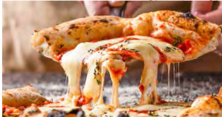
Napolitana da pizzaria na Mooca em São Paulo