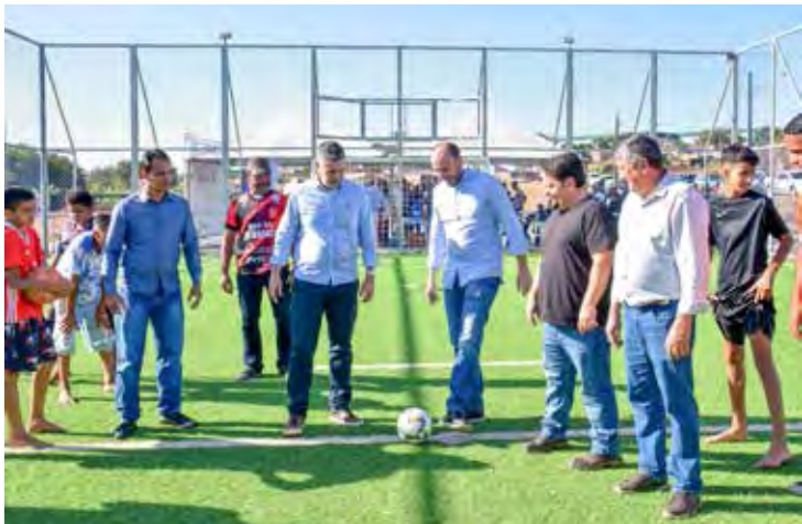
Inauguração da Arena Esportiva do Jardim Novo