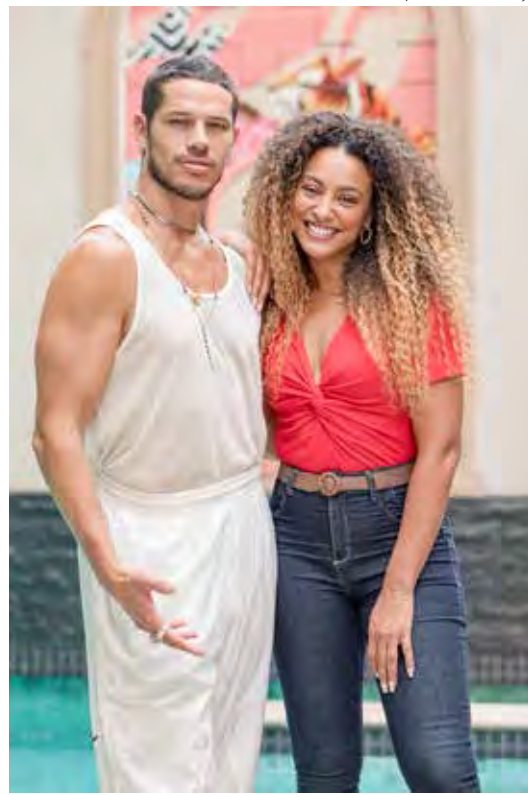
José Loreto e Sheron Menezes, estrelas de “Vai na Fé”

“Vai na Fé”, atual novela das sete da noite da Globo, caminha para suas últimas semanas de exibição. O último capítulo será apresentado no dia 11 de agosto, com a tradicional reprise no sábado, 12. Escrita por Rosane Svartman, cujo currículo na TV só reúne sucessos, a trama se mantém em alta desde o início e, para muitos, é a melhor novela da emissora em todos os horários. Vale lembrar que o projeto provocou uma grande expectativa logo no anúncio: seria protagonizado por uma evangélica e ex-dançarina de funk, Sol, personagem de Sheron Menezes. Uma batalhadora e “leoa” quando precisa defender a família. No decorrer dos capítulos, porém, a história enveredou por muitos outros temas que interessam ao público (jovem e adulto) e ganhou a audiência. Colocou em discussão o racismo, o relacionamento abusivo, traumas, lutos, descobertas, fragilidades, amores e lições valiosas, movimentando atores jovens (José Loreto, Mel Maia, Carolina Dieckmann, Samuel de Assis...) e experientes (Renata Sorrah, Zé Carlos Machado...). O detalhe é que, apesar de todo esse sucesso, “Vai na Fé” não foi capaz de mudar uma vírgula do processo de reorganização adotado pela Globo para conter gastos. A emissora já avisou que não vai renovar o contrato de ninguém que trabalhou no esquema “por obra certa”. E isso inclui atores e os roteiristas. Todos (exceto à autora titular) serão dispensados no fim deste mês.