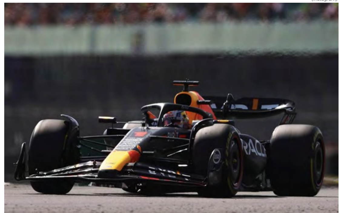
Líder do campeonato, piloto holandês largará em primeiro em Silverstone

Neste domingo, a largada está marcada para às 11h, com transmissão da Band.