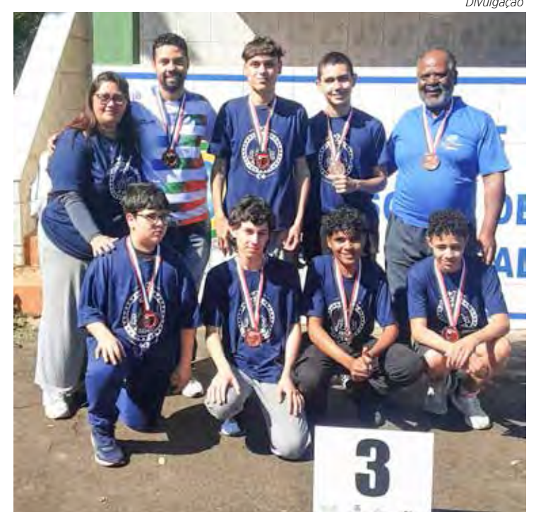
Rio Claro vai bem nos Jogos Regionais.

Vitórias para o vôlei sub-21 A equipe feminina enfrentou Leme e venceu a partida por 2 x 0, com parciais de 25/13 e 25/20. Com o resultado as meninas chegaram a segunda vitória seguida. Outra equipe que também está embalada é a do vôlei masculino sub-21. Pelo terceiro jogo seguido o resultado é vitória. Dessa vez, enfrentando Atibaia, Rio Claro venceu por 2 x 0, com parciais de 25/23 e 25/22.