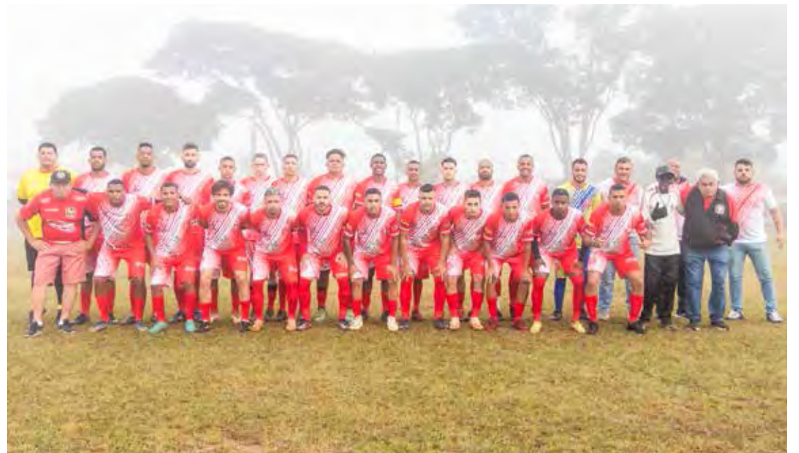
Time amador do IX de Julho FC que hoje comemora aniversário

Aniversário do IX de Julho FC O domingo será festivo também, para a coletividade do IX de