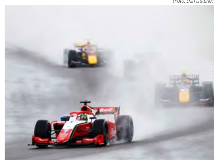
Frederik Vesti venceu corrida sprint da F2 em Silverstone na temporada 2023

A corrida 2 tem largada às 05:55 hs deste domingo, com transmissão pela BandSport.