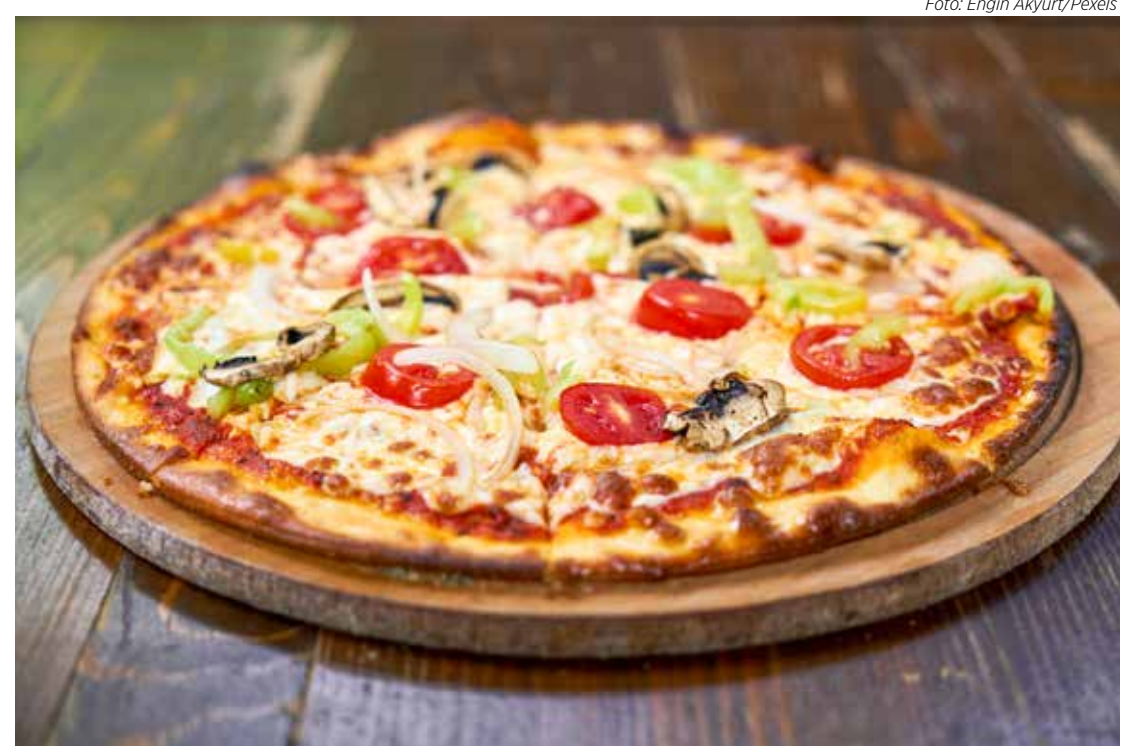
A pizza chegou ao Brasil no início do século 20 e virou uma paixão nacional