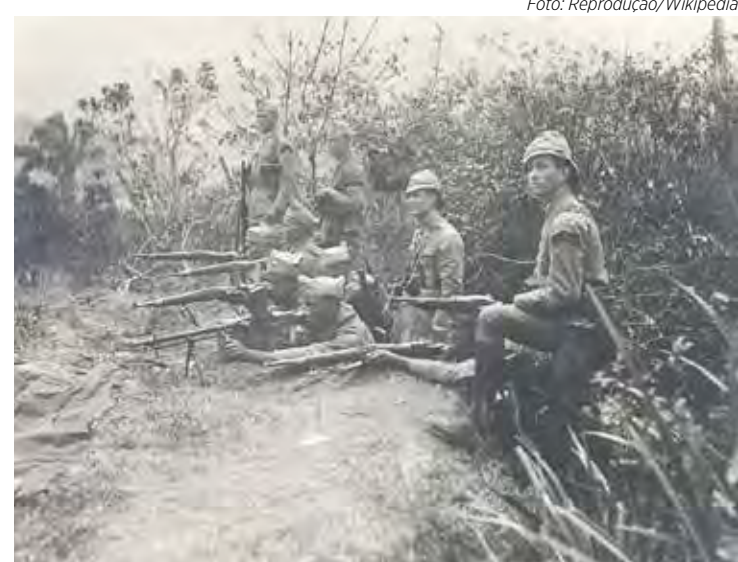
Soldados federais no Vale do Paraíba

Desde 5 de março de 1997, o dia de 9 de julho é feriado estadual em São Paulo. Assim, os paulistas têm o feriado cívico para refrescar a lembrança da Revolução Constitucionalista de 32. O município de Rio Claro sempre realiza ato cívico em comemoração à Revolução Constitucionalista de 1932