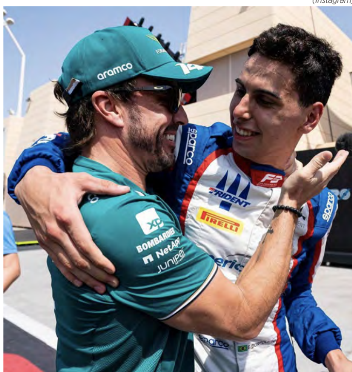
Gabriel Bortoleto, na foto com seu padrinho Fernando Alonso, teve mais um brilhante desempenho na F3

A corrida que fecha a sexta etapa da temporada 2023 da Fórmula 3 será disputada neste domingo (9), a partir das 4h20.