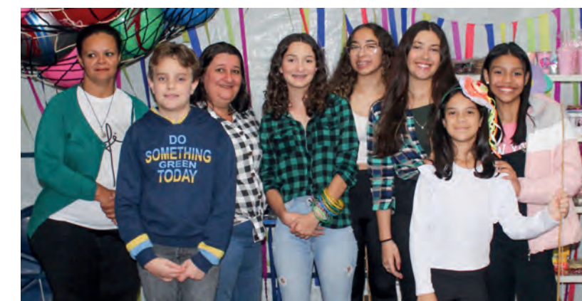
Voluntários da Barraca da Argola e Pescaria