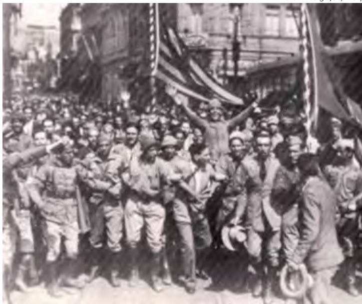
Manifestantes nas ruas de São Paulo