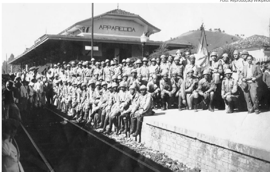
Voluntários na Estação de Aparecida à espera do embarque para o fronte

e em memória aos soldados que lutaram na batalha, e neste ano não será diferente. O evento será realizado neste domingo (9), às 9 horas, na Praça 21 Irmãos Amigos, localizada na Rua 19 com Avenida 7, no Jardim Claret.