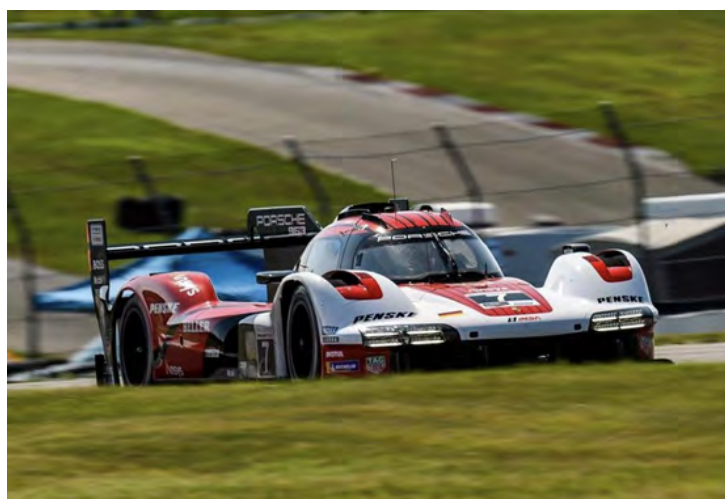
Com brasileiro na equipe, Porsche Penske tem objetivos ambiciosos para a sexta rodada do IMSA

A Porsche Penske Motorsport enfrenta a prova com dois protótipos híbridos na categoria GTP. A equipe cliente JD-C-Miller MotorSports executa outro protótipo Porsche idêntico. Nas duas classes GTD, quatro equipes parceiras competirão com um total de cinco carros Porsche 911 GT3 R.