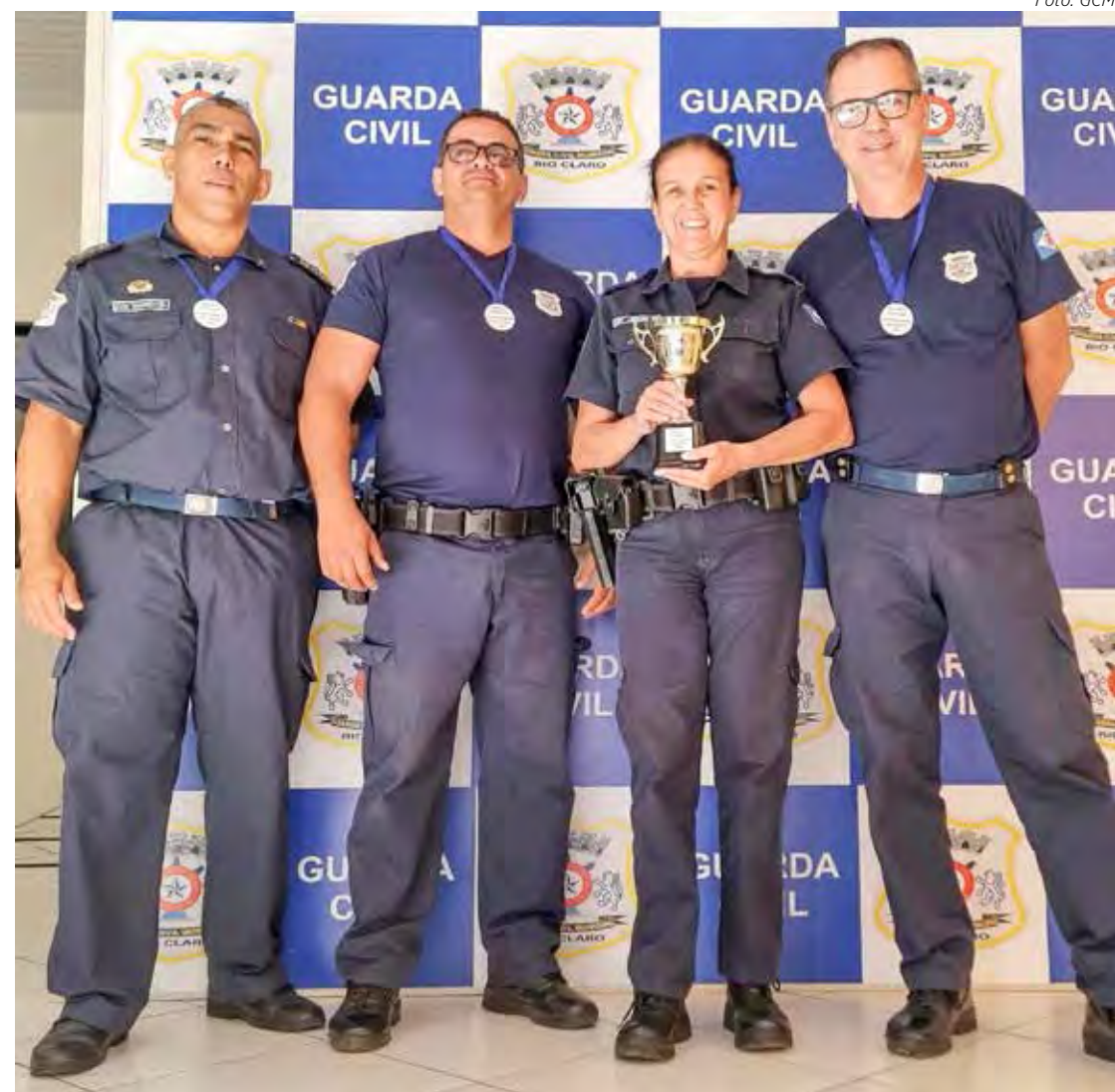
Torneio aconteceu nesta semana