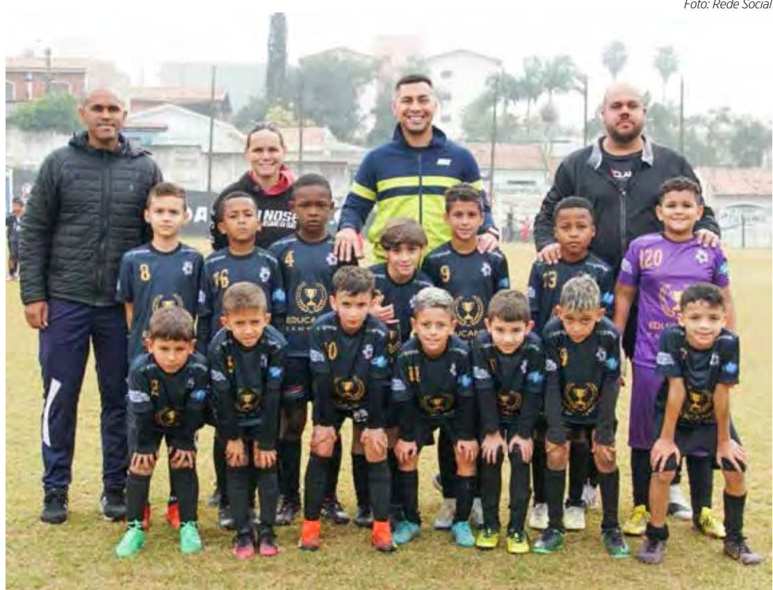
Projeto Educando Campeões disputa Torneio Iniciação

Sub-13 (Grupo B) Campo do Cidade Nova: 09h30 – Sal da Terra x Showbol