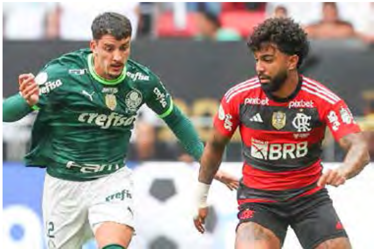
Palmeiras x Flamengo, às 21 h, Brasileirão