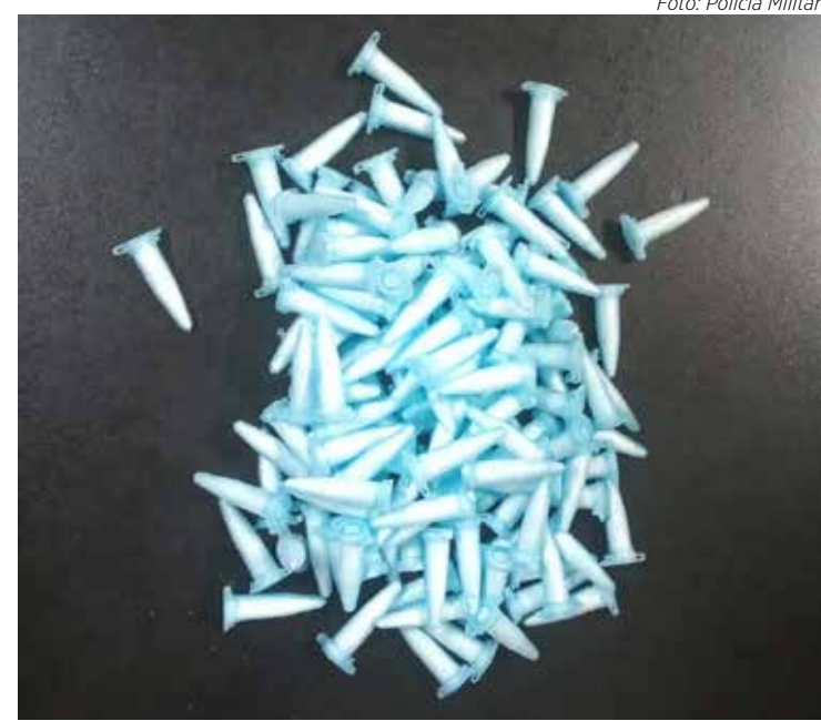
Caso aconteceu no bairro Parque São Jorge

Ao ser indagado, o abordado confessou que estava na prática de tráfico de drogas pelo local. A ocorrência foi apresentada no Plantão Policial onde o infrator da lei permaneceu à disposição da Justiça.