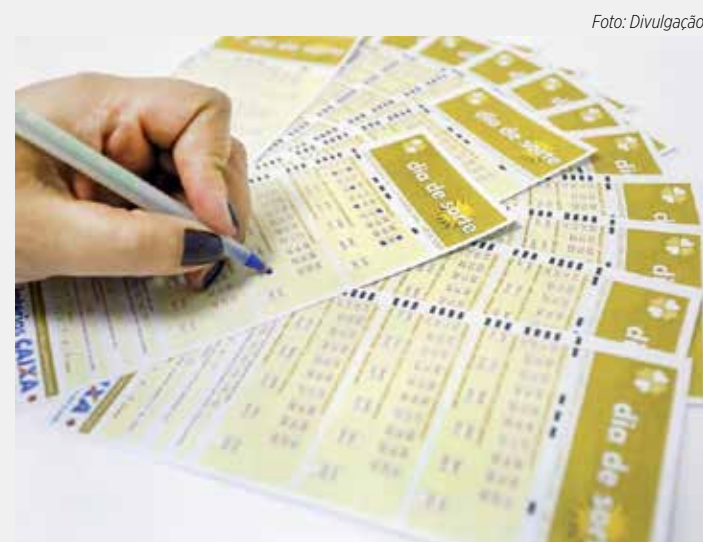
Prêmio principal saiu para Aparecida de Goiânia

Apostas de Araras, Descalvado, Leme, Pirassununga, São Carlos, São José do Rio Pardo acertaram 14 das 15 dezenas no concurso 2.856 da Lotofácil, sorteada na quinta-feira, e ganharam R$ 1,1 mil cada.