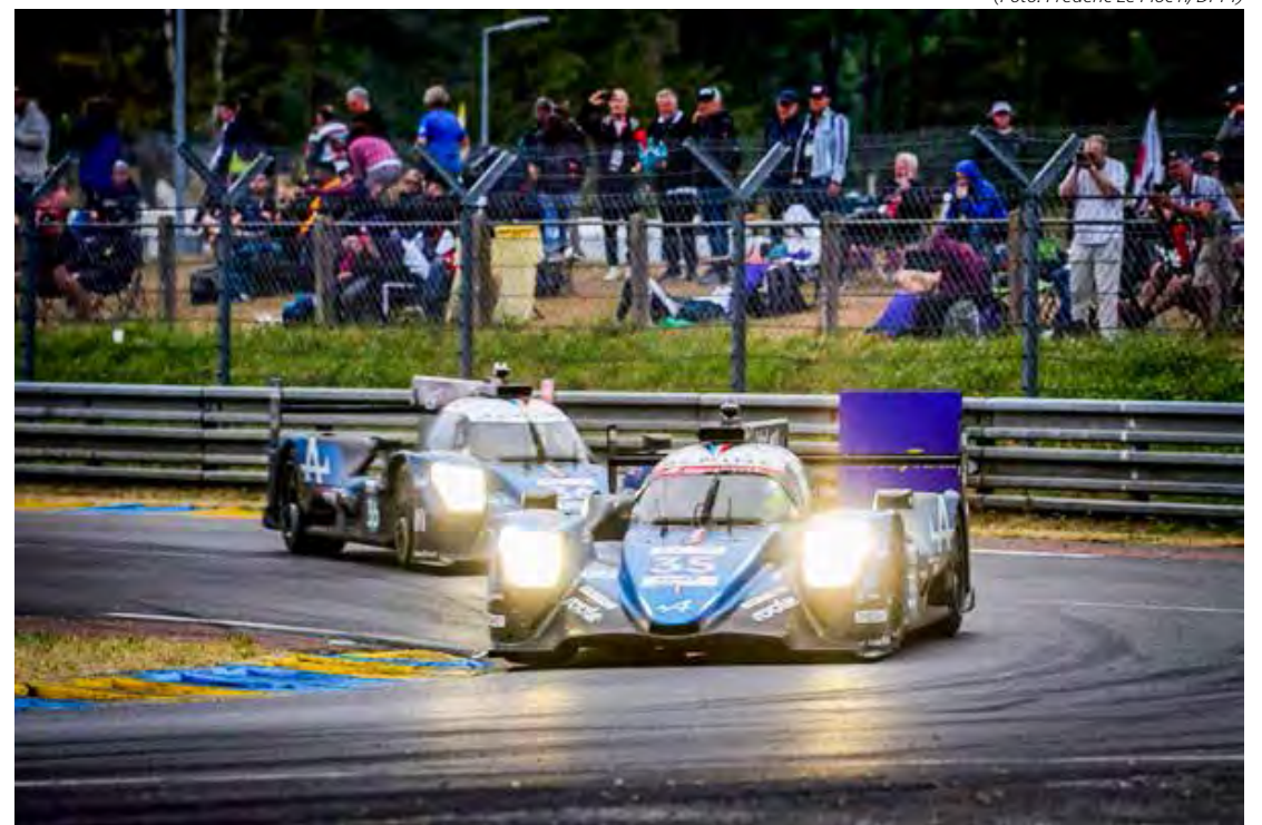
André Negrão tem boas expectativas para Monza