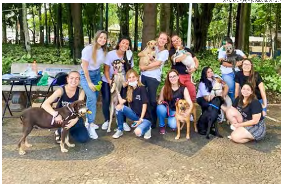
Equipe da ONG Anjos do Focinho em feita de adoção realizada no Jardim Público

"Atuamos com resgate de animais vítimas em vulnerabilidade ou machucados, e os custos dos cuidados médicos, principal-