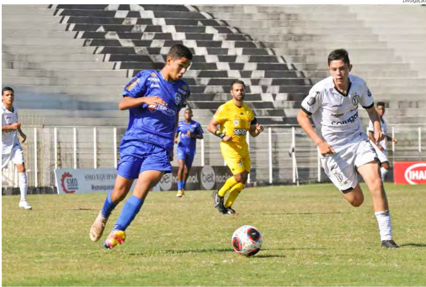
Rio Claro FC enfrenta SKA Brasil, pelo Sub-17