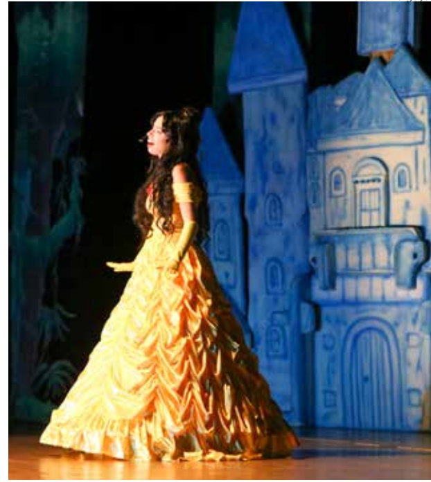
A peça “A Bela e a Fera” também será encenada