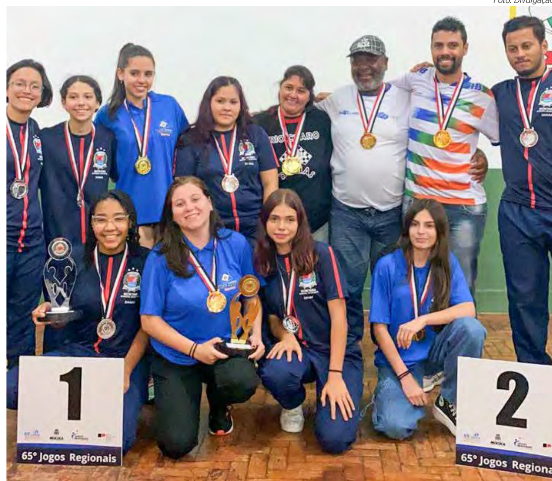
Equipe de damas de Rio Claro faturou ouro nos Regionais

As equipes de vôlei masculino e feminino de Rio Claro estrearam na competição com derrotas. As meninas perderam por 2 x 0 para Vinhedo, parciais de 25/7 e 25/14. No vôlei masculino sub-21 a derrota foi para Hortolândia e por 2 x 1, parciais de 22/25, 25/19 e 18/16.