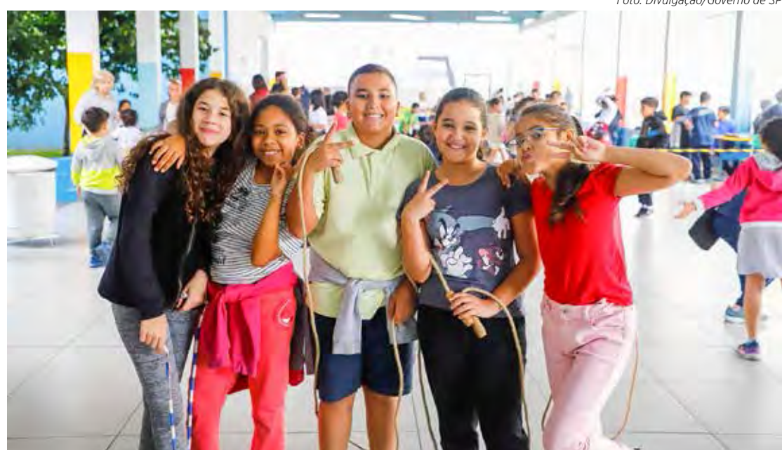
Alunos das escolas estaduais ficarão de férias até o dia 24 de julho

O ano letivo de 2023 na rede estadual começou em 3 de fevereiro. As férias de julho vão de 3 a 27. O dia 24 de julho será destinado ao replanejamento com início do segundo semestre no dia 25. O encerramento do ano letivo está previsto para 15 de dezembro.