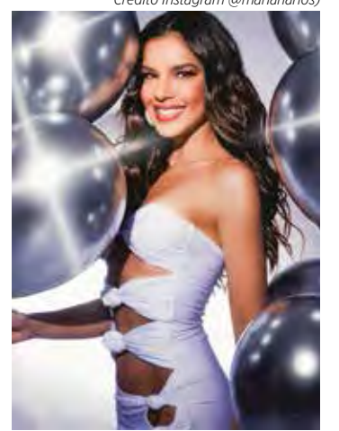
Mariana Rios, apresentadora de reality "A Grande Conquista"

Esta é a parte I de um assunto, que precisa ser colocado e ainda será desenvolvido nos próximos dias.