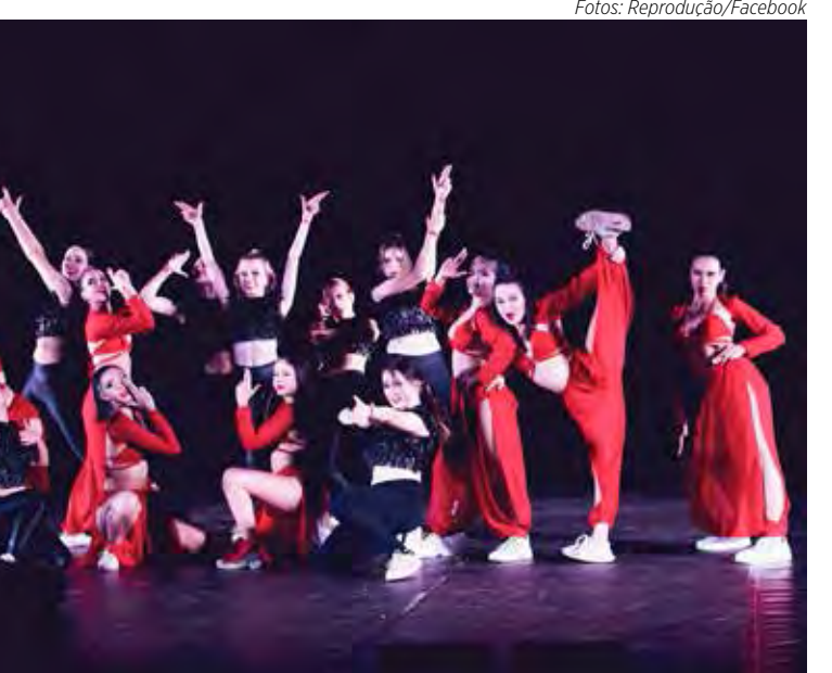
2ª Mostra de Dança de Santa Gertrudes terá diversidade de apresentações