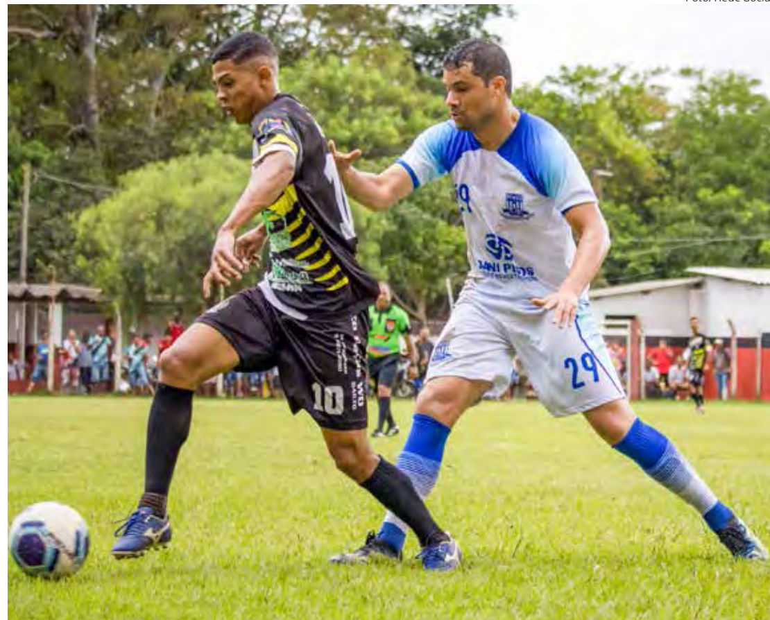
Bola rolou também na Série B do Amadorzão