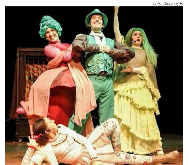
Musical infantil será apresentado no próximo dia 15 de julho no Sesi

“O Canto das Vitaminas”, 15/07, no teatro do Sesi Rio Claro (Avenida M-29, 441, no