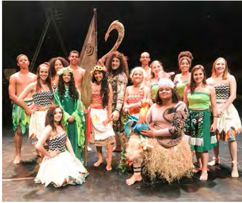
O espetáculo infantil “Uma aventura em alto-mar” é uma das atrações na programação do shopping

Já as oficinas infantis serão realizadas aos domingos (dias 9, 16, 23 e 30 de julho), próximo