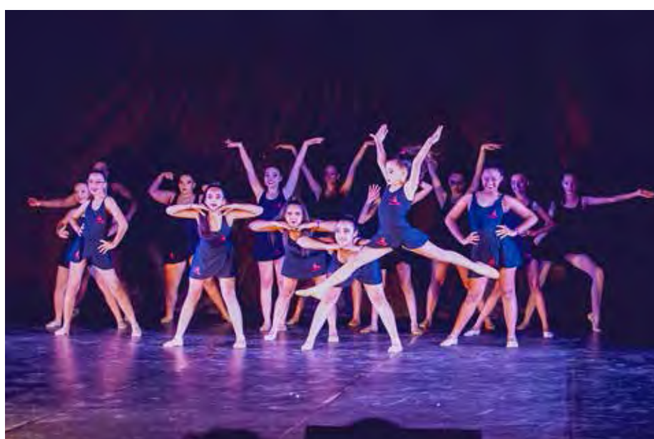
Ao todo serão 17 academias e grupos de dança e 44 coreografias

A mostra tem por objetivo proporcionar um espaço onde as academias e grupos da cidade e região possam apresentar suas coreografias, além de incentivar o desenvolvimento da dança como parte importante na formação artística de crianças, jovens e adultos.