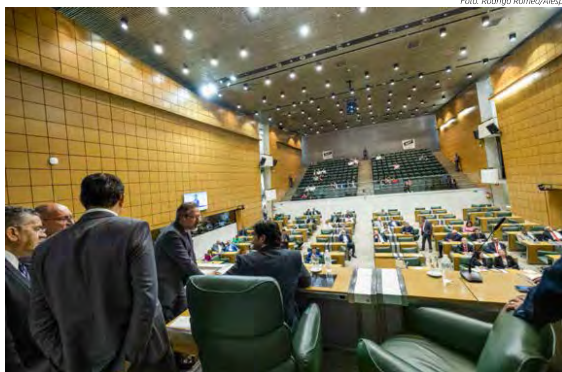
O projeto da LDO 2024 do governo estadual foi aprovado na última quarta-feira (28) em sessão na Alesp

O projeto da LDO elaborado pelo executivo estadual foi aprovado com acréscimo de 243 emendas parlamentares incluídas pelos deputados foram acatadas, na forma de 16 subemendas apresentadas pelo relator. Agora, o projeto segue para sanção do Executivo e, após ser sancionado, será convertido na