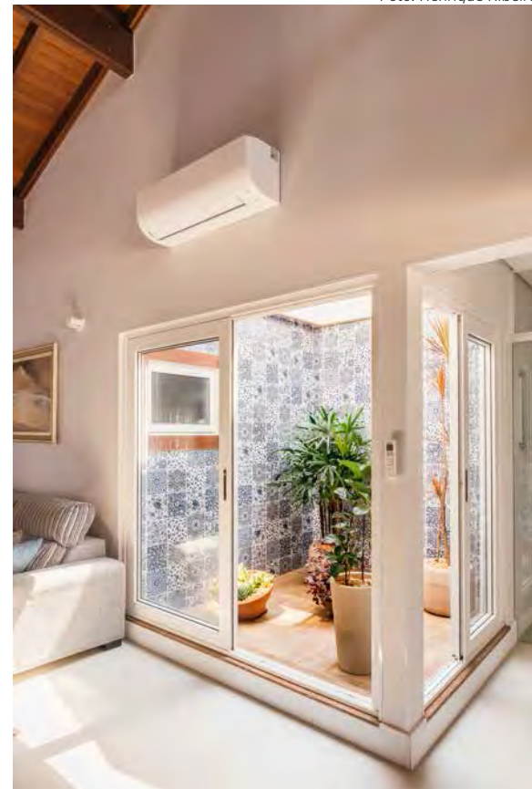
Em um jardim de inverno, as espécies são benéficas na filtragem do ar e podem propiciar efeitos calmantes e relaxantes