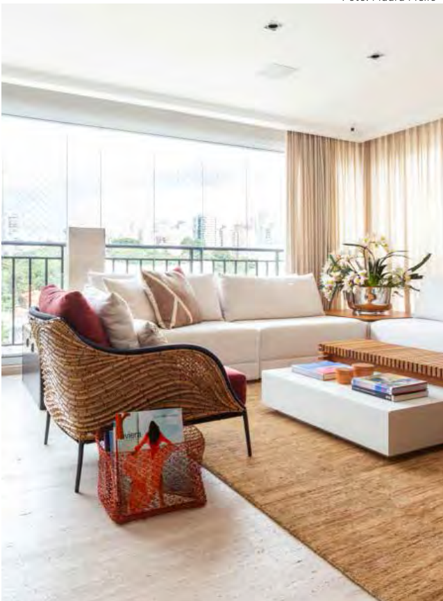
O contraste de tons claros e terrosos permeia o living desse apartamento assinado