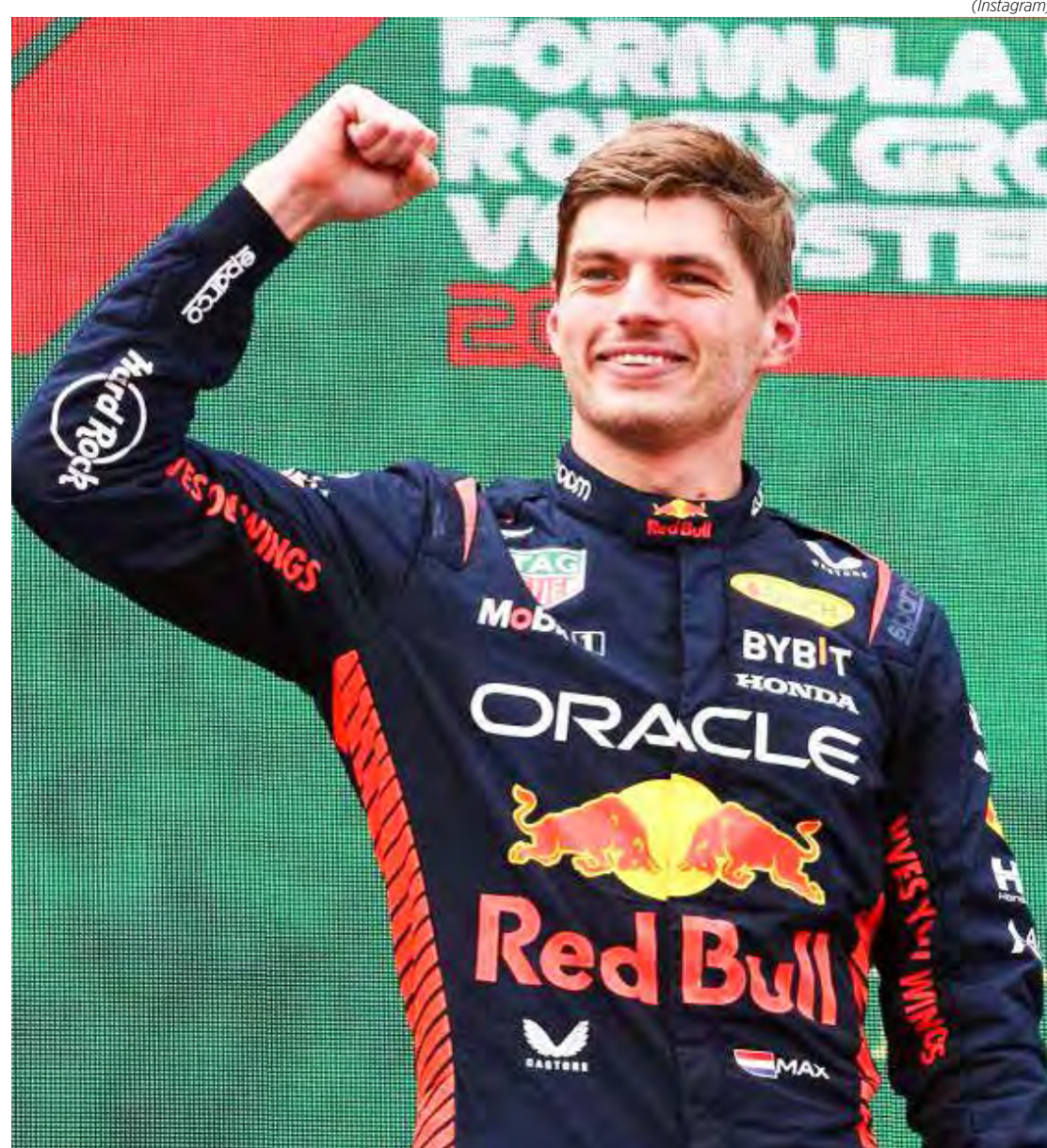
Max Verstappen venceu o GP da Áustria e disparou na classificação

A próxima etapa está marcada para acontecer já no final da semana, entre 7 e 9 de julho, com o GP da Inglaterra.