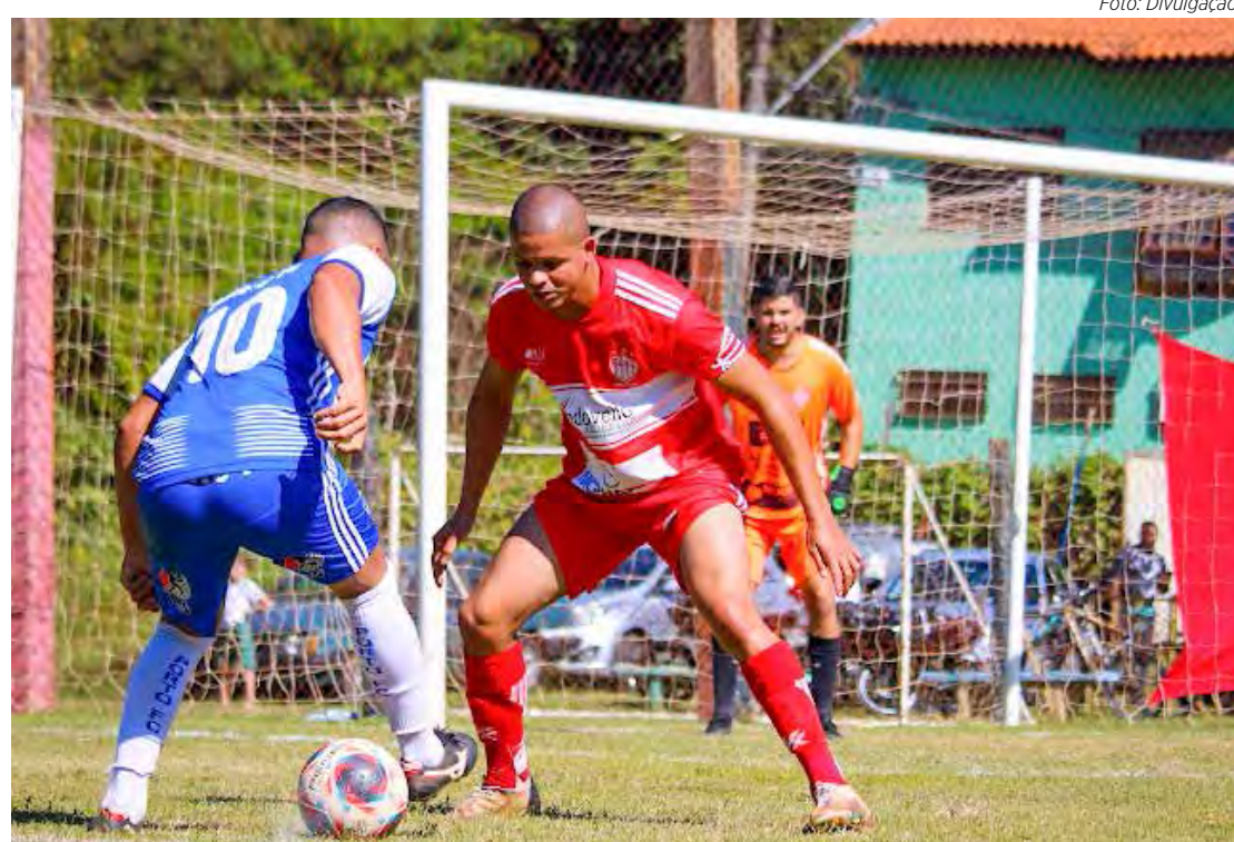
Amadorzão Série A começou domingo

A 2ª. rodada do Amadorzão 2023, já tem os confrontos definidos: AA Santa Maria x Família Santa Maria, AA Boa Vista x AA Santana, EC Vasco da Gama x IX de Julho FC, Cidade Nova FC x Porto FC, Unidos EC x CA Juventus, Juventude FC x EC Paulistão, EC Panorama x Jardim Novo FC, EC Novo Wenzel x Vila Olinda FC, Corumbataí FC x Família CVZ FC.