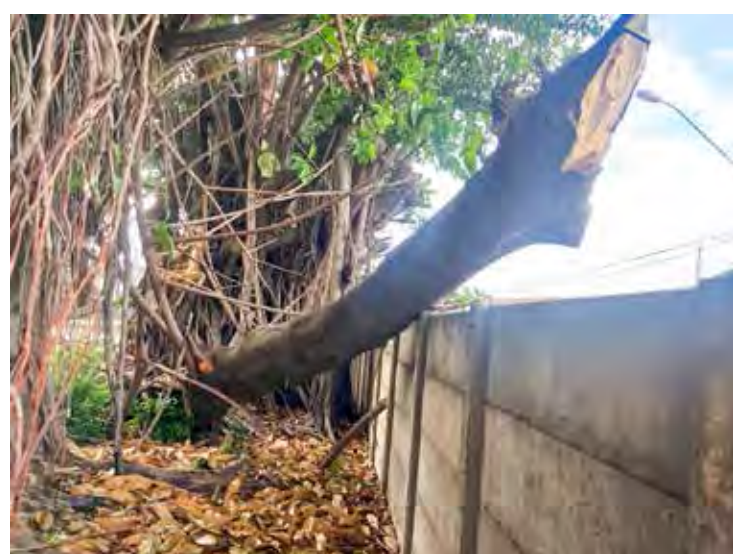
Galho enorme e pesado oferece risco

A melhor colocação da seleção brasileira feminina de futebol em mundiais foram o vice-campeonato em 2007 e o 3º. lugar em 1999.