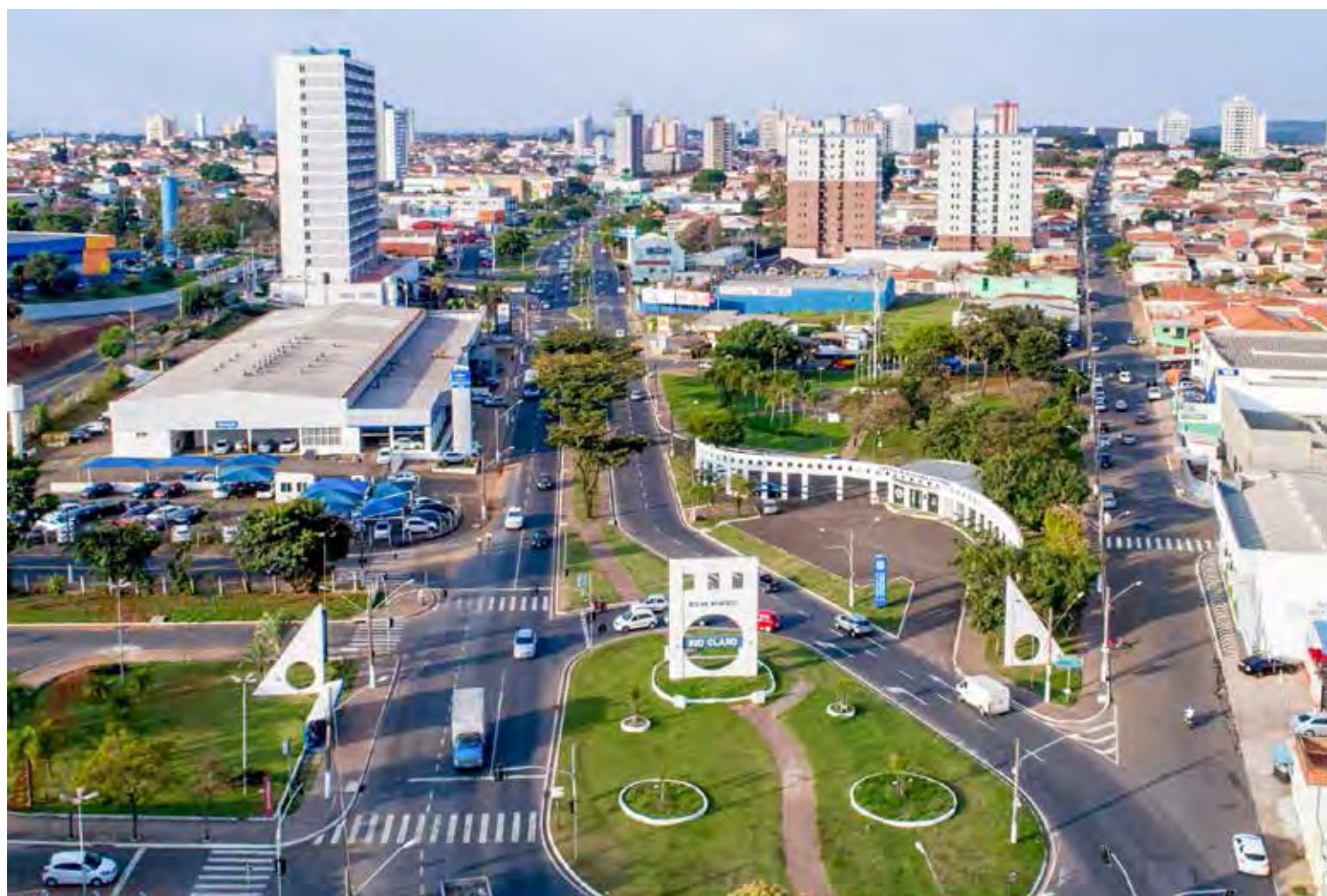
Vista aérea de Rio Claro cuja população cresceu 8,14% entre 2010 e 2022

O município de Araras aumentou de 118.843 para 130.866, o total de pessoas, alta de 10,12%. Em Cordeirópolis,