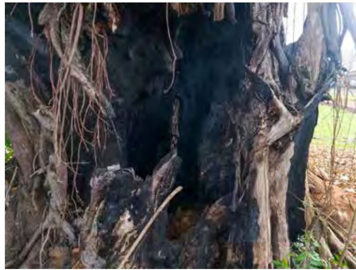
Tronco tem buraco considerável na sua base