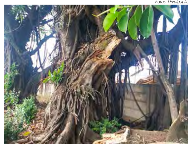
Situação da árvore é precária