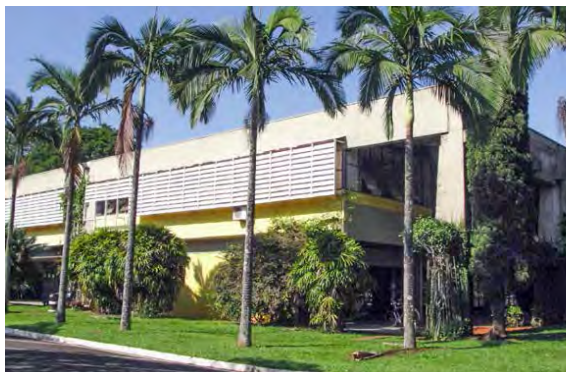
Um dos espaços do campus da Unesp em Rio Claro – nova alternativa para acessar as vagas desta e de outras instituições públicas de renome do estado

Mais que o incentivo à entrada no ensino superior, a ação servirá diretamente como combate ao abandono e evasão do ensino médio. No próximo ano, será utilizada uma nota acumulada das provas feitas na segunda e terceira séries do ensino médio. A partir de 2025, serão consideradas as avaliações nas três séries.