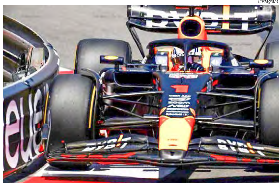
Atual bicampeão do mundo confirmou a 26ª pole da carreira