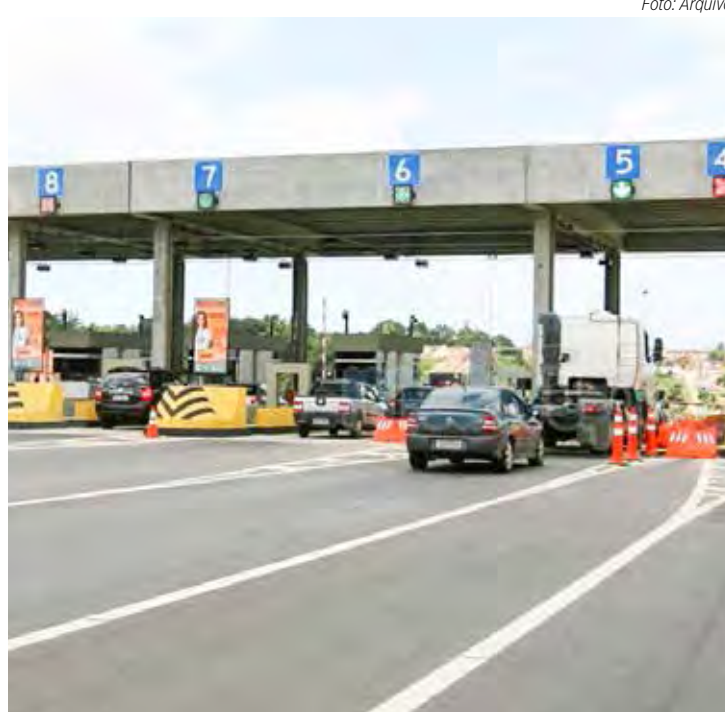
Motoristas devem ficar atentos aos novos valores a partir deste sábado

Vale ressaltar que a multa por evasão de pedágio é de R$ 195, 23. Infração grave, com cinco pontos na carteira. Câmeras de monitoramento têm ajudado a polícia a identificar os infratores.