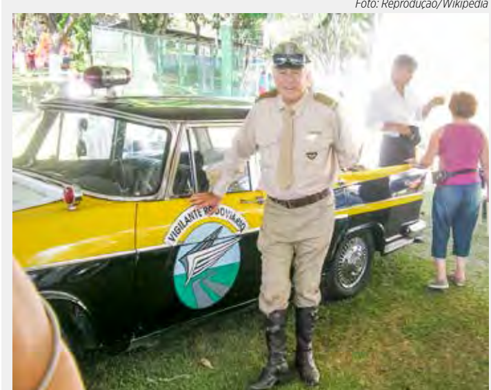
A 31ª edição do Encontro de Veículos Antigos de Rio Claro traz como destaque o eterno Vigilante Rodoviário

Realizado pelo Antigo Auto Clube de Rio Claro, o evento tem apoio da prefeitura de Rio Claro, Claretiano Rede de Educação e Roncoli Auto Peças.