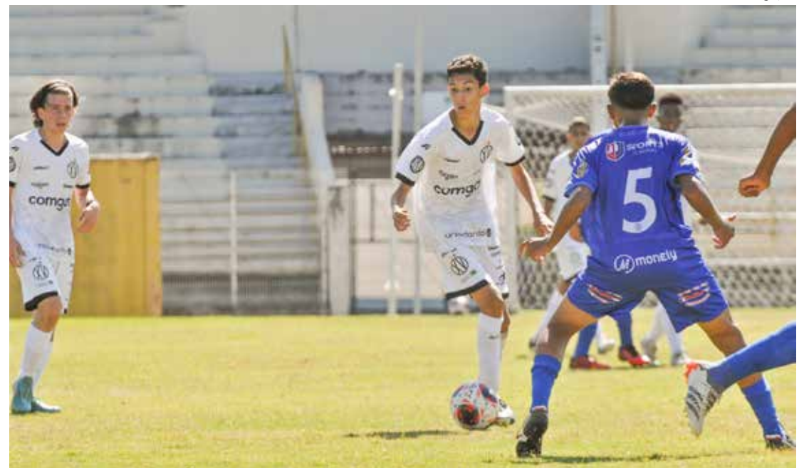
Manhã de futebol no Schmidtão

Já as equipes Sub-11 e Sub-13 do Rio Claro, que também disputam o Campeonato Paulista jogam na manhã deste domingo (2). Terão como adversário o Grêmio São-carlense. O Sub-11 entra em campo às 9 horas e o Sub-13 às 10h30. Ambos os jogos acontecem no estádio Dr. Augusto Schmidt Filho.