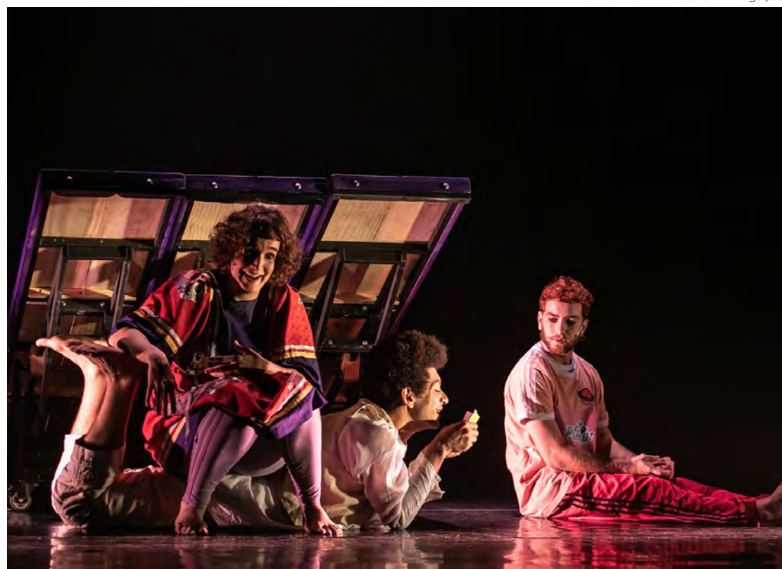
O espetáculo ‘Vamos comprar um Poeta’ fala sobre amor, amizade e capacidade de invenção.

Vamos comprar um Poeta. Dia 1º de julho de 2023, às 16h, no Teatro Sesi Rio Claro (Avenida M-29, 441, no Jardim