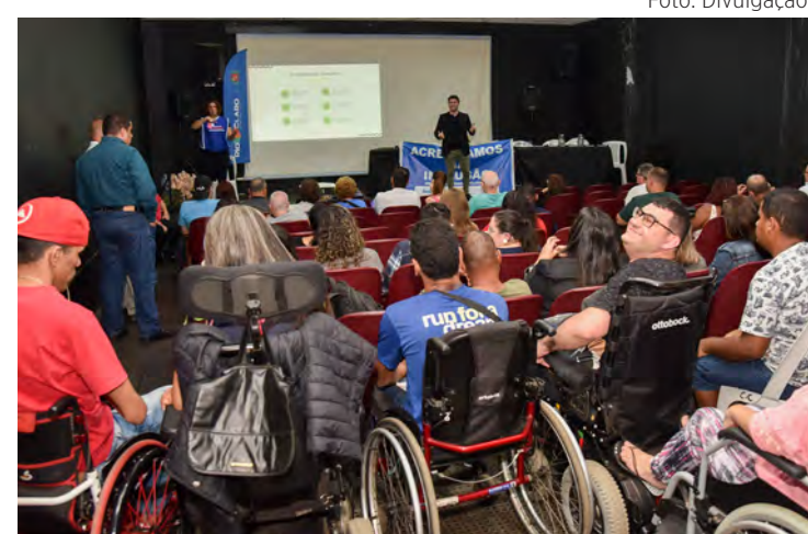
Encontro sobre Empregabilidade da Pessoa com Deficiência ocorreu no Centro Cultural.