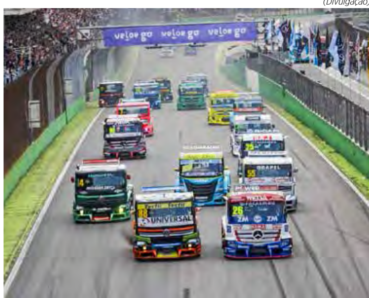
Copa Truck marca presença novamente no Paraná com mais uma etapa no Autódromo de Cascavel

As corridas de domingo acontecem em sequência a partir das 12h40, com transmissão pela Band, Sportv e youtube da Copa Truck e High Speed Channel.