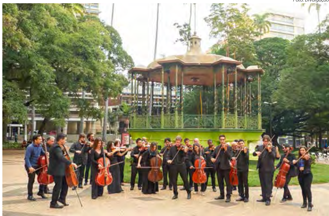
A Orquestra do Conservatório Carlos Gomes de Campinas realiza concerto gratuito nesta sexta (30) em Rio Claro