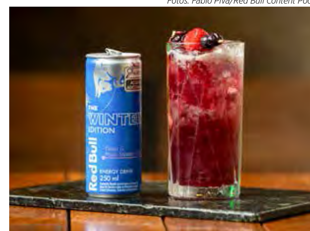
Citric Raspberry é uma ótima opção para manter as doses de energia