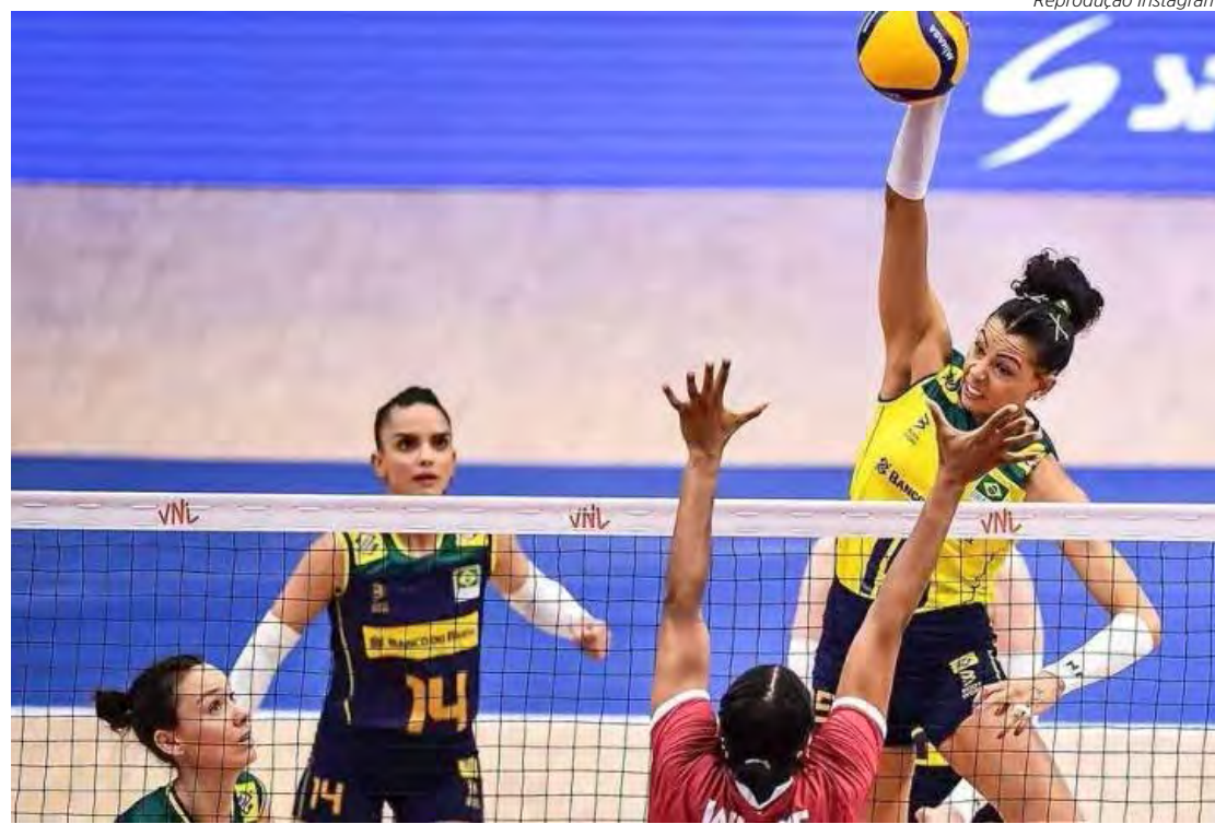
Brasil foi mal e perdeu para o Canadá