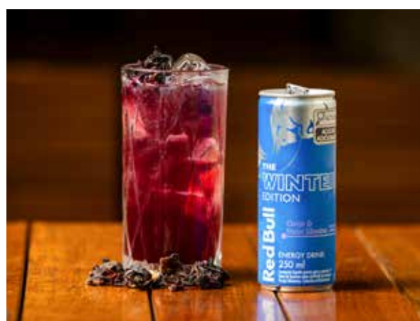
Magic Hibiscus: experimente esse delicioso mocktail