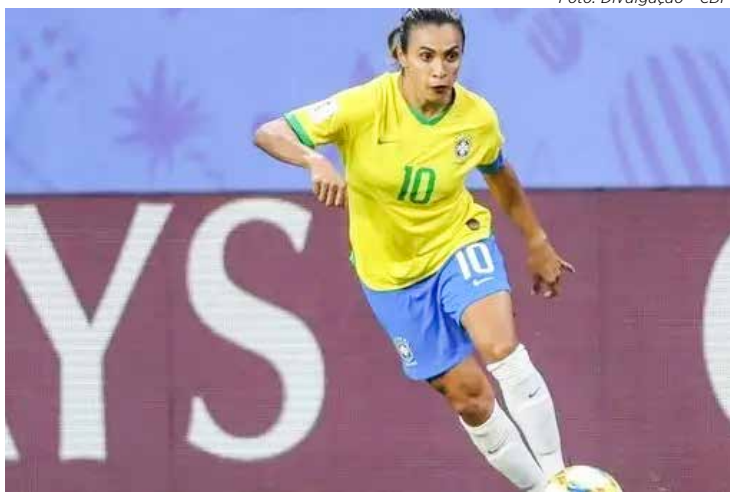
Marta estará no Mundial Feminino