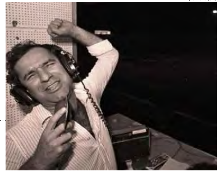
Osmar Santos, um dos gênios do nosso rádio