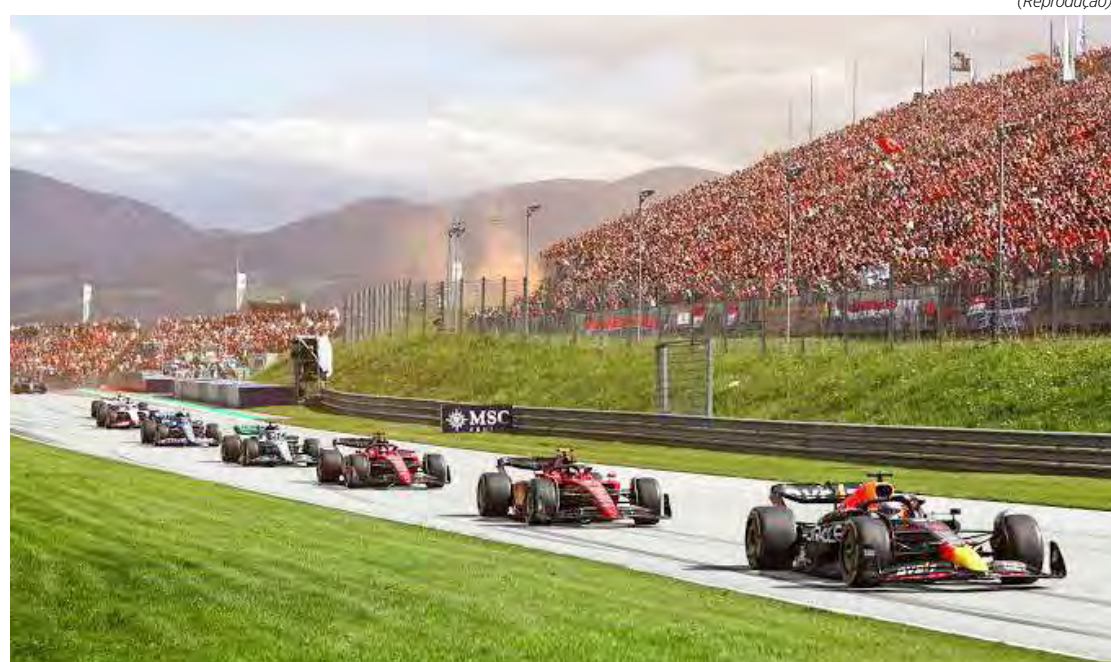
Principal categoria do automobilismo mundial retorna à casa da Red Bull para mais um fim de semana com sprint

do para começar essa jornada no Red Bull Ring. É uma pista que eu gosto bastante de andar e conquistei um ótimo resultado na temporada passada com o segundo lugar no sábado. Vamos trabalhar forte junto com a equipe para ir em busca do melhor resultado possível", disse ele.