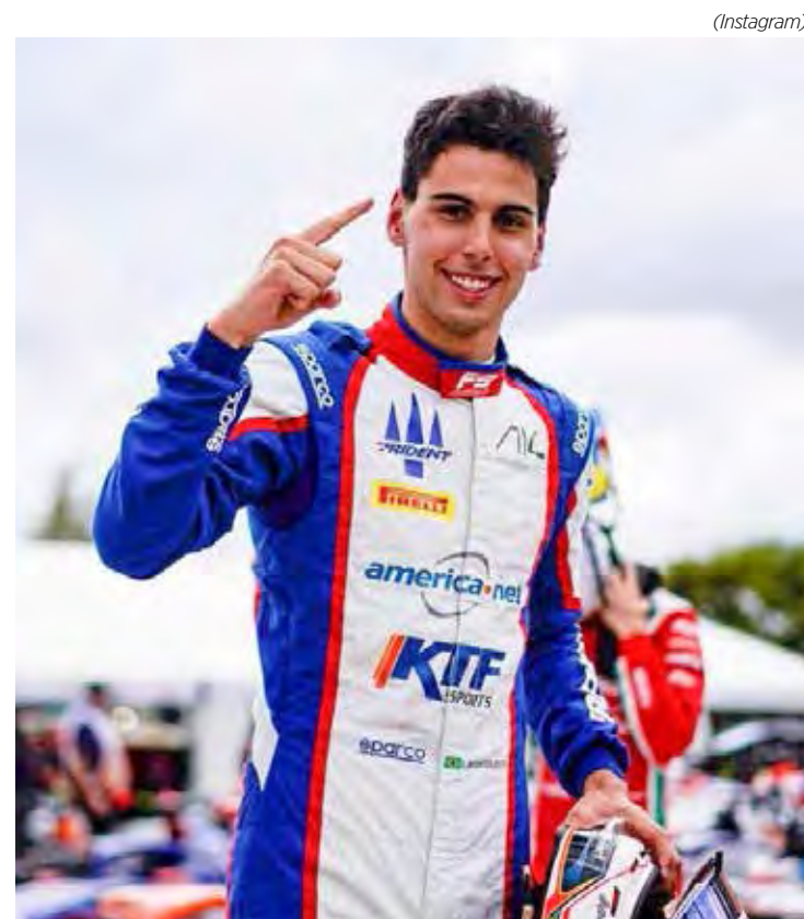
Brasileiro Gabriel Bortoleto é o líder do campeonato

2 de julho, domingo 14h45 – Corrida (ESPN, TV Cultura, Star+)