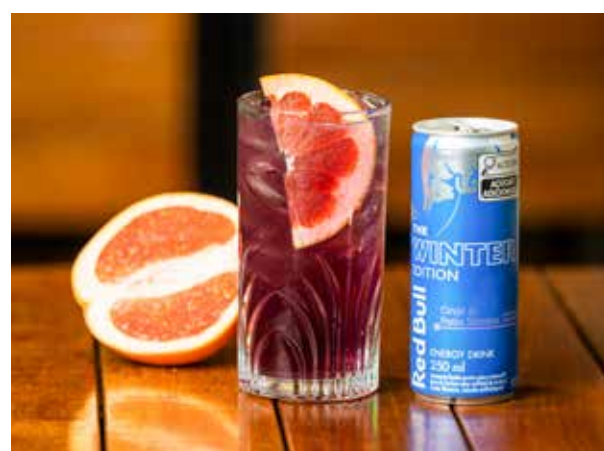
Purple Orange é um saboroso drink sem álcool