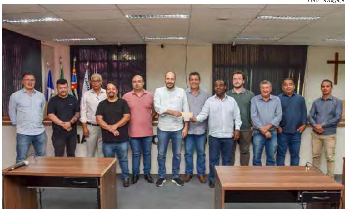
Câmara devolveu R$ 3 milhões à prefeitura