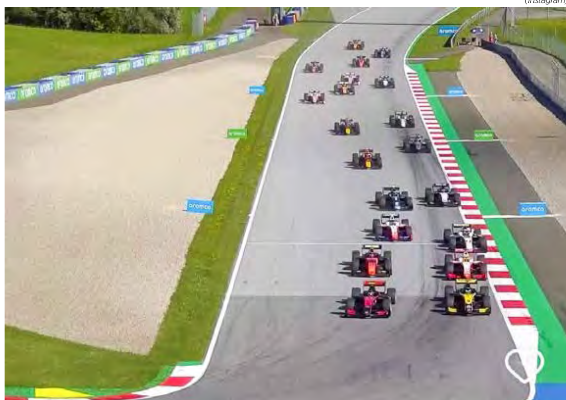
Principal categoria de acesso à F1 realiza a sétima etapa da temporada 2023