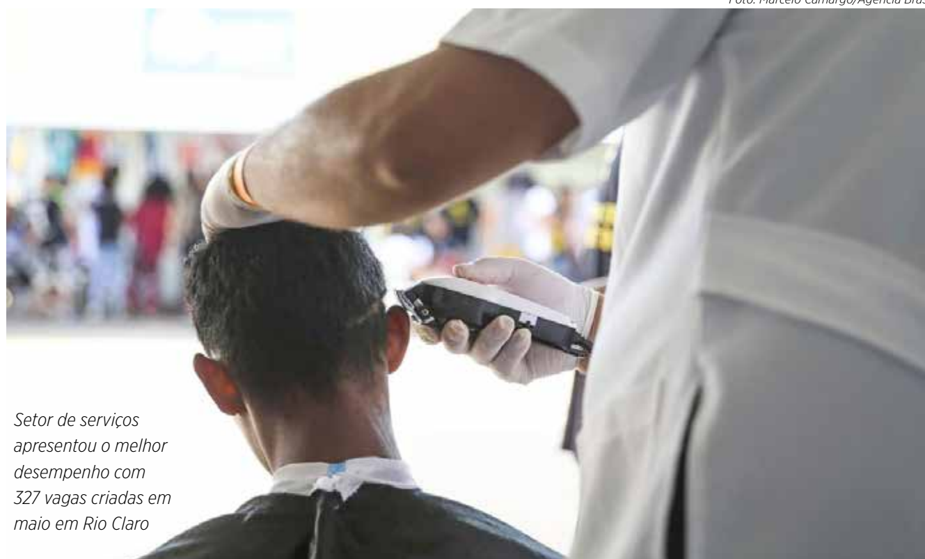
Setor de serviços apresentou o melhor desempenho com 327 vagas criadas em maio em Rio Claro

Apesar dos números positivos, o ministro do Trabalho e Emprego, Luiz Marinho, ressaltou que o resultado ficou abaixo da expectativa, que era gerar 180 mil empregos. De acordo com ele, isso ocorreu por causa da política de juros altos praticada pelo Banco Central. "Trabalhávamos com a previsão mínima da ordem de