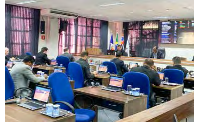
Vereadores aprovaram 11 projetos de lei em sessão extraordinária nesta quarta