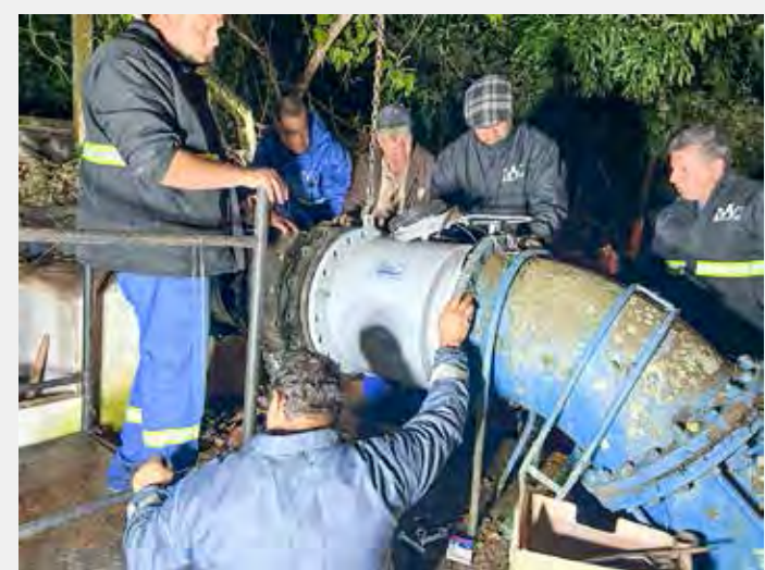
Os trabalhos tiveram início às 20h30 de terça-feira (27) e foram finalizados durante a madrugada de quarta-feira (28)

São instalados para avaliar a relação entre o volume de água captado com o volume produzido e entregue, aprimorando o monitoramento ao combate de perdas de água em todas as fases, desde a captação até o consumo.