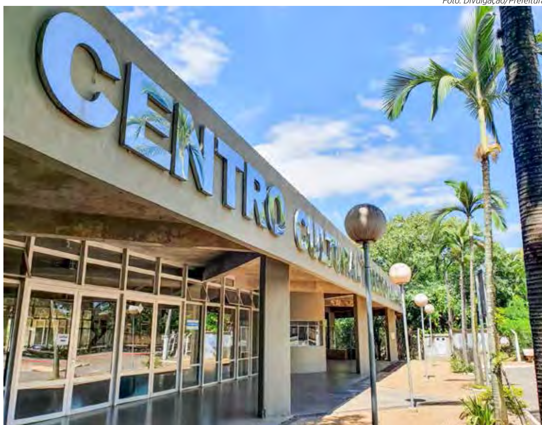
As atividades começam às 13h30, no Centro Cultural Roberto Palmari (Rua 2, 2880, Vila Operária)

Também participam do encontro o Senac, falando sobre capacitação para o mercado de trabalho, Fundação Municipal de Saúde, abordando habilitação e reabilitação de pessoas com deficiência, e Sicoob Cocre, levando informações a respeito de educação financeira, segurança e prevenção.