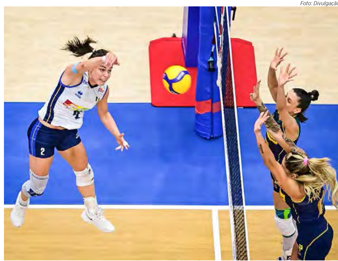
Brasil e Itália fizeram grande jogo decidido no tie-break

De volta à seleção, a ponteira Gabi fez grande partida e marcou 25 pontos. Vilani, pela Itália, foi o destaque com 21. Em números gerais, o Brasil somou 67 pontos de ataque, 10 de bloqueio, 5 de saque e 28 por conta de erros do adversário.