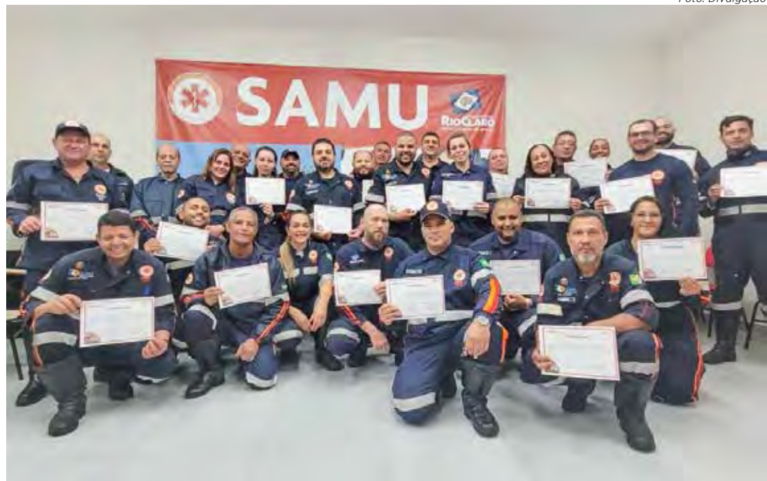
Curso foi realizado de novembro a maio para 51 profissionais que atuam no Samu Regional