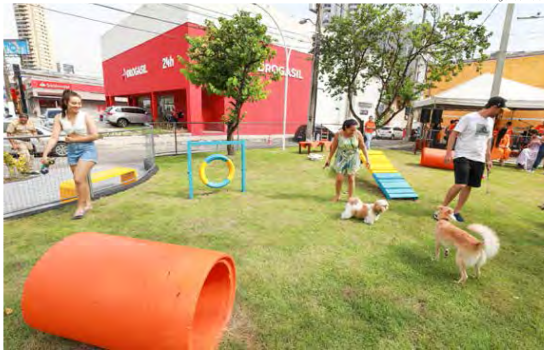
A prefeitura de Belém inaugurou em janeiro deste ano a praça pet "k9 Índia" no bairro Reduto