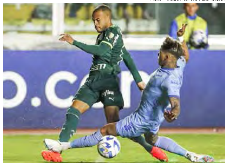
Palmeiras x Bolívar, às 21 horas