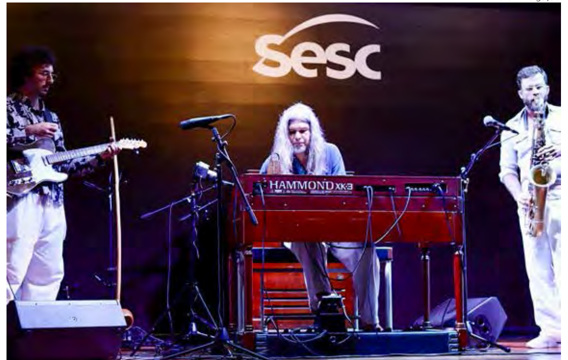
O Du Rompa Hammond Trio se apresenta no Cineteatro Itália em Rio Claro neste sábado, dia 1º de julho