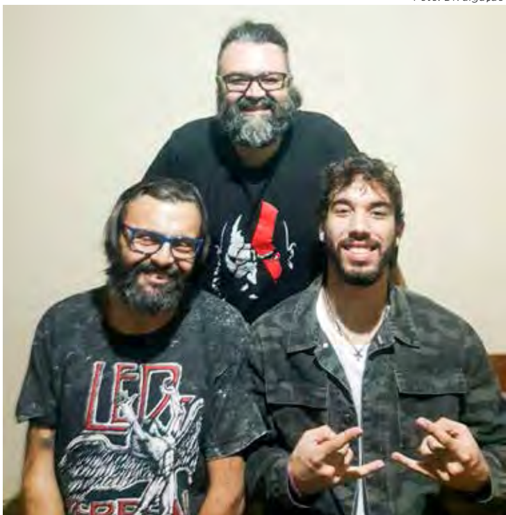
Banda Rock A2 toca no Projeto Quatro e Meia a partir das 16h30