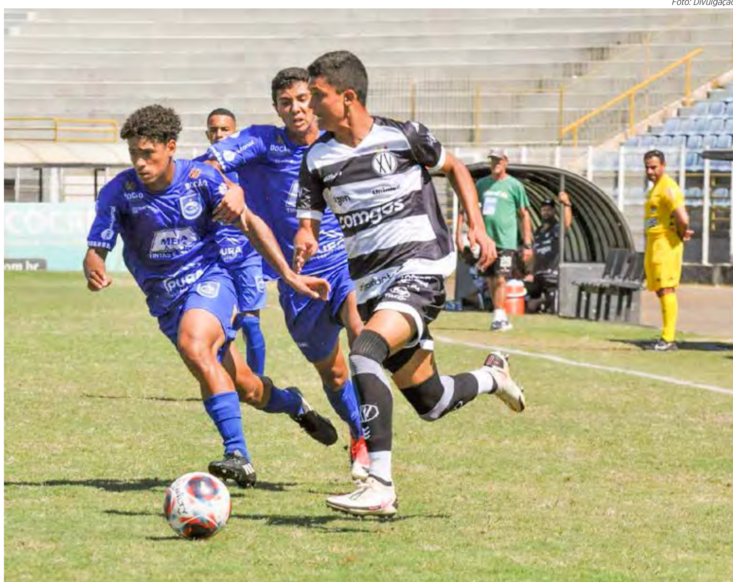
Base do Azulão no Campeonato Paulista