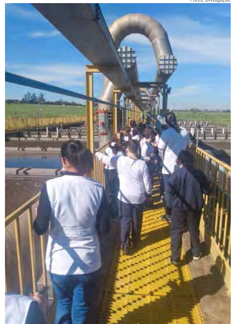
Alunos visitam estação de tratamento de esgoto do Jardim Novo

Também no mês de maio, 60 alunos do Claretiano – Colégio de Rio Claro, visitaram a Estação de Tratamento de Esgoto (ETE) Jardim Novo, que em 2022 foi responsável pelo tratamento de 47% do esgoto gerado pela cidade. Durante a visita do programa Portas Abertas, os estudantes do 6º ano do ensino fundamental puderam conhecer sobre o processo de tratamento desenvolvido no local, que adota a tecnologia Nereda®, um sistema desenvolvido na Holanda que através da bio-