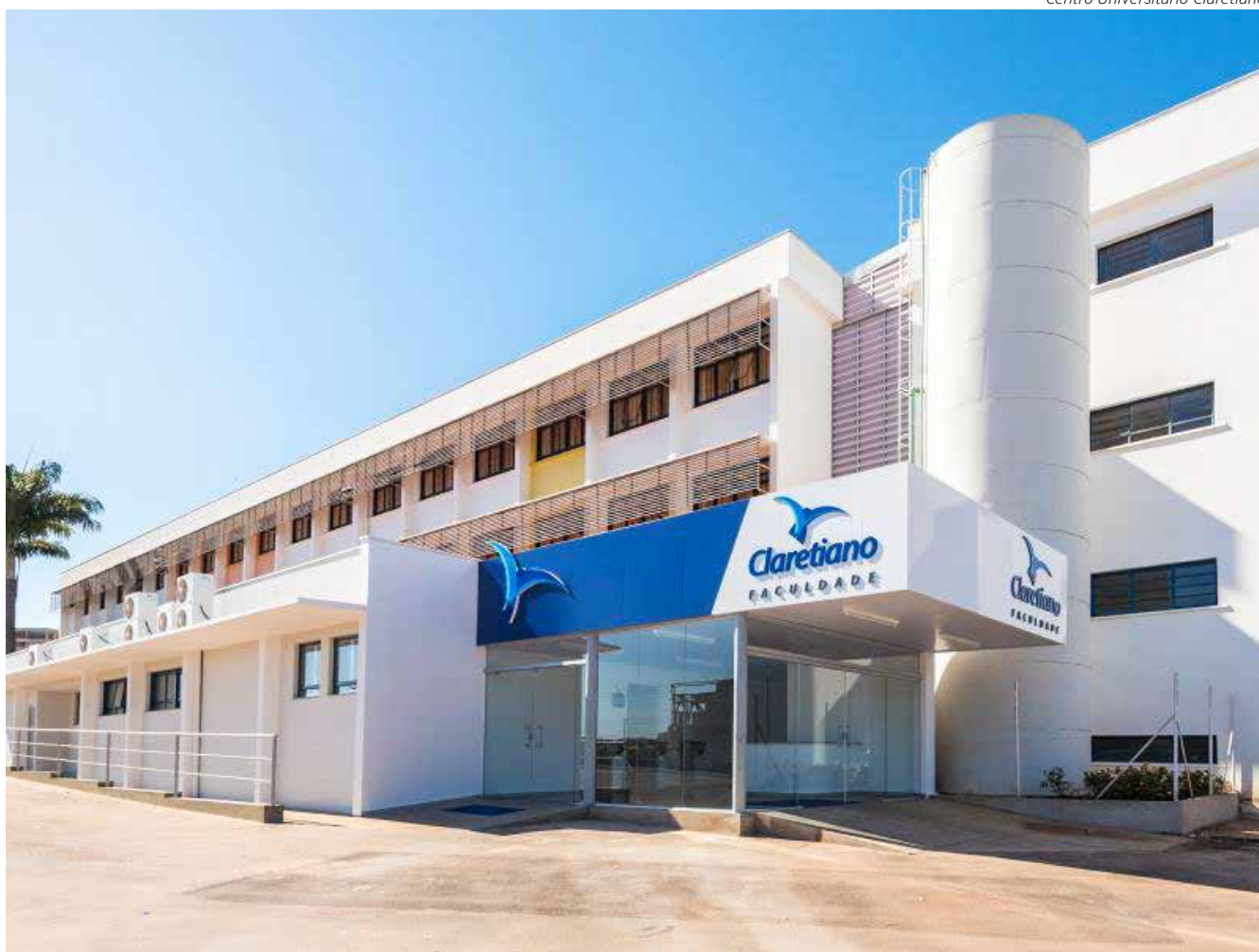
Inscrições devem ser feitas no site da Vunesp

Vale lembrar que todo candidato ou candidata deve se orientar pelas informações do edital que estão no