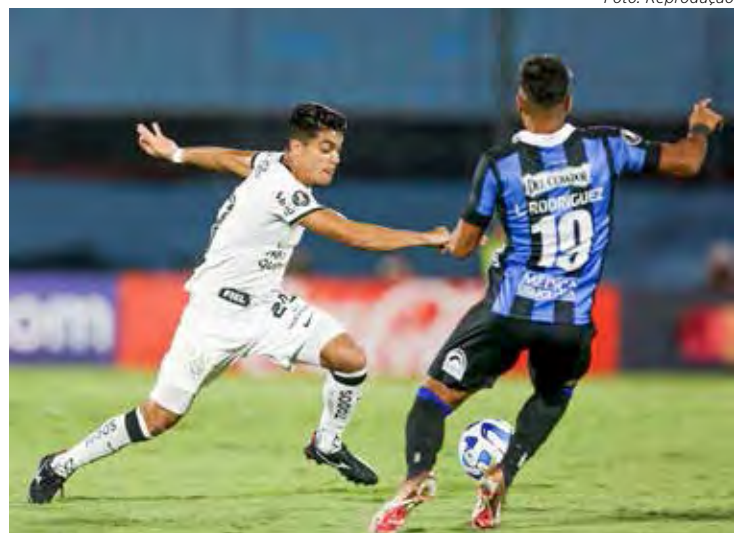
Corinthians x Liverpool-URU às 21h30