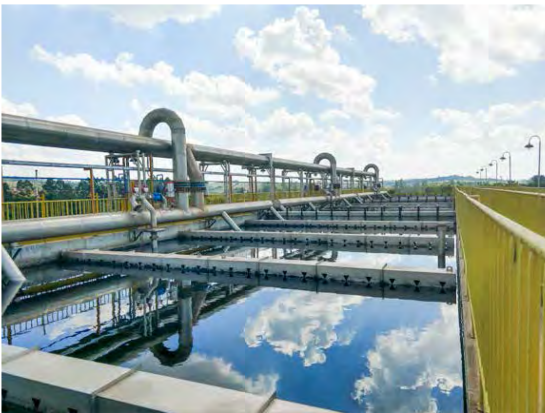
ETE Jardim Novo

Escolas, empresas e instituições interessadas em receber as palestras da BRK ou realizar visitas às instalações podem solicitar o agendamento da ação pelo e-mail sustentabrisp@brkambiental.com.br . As atividades são disponibilizadas de forma presencial e on-line. Para outras informações e solicitação de serviços, a concessionária disponibiliza atendimento telefônico gratuito pelo 0800-771-0001.