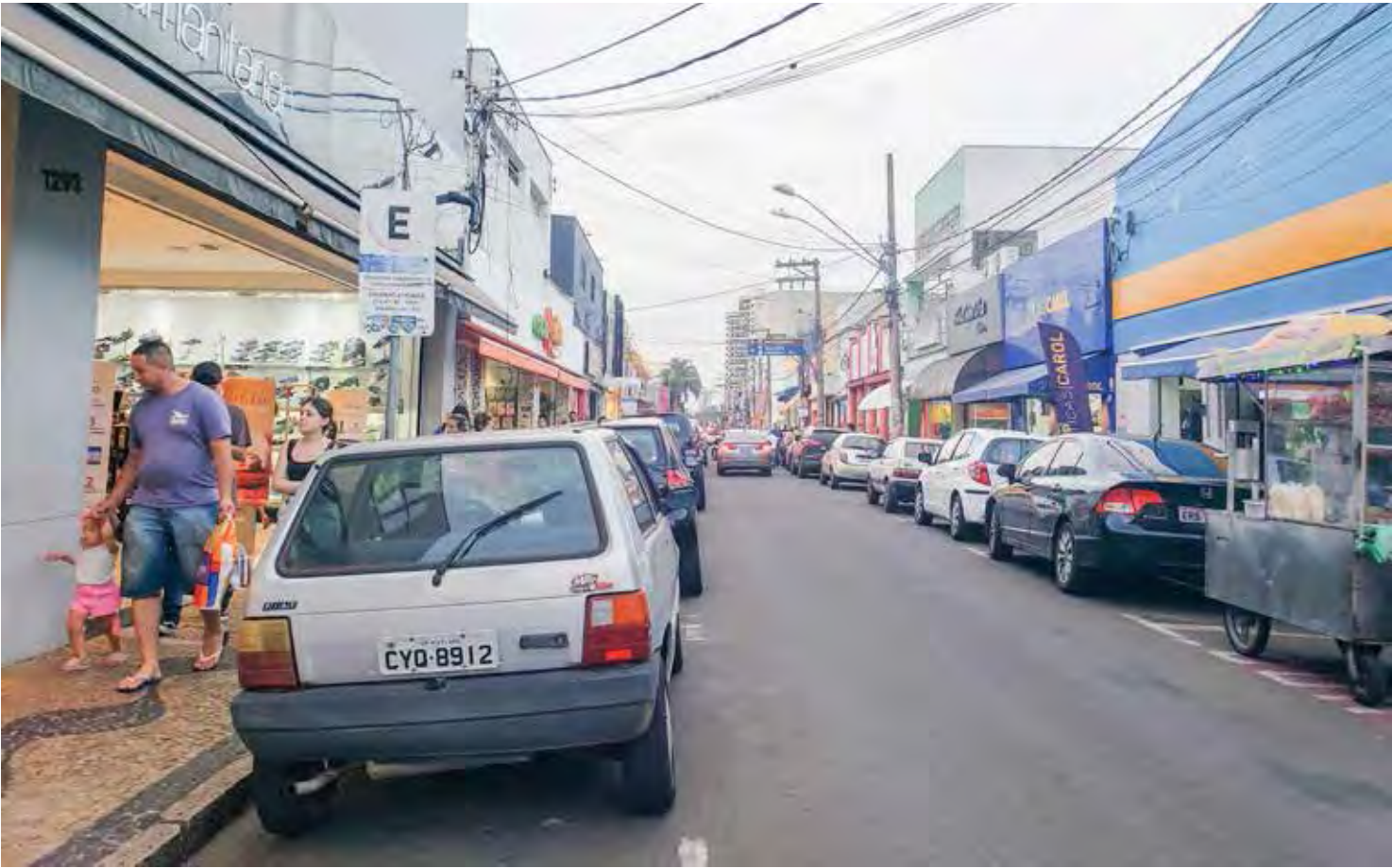
Lojas de rua vão atender o público das 9 às 15 horas no feriado deste sábado