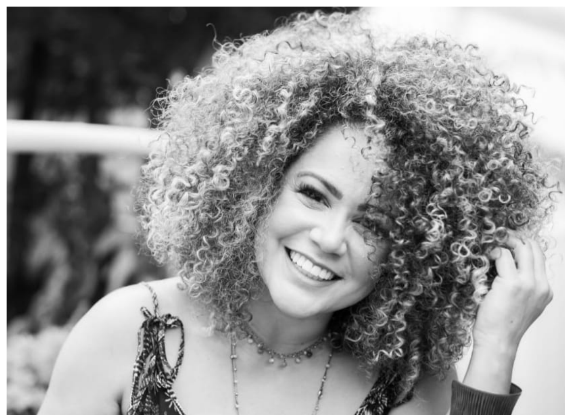
Samba D'Aninha é uma das atrações do Festival Rango e Rock