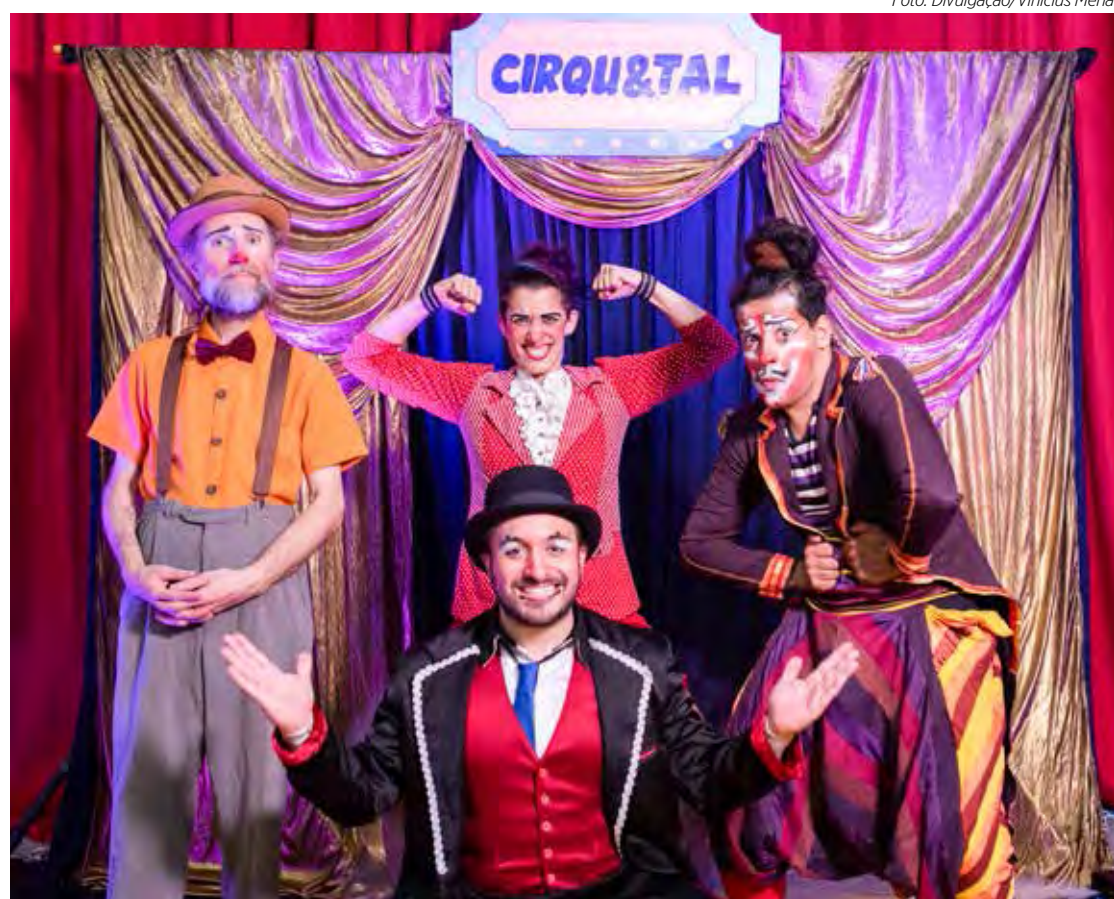
Espectáculo circense o Cirqu&tal será apresentado em Ajapi

Além da apresentação do espetáculo circense Cirqu&tal, do repertório da MB Circo, a Caravana Circo Rural sempre contará com a participação de artistas da comunidade. Em Rio Claro, por exemplo, a cena também será ocupada pelos shows do Forró Seguro e do DJ Explosão.