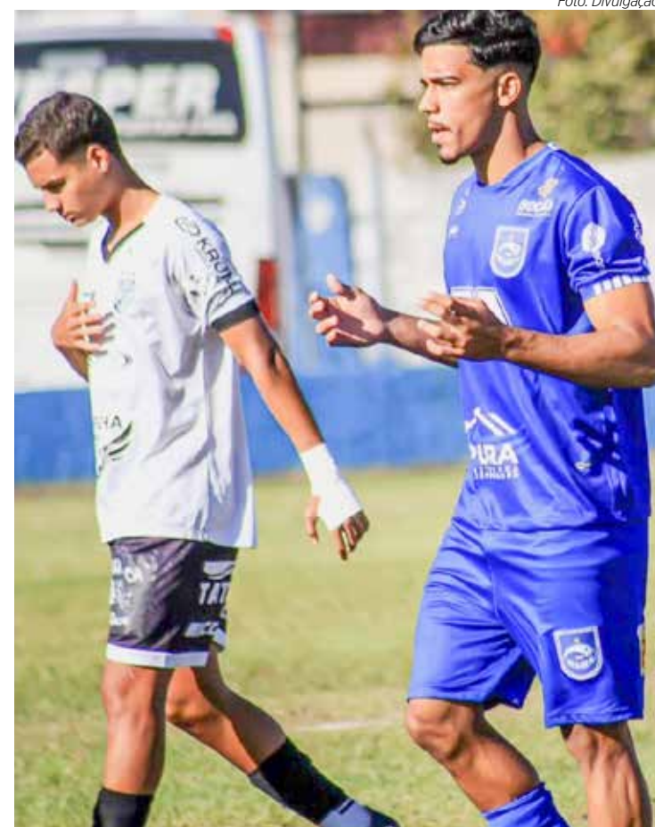
Sub-20 do Rio Claro FC tem o Botafogo pela frente

E neste domingo (25), acontecem os jogos das categorias Sub-11 e Sub-13 do Campeonato Paulista, que chega à 6ª. rodada da 1ª. fase. O Velo Clube recebe no estádio Benitão, a SE Matonense. E o Rio Claro FC visita o União Barbarense. Os jogos do Sub-11 começam às 9 horas e os do Sub-13 às 10h30.