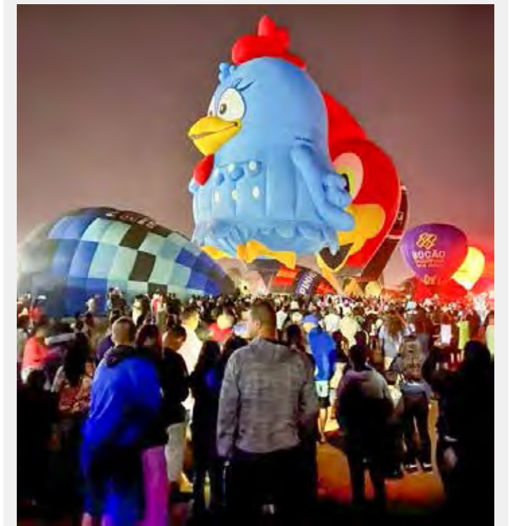
No Night Glow, os balões de ar quente se transformam em gigantes lanternas coloridas

Não perca essa oportunidade de presenciar um espetáculo único e emocionante. O aeroclube de Rio Claro será o local perfeito para essa exibição grandiosa, oferecendo uma visão privilegiada e de fácil acesso a todos os espectadores para uma noite inesquecível. Não fique de fora dessa experiência mágica.