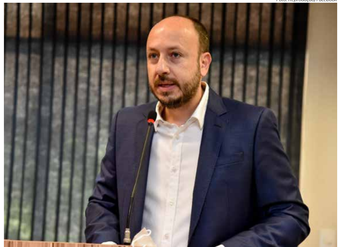
O prefeito de Rio Claro, Gustavo Perissotto

Gustavo - Realmente, desde 2015 não são lançados novos empreendimentos para essa população. Porém, em nosso governo estamos tomando providências para atender também estas pessoas. A prefeitura de Rio Claro comprou terreno e regularizou outro para construir 200 moradias de interesse social. Estamos acompanhando o pro-