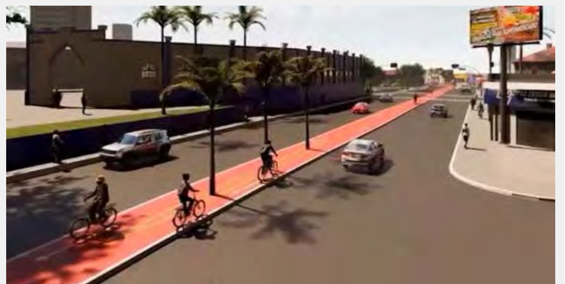
Projeto de revitalização da Visconde prevê a construção de ciclovia e novo paisagismo

da Visconde que está sendo realizado pela prefeitura. As obras já começaram. Além da ciclovia, a avenida vai ganhar semáforos inteligentes e novo paisagismo. O projeto foi inspirado na Avenida Paulista em São Paulo, e prevê ainda a instalação de gradis para garantir a segurança dos usuários.