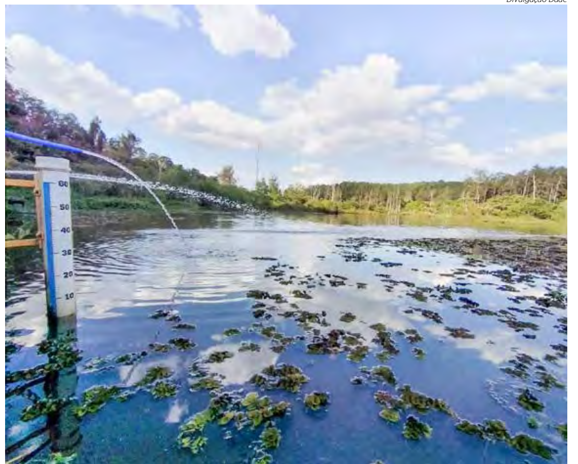
A água bruta captada no Ribeirão Claro abastece a Estação de Tratamento de Água (ETA 1), que fica no bairro Cidade Nova, responsável pelo fornecimento de água em 40% da cidade, abrangendo bairros das regiões Norte, Sul e Central, além do distrito de Assistência

Rui: Além da captação, tratamento e abastecimento de água, o Daae também executa fundamental trabalho ambiental de recuperação, preservação e proteção das áreas dos mananciais onde capta a água bruta e também nos cursos d'água e nascentes, com a realização de plantios, com mais de 1000 mudas plantadas em 2022.