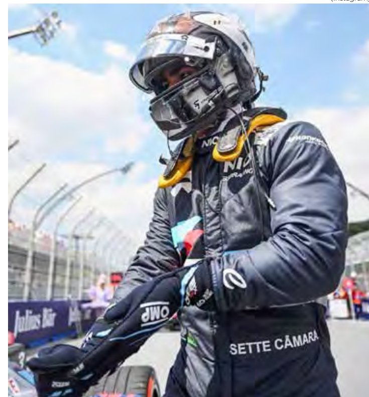
Brasileiro chega confiante para a prova deste sábado