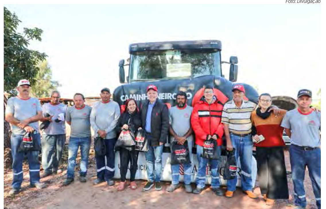
Caminheiros recebendo o kit durante mobilização da campanha na Cerâmica Alfagres.

A campanha “Caminhoneiro do Bem Anda Lonado” conta com o apoio das prefeituras municipais de Cordeirópolis, Ipeúna, Rio Claro e Santa Gertrudes, além do suporte do Seste Senat, fortalecendo a parceria e o compromisso com a conscientização e a segurança no transporte de carga nas estradas.