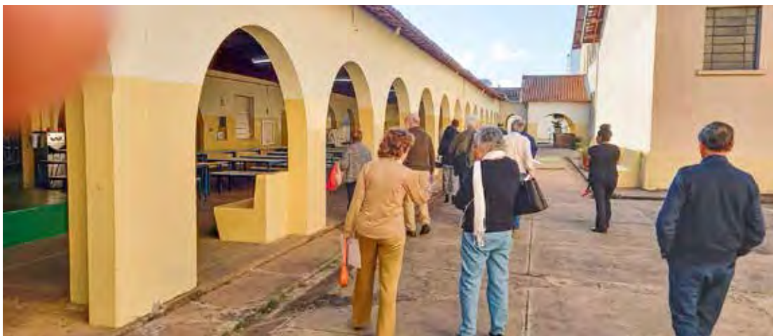
Ex-alunos visitaram a escola Ribeiro em encontro realizado no último dia 16