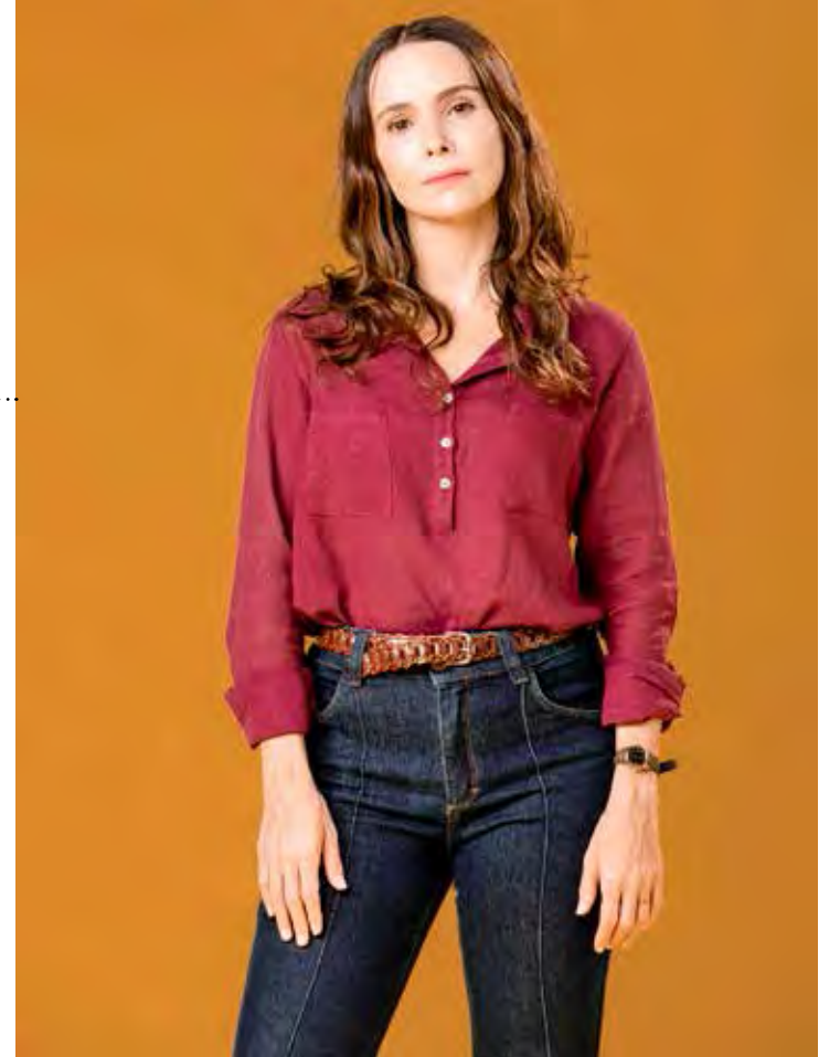
Débora Falabella integra os elencos de “Terra e Paixão” e “Aruanas”

Flávia Noronha, do “TV Fama”, parceira do Nelson Rubens na apresentação do programa, acaba de renovar seu contrato com a Rede TV!. Assinou por mais um ano.