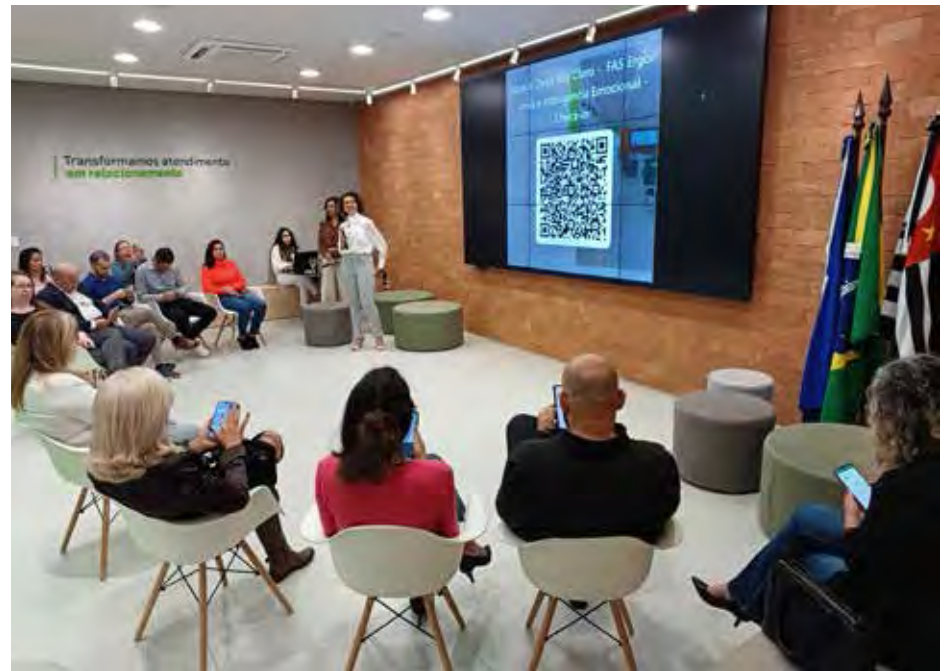
No excelente espaço versátil da Dexis – Siced, a reunião que movimentou empresários que lá estiveram para conferir a proposta das profissionais