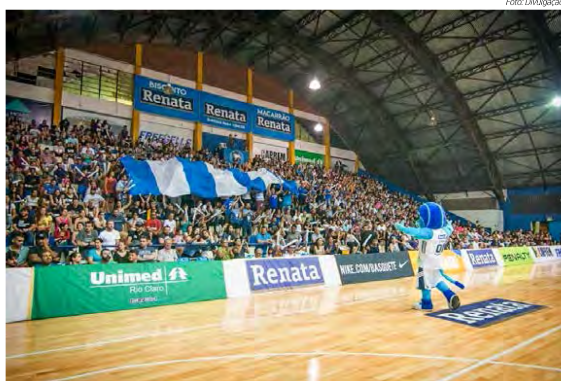
Ginásio Felipão, palco de muitas glórias do esporte rioclarense