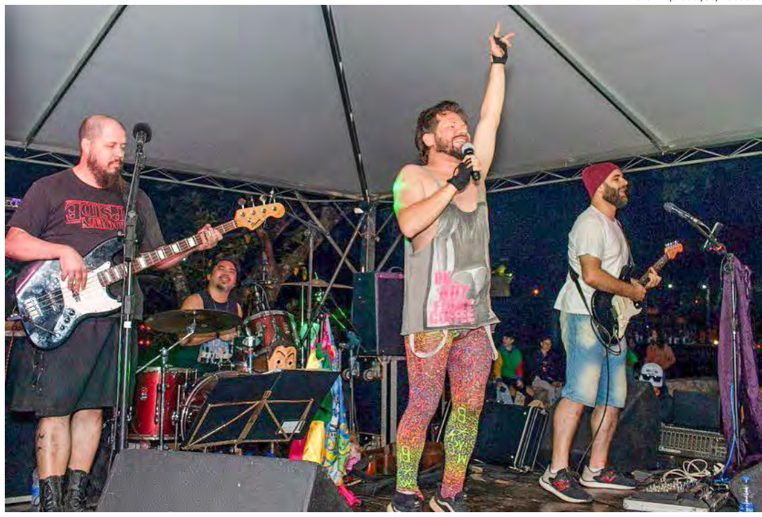
A banda Balaio de Gato é uma das atrações do Show da Cidade deste sábado

Para o período da noite estão previstas ainda outras duas atrações musicais, com DJ Baba e show da dupla Lipe & Lyan. Para