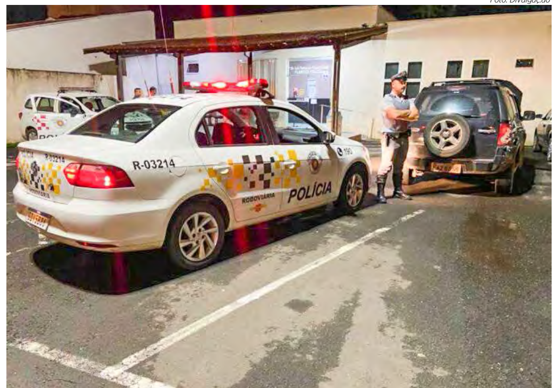
Conductor da Amarok foi submetido ao teste de etilômetro, que acusou negativo para ingestão de bebida alcoólica

O corpo do ciclista foi encaminhado ao IML (Instituto Médico Legal) para exame do legista.