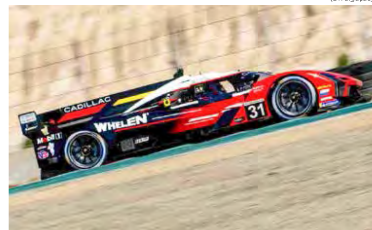
Pipo Derani lidera o Endurance Challenge e é o vice-líder na temporada da IMSA GTP com o Cadillac V-Series.R LMDh #31 da Whelen / Action Express