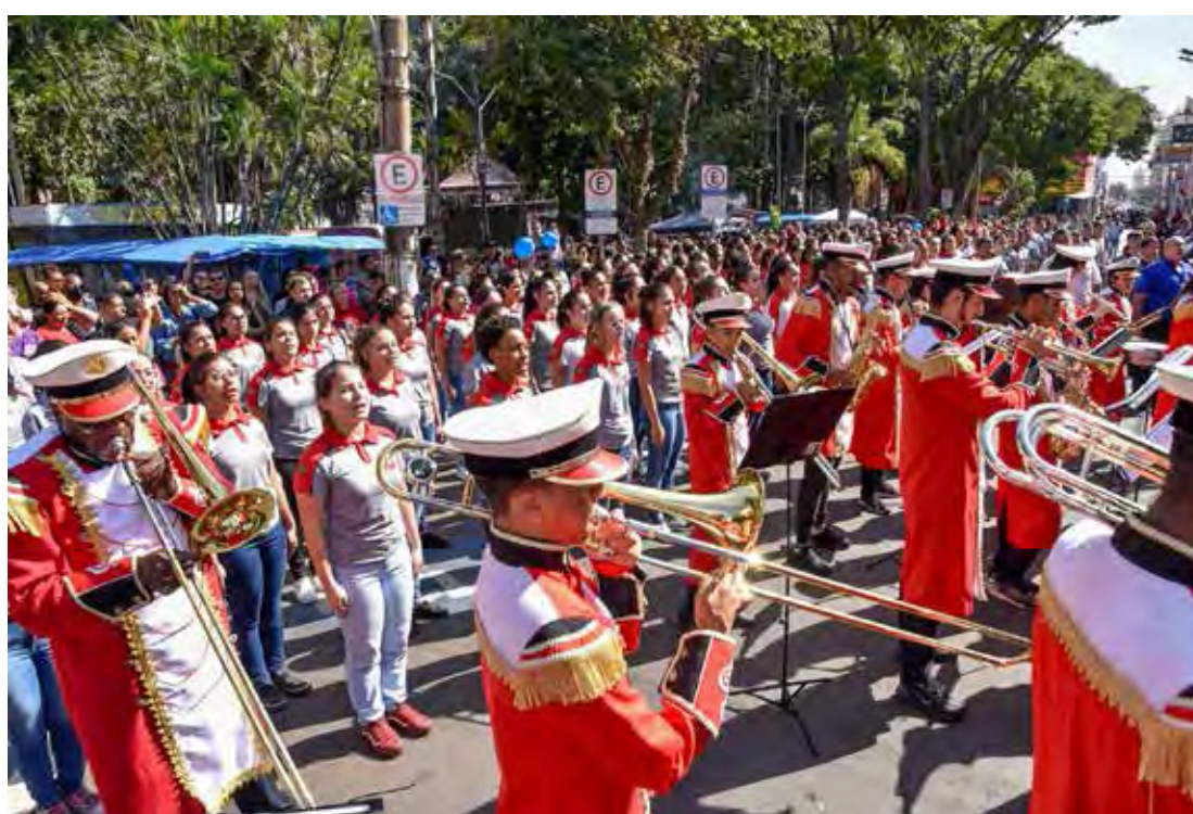
Grande público costuma prestigiar o desfile cívico de aniversário da cidade