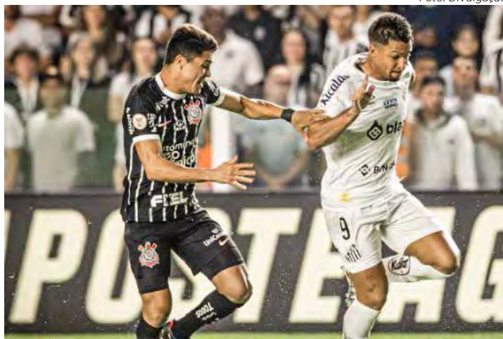
Corinthians foi melhor e mereceu a vitória