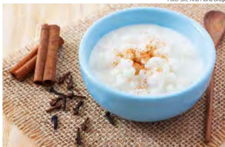
Canjica-vegana - Prato tradicional das festas juninas, a canjica também pode ser light

Primeira: O ideal é que você conserve o doce na geladeira, mas ele resiste boas horas fora dela, caso queira servi-lo em alguma festa junina.