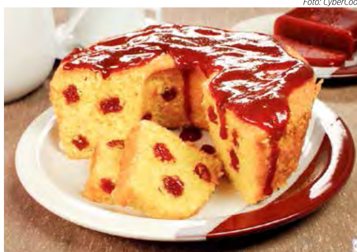
Bolo de fubá com goiabada: uma mistura que dá super certo

Segunda: A consistência do doce, justamente por não ter açúcar, não será tão dura quanto a do pé de moleque tradicional.