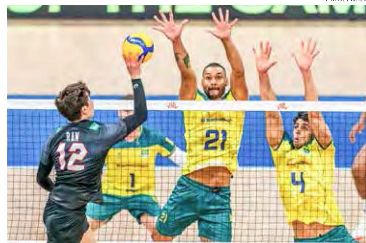
Brasil parou no invicto Japão