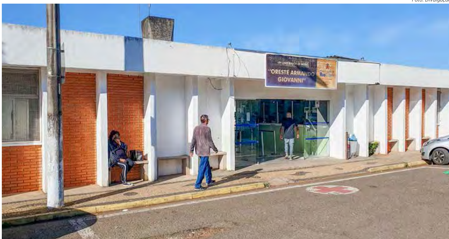
Fachada do prédio da UBS da Av. 29 que será reformado pelo município