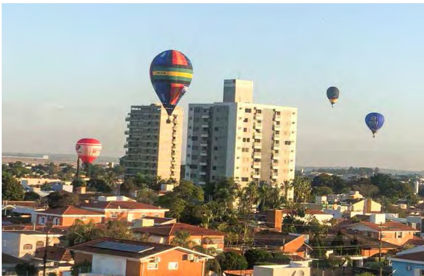
Os balões começaram a colorir o céu de Rio Claro com a Copa de Balonismo que segue até domingo

As pessoas que quiserem concorrer a um voo de balão devem doar um litro de óleo ao Fundo Social de Solidariedade do município nesta sexta-feira das 8 às 17 horas e no sábado das 8 às 13 horas. As doações estão sendo recebidas no paço municipal. O sorteio será feito no Show da Cidade, no sábado (24). Serão sorteados 4 voos, um para cada pessoa.