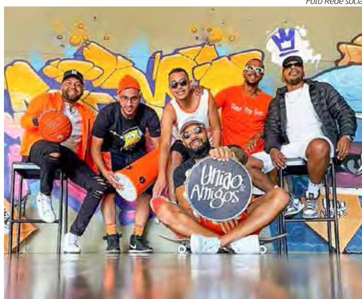
Grupo União de Amigos no Buteko

SHOPPING RIO CLARO – Nesta sexta (23) a domingo (25), prossegue o Arraiá Junino. O evento conta com Shows Especiais na Praça de Alimentação, além de Oficinas Infantis temáticas gratuitas, próximo ao cinema e, também,