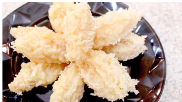
Cocada - Mesmo sem açúcar, a cocada ainda é uma delícia