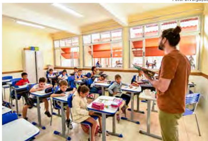
A escola já está em funcionamento há 20 dias e atende alunos de vários bairros