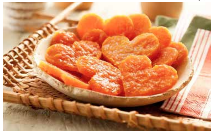
Doce de abóbora vegano - O cardápio vegano inclui doce de abóbora e outras guloseimas