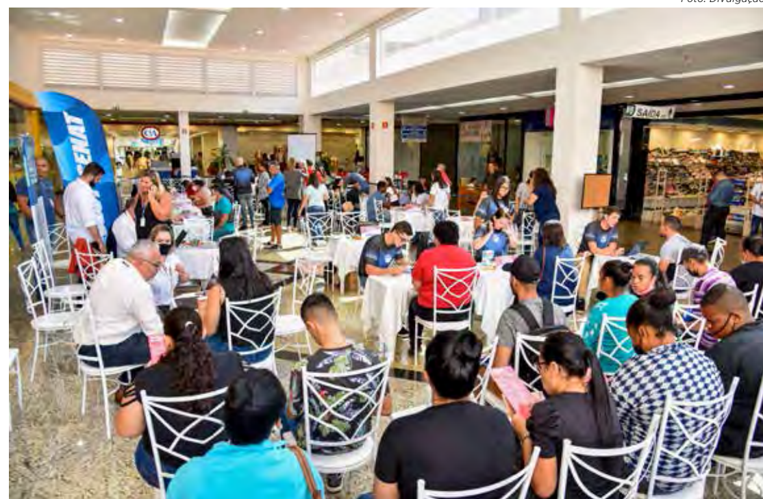
Feira da Empregabilidade será realizada amanhã na sede do Ginástico em Rio Claro

A expectativa dos organizadores foi superada e 35 empresas já confirmaram participação, número superior aos atingidos nas edições anteriores. Também estarão presentes sete instituições de ensino.