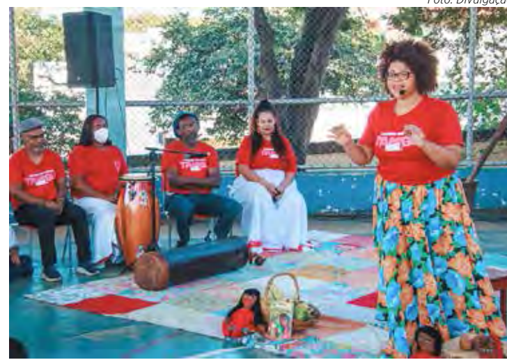
Apresentação do projeto Dandara para alunos de escola na cidade de Tietê