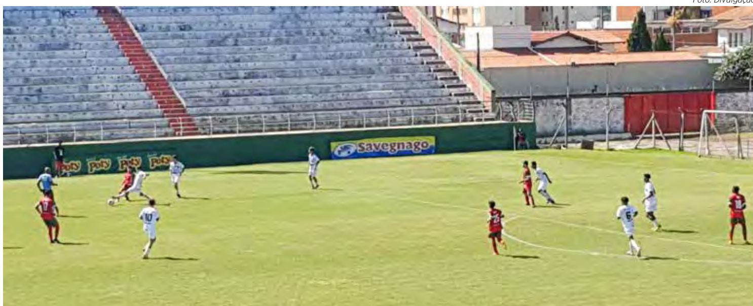
Benitão recebeu jogos da base

As equipes Sub-13 de Velo Clube e Rio Claro FC também foram à luta neste final de semana, pela 5ª. rodada da 1ª. fase do Campeonato Paulista. Os jogos aconteceram na manhã de domingo (18). Em Limeira, Independente e Rio Claro FC não saíram do 0x0. E no estádio Benitão, em Rio Claro, vitória da Ferroviária sobre o Velo Clube por 4x0. Na classificação, o Rio Claro FC é o 3º. colocado do Grupo 4 com 11 pontos ganhos e o Velo Clube permanece em 7º. lugar com 3 pontos ganhos. As equipes do União Barbarense e Grêmio São-carlense que venceram na rodada, dividem a liderança do respectivo grupo, cada qual, com 12 pontos ganhos.