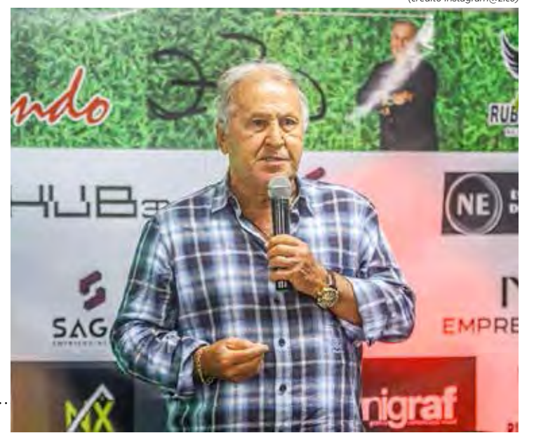
"Resenha do Galinho" estreia quinta-feira, às 23h30, na Jovem Pan

Mas a maneira que aconteceu deixa questões em aberto. A interpretação cabe a cada um. No BS, sabe-se, existe no mínimo uma enorme estranheza.