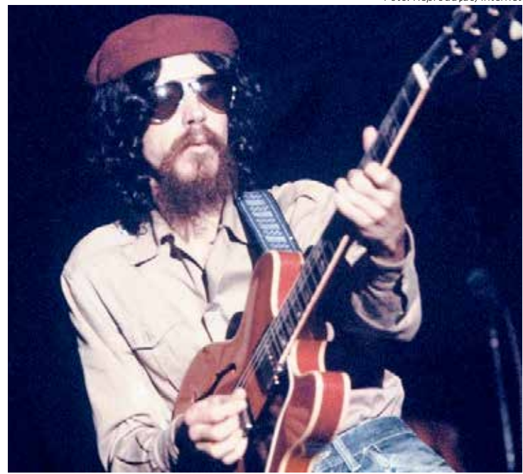
O cantor Raul Seixas será homenageado no Projeto Quatro e Meia