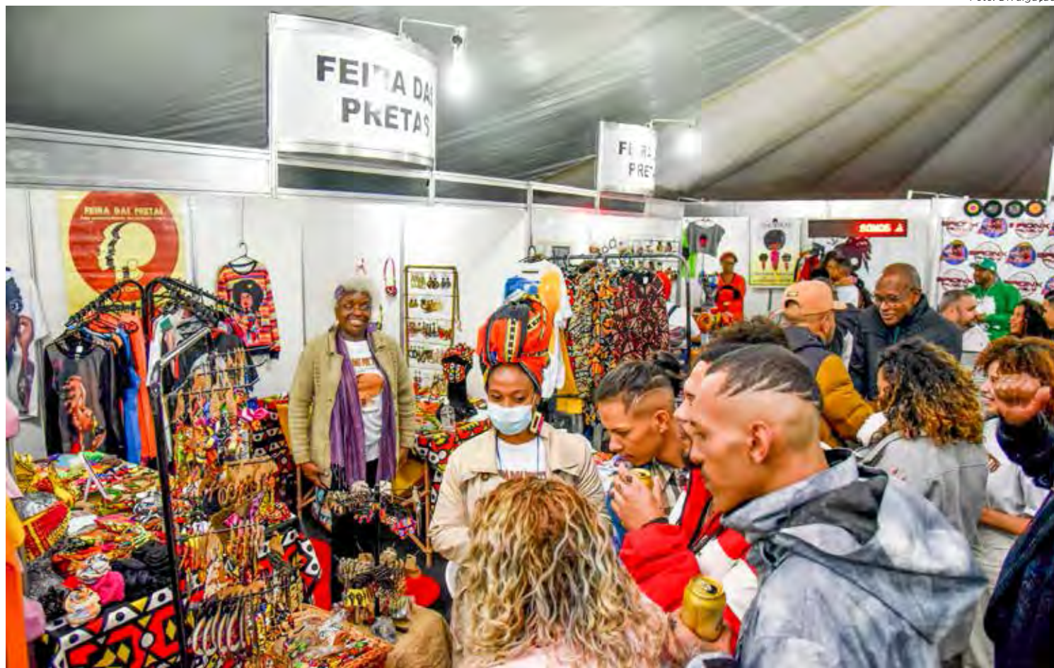
Grande público costuma prestigiar a Black June, a maior festa junina black do estado de São Paulo

O evento tem o apoio das secretarias municipais de Cultura e Turismo e faz parte do calendário turístico do estado de São Paulo e das comemorações dos 196 anos de Rio Claro.