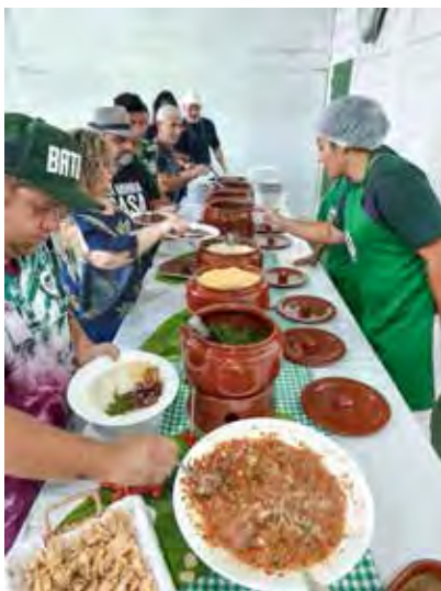
Uma deliciosa feijoada foi o prato principal do evento que agradou a todos