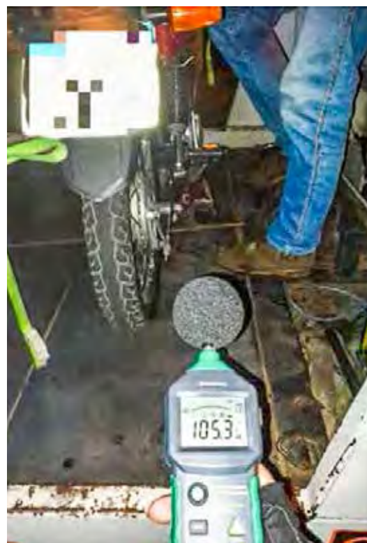
Em abril deste ano, dois veículos foram apreendidos em Rio Claro após a Guarda Civil Municipal aplicar a 'lei do pancadão'.

Vale lembrar que Rio Claro tem a Lei Municipal nº 2.202, de 15 de abril de 1988, que dispõe sobre a emissão de sons e ruídos em decorrência de qualquer atividade industrial, comercial, social ou recreativa no município. O artigo 1º da lei estabelece que “é proibido perturbar o sossego e o bem-estar públicos e de vizinhança com sons de qualquer natureza que ultrapassem os limites estabelecidos” na legislação.