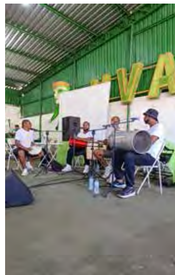
Um pouco de música de boa qualidade no almoço da escola de samba Uva com o Grupo Art