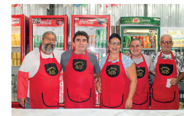
Voluntários da Barraca das Bebidas