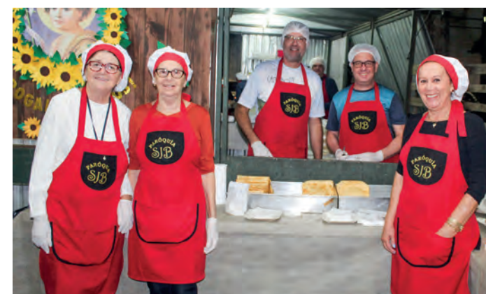
Voluntários da Barraca do Pastel