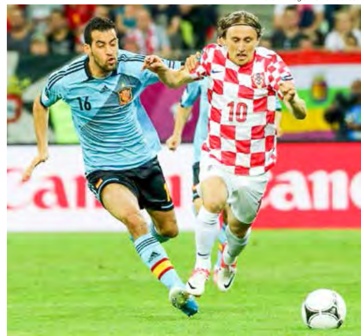
Espanha x Croácia na final

A final da Liga das Nações 2023 terá transmissão do SporTV e da ESPN na TV fechada e através do serviço de streaming Star+.