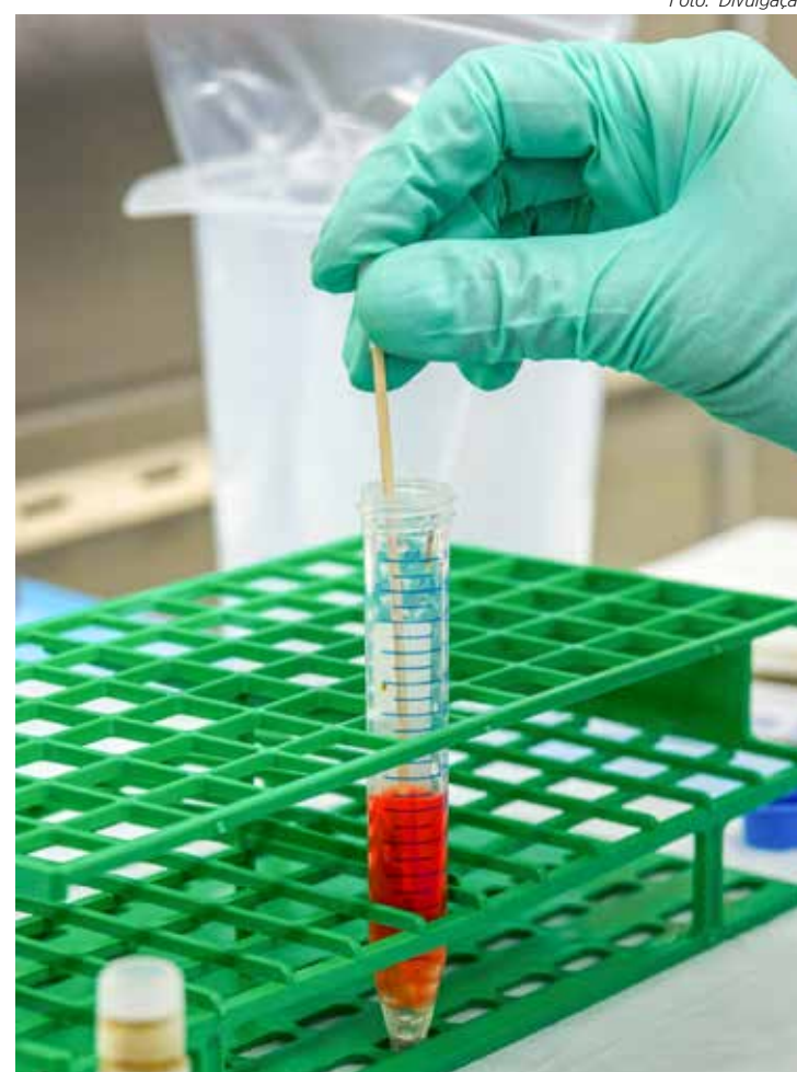
A leucemia e anemia são doenças ligadas diretamente ao sangue que acometem crianças e adultos

Também pode ser causada por deficiência de nutrientes essenciais para produção de glóbulos vermelhos, como ferro e vitamina B12, por exemplo. A redução da vida útil dos glóbulos vermelhos é outro fator que pode levar à doença. Os sintomas variam, mas os recorrentes são: cansaço, palidez, palpitações, sonolência, formigamento nas mãos e nos pés, falta de apetite e alteração do paladar.