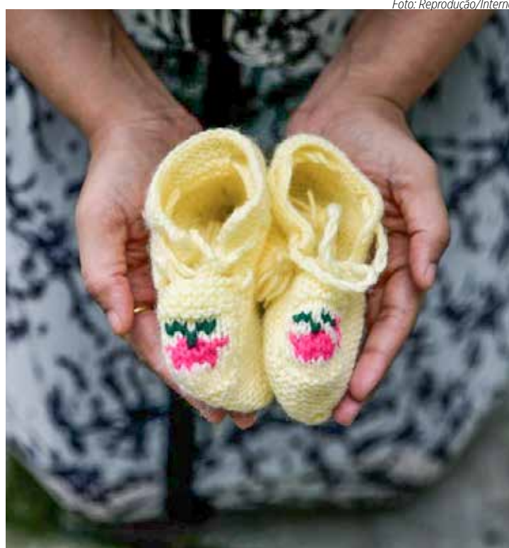
No Brasil, há aproximadamente 8 óbitos neonatais para cada 100 mil nascidos vivos e cerca de 28 mil óbitos fetais ao ano

O estudo relata que é comum mães e pais, que acabaram de perder seus bebês, ouvirem fra-