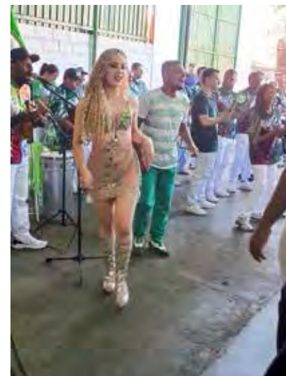
A bateria Fúria se reuniu para fazer a festa final