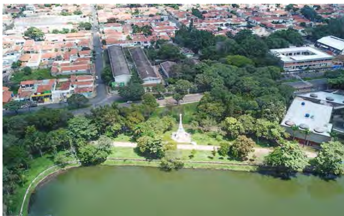
Grande estrutura será montada no entorno da Torre Eiffel no Lago Azul para o 2º Festival de Inverno