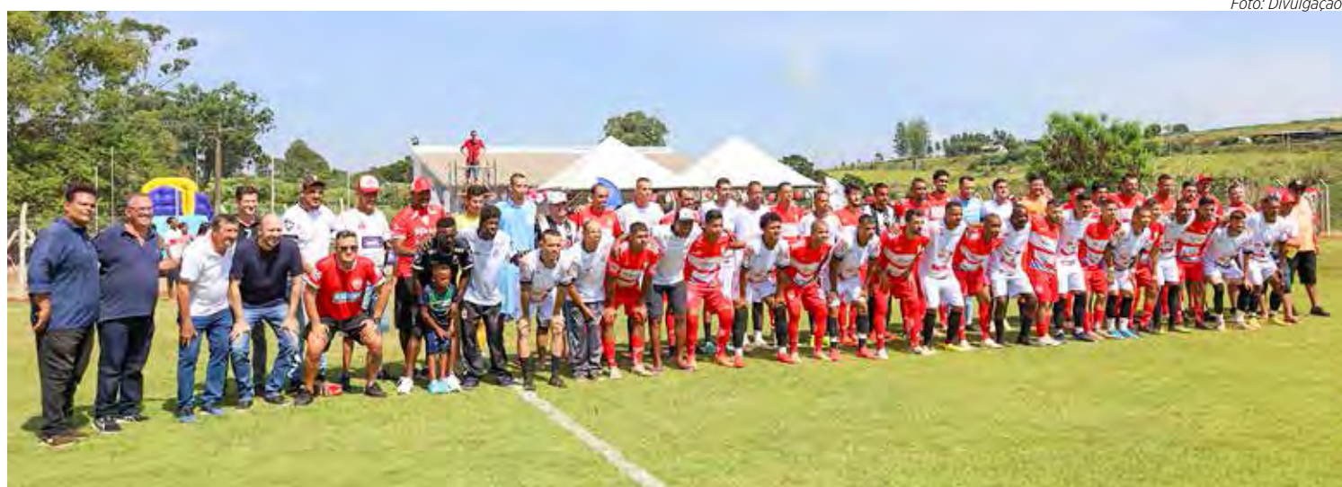
Distrital do AA Boa Vista foi inaugurado em março deste ano. Foto

O público que acompanha de perto o futebol amador e os esportistas em geral certamente marcarão presença para assistir a esse jogo que promete ser disputado em alto nível devido a qualidade técnica de ambas as equipes.