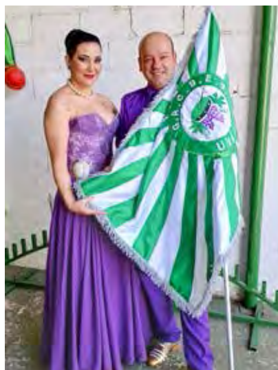
Mestre-sala e porta-bandeira são presenças obrigatórias e colhem admiração em cada giro