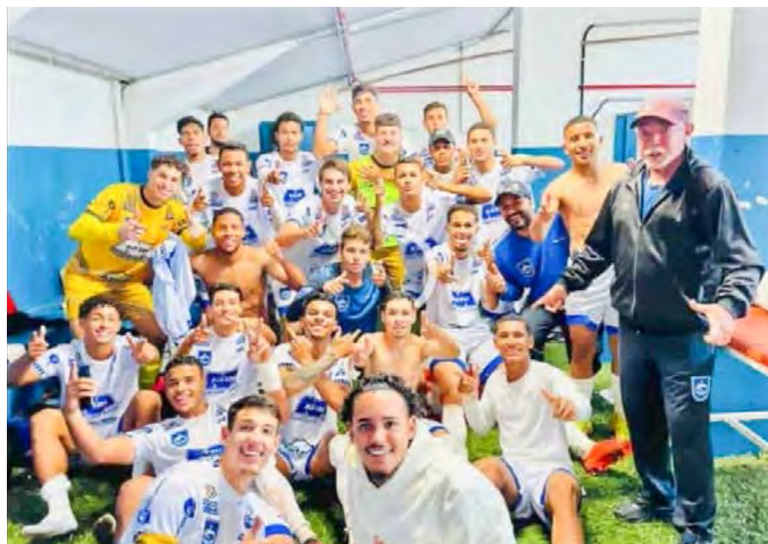
Rio Claro FC está na 2ª fase do Paulista Sub-20

Após 4 rodadas, o Velo Clube ocupa a 7ª colocação no Grupo 4 da categoria Sub-11 com 3 pontos ganhos. O Rio Claro FC é o 6º com 6. A equipe rioclarista lidera o Grupo 4 da categoria Sub-13 com 10 pontos ganhos e o Velo Clube aparece na 7ª. colocação com 3 pontos conquistados.