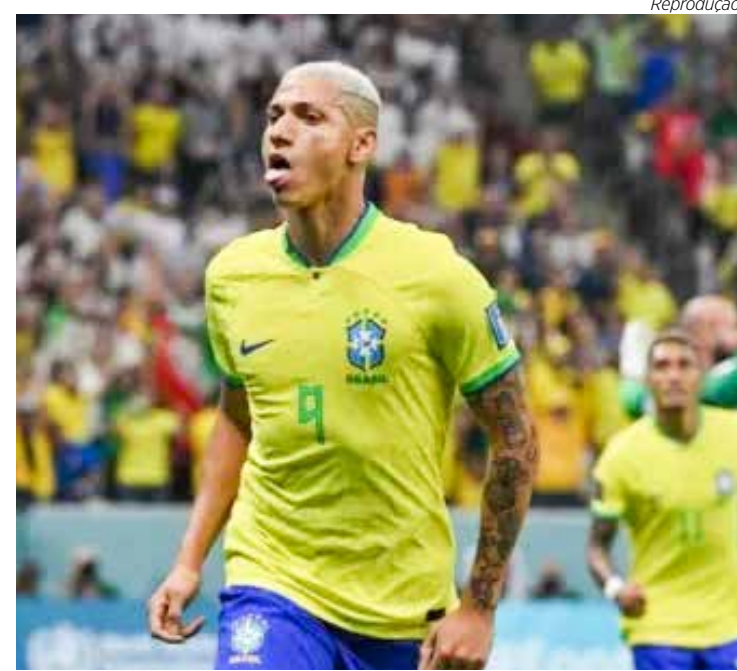
Richarlison comanda ataque do Brasil contra Guiné

Será o segundo amistoso do Brasil, depois do fiasco na Copa do Mundo do Qatar, ano passado, quando foi eliminado nas quartas de final. Em março deste ano, em seu primeiro teste depois da Copa, o Brasil foi derrotado pelo Marrocos, por 2x1.