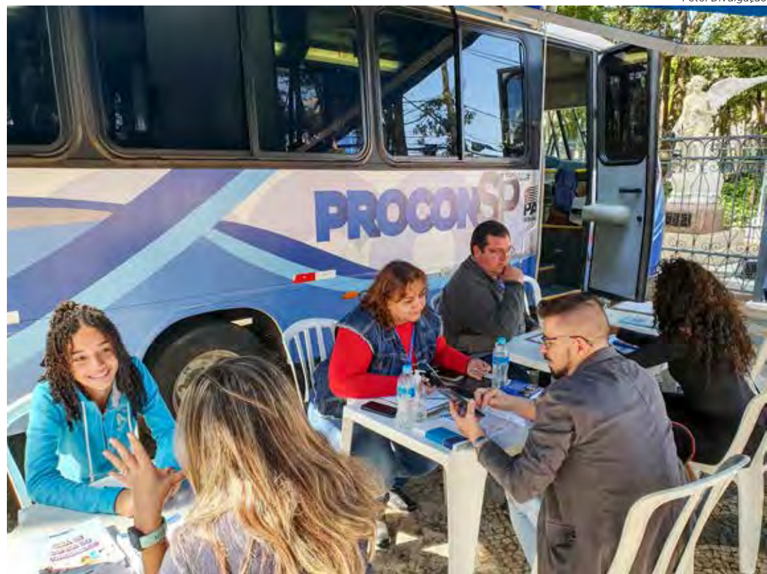
Procon Móvel irá atender das 9 às 15 horas, no Jardim Público

Na quarta-feira (21), mesmo com o Procon Móvel em funcionamento no Jardim Público, o atendimento do Procon no Cervejão (Rua M-15, 411) e no Centro (Rua 5, 821) será normal.