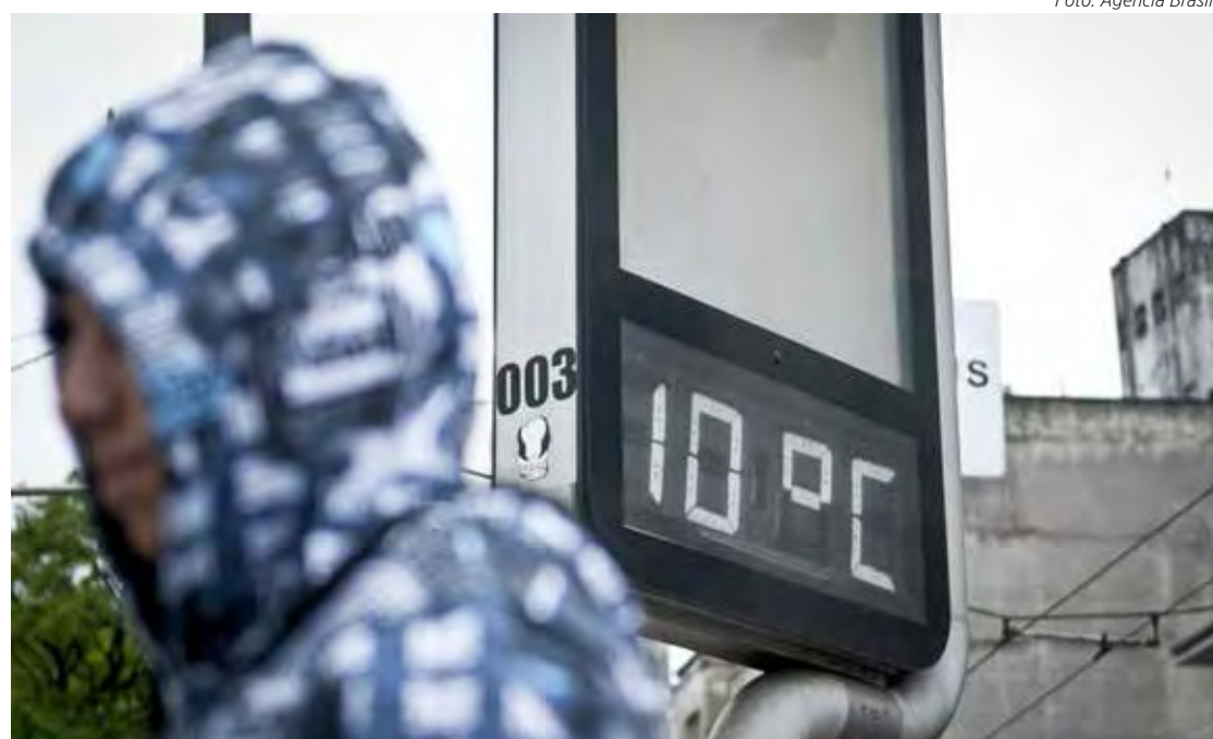
Temperatura deve ficar entre 8°C e 10°C neste final de semana em Rio Claro, segundo previsão do Ceapla/Unesp

Apesar do frio, essa não foi a mais baixa temperatura registrada neste ano na cidade. Segundo Burigo, esse recorde ocorreu no dia 16 de maio quando os termô-