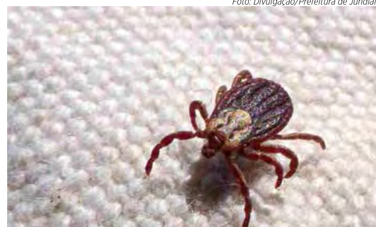
Febre maculosa é transmitida por meio da picada do carrapato estela

A febre maculosa, também conhecida como doença do carrapato, é uma infecção febril de gravidade variável, com elevada taxa de letalidade. A doença não é transmitida de pessoa para pessoa, mas por meio da picada do carrapato estela. Por isso, para preveni-la, o ideal é evitar locais onde haja exposição a esses