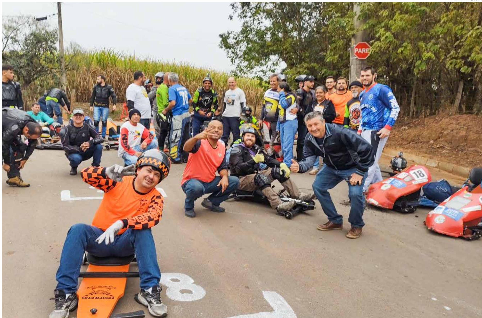
Descida do Cadeião é desafio para os pilotos do 2º GP de Rolimã