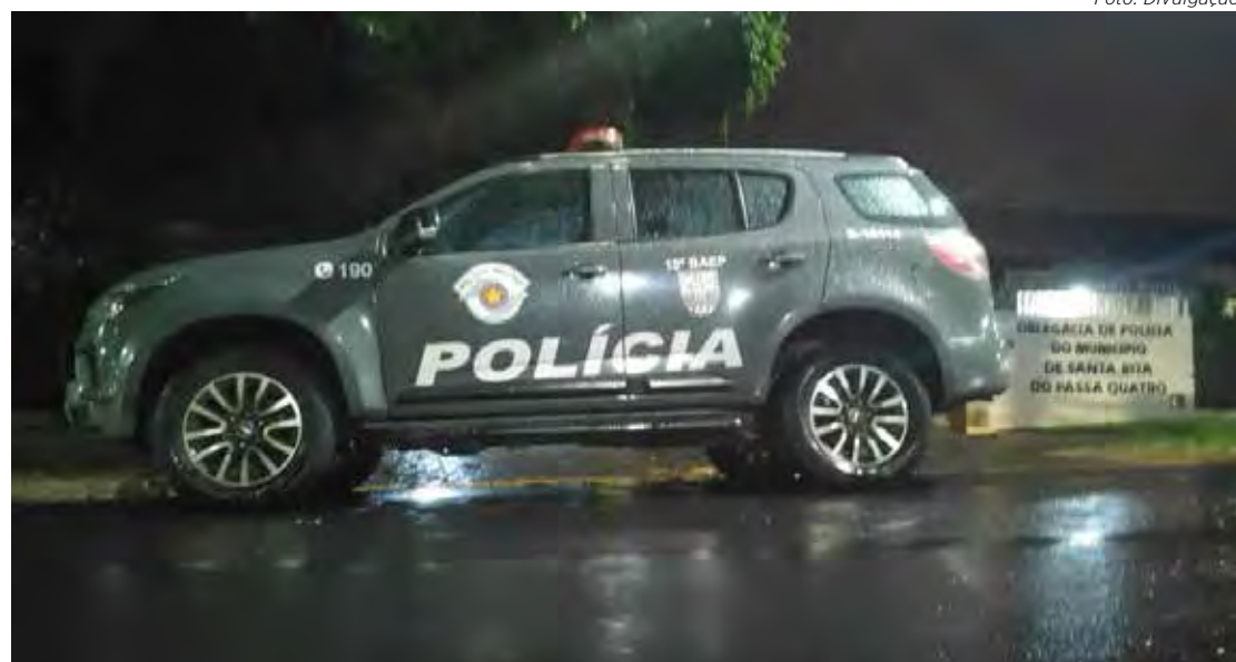
Policiais do 10º Batalhão de Ações Especiais de Polícia patrulhavam a área rural de Tambaú quando foram acionados para dar apoio ao policiamento da área após o roubo

Segundo informações do boletim de ocorrência, os três suspeitos roubaram uma casa em Porto Ferreira (SP) e fugiram levando um carro, modelo Audi A3, e uma moto.