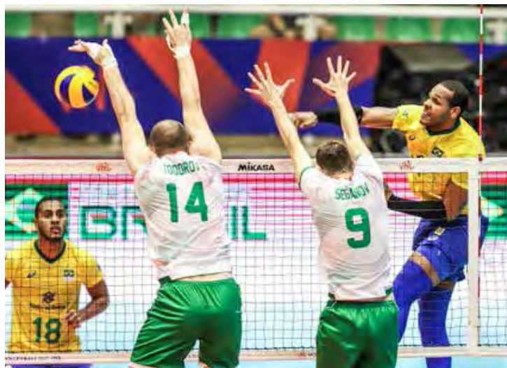
Brasil enfrenta Bulgária no dia 20, pela Liga das Nações

Todos os jogos terão transmissão ao vivo pelo canal Sportv2.