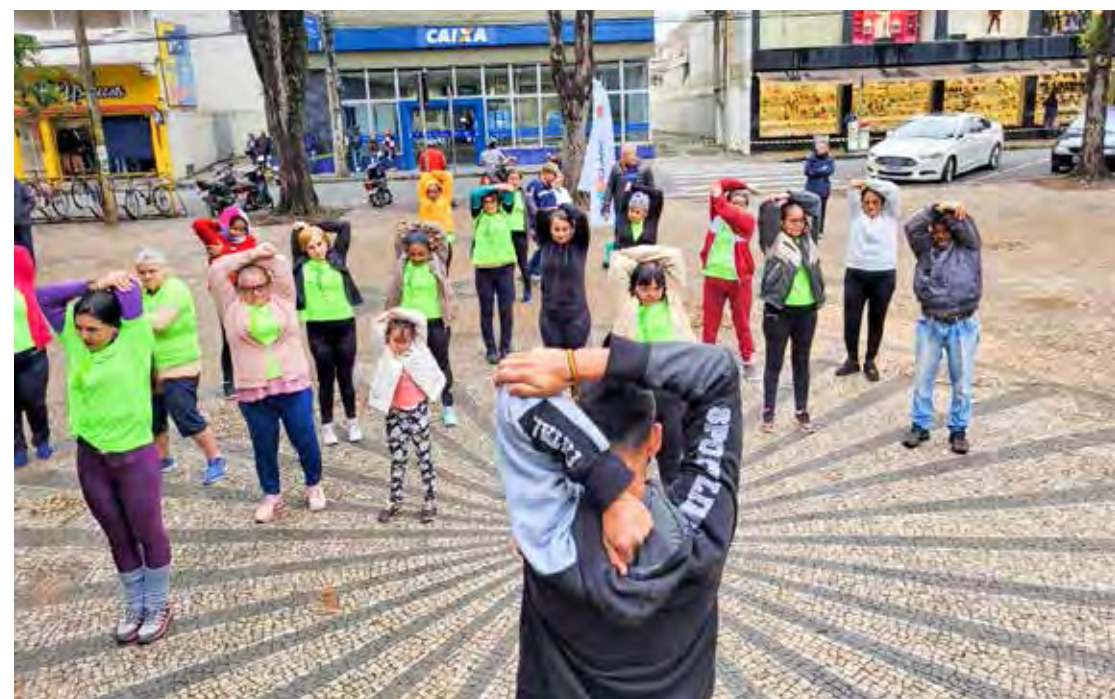
Evento foi realizado na sexta-feira com dança, caminhada, orientação nutricional, vacinação e testes rápidos

Neste sábado e domingo (18) o município de Rio Claro realizará a 13ª edição da Black June, a maior festa junina black do estado de São Paulo. Neste ano, o evento, que sempre era feito no bairro Bela Vista, terá novo local: será na antiga estação ferroviária, no centro histórico da cidade.