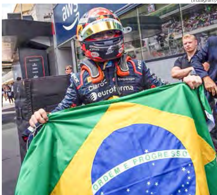
Enzo Fittipaldi foi ao pódio na corrida principal

Oliver Bearman controlou a corrida principal da Fórmula 2 na Espanha e garantiu o terceiro triunfo do ano, seguido por Enzo Fittipaldi, em ótimo fim de semana, que conquistou o segundo pódio na temporada 2023 e saltou na classificação. Quem fechou o pódio foi Victor Martins.