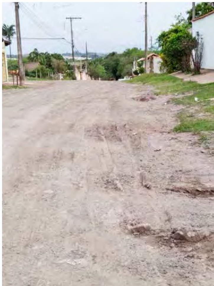
Rua sem asfalto no Jardim Nova Rio Claro