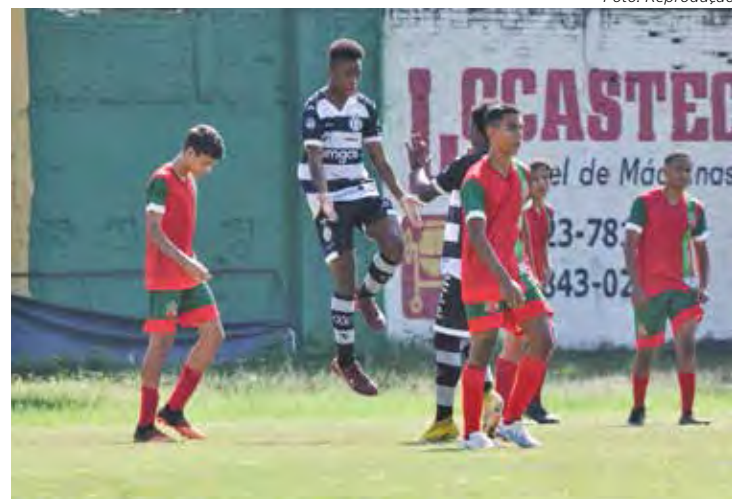
Velo não foi bem com a base neste final de semana