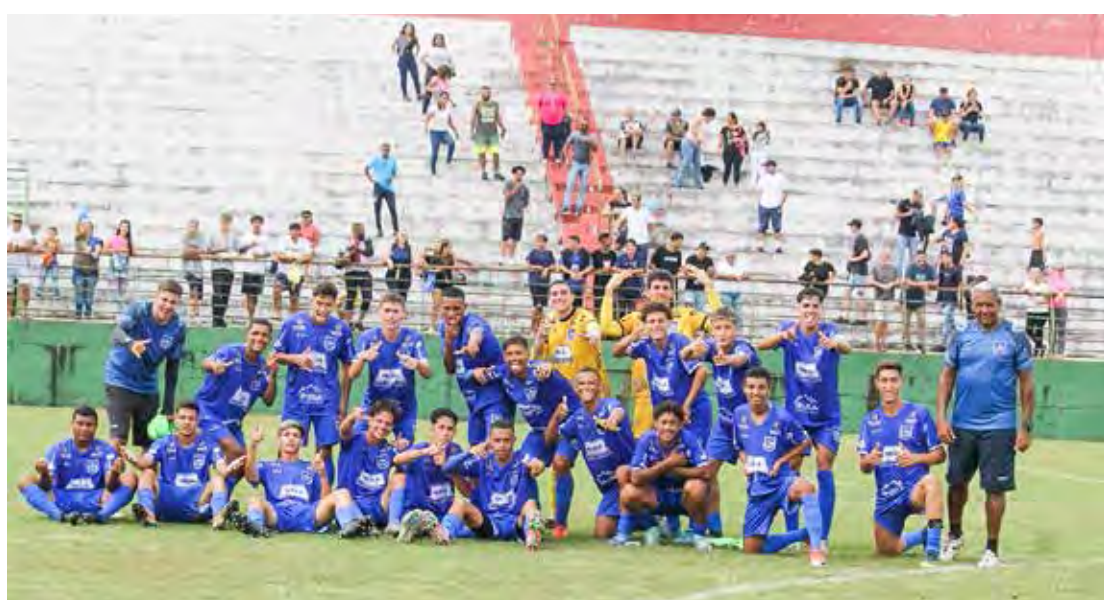
Categorias de base do Rio Claro foram bem neste final de semana

O Sub-11 venceu por 2x0 e o Sub-13 goleou por 4x0. Mas não parou por aí. No sábado (3), foi a vez das categorias Sub-15 e Sub-17 receberem a visita do União São João de Araras, no estádio