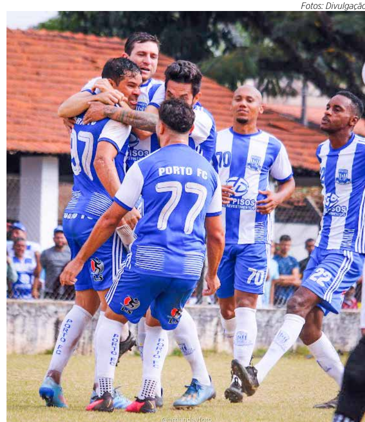
Porto FC tem jogado grande futebol e vencido os adversários