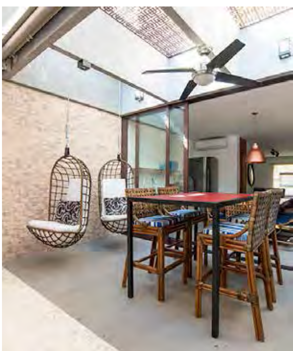
Neste projeto da Arquiteta Patrícia Miranda, foram instaladas poltronas suspensas na área gourmet, o que trouxe mais conforto ao ambiente