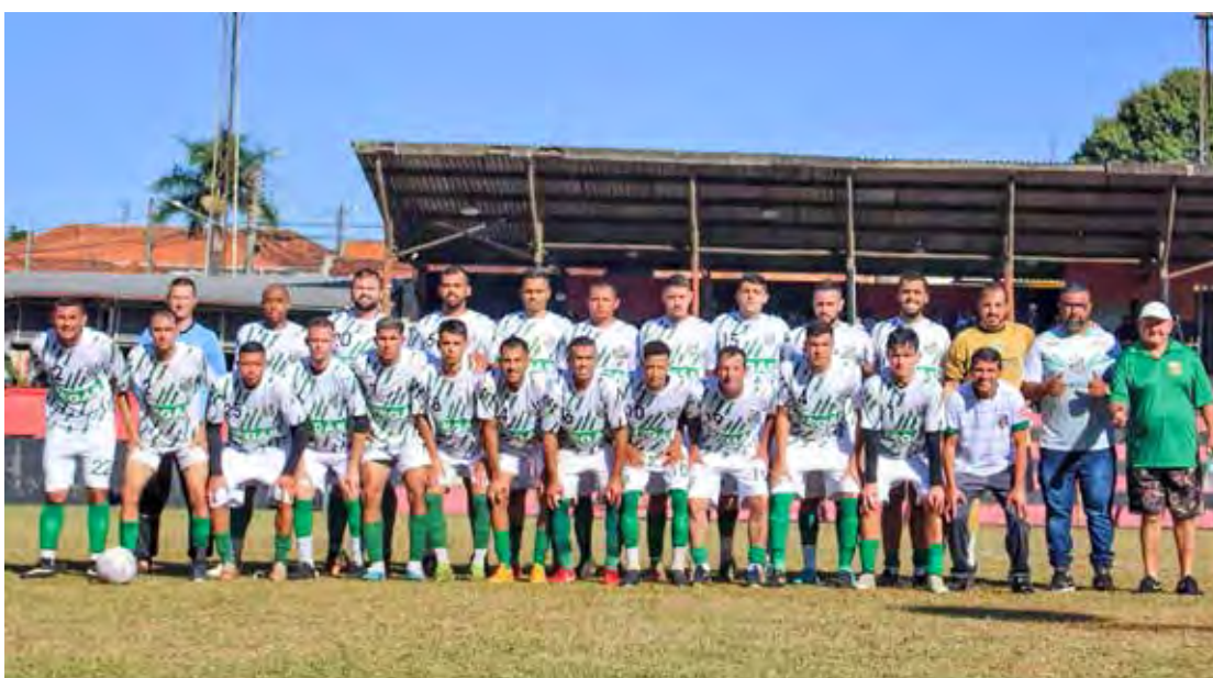
Unidos EC está na final da 1ª Copa da Liga

Liga Municipal de Futebol, informa que a grande decisão, entre Porto FC de Santa Gertrudes e Unidos EC, acontece no próximo domingo (11), no estádio III Distrital, às 9 da manhã.