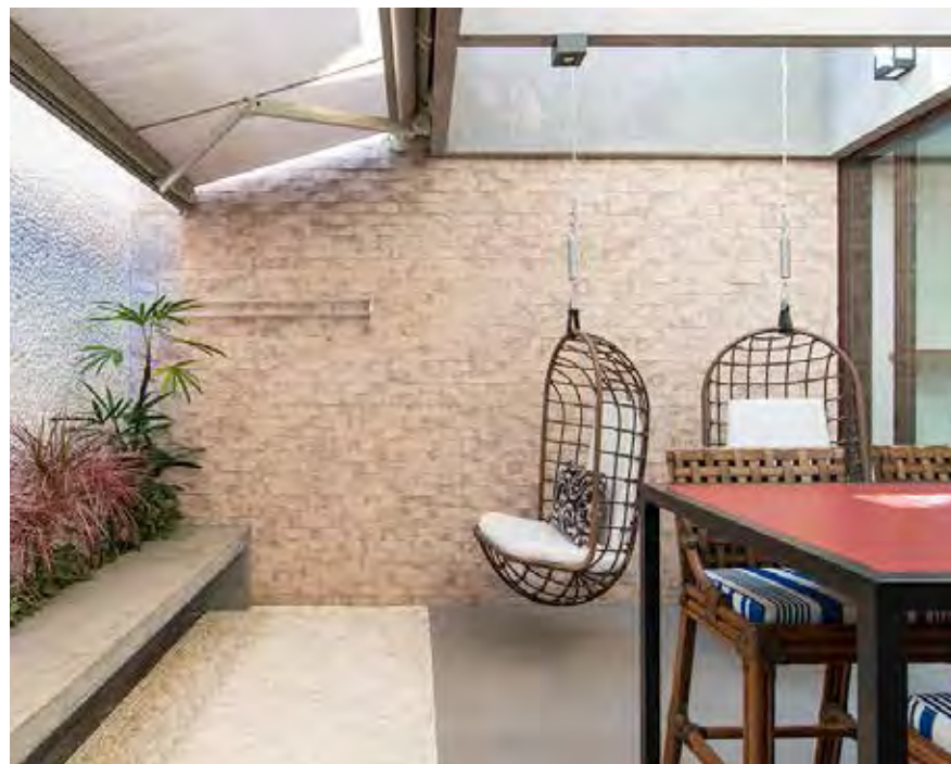
Uma sala de jantar integrada a área gourmet, nesta residência praiana. As poltronas suspensas projetadas pela arquiteta deixou o ambiente com maior amplitude