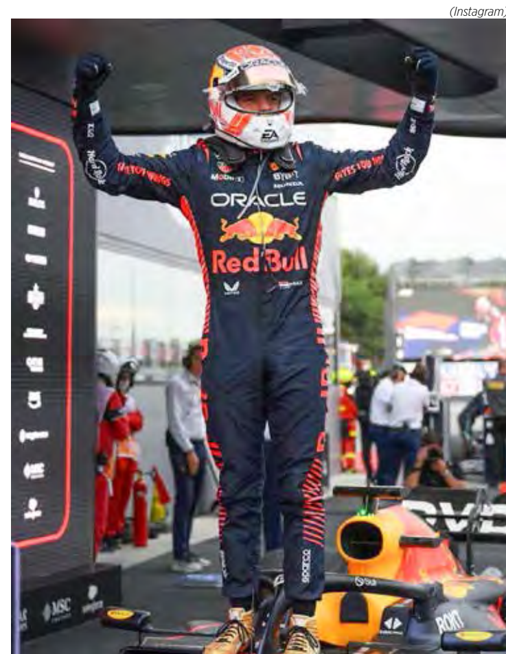
Holandês está na liderança com 170 pontos enquanto Pérez tem 117 e Alonso 99

O piloto brasileiro Helio Castro Neves foi 19º com a Meyer Shank Racing. A próxima etapa da IndyCar 2023 é o GP de Road America, em 18 de junho.