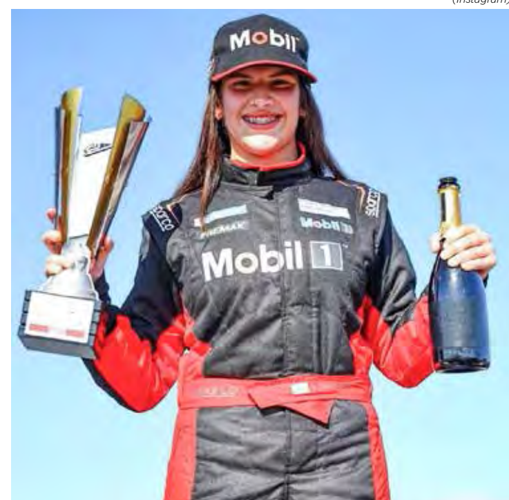
Em sua temporada de estreia na categoria, jovem de 17 anos entra para a história com primeira vitória feminina