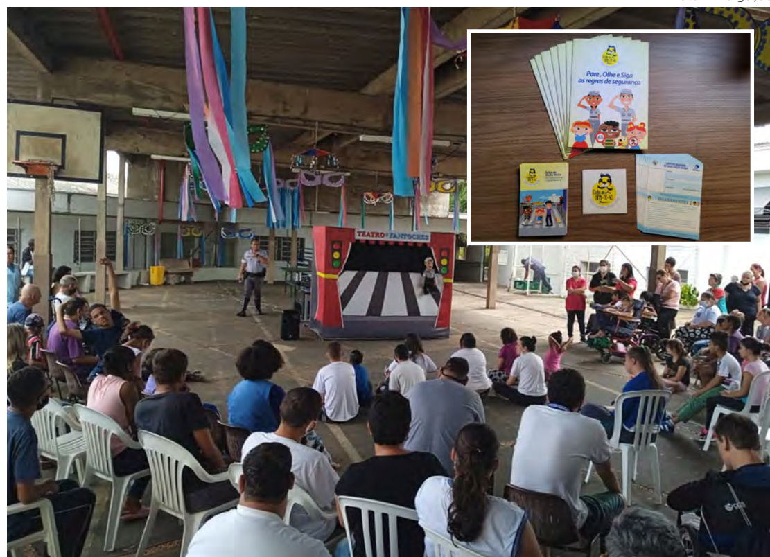
Ações são voltadas ao público infantil e estão ocorrendo em quatro escolas da cidade.

Além dos materiais didáticos, os alunos também são apresentados ao aplicativo do Clube do Bem-Te-Vi - Detran-SP. A ferramenta fornece uma carteira de habilitação mirim quando algumas as atividades são concluídas. Dentro do espaço virtual,