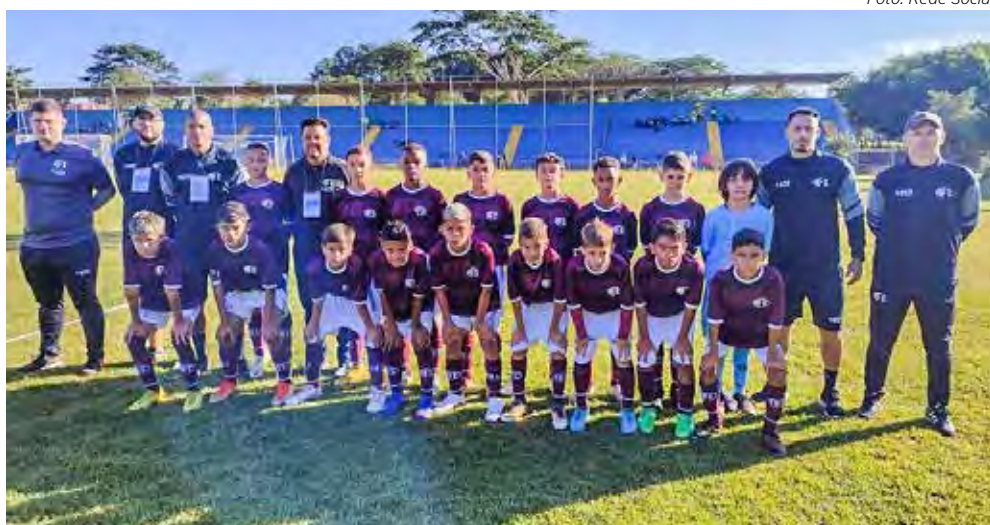
Time Sub-11 da Ferroviária, que derrotou o Rio Claro FC por 3x2