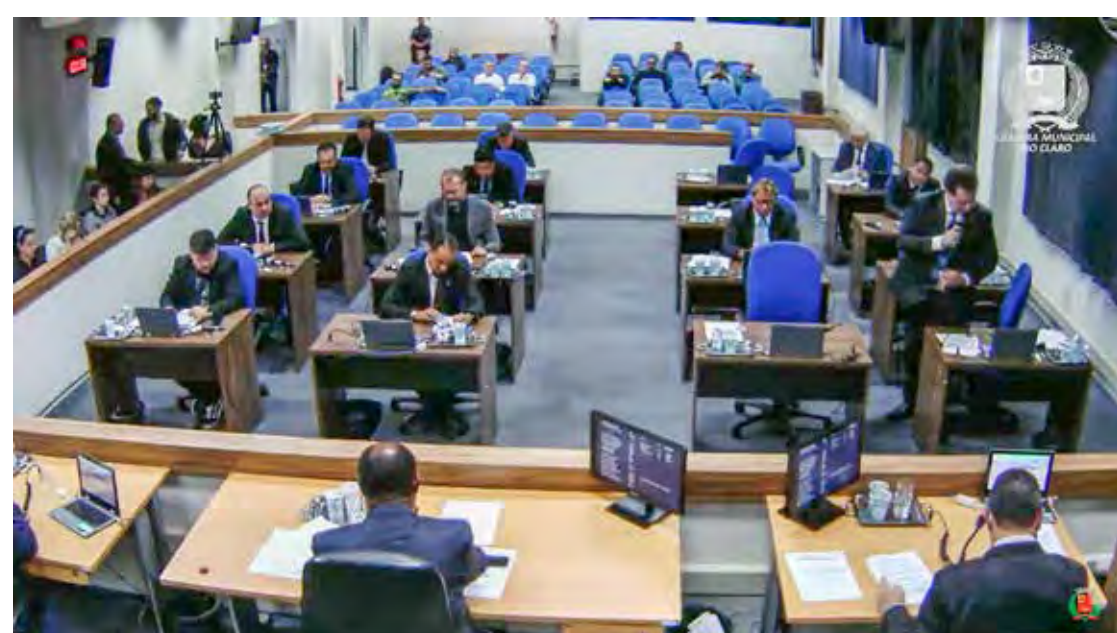
Vereadores aprovaram 15 projetos de lei na sessão ordinária desta segunda-feira