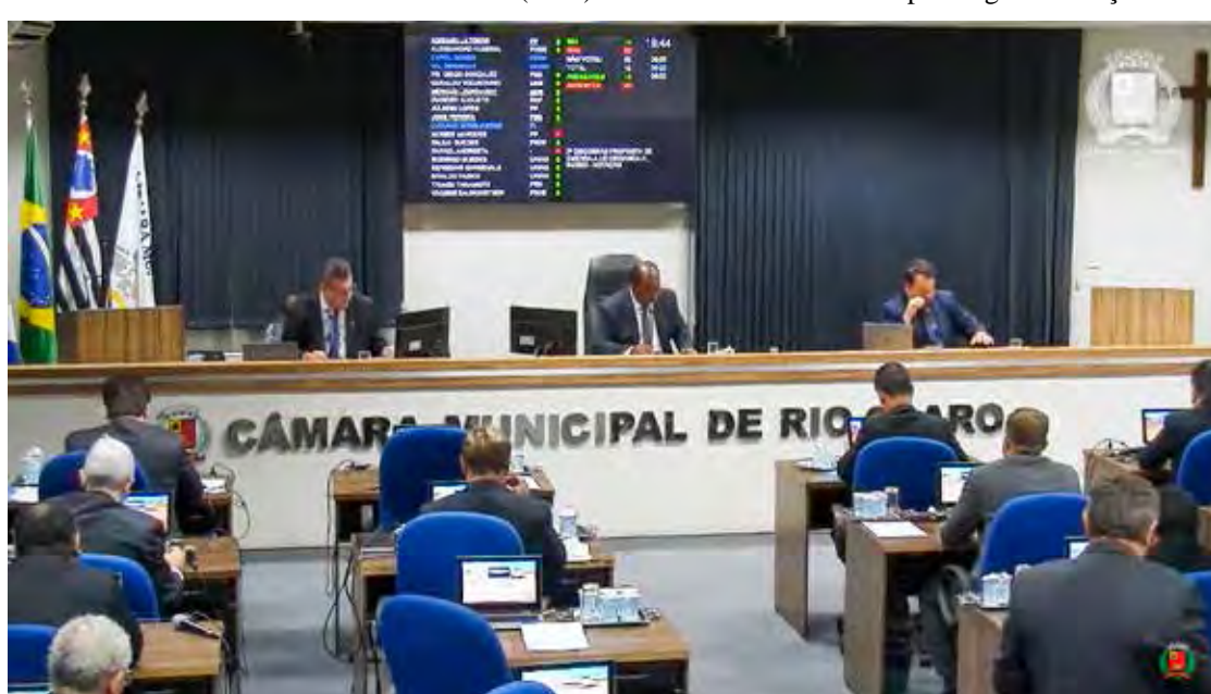
Vereadores que compõem a mesa diretora conduziram os trabalhos