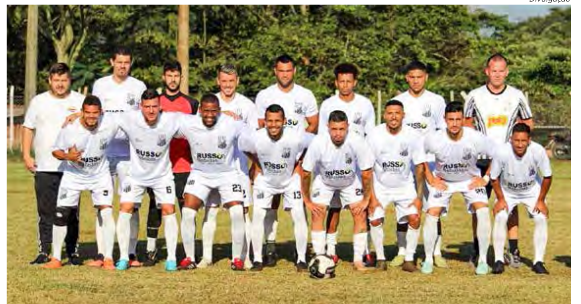
Santana tem dura missão contra o Porto FC.

O Departamento Técnico da Liga Municipal de Futebol informa que a fase quartas de final e semifinal da 1ª. Copa da Liga serão disputadas em partida única. Havendo empate no tempo normal de jogo, a decisão da vaga será na disputa de pênaltis.