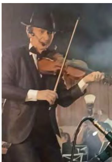
Silviolino em grande estilo, atraindo olhares e aplausos

Apesar das lamentações, aguardemos o próximo ano para apreciar novamente essa produção de grande sucesso.