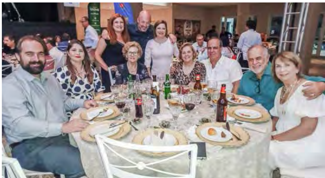
Quando o assunto é beneficente encontramos essa equipe.. Rotary Club Rio Claro Cidade Azul, unidos e festivos!