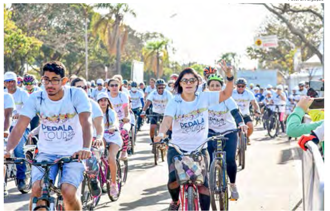
Pessoas de todas as idades podem participar do passeio ciclístico deste domingo

A realização do evento é do Pedala Rio Claro, com apoio da prefeitura por intermédio do Fundo Social de Solidariedade e da Secretaria Municipal de Mobilidade Urbana e Sistema Viário.