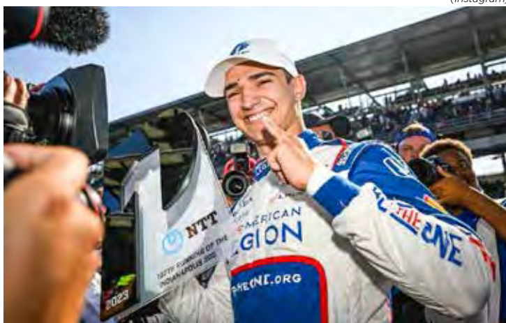
Álex Palou larga da pole na Indy 500