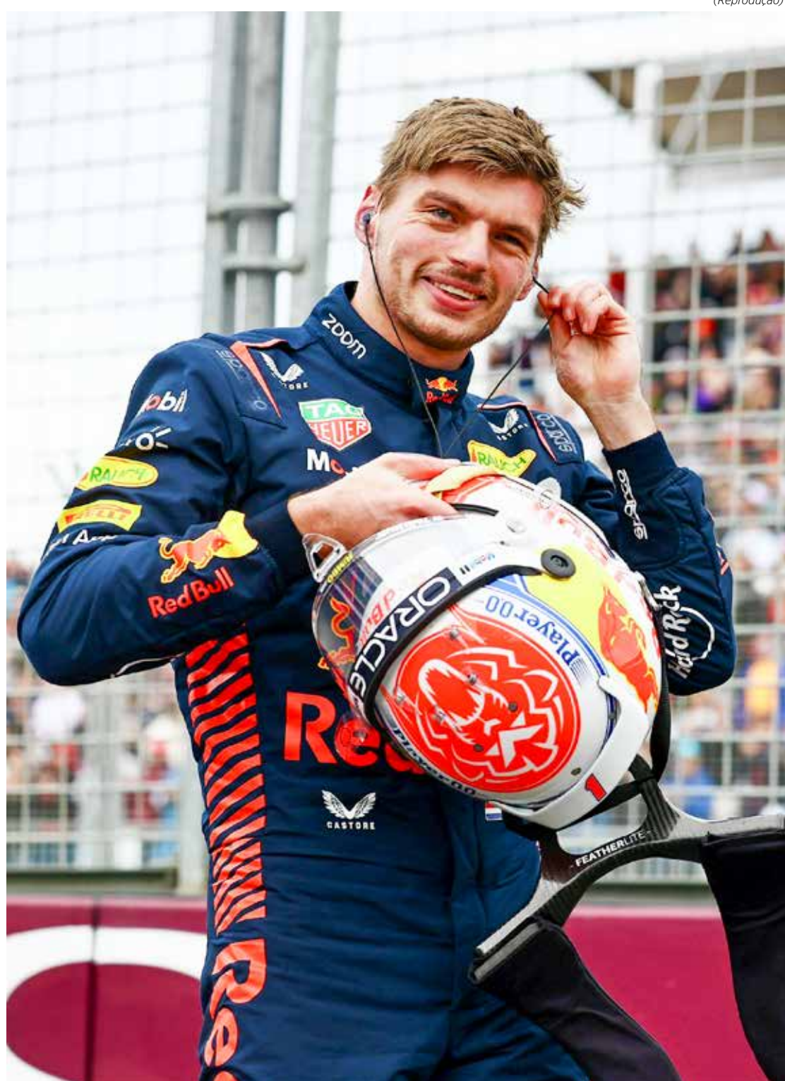
Max Verstappen, da Red Bull, se prepara para o treino classificatório do GP de Mônaco