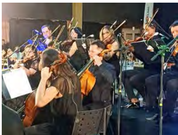
Orquestra Filarmônica Rioclarense, na foto apenas uma parte dela, mais uma vez é show e nota máxima de apreciação