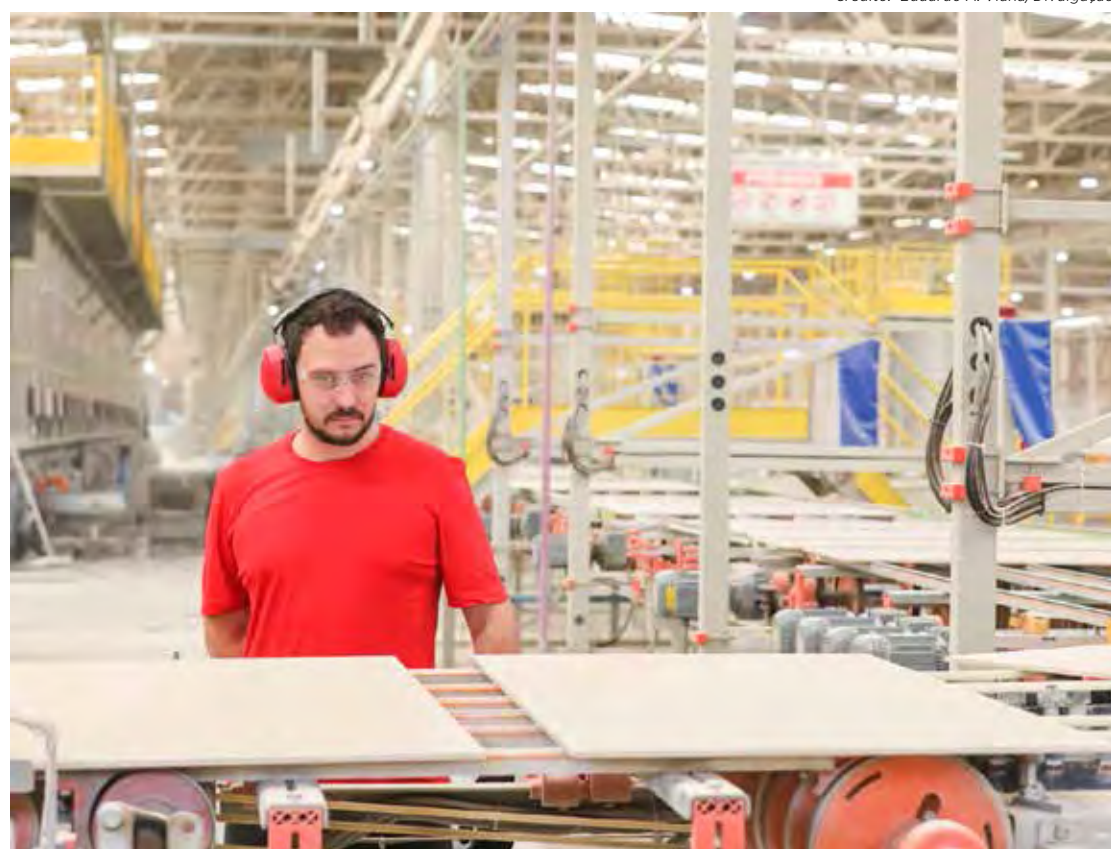
Dia do Ceramista é comemorado neste domingo, dia 28 de maio