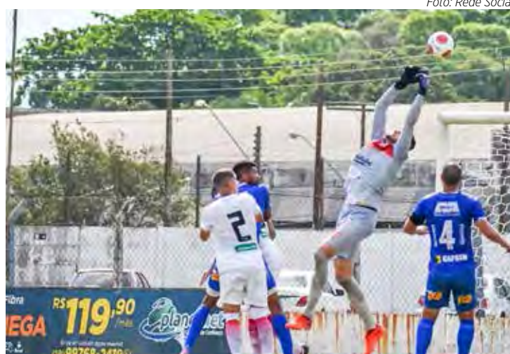
Rio Claro FC Sub-20 joga em São Carlos

Tudo começa no período da manhã, no estádio Schmidtão, às 9 horas, quando a garotada boa de bola do time Sub-11 do Azulão recebe a Ferroviária de Araraquara pela 2ª. rodada do campeonato promovido pela Federação Paulista de Futebol. Em seguida, às 10h30, será a vez do Sub-13 de Rio Claro FC e Ferroviária medirem forças. Vale destacar que não