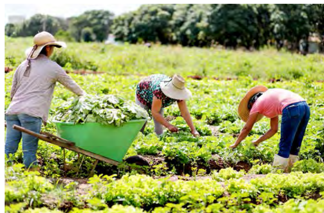
Colheita de Hortaliças em Propriedade Rural de Rio Claro

Parabéns a todos aqueles que suam o “COLHER”, com seu suor e dedicação, garantindo o crescimento da economia e o sustento da população.