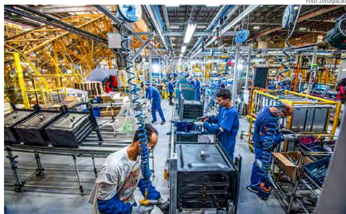
Linha de produção da Whirlpool na fábrica em Rio Claro

Nesse cenário, a diversidade industrial de Rio Claro é uma vantagem. Em tempos de crise, o município sofre menos impacto por não se apoiar apenas em um segmento. “Rio Claro é privilegiada por ter uma indústria diversificada porque é difícil uma crise atingir vários setores ao mesmo tempo”, pontua Zaine observando que município se destaca nas áreas de construção civil, linha branca, saúde com produção de medicamentos e órtese e prótese, metalurgia, química, entre outras. “É importante que a diversidade industrial de nossa cidade seja cada vez apoiada e valorizada para diminuir os riscos. É essencial trazer novos investimentos, mas também é fundamental apoiar as indústrias já instaladas que geram empregos e riqueza ao município há muitos anos”.