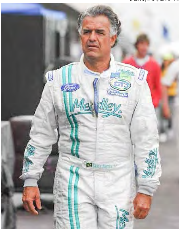
Ex-piloto e empresário recebeu diversas homenagens e manifestações nas redes sociais.

Ao final de sua carreira nas pistas, investiu no ramo empresarial. Ele fundou a Medley, maior