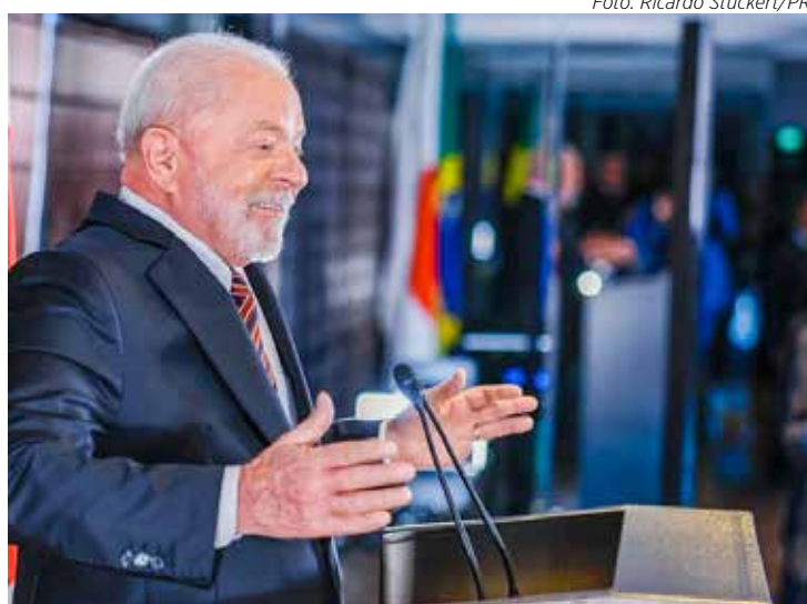
O presidente Lula confirmou presença no evento em comemoração ao Dia da Indústria.

No evento de hoje, Lula deve anunciar as primeiras medidas da