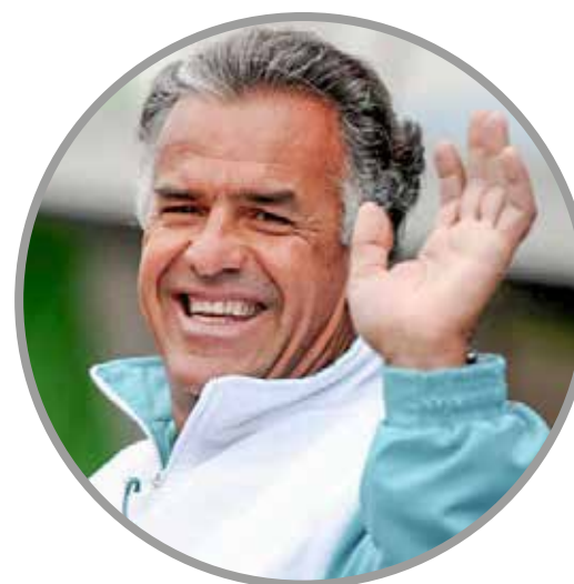
Xandy Negrão faleceu ontem aos 70 anos após longa luta contra um câncer

A morte do ex-piloto foi lamentada nas redes sociais. “Um