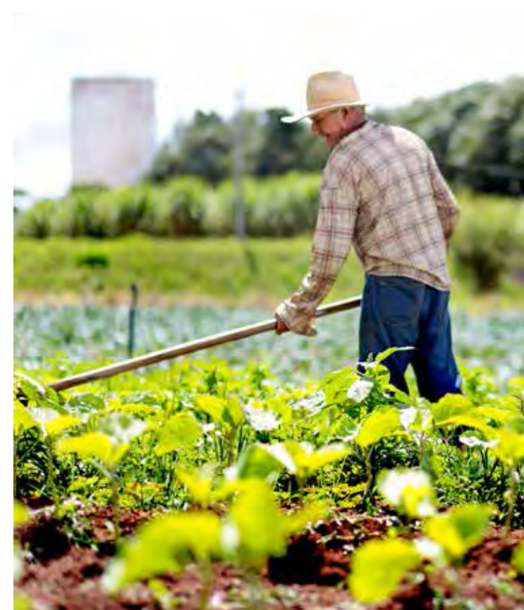
Trabalhador Rural em Propriedade do município

Para cultivar um alimento são necessárias muitas etapas, capinar o terreno, preparar a terra, plantar as sementes, regar a área e ainda proteger a plantação de pragas e ervas daninhas. Após essas etapas, tem todo o processo de colheita, beneficiamento dos produtos e transporte, para finalmente chegarem às mesas das famílias.