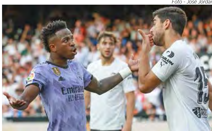
Vinicius Jr. reage a ataques racistas

Na segunda-feira (22), a polícia da Espanha resolveu agir e prendeu 3 torcedores do Valência, suspeitos de come-