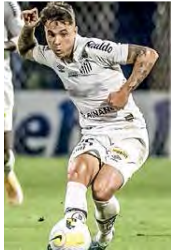
Soteldo reforça o Santos na Sulamericana