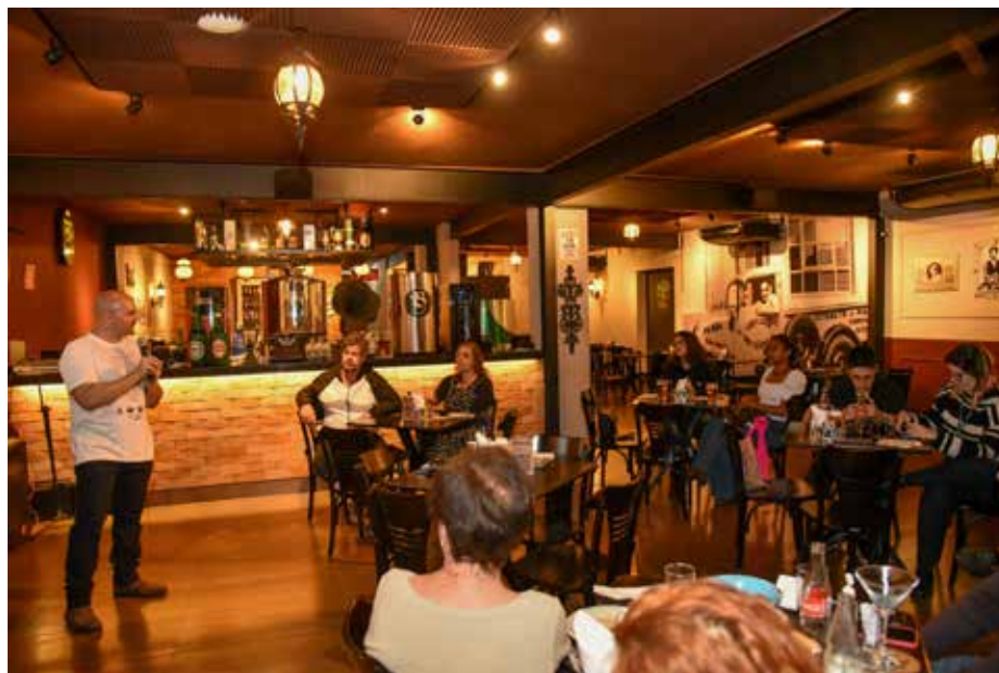
Os debates do Pint of Science 2023 são realizados em quatro bares de Rio Claro

O evento foi criado para proporcionar debates sobre tópicos científicos com quem faz ciência. É realizado por voluntários e é uma organização sem fins lucrativos. O Pint é realizado durante três dias anualmente e de forma