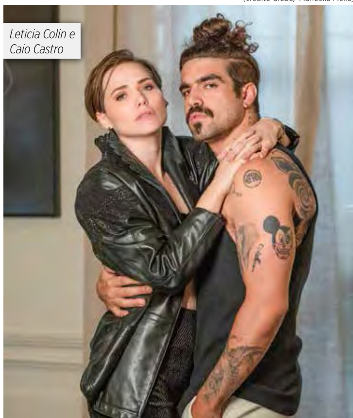
Leticia Colin e Caio Castro

Está tudo muito no comecinho ainda, mas como já tem conversa rolando, Tirullipa poderá apresentar um novo programa de humor no SBT. Já existem ordens para se gravar um piloto o mais rápido possível.