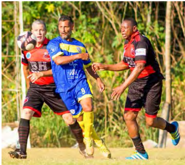
Master 5.0 joga aos sábados à tarde