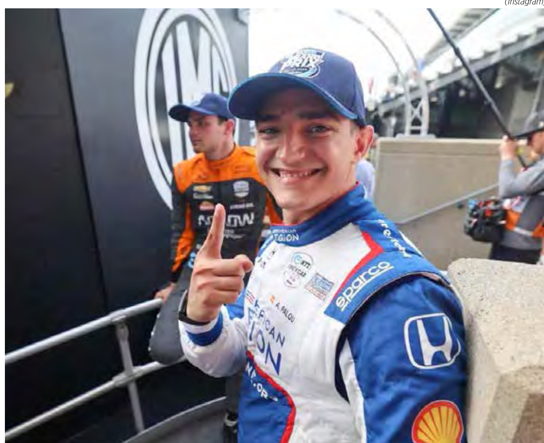
Campeão de 2021, Álex Palou larga na frente nas 500 Milhas de Indianápolis

A tradicional corrida será disputada no próximo domingo, dia 28 de maio.