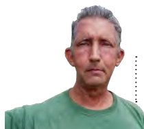
O autor é Gestor Ambiental willytecnofish@hotmail.com @grassmannambiental