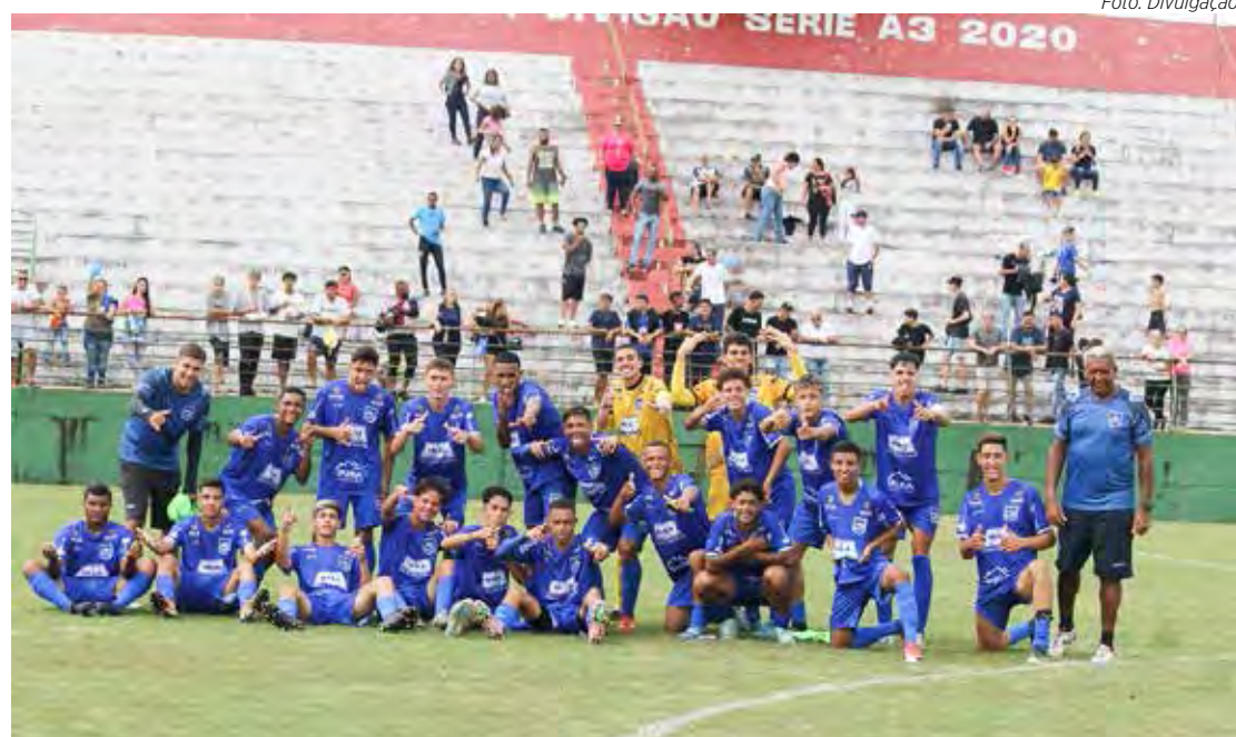
Base do Rio Claro FC fez a festa no Benitão