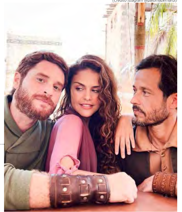
Bateseba vai mexer com Davi e Urias