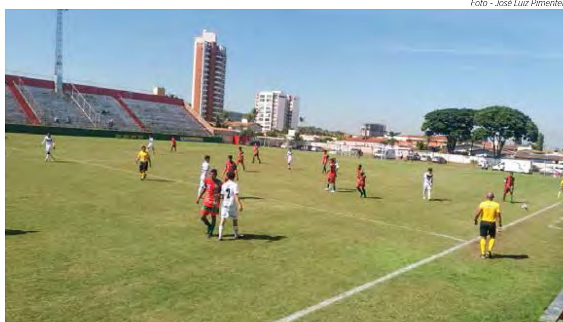
Velo Clube venceu União S. João por 2x0, no Sub-17