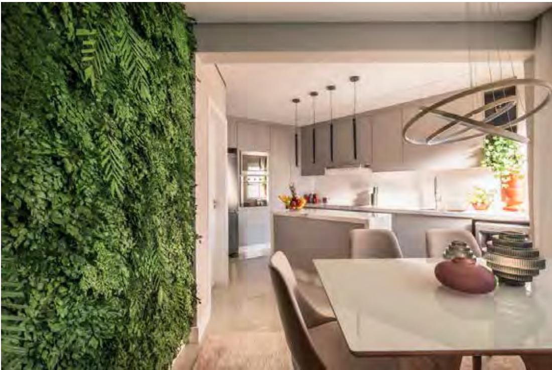
Própria para ambientes internos, as plantas preservadas podem ser cultivadas em jardins verticais, vasos, canteiros e cachepots, de acordo com a arquiteta e paisagista Priscila Tressino

Projetos de PB Arquitetura - Fotos: Photons Fotografia | Henrique Ribeiro