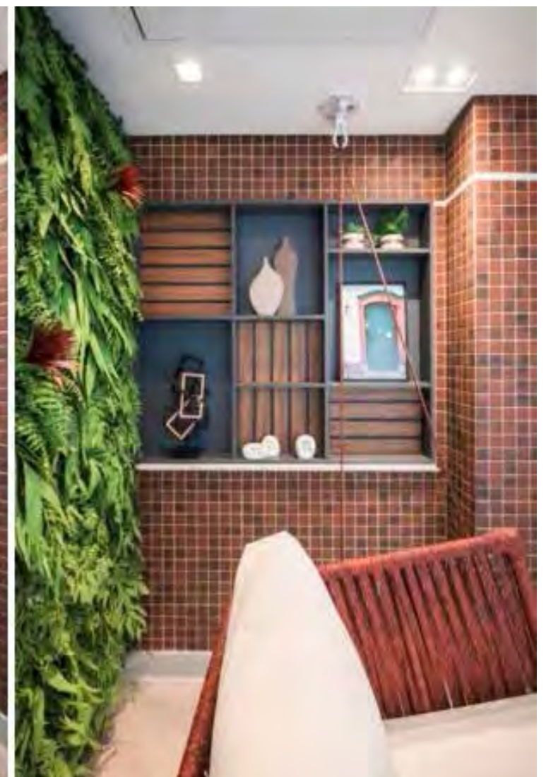
Versátil, o jardim vertical é sempre muito bem-vindo dentro de qualquer estilo decorativo