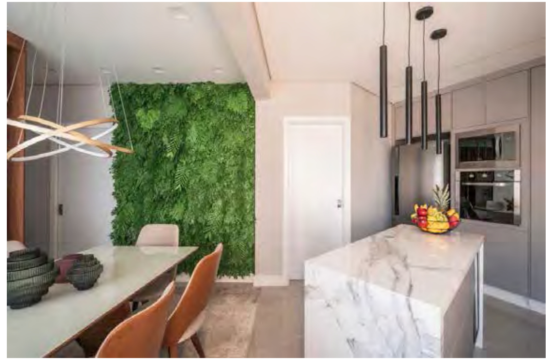
A parede verde de espécies preservadas trouxe um mix de vida, frescor e leveza para a sala de jantar integrada à cozinha