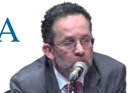
Auditor fiscal, presidente do Instituto Justiça Fiscal, coordenador da campanha Tributar os Super-Ricos