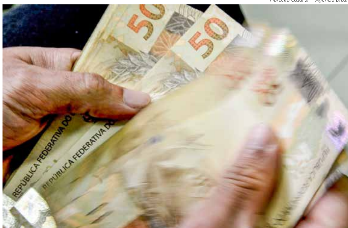
Cruzamento de diferentes bases de dados aponta que 468 mil famílias fora do perfil de renda do programa

Desde o início do ano, o programa social voltou a se chamar Bolsa Família. O valor mínimo de R$ 600 foi garantido após a aprovação da Emenda Constitucional da Transição, que permitiu a utilização de até R$ 145 bilhões fora do teto de gastos neste