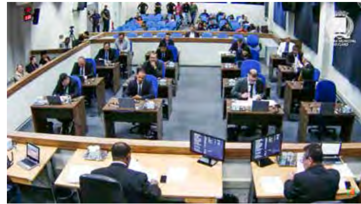
Vereadores em plenário na sessão extraordinária desta terça-feira, dia 16 de maio

Também foi aprovado projeto de autoria de vereadores que altera dispositivos da Lei Complementar nº 118/2017 para readequar os salários dos assessores legislativos que ocupam cargos em comissão. Detalhe: esses salários tiveram reajuste aprovado no mês passado. Os parlamentares justificam que essa alteração vai equalizar os gastos com a folha de pagamento da Câmara Municipal não gerando mais ônus com o reajuste dos salários dos vereadores.