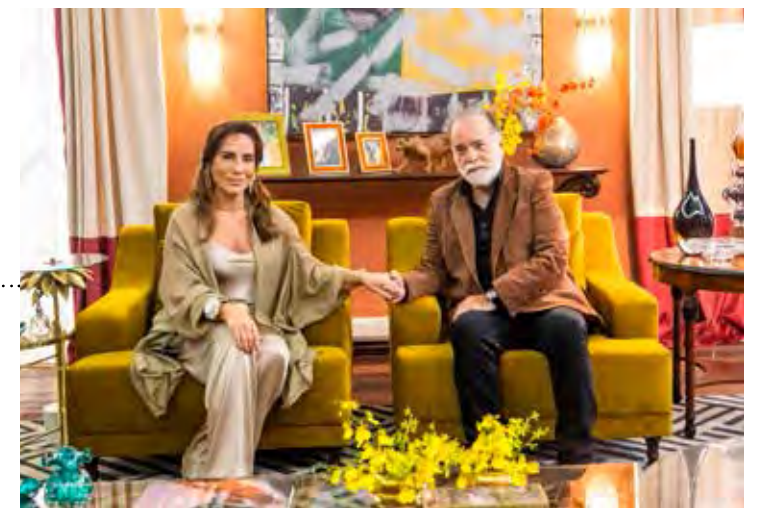
Tony Ramos e Gloria Pires nos estúdios de “Terra e Paixão”