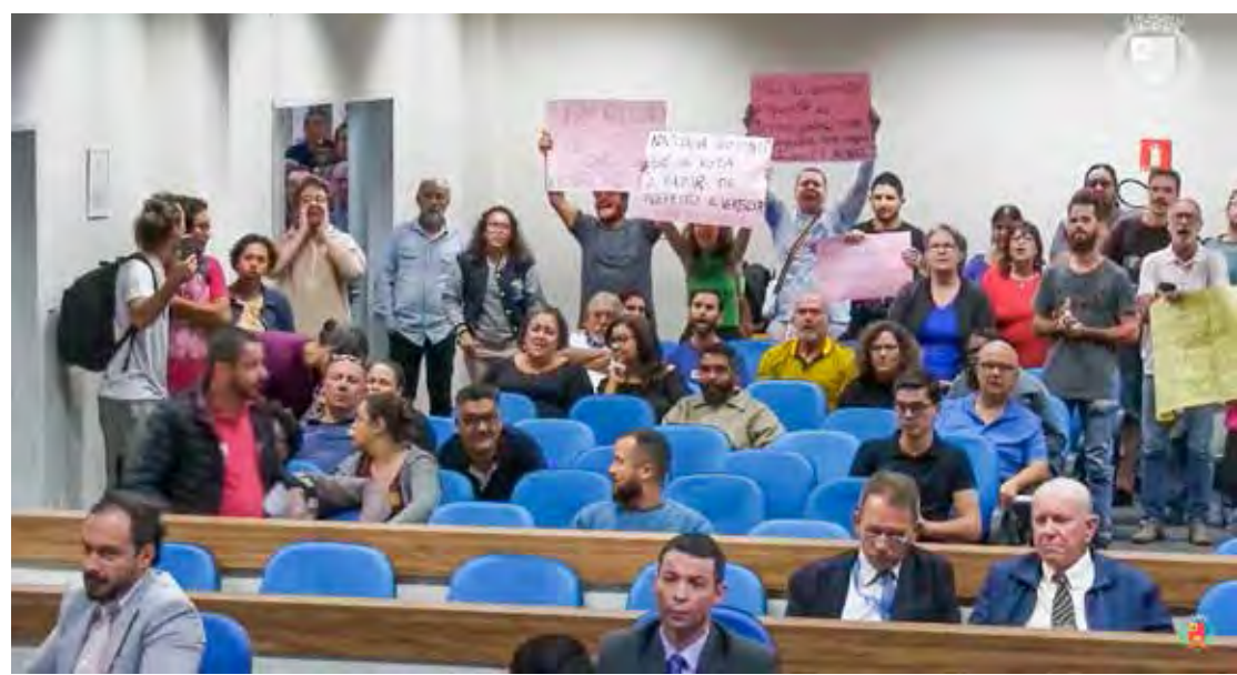
Populares munidos de cartazes acompanharam a votação do projeto de reajuste dos vereadores, do prefeito, vice-prefeito e secretários

De acordo com a Câmara, o valor segue "os limites constitucionais de 50% dos subsídios dos deputados estaduais, conforme Lei Estadual nº 17.617/2022,