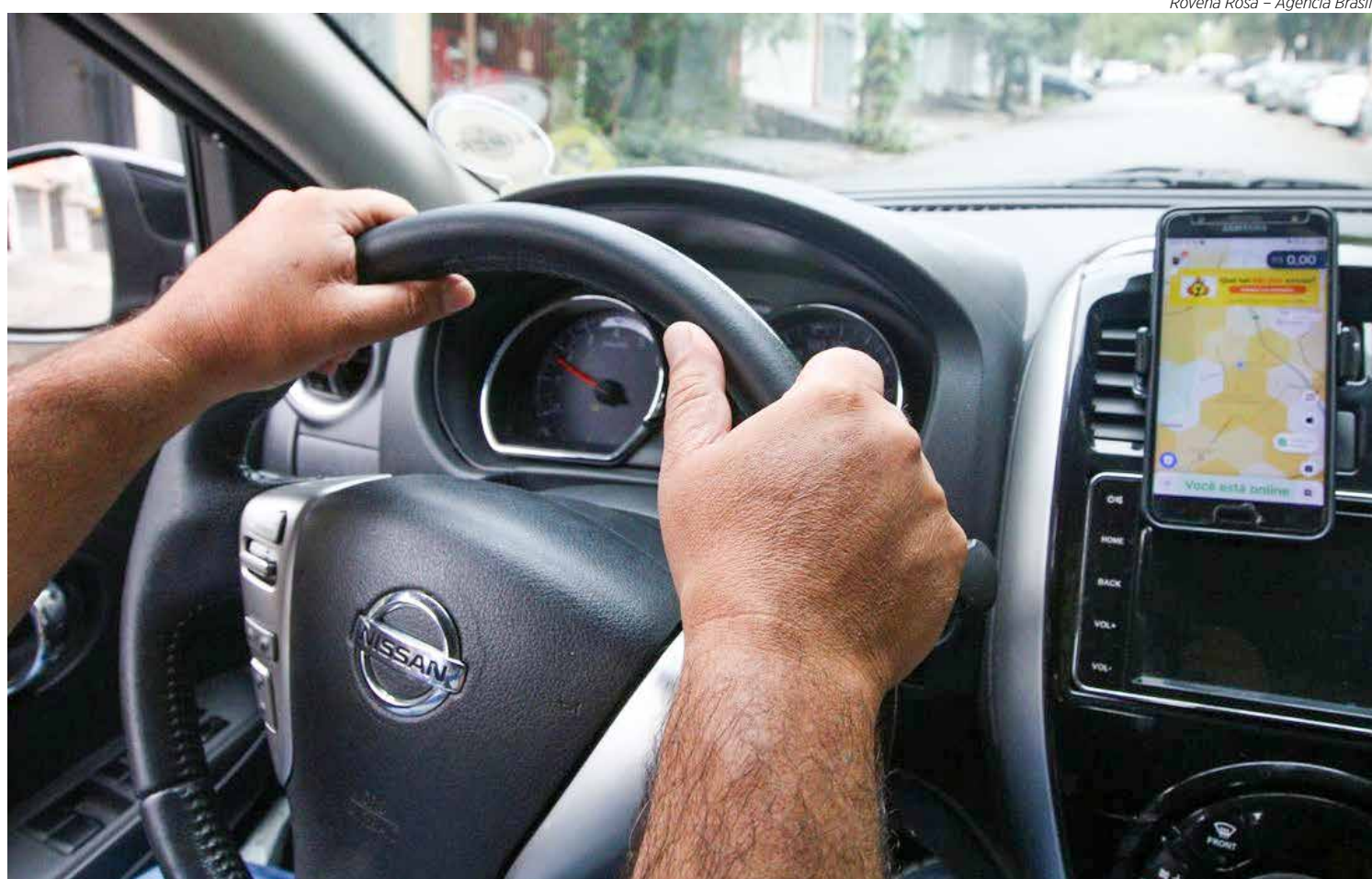
Rovena Rosa - Agência Brasil

Outra reivindicação da categoria é com relação ao sistema de cobrança. “De 2019 para cá as empresas mudaram o sistema de cobrança. Antes, você saía da sua casa para ir para o seu trabalho, por exemplo, você sabia que esse valor informado seria o mesmo que você pagaria. Atualmente não é isso mais, e com isso a taxa cobrada dos motoristas também está sofrendo essa variação. As empresas reajustaram os valores das tarifas para os passageiros, mas não repassaram para os motoristas, fazendo com que o valor de uma corrida chegue até 60% de desconto de taxa. Com isso, os motoristas