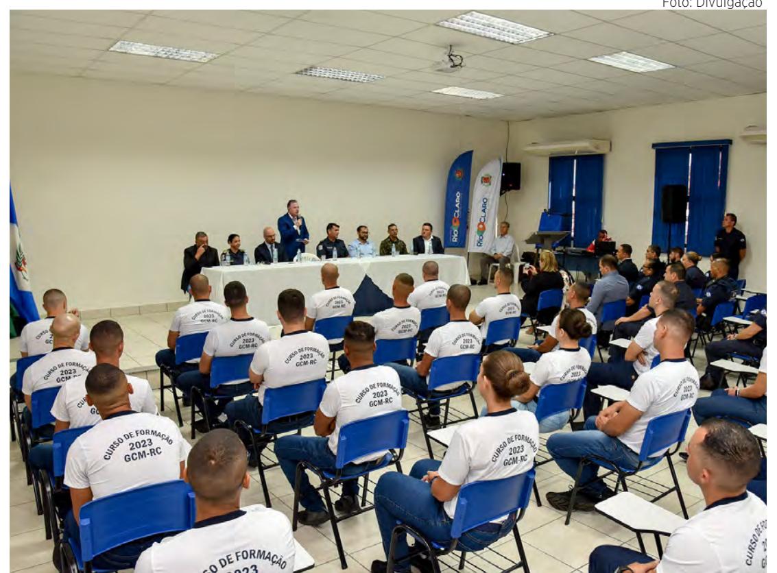
Evento foi realizado na manhã de segunda-feira (15).