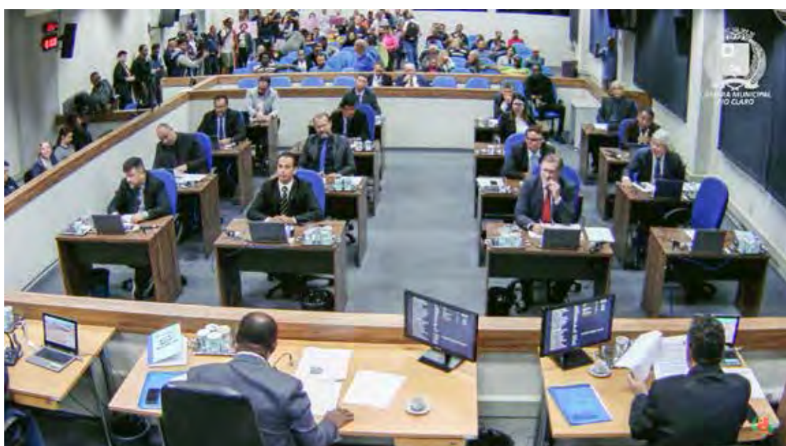
Vereadores no plenário e manifestantes ao fundo

devendo ser pago o subsídio inclusive no período do recesso legislativo".