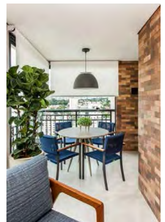
Versátil para tarde de cafés ou jogos de cartas, a mesa completa a mobília da varanda | Projeto de Gigi Gorenstein