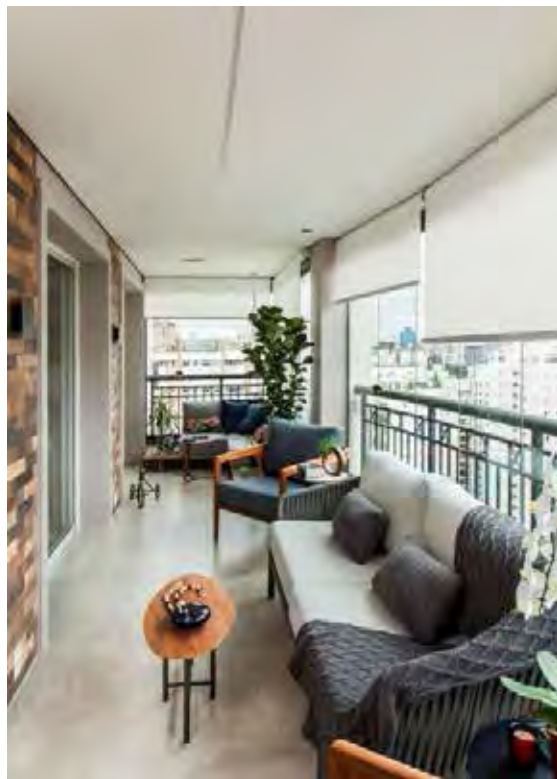
Reforma transformou varanda em living e buscou combinar elementos da estética com bem-estar | Projeto de Gigi Gorenstein