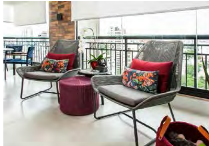
Com uma paleta mais vibrante, como o viva magenta com cinza, as poltronas complementam o espaço mais íntimo | Projeto de Gigi Gorenstein