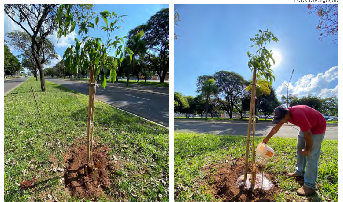
Plantio foi realizado na semana passada pela prefeitura.

Além da recomposição da arborização, o Departamento de Silvicultura também fará a manutenção das mudas de árvores recém-plantadas, de forma adequada, com irrigação, coroamento e o controle de pragas, garantindo que permaneçam saudáveis.