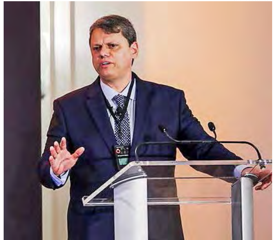
Governador Tarcísio de Freitas