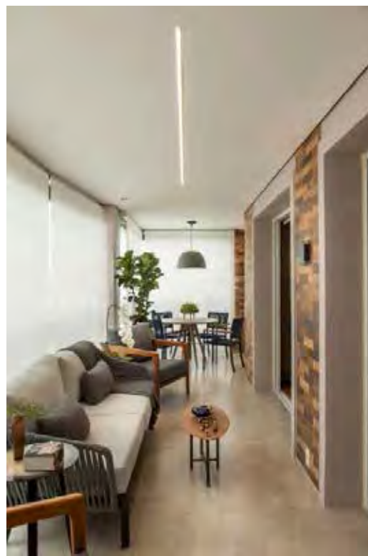
A repaginação englobou desde a substituição do revestimento do piso e paredes, todos os móveis e os itens decorativos | Projeto de Gigi Gorenstein