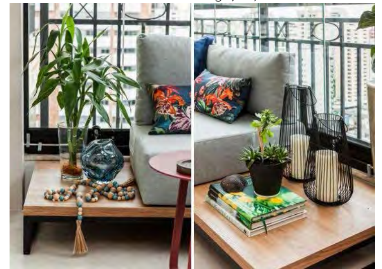
Detalhes também são importantes: o mobiliário e objetos se destacam pelo design diferente | Projeto de Gigi Gorenstein

era contornado por cortinas de vidro retrátil, deixando o ambiente mais reservado, quando necessário, sob uma paleta de tons bege. O piso de cerâmica era desnivelado, fator que dificultava a locomoção, entrada e saída do ambiente, bem como a ilumina-