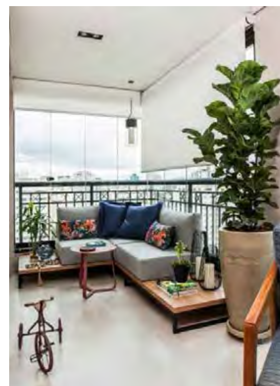
O canto recebeu um estofado suspenso em base de madeira perfeito para diversas ocasiões do dia a dia, tanto para relaxar sozinho ou receber convidados | Projeto de Gigi Gorenstein