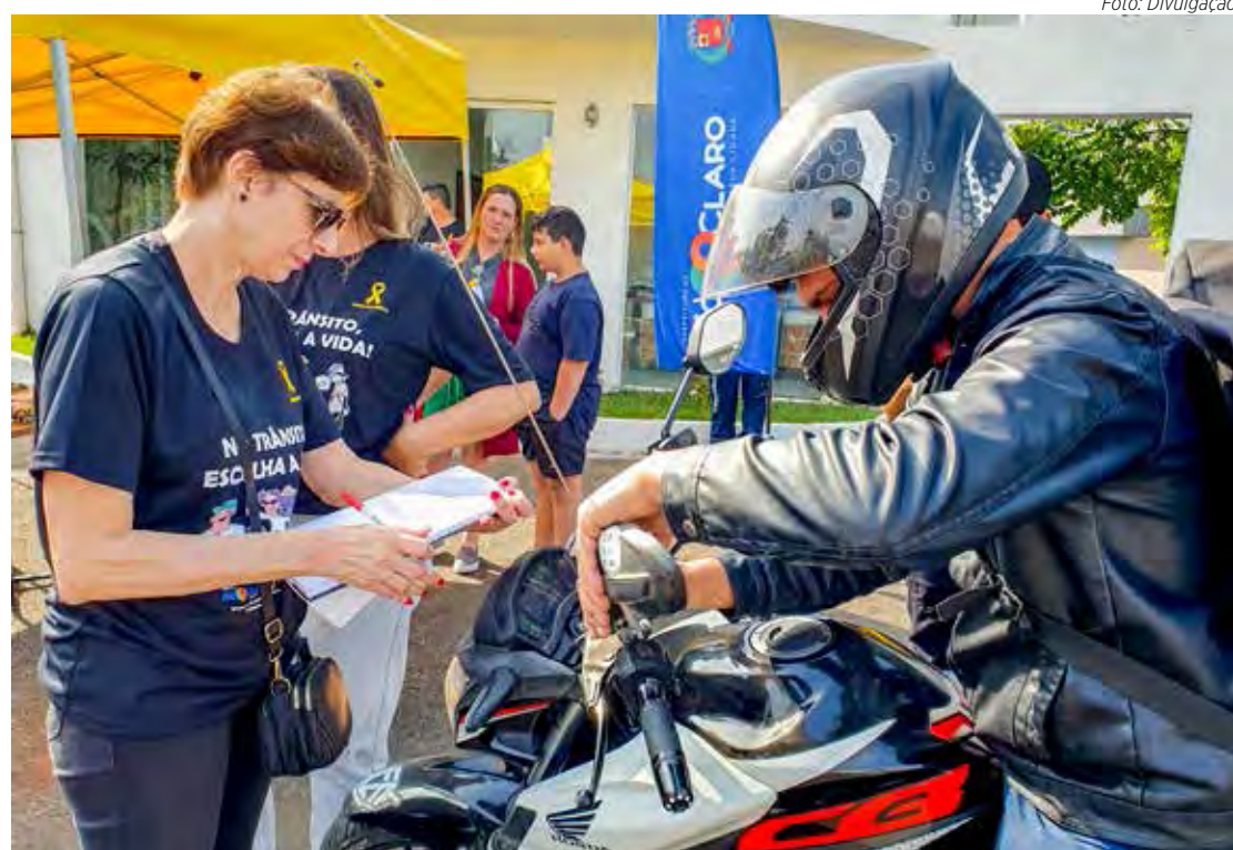
Entrega de antenas anticerol aos motociclistas faz parte da campanha “Maio Amarelo”

A Secretaria Municipal de Mobilidade Urbana e Sistema Viário programou outros dois eventos para entregar antenas anticerol aos motociclistas. Um foi realizado no sábado, dia 6, na Avenida Tancredo