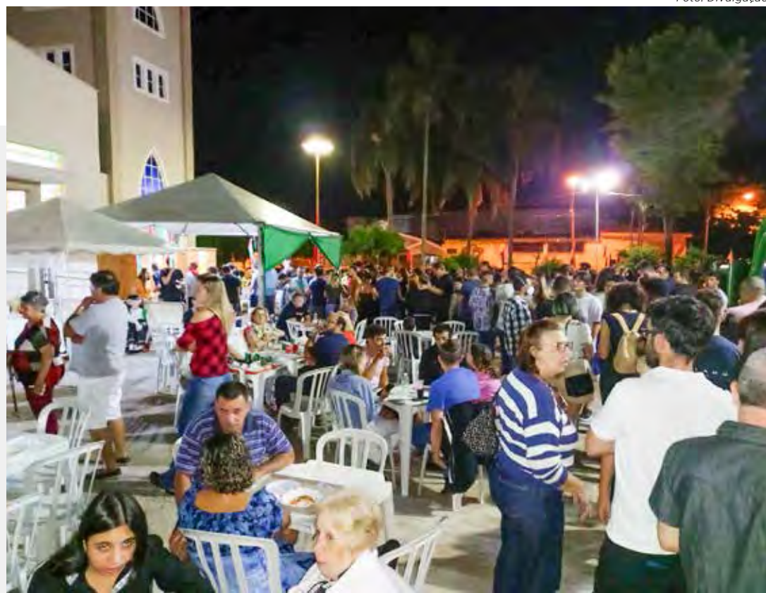
Grande público costuma prestigiar a Festa Italiana