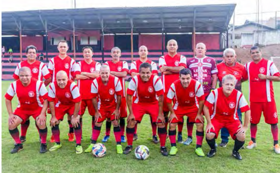
Master 5.0 IX de Julho FC