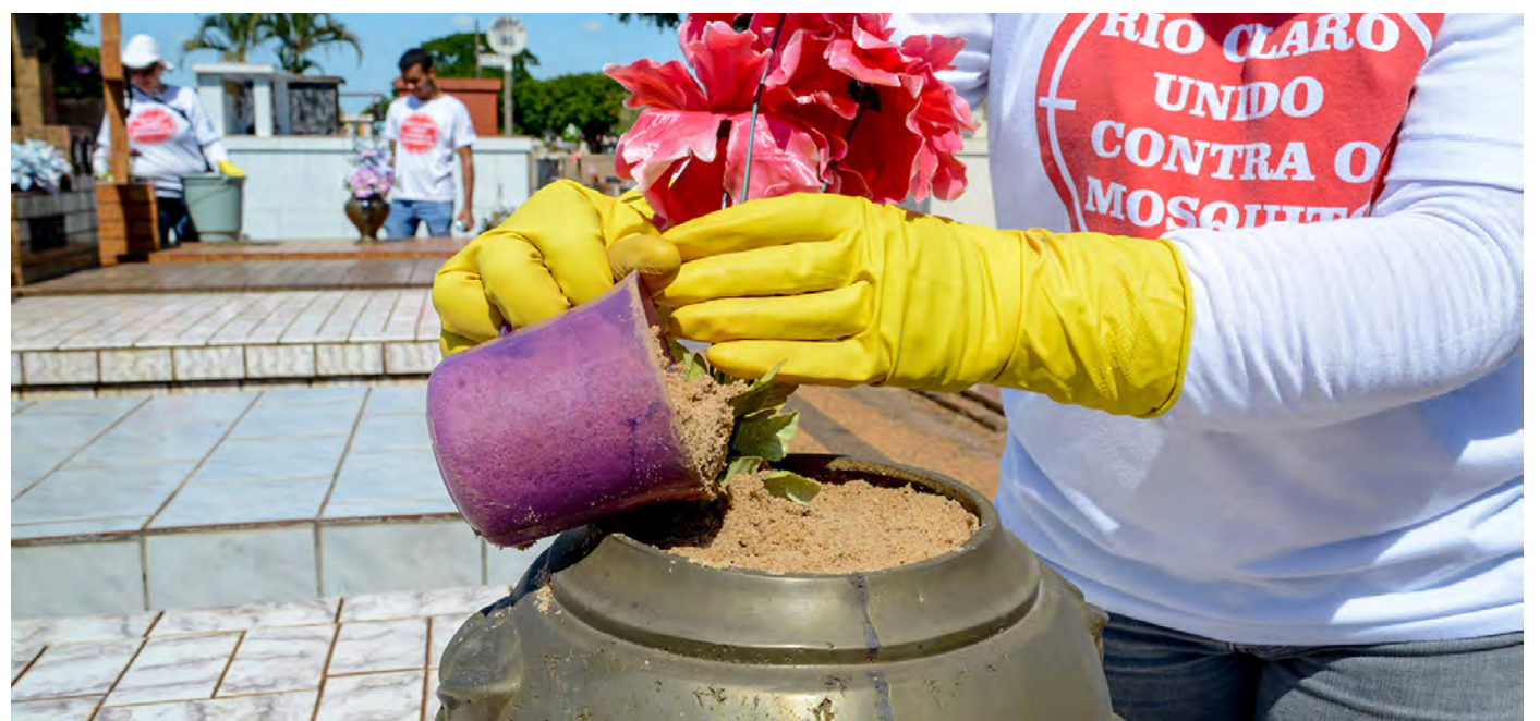
Não devem ser usados saquinhos plásticos envolvendo arranjos de flores.