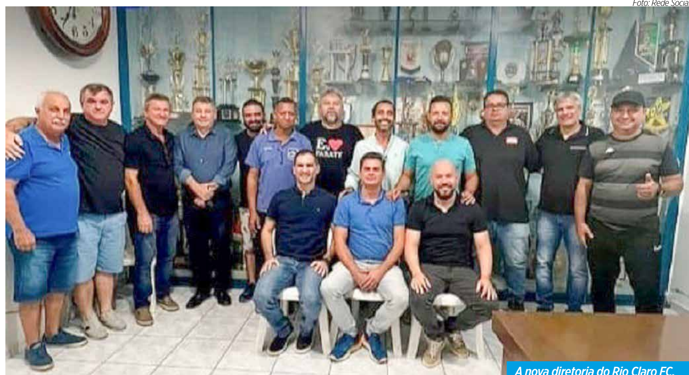
A nova diretoria do Rio Claro FC.