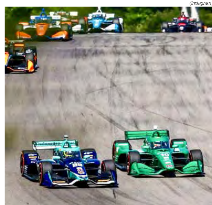
A transmissão da corrida é a partir das 16h30

A transmissão da corrida é a partir das 16h30.