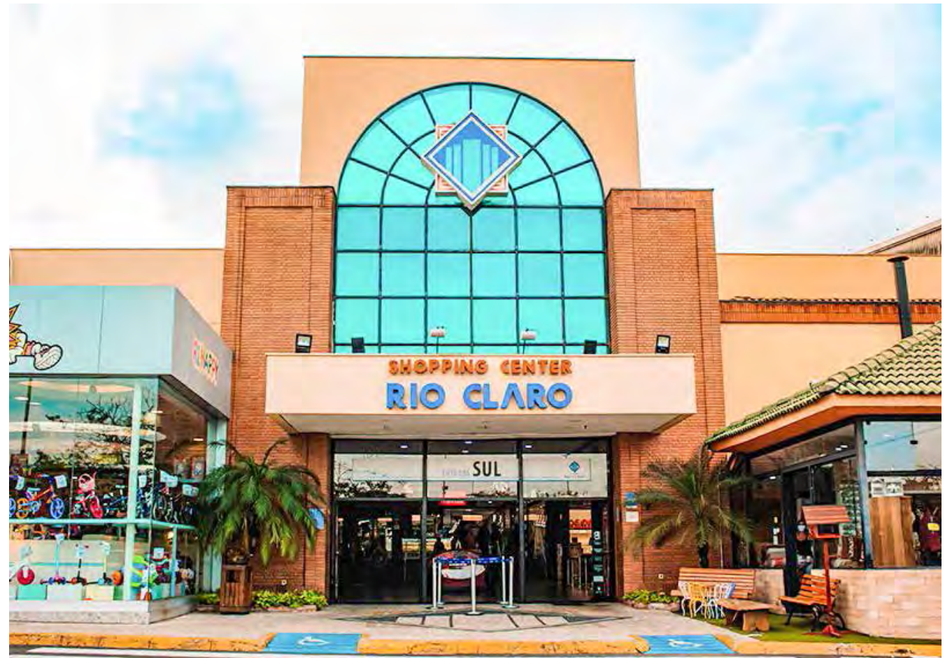
Fachada da entrada Sul do Shopping Rio Claro

Entre as facilidades de fazer suas compras no Shopping Rio Claro destaca-se o horário de funcionamento do empreendimento: de segunda a