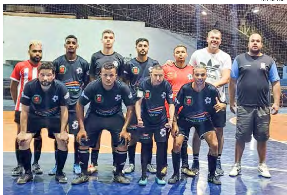
Equipe do CAIC Educando fez grande jogo com o Galáticos FC no CSU João Redher Neto

A Super Copa CSU 2023 de Futsal tem apoio da Secretaria Municipal, Canal Endanonados e Camisa 23 Eventos.