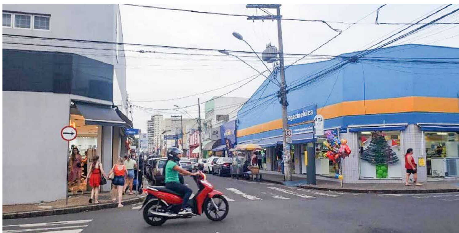
Lojas do comércio de rua em Rio Claro têm horário especial de funcionamento para o Dia das Mães