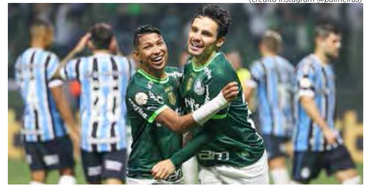
Lance de Palmeiras e Grêmio pelo Brasileiro