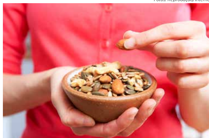
As castanhas e nozes são ótimas opções para refeições pequenas e rápidas

Além de ser a base do pão, a farinha integral também serve para preparações de biscoitos e bolos caseiros. No caso dos bo-