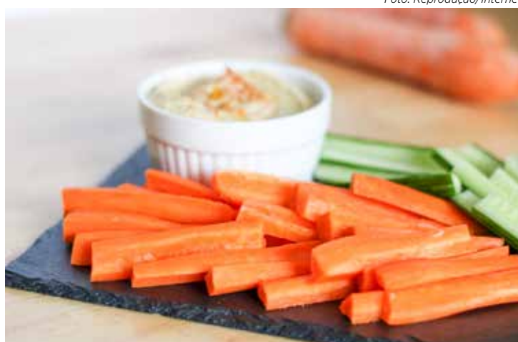
Os legumes podem ser servidos até mesmo crus, como no caso de palatinhos de cenouras

As frutas são opções saudáveis, práticas e refrescantes para esse momento. Elas podem ser levadas inteiras ou picadinhas para a escola ou o trabalho para facilitar o consumo. Existe ainda a opção das saladas de frutas, e ainda de associá-las ao consumo de castanhas e iogurtes naturais. As vitaminas também são boas