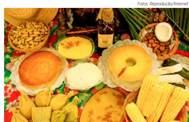
O milho é um alimento versátil que oferece várias opções de lanche: cozido na espiga, pamonha, curau ou até mesmo nos pães e bolos