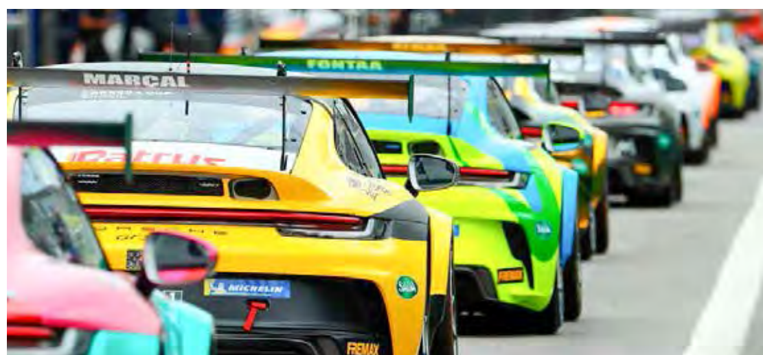
Categoria retorna à capital paulista para a primeira de três corridas de longa duração do ano

Os 300 km de Interlagos (Carrera e Challenge) é neste sábado. Os canais Sportv exibem a corrida ao vivo a partir das 15h30, além dos canais oficiais da Porsche Cup C6 Bank Mastercard. A Band mostra flashes da etapa em sua programação.