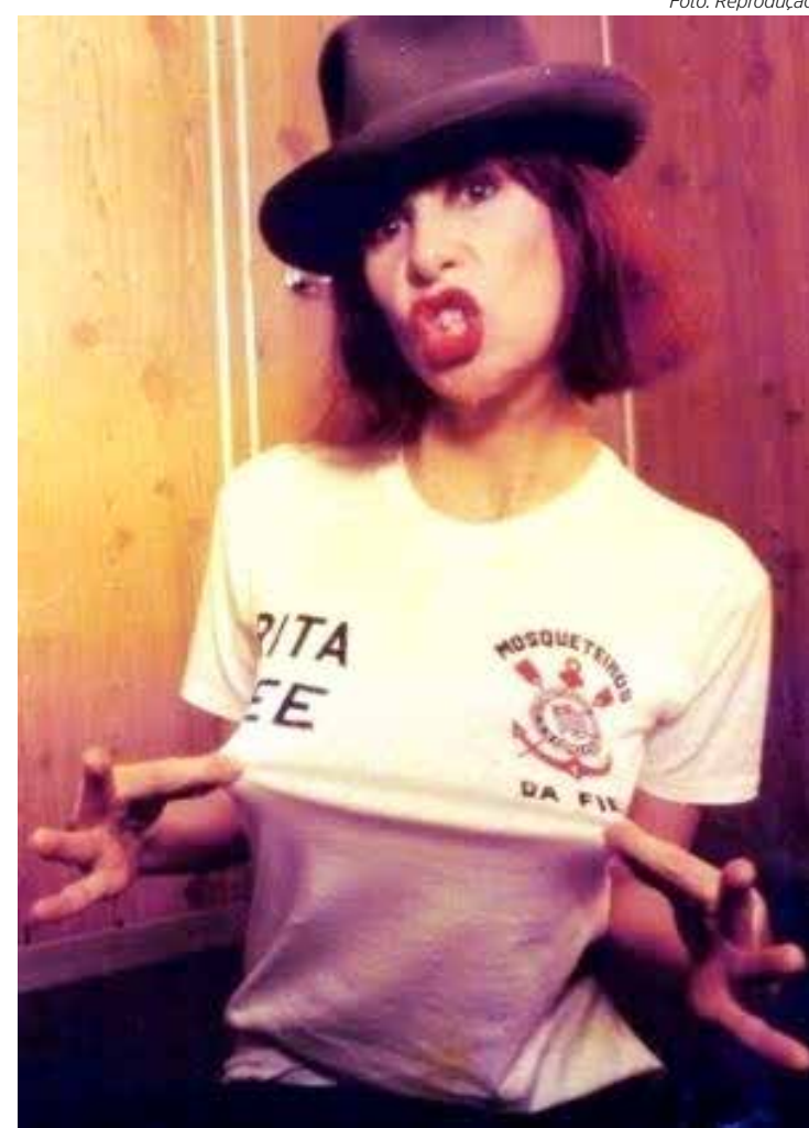
A corinthiana Rita Lee

Atual campeão brasileiro, o Palmeiras também se manifestou a respeito do falecimento da cantora e compositora Rita Lee: “Com muito pesar, recebemos a notícia do falecimento da rainha do rock brasileiro, Rita Lee. Lamentamos profundamente a perda de um ícone da música nacional e prestamos condolências aos familiares, amigos e fãs”.