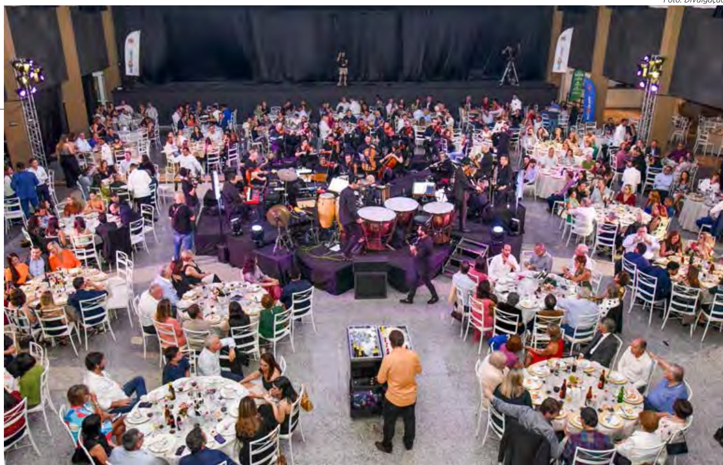
Evento foi realizado sábado no Grupo Ginástico