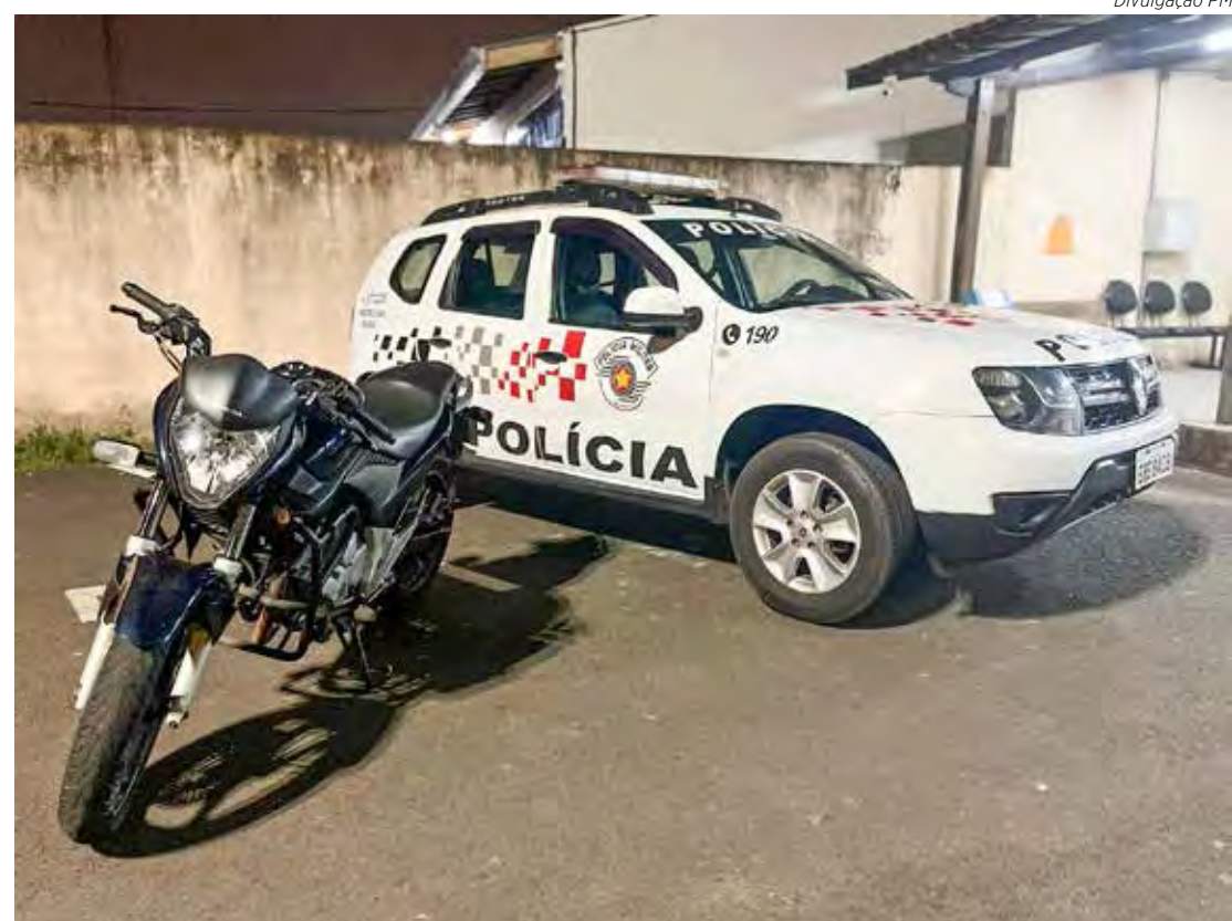
A moto, uma carteira, documentos e dinheiro tinham sido furtados de uma casa naquele município

Em diligências os policiais constataram que rapaz havia furtado uma residência no município de Brotas, e de lá tinha levado a motocicleta Honda/