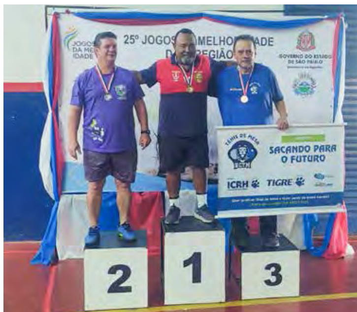
Equipe RCTM representou Rio Claro nos Jogos da Melhor Idade