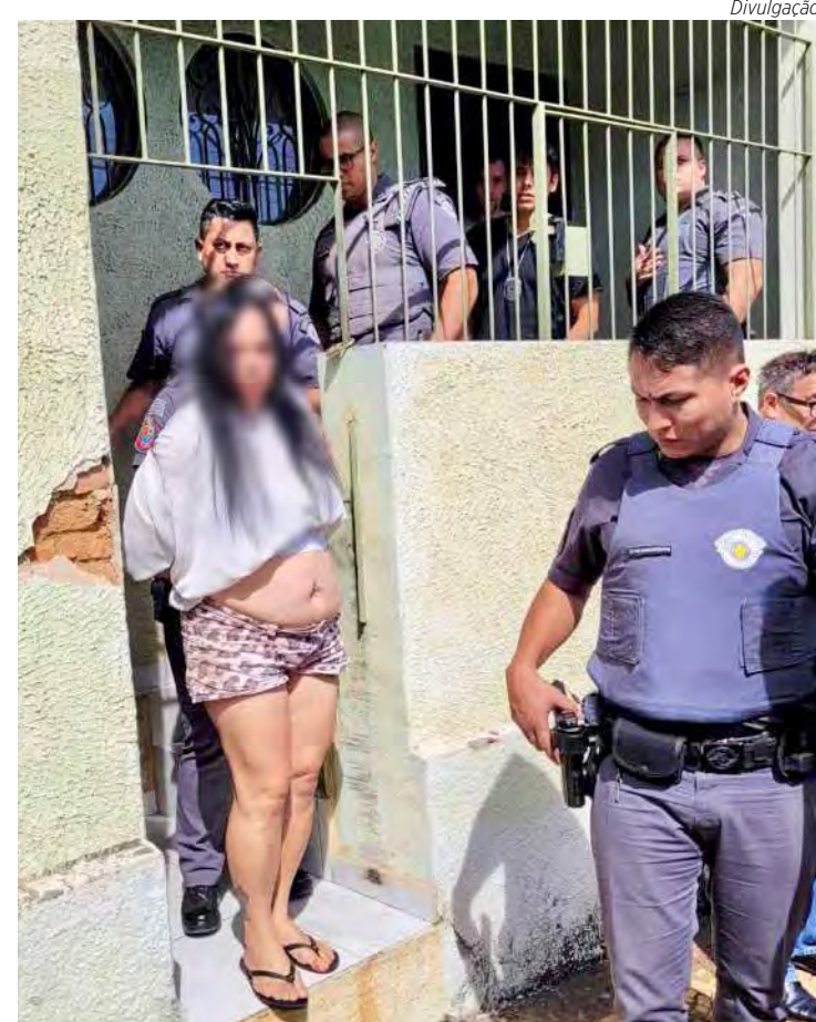
Suspeita foi levada pelos policiais e permaneceu presa até o fechamento desta edição

A filha da vítima informou que a camiseta usada pela suspeita era da mãe. A mulher disse