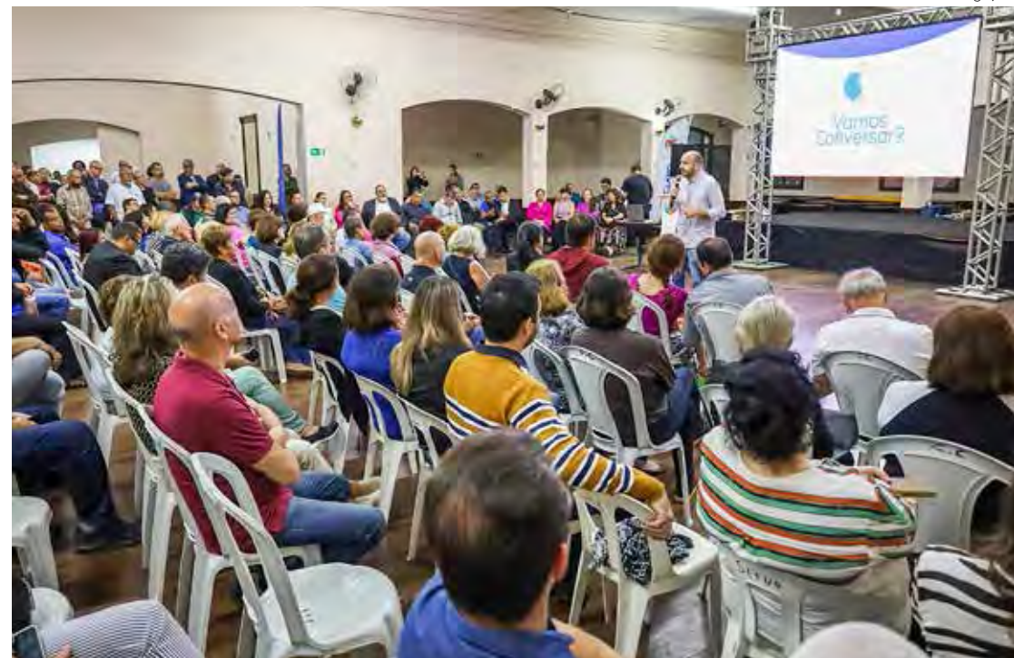
Moradores participam de reunião do programa “Vamos Conversar?”