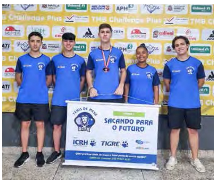
Projeto Sacando para o Futuro de Tênis de Mesa, obtém bons resultados