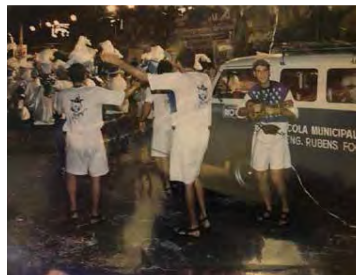
Rita Lee é 'Daqui' era o nome do samba enredo da Samuca em 1995, homenageando a artista