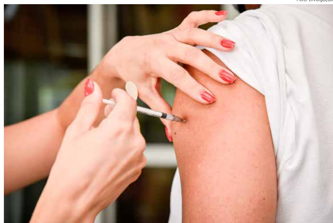
A dose é aplicada a partir das 7h30 nas unidades básicas de saúde e unidades de saúde da família

A Fundação Municipal de Saúde lembra que a unidade de saúde da Avenida 29 costuma ser a que recebe maior público, o que pode gerar filas. Por isso