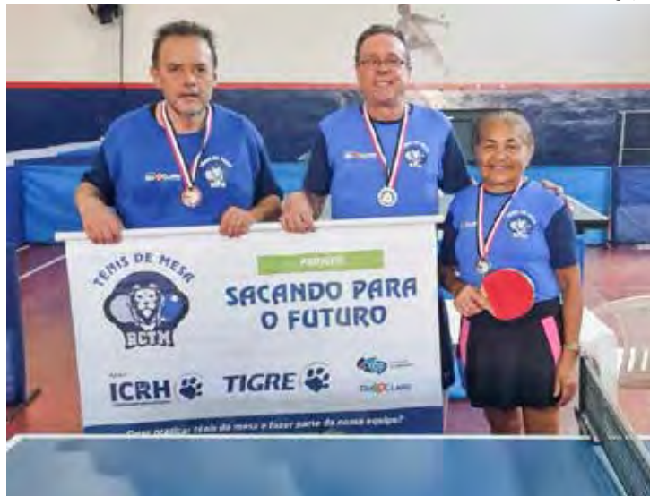
Mesatenistas de Rio Claro exibem medalhas conquistadas no JOMI.