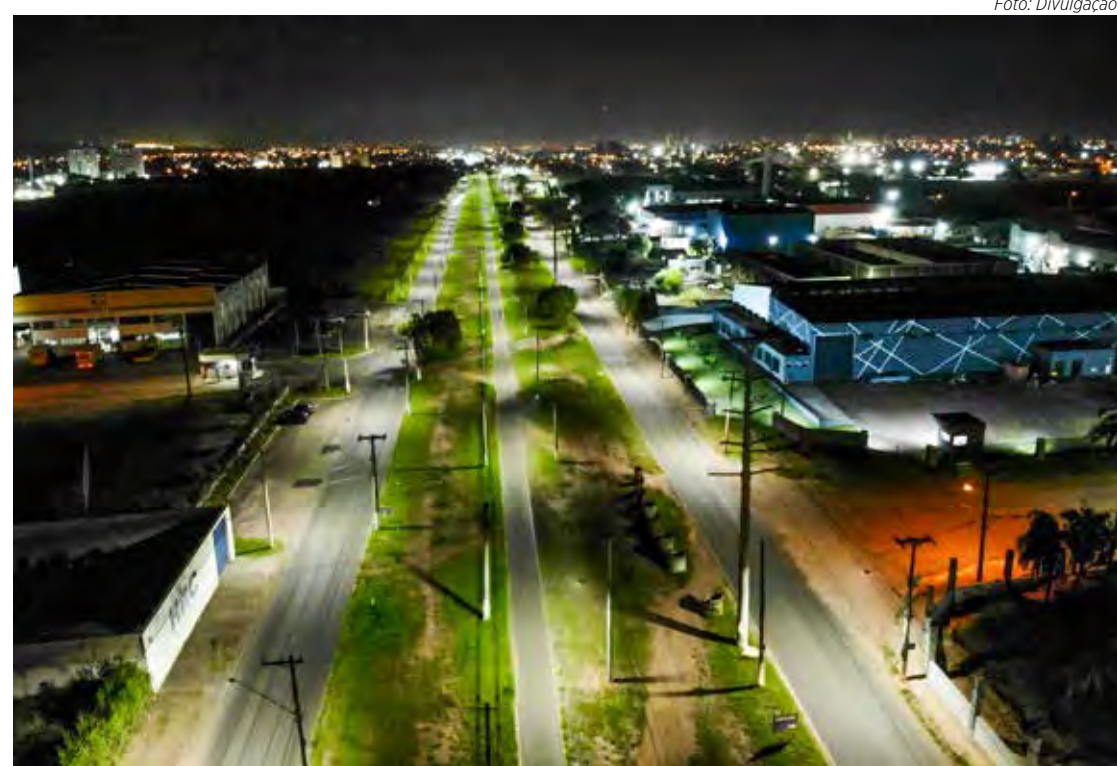
Foram instaladas 95 luminárias de led para iluminar a ciclovia em toda sua extensão

A iluminação foi instalada desde a Avenida 50-A, perto do Corpo de Bombeiros, até a Rodo-