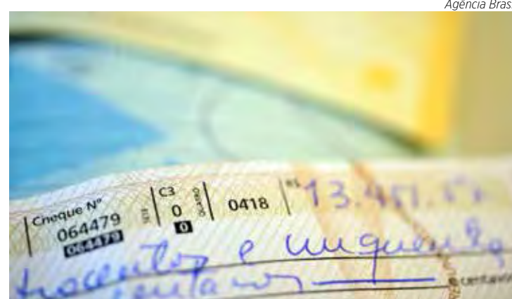
Mudanças devem dificultar falsificações, avalia BC

A principal mudança citada pelo BC é a transferência de regulação do modelo-padrão dos cheques para as instituições financeiras. Até então, cabia ao BC fazer essa regu-