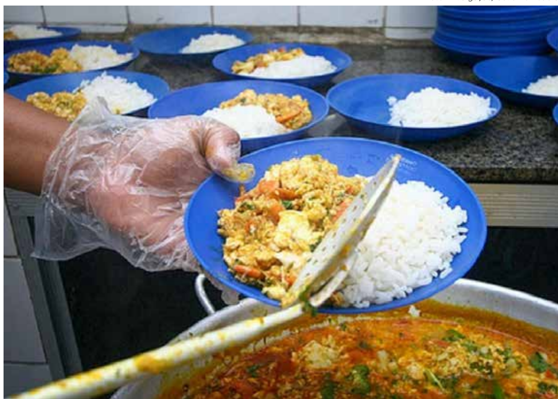
Serviço de merenda escolar atende milhares de alunos por dia em Rio Claro

O processo licitatório teve como vencedoras as empresas Dafra Comércio de Carnes Ltda., J & A Comercial do Brasil, Conser Alimentos Ltda., Nutricionale Comércio de Alimentos Ltda., Logdis Serviços, Logística, Distribuição e Armazenagem Ltda., Supermercado Morada do Sol, M Zamboni Comércio e Representações de Produtos Alimentícios e Mercadorias em Geral e Distribuidora Nancy Ltda. Como a licitação é dividida em vários