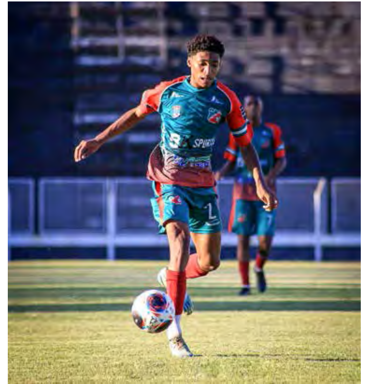
Velo joga no Benitão a final da Paulista Cup Sub-20