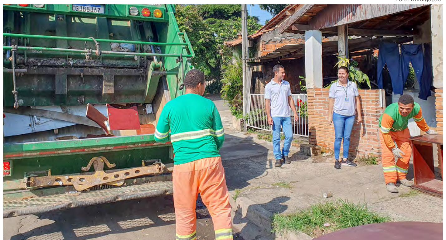
Ao longo de quatro mutirões são 21 toneladas de materiais recolhidos.

De acordo com o boletim emitido na quinta-feira (27) pela Vigilância Epidemiológica, Rio Claro tem neste ano 325 casos confirmados de dengue. Não há casos de chikungunya, zika vírus e febre amarela, também transmitidas pelo Aedes.