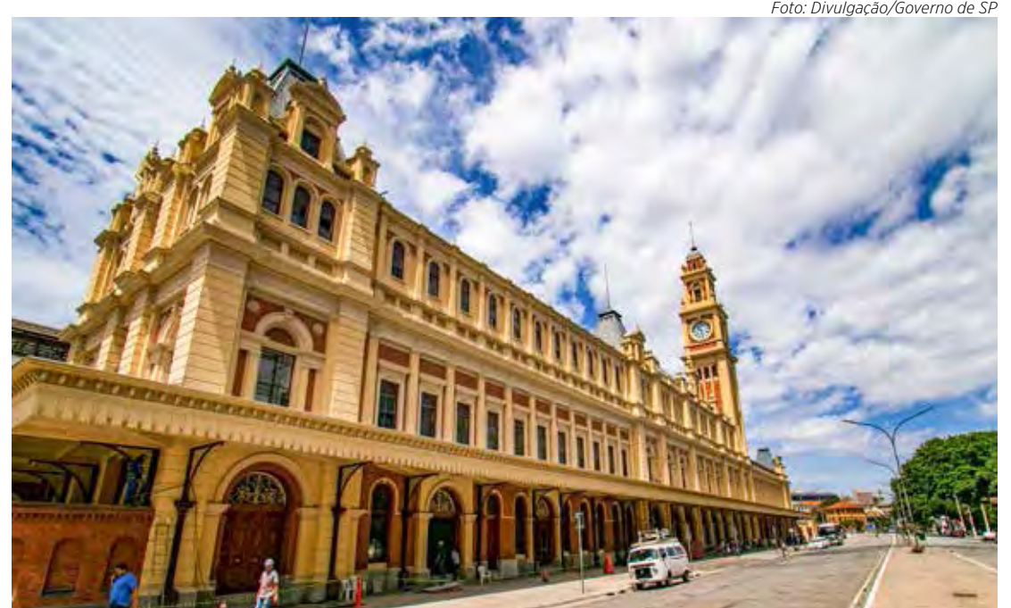
O Museu da Língua Portuguesa fica na Praça da Língua s/n, no bairro Luz em São Paulo

Confira a programação completa no site do museu: https://www.museudalinguaportuguesa.org.br/