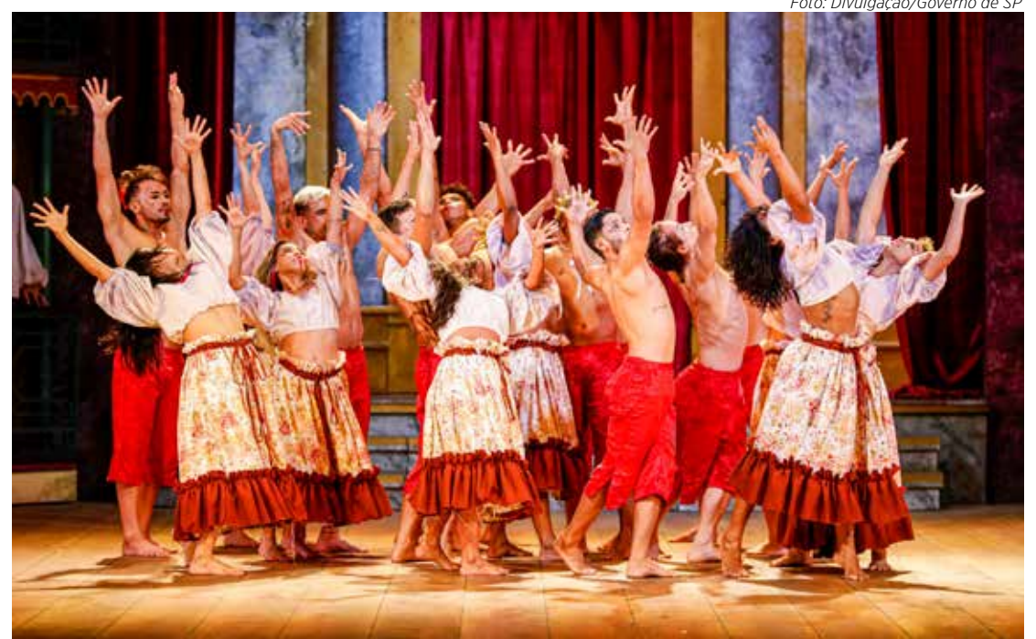
Serão quatro óperas apresentadas ao vivo e on-line direto do Teatro Amazonas

A plataforma #CulturaEmCasa foi lançada em 21 de abril de 2020. Desde então, cerca de 8,3 milhões de pessoas foram impactadas pelos mais de 5 mil conteúdos já foram disponibilizados pela #CulturaEmCasa, a maior plataforma cultural gratuita da América Latina.