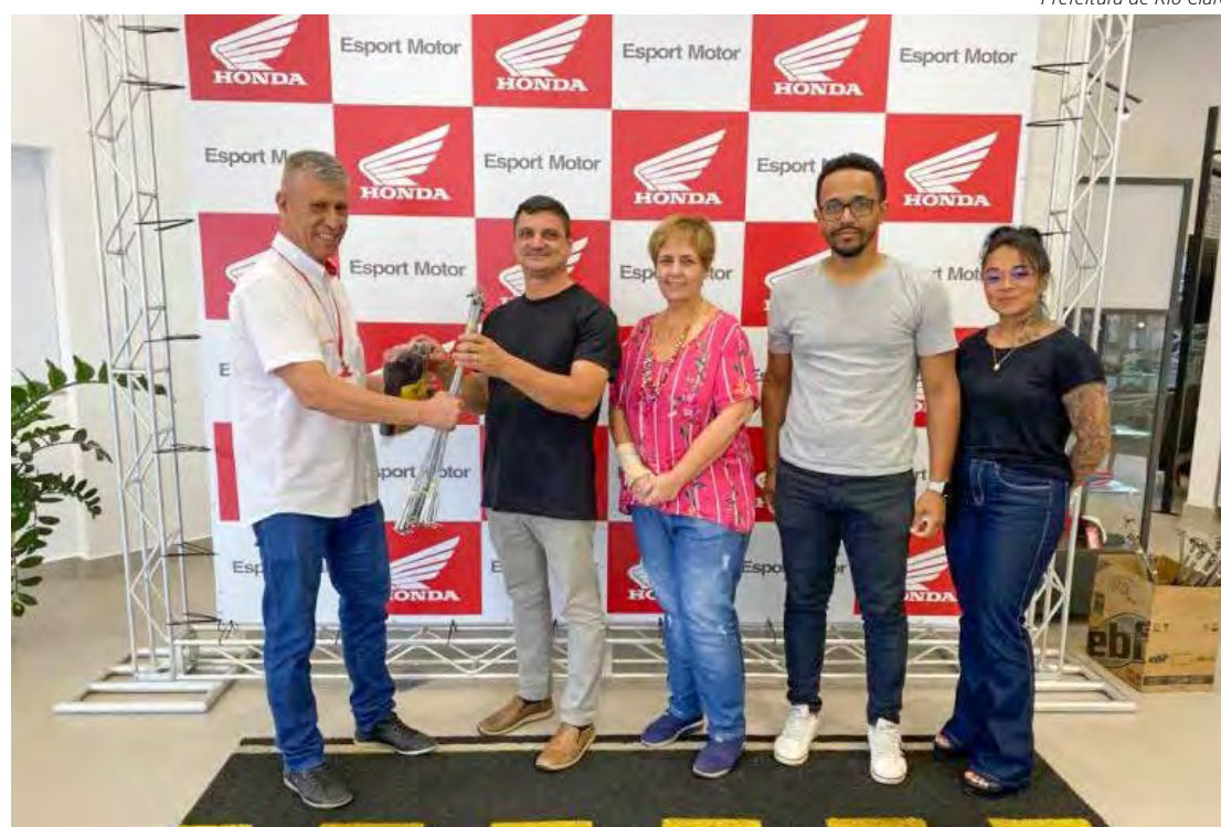
Prefeitura de Rio Claro

A Prefeitura está informando oficialmente que tem aproximadamente 1.500 antenas para serem distribuídas.