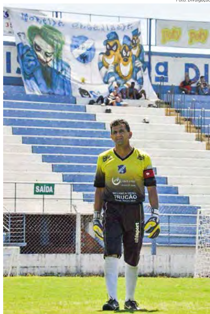
No estádio Schmidtão defendendo o UPU do Parque Universitário