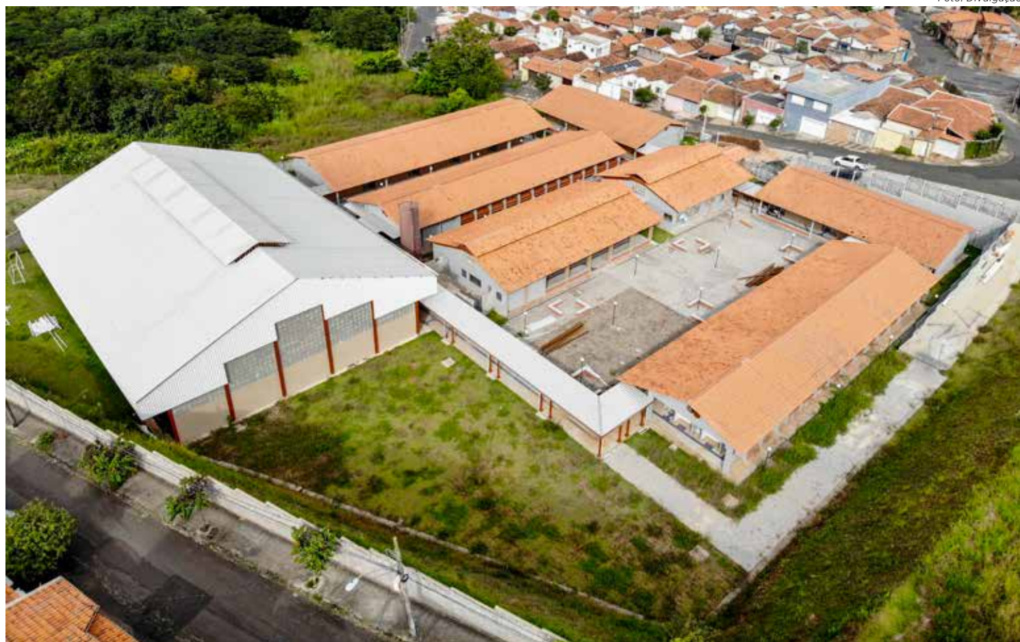
A escola do Benjamin de Castro vai atender 780 alunos do ensino fundamental I