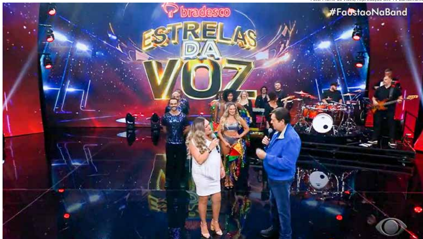
Acompanhada de músicos e bailarinos, ela encantou a plateia