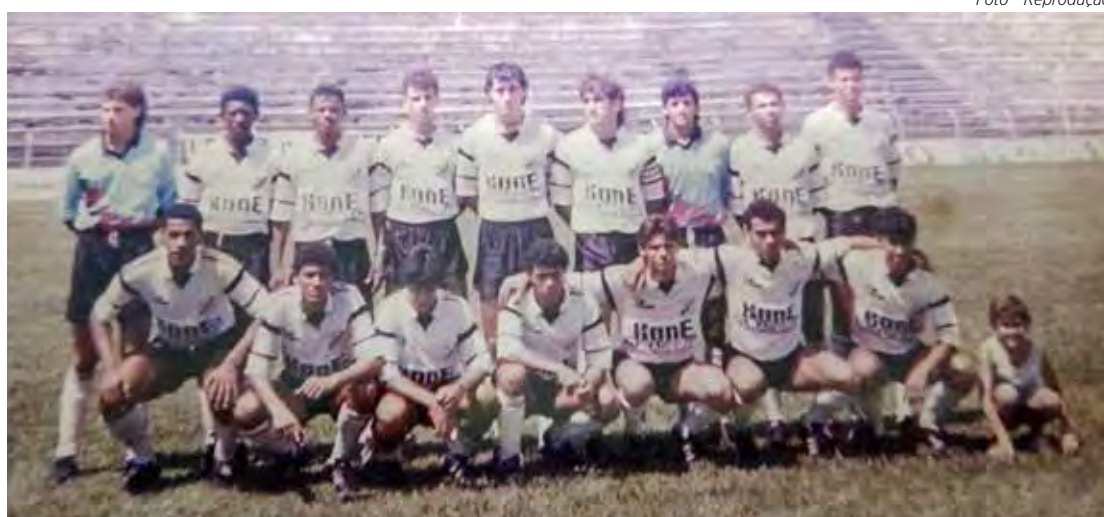
Como profissional, na Inter de Limeira, em 1991

peão amador jogando por equipes de Rio Claro, Limeira e Conchal. Tenho alguns títulos também da Copa Gazeta de Limeira, que era muito disputada, e tenho também títulos regionais por clubes de Rio Claro, Santa Gertrudes, Limeira e Corumbataí,