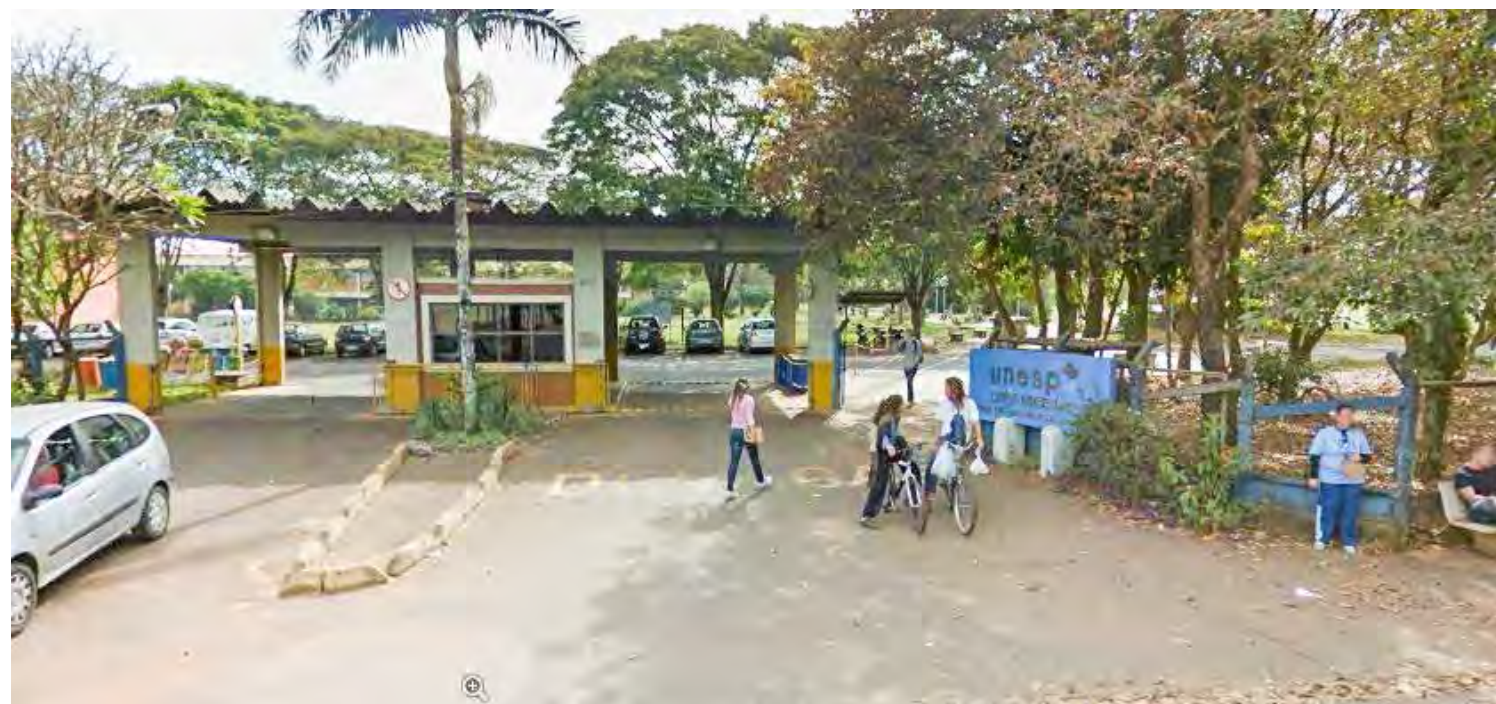
Câmera de monitoramento deixou de funcionar e alertou os vigias