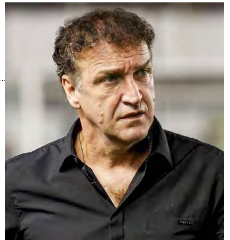
Cuca é o atual técnico do Corinthians