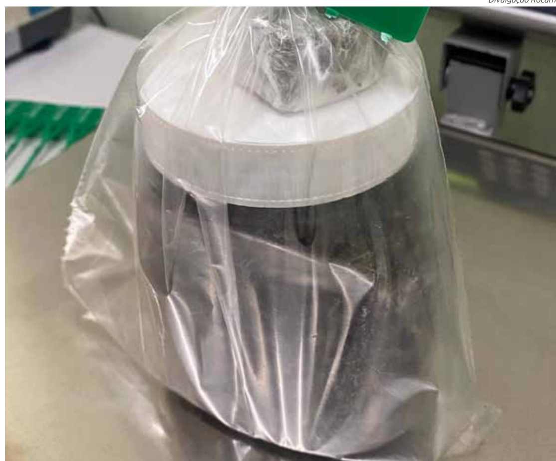
Um deles alegou que o pó branco seria para tratar piscina, mas era cocaína

No momento da abordagem, o outro rapaz tentou se desfazer de uma sacola, jogando-a sobre o telhado, correndo depois de volta para a casa.