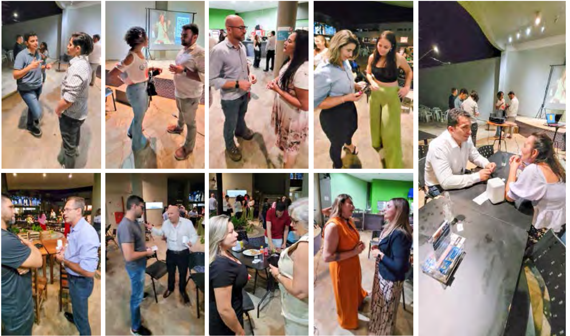
Momento especial de network em que culminou a proveitosa noite