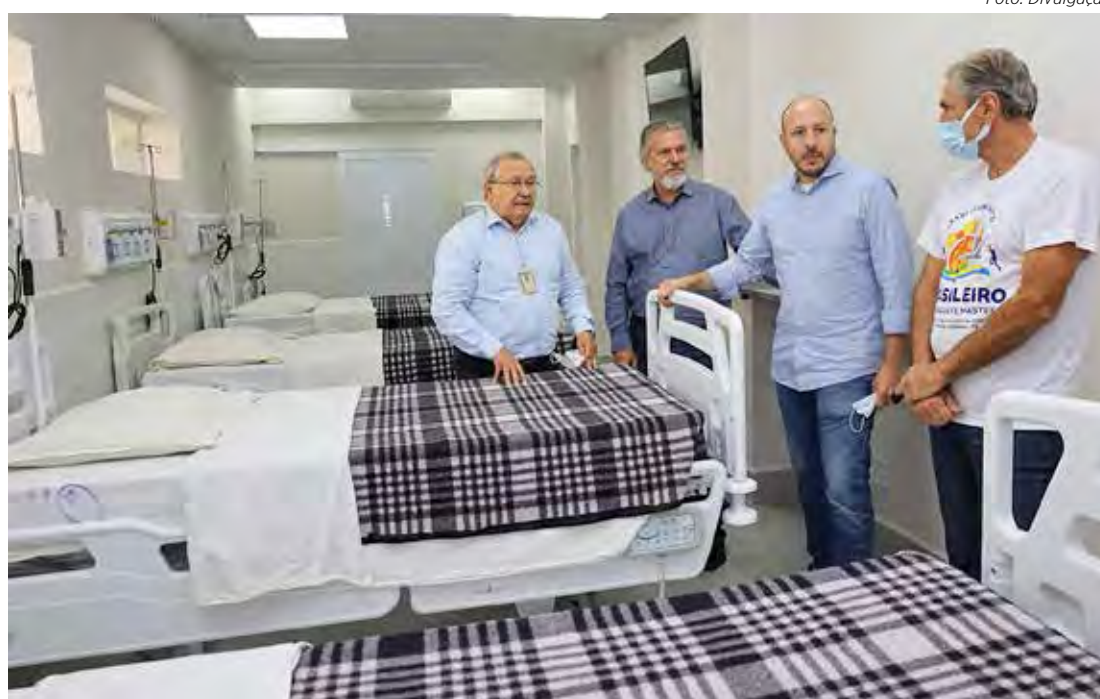
Catorze dos 24 leitos da unidade de urgência já começaram a funcionar

Em agosto do ano passado, a Fundação Municipal de Saúde transferiu a administração do antigo PSMI para a Santa Casa, o que possibilitou a abertura