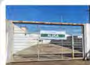
CÓDIGO 7042 Terreno com 749,00m² - Consolação - Rio Claro/SP - Valor Locação: R$3.111,11