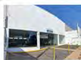
CÓDIGO: 6165 RUA 14- Salão com 600,00m², 2 wc's, cozinha, escritório e recuo para carros. Consolação - Rio Claro/SP - Valor Locação: R$20.000,00