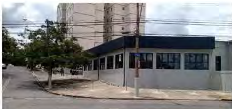
CÓDIGO: 7456 - Galpão com 1.318,20m² - Taquaral - Campinas/ SP - Valor Venda: R$5.000.000,00