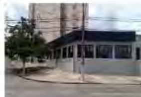
CÓDIGO: 7456 Galpão com 1.318,20m² - Taquaral - Campinas/ SP - Valor Locação: R$33.333,33