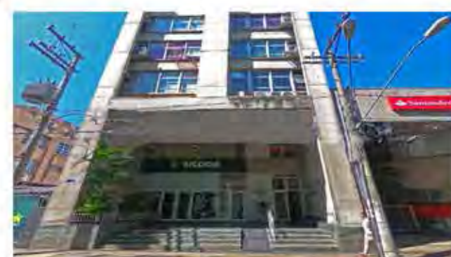
Código 8442 SALA COM APROXIMADAMENTE 82,00M², WC E COZINHA - Centro - Rio Claro - Valor Locação: R$666,67