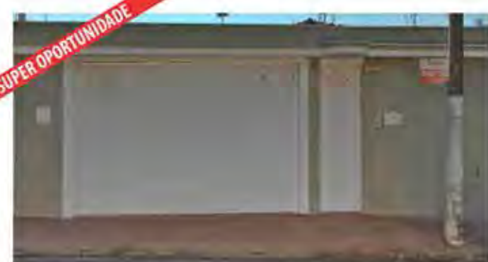
CÓDIGO 9084 - Recepção, 5 salas, 3 wc's, cozinha com arm. emb., área externa com churrasq., lavanderia e garagem para 4 carros. Santa Cruz - Rio Claro/SP - Valor Venda: R$850.000,00