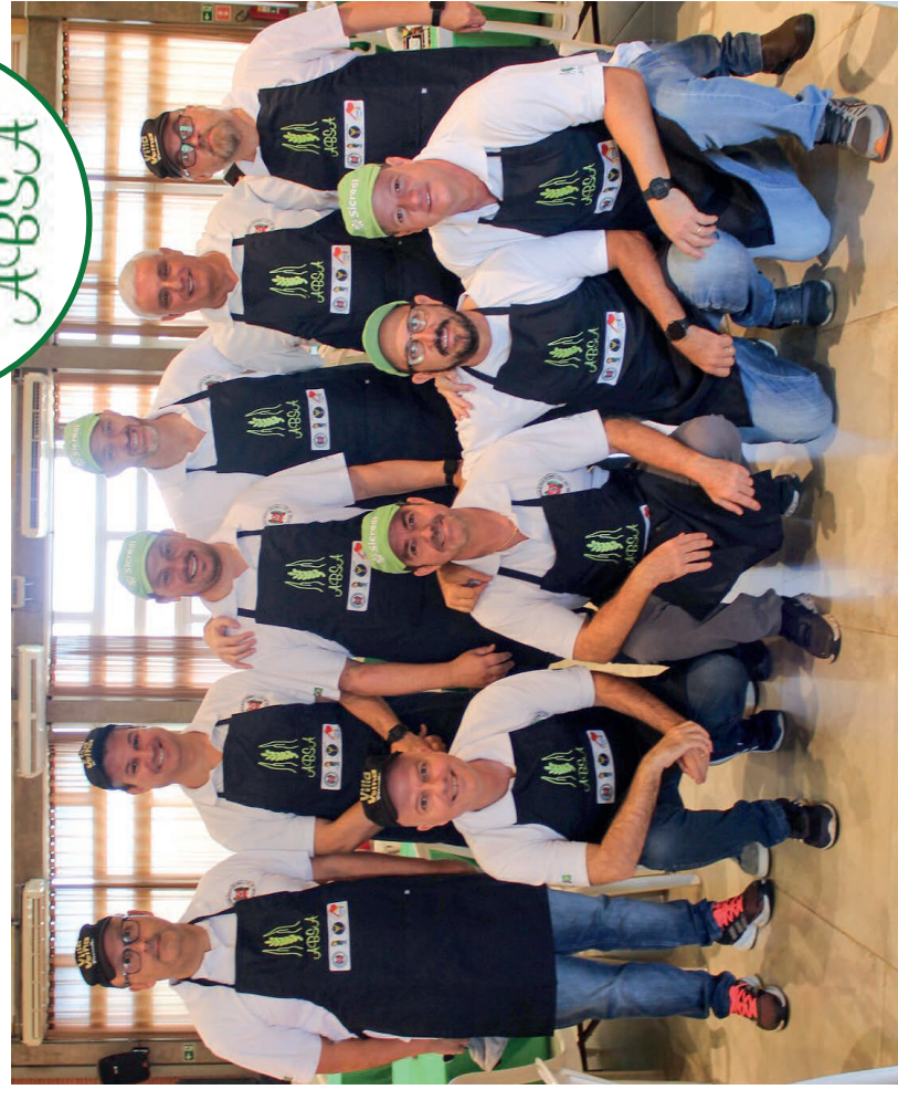
Presidente e diretores da ABSA - Associação Beneficente Solidária das Acácias, de Santa Gertrudes