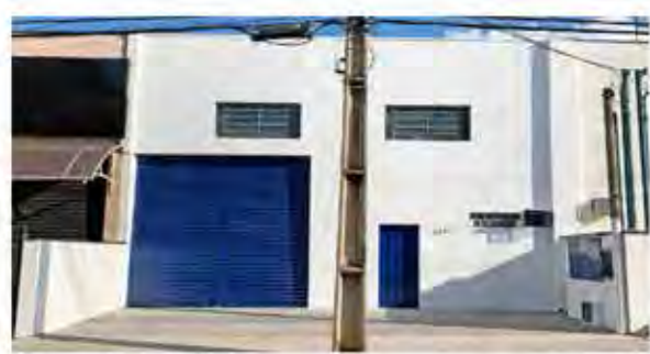
CÓDIGO 9122 - Galpão 300,00 M2, contendo recuo para carros, 2 Wc's, cozinha, área de luz. Avenida 14 Nº 2237, Jardim São Paulo - Rio Claro - Valor: R$835.000,00