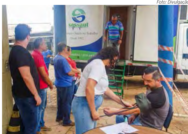
Mais de 180 servidores foram atendidos em dois dias de realização de exames