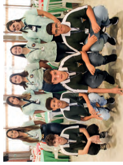
Equipe da Guarda Mirim de Santa Gertrudes