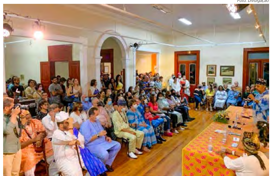
Semana Ogum abre espaço para discussões sobre a igualdade de direitos