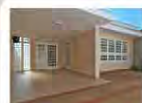
CÓDIGO 9084 Recepção, 5 salas, 3 wc's, cozinha com arm. emb., área externa com churrasq., lavanderia e garagem para 4 carros. Santa Cruz - Rio Claro/SP - Valor: R$4.444,44