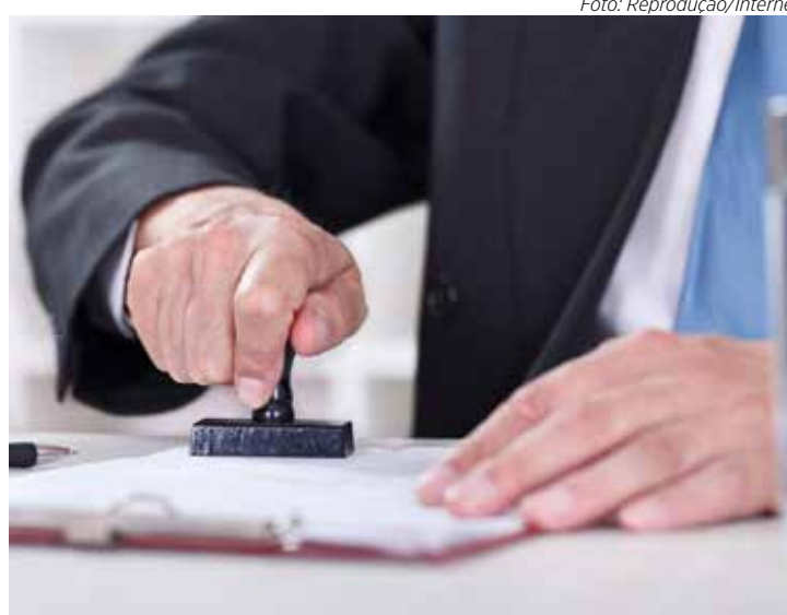
Prefeitura quer acessar o banco de dados dos cartórios extrajudiciais

O envio de dados dos cartórios para a prefeitura seria mensal com pagamento do município por