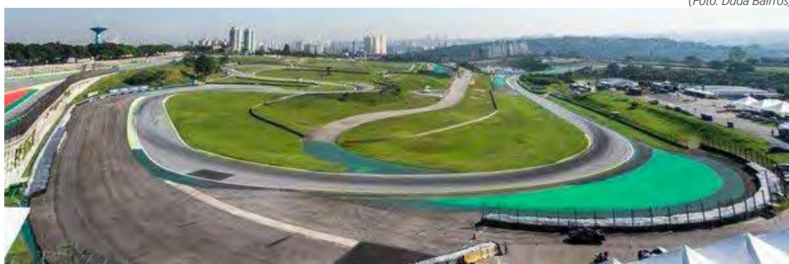
Autódromo José Carlos Pace, em Interlagos com cinco provas neste domingo