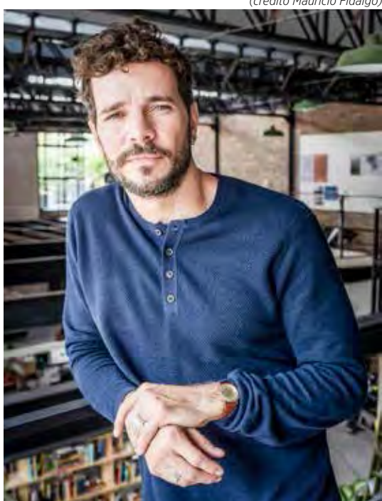
Daniel de Oliveira