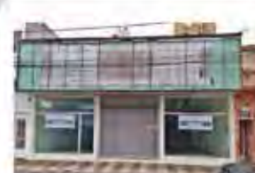
CÓDIGO: 7291 Galpão com 370,00m², com 2 escritórios, 2 wc's. Centro - Limeira/SP - Valor Locação: R$16.666,67