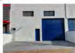
CÓDIGO 9121 Galpão 300,00 M2, contendo recuo para carros, escritório, mezanino, 2 Wc's, cozinha, área de luz. Avenida 14 Nº 2227, Jardim São Paulo - Rio Claro - Valor: R$835.000,00