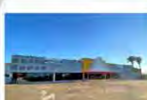
Código 8262 ÁREA TERRENO: 4.269,12 M2 - ÁREA CONSTRUÍDA: 2.513,00 M2 - Centro - Rio Claro - Valor Locação: R$83.333,33