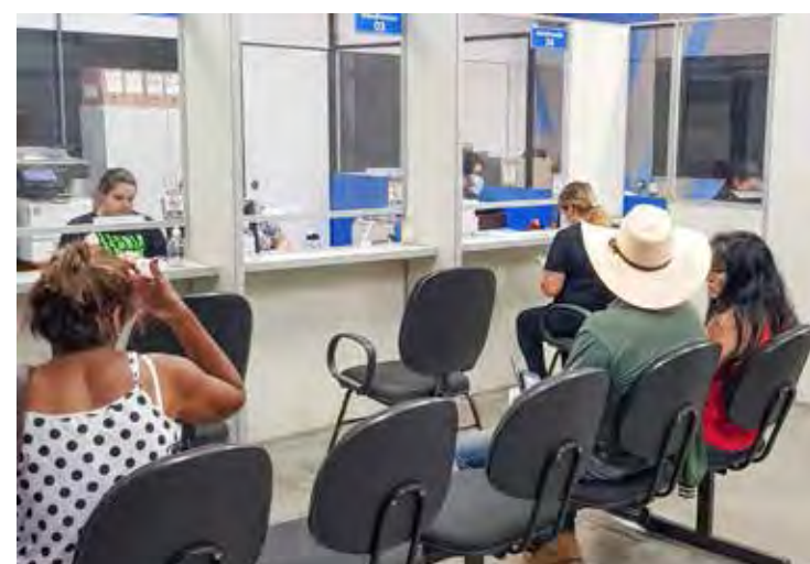
O Daae não terá atendimento presencial no feriado de sexta-feira, dia 21

Os serviços essenciais como captação, tratamento e abastecimento de água, além de reparos emergenciais, continuarão sendo realizados normalmente, como é feito todos os dias pelas equipes do Daae.