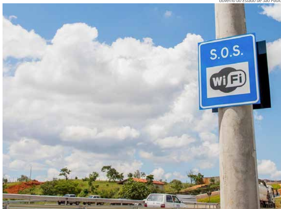
Sinalização informa rodovias com serviço de Wi-Fi

A ViaPaulista, que opera 720 quilômetros de rodovias nas regiões de Araraquara, Ribeirão Preto e Franca, também conta com o serviço de wi-fi em parte de seu trecho. Com a rede “SOS