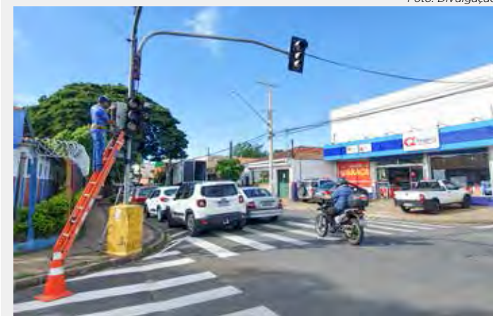
Pedestres podem acionar semáforo no cruzamento da Rua 3-A com a Avenida 36-A, na Vila Alemã