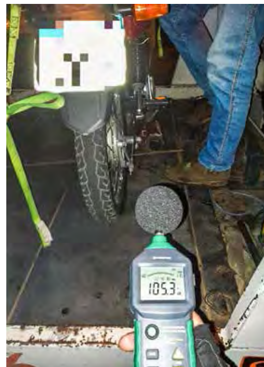
Nível de ruído foi aferido por equipamento da GCM

As apreensões e autuações são relacionadas com perturbações do sossego, por excesso de ruído, ou uso de som automotivo em volume alto, práticas denunciadas pela população da região da Avenida 25 com Rua 23, no Bairro Estádio, onde, segundo a GCM, havia um intenso fluxo de veículos, com as vias tomadas pelos frequentadores, impedindo o fluxo do trânsito.