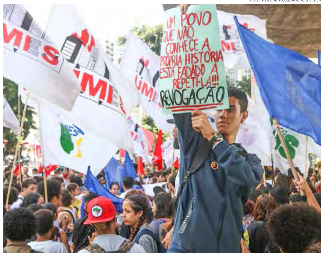
Estudantes fizeram nesta quarta-feira (19), na capital paulista, um protesto pedindo a revogação do novo ensino médio

Estudantes fizeram nesta quarta-feira (19), na capital paulista, um protesto pedindo a revogação do novo ensino médio. O ato se concentrou em frente ao Museu de Arte de São Paulo (Masp), na Avenida Paulista, na região central e saiu em passeata, descendo pela Rua Augusta, até a Praça da República, no centro, onde fica a sede da Secretaria Estadual de Educação. Os jovens gritavam palavras de ordem e carregavam bandeiras e faixas.