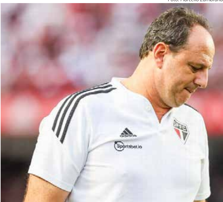
Fim de ciclo para Rogério Ceni no São Paulo