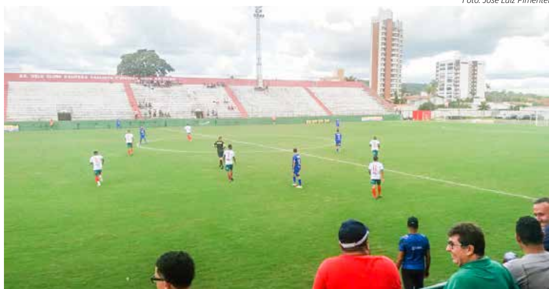
Velo derrota o Rio Claro FC no Paulista Sub-20