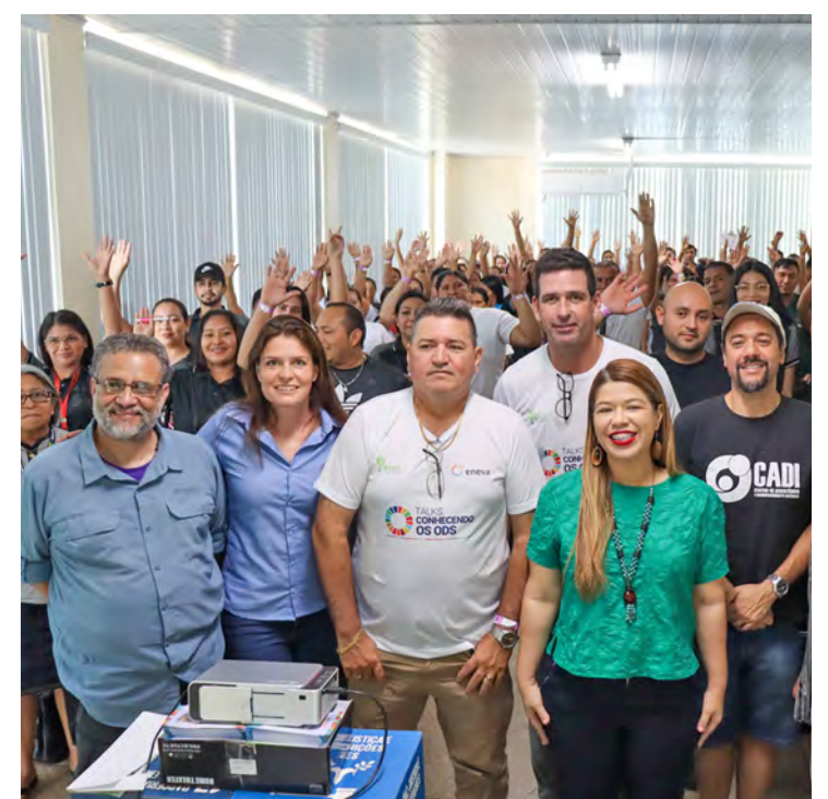
A iniciativa é um dos desdobramentos do Festival Conhecendo os ODS, ação que já teve duas edições.