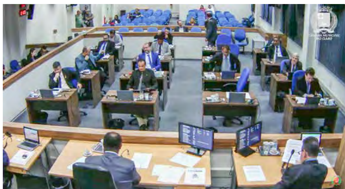
Vereadores aprovaram cinco projetos na sessão camarária desta segunda-feira (17)

cargos, conforme exige a Lei de Responsabilidade Fiscal. O setor jurídico solicita que o documento seja apresentado.