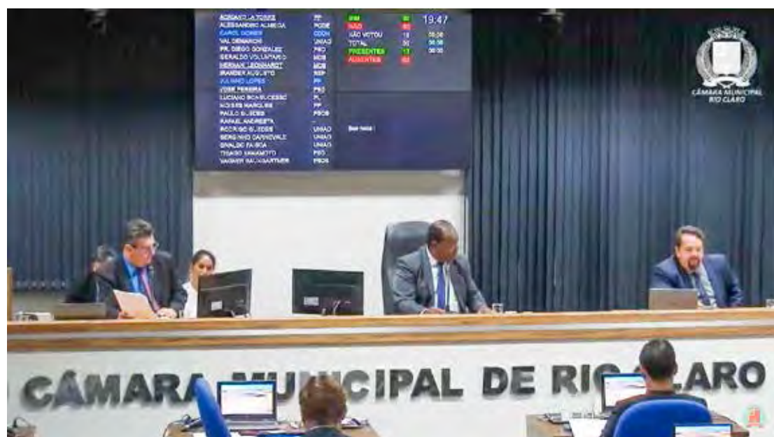
Vereadores da mesa diretora conduziram os trabalhos

O projeto de lei que dispõe sobre a criação dos cargos foi aprovado em primeira discussão pelos vereadores na sessão ordinária desta segunda-feira (17). No entanto, parecer da procuradoria jurídica ressalva que o Executivo Municipal não apresentou estudo de impacto financeiro gerado pelos novos