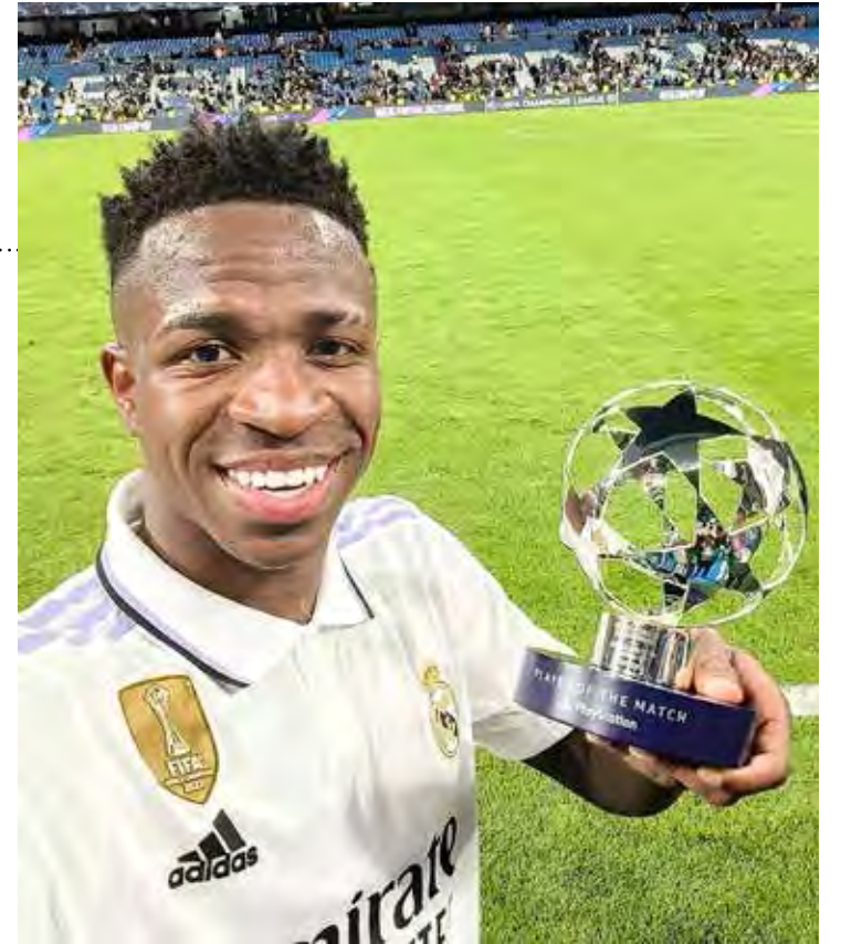
Chelsea e Real Madrid, do craque Vini Jr., voltam a se enfrentar nesta terça-feira pelo jogo de volta das quartas de final da Champions League