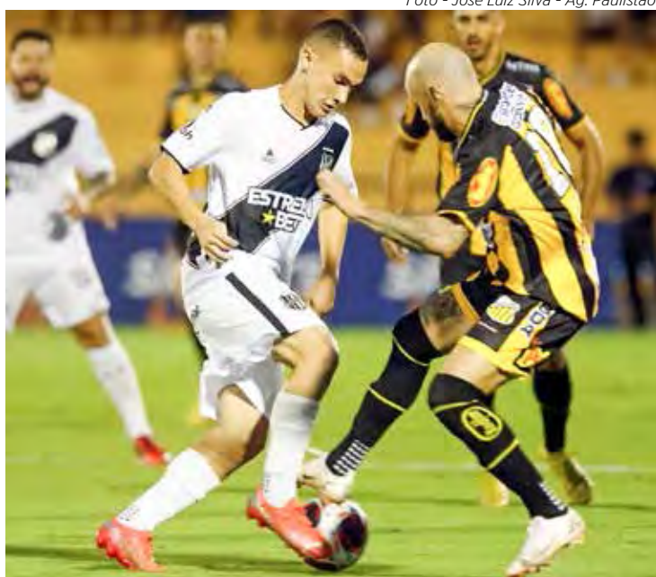
Ponte Preta e Novorizontino disputam título da Série A2