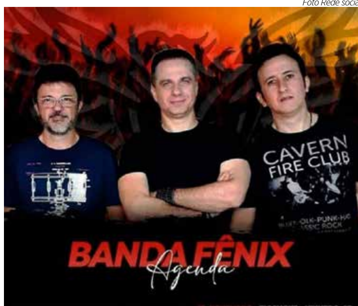
Banda Fênix no Madureira Bar Music

ESPAÇO1 SNOOKER BAR – No sábado (8), a partir das 22h, tem música eletrônica com o Dj Marcelo Custos com as melhores do Flashback e Piseiro. A casa convida você conhecer e vir jogar uma sinuquinha, com o melhor Chopp