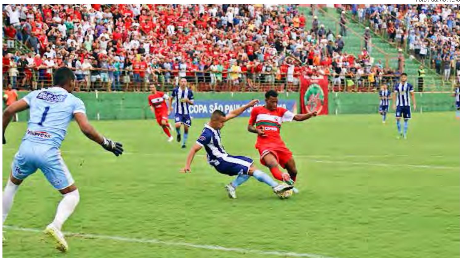
Velo Clube e Rio Claro medem forças na Sub15 e Sub17

A competição é promovida pela Federação Paulista de Futebol e reúne um total de 32 times divididos em grupos na primeira fase. Velo Clube e Rio Claro FC estão no Grupo 5, ao lado de União São João de Araras, Independente FC de Limeira, XV de Novembro de Jaú e XV de Novembro de Piracicaba.