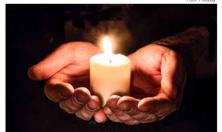
Normalmente, no Sábado Santo, acontece a preparação da Igreja para a celebração da Vigília Pascal