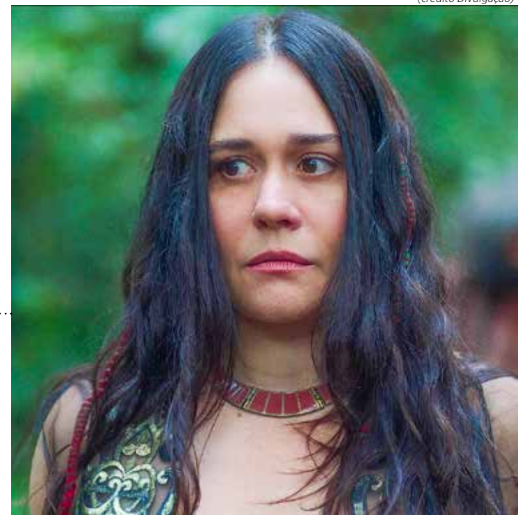
Alessandra Negrini vive a personagem Cuca em “Cidade Invisível”