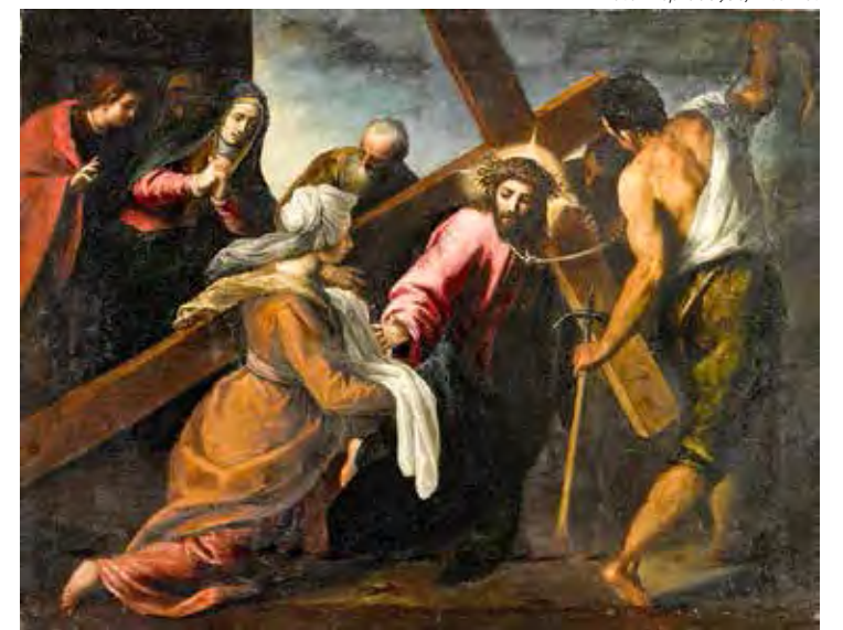
Cristo no Caminho do Calvário é uma pintura de Palma Il Giovane que foi carregada em 30 de julho de 2017