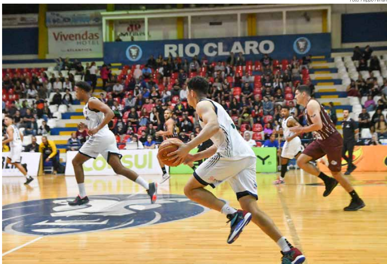
Rio Claro Basquete encara Flamengo no Felipão

No próximo dia 12 (quarta-feira), o Rio Claro Basquete encerra sua participação na fase regular do NBB15, quando recebe no ginásio Felipe Karam, a equipe do São José, às 20 horas.