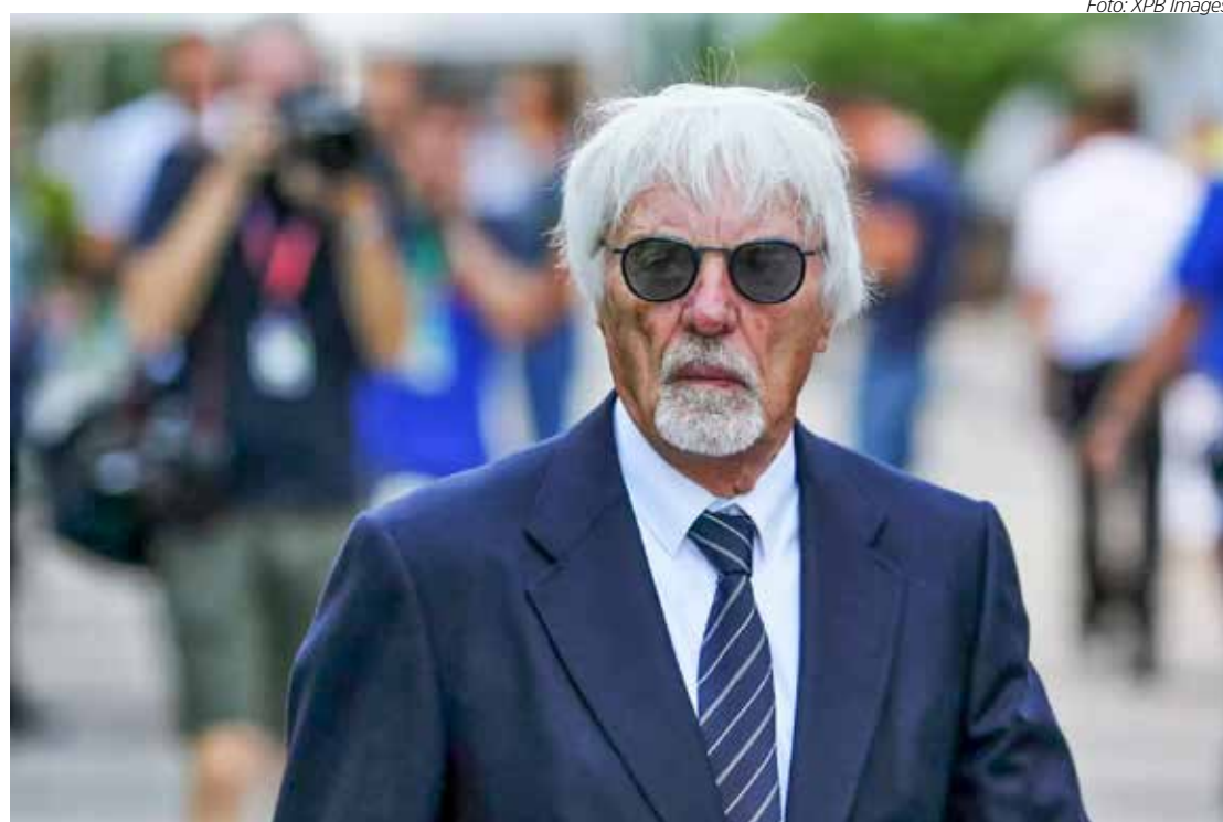
Bernie Ecclestone, ex-chefe da F1, admitiu esquema na F1

Flavio Briatore foi banido da Fórmula 1 em 2009, mas a decisão foi revertida um ano depois, pelo Tribunal de Grande Instância de Paris (França). Pat Symonds recebeu uma suspensão de cinco anos; hoje, ele é o atual diretor técnico da F1. Em março, o ex-chefe da categoria, Ecclestone, afirmou que os dirigentes optaram por não anular a corrida para evitar um grande escândalo.