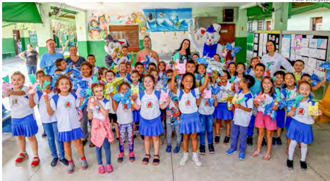
Alunos da Educação Infantil, Ensino Fundamental e EJA estão recebendo ovos de Páscoa