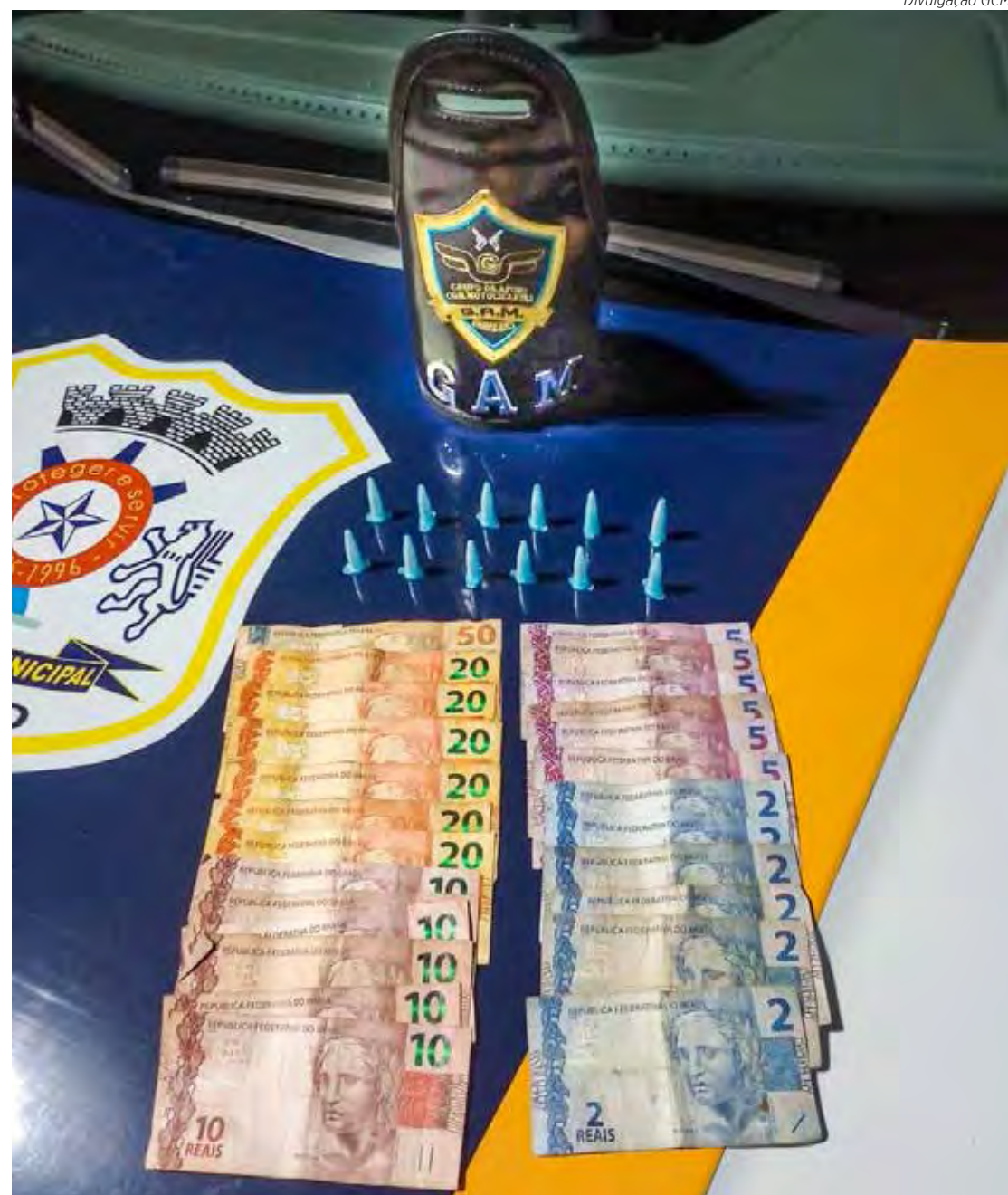
Dinheiro e drogas que foram apreendidos com o rapaz

Questionado sobre as porções de drogas, o menor informou que estava na prática do tráfico de entorpecente desde o início da noite, que já estava indo embora, e que o dinheiro encontrado era fruto das vendas da cocaína.