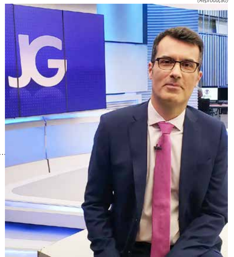
Fábio Turci está entre os demitidos pela Globo