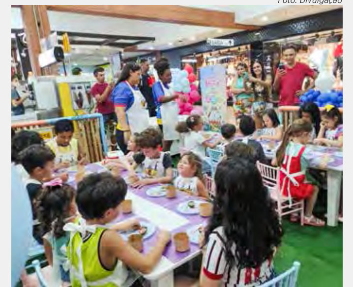
Atividades gratuitas para as crianças acontecem desta sexta até o domingo