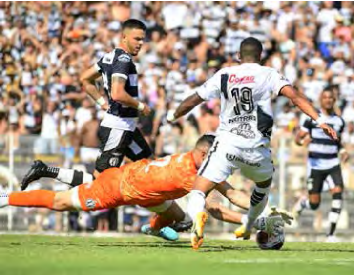
Ponte Preta e XV de Piracicaba jogam em Campinas