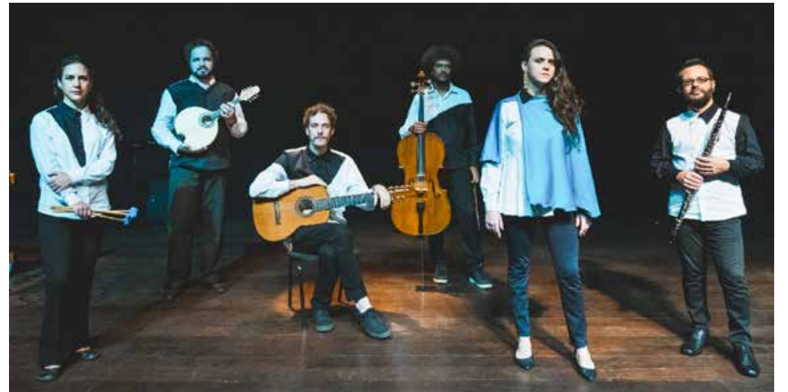
O sexteto Passim se apresenta neste sábado (1º) no Centro Cultural em Rio Claro

Para incentivar a produção musical autoral e levar um pouco da alma de cada um dos lugares por onde o grupo passa, Passim convidou um “cantautor” local para abrir o espetáculo musical em cada cidade. Em Rio Claro será o com-