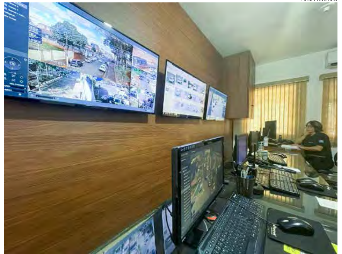
Central de Monitoramento da prefeitura de Cordeirópolis

Conforme o registro policial, no dia 17 de junho, às 9h40, o agente foi à casa da paciente, localizada no Centro, mas ficou no